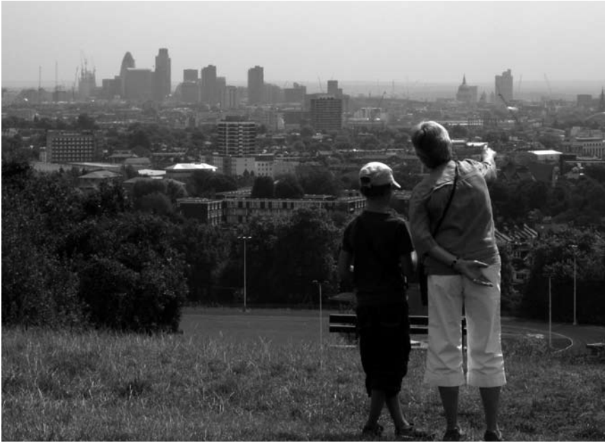
Imatge 2. La comprensió del caràcter del paisatge pot ser útil per a prendre decisions sobre el disseny i la ubicació de nous elements en el paisatge.

Tant a Anglaterra com a Escòcia, l'avaluació del caràcter del paisatge s'utilitza habitualment a l'hora de prendre decisions sobre l'ordenació i la gestió del sòl per a diferents tipus d'intervencions. En aquest sentit, es fa servir, sobretot, per a complementar estudis de sensibilitat o capacitat que analitzen el potencial del paisatge a l'hora d'establir-hi nous habitatges, parcs edílics i altres tipus d'infraestructures per a generar energies renovables, nous boscos o instal·lacions importants a escala local, com ara projectes d'aqüicultura a Escòcia. Aquest tipus de projectes impliquen necessàriament l'anàlisi de la sensibilitat de les diferents àrees amb caràcter paisatgístic i/o de les tipologies de caràcter del paisatge, i de la seva capacitat d'assumir determinades transformacions i acollir actuacions d'un tipus concret. Si s'aplica d'una manera efectiva, l'avaluació del caràcter del paisatge pot assumir, en aquestes circumstàncies, un paper molt destacat en la cerca de solucions que obrin la porta a actuacions necessàries, contribuint alhora a conservar el caràcter divers i les qualitats més valorades