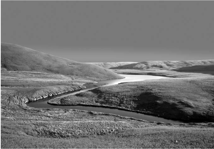
Imatge 1. Les muntanyes Cambrianes a la zona de Mid Wales van ser l'àmbit on es va començar a utilitzar la nova metodologia d'avaluació del paisatge.

de la Countryside Commission (Countryside Commission, 1987) i, més endavant, es va publicar una anàlisi més detallada dels principis i la pràctica en el context escocès (Countryside Commission for Scotland, 1991). Val a dir que aquests documents van ser cabdals per a transmetre als professionals el potencial d'aquesta nova eina. Posteriorment, la publicació de la primera guia de la Countryside Commission adreçada als tècnics dels sectors públic i privat (Countryside Commission, 1993a) va servir per a reforçar el missatge de la importància del paisatge i va ser clau per a estimular l'ús de la nova aproximació de l'avaluació del paisatge en una gran quantitat d'aplicacions diferents. S'observa, doncs, que les administracions locals van adoptar una actitud cada vegada més activa, tal com ho demostra un estudi de l'any 1997 (Diacono, 1997), que assegura que un 83% dels comtats anglesos van encarregar avaluacions del seu paisatge i que la meitat es van dur a terme des que va veure la llum l'esmentada publicació de l'any 1993. Altres estudis endegats posteriorment per la Countryside