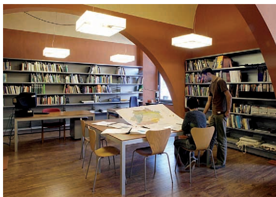
Figura 2. Centre de documentació de l'Observatori del Paisatge.

Per facilitar la difusió, formació i sensibilització en relació al paisatge, l'Observatori ha creat el web www.catpaisatge.net (fig. 3) amb l'objectiu de fer disponible d'una manera ràpida i senzilla informació sobre la nova política de paisatge a Catalunya, sobre conferències i activitats diverses, o sobre publicacions de referència i estudis universitaris vinculats amb el tema. El web conté també arxius fotogràfics, mapes i informació diversa sobre tota mena d'institucions i d'iniciatives catalanes, europees i d'altres parts del món dedicades al paisatge. La seva versió en castellà, anglès