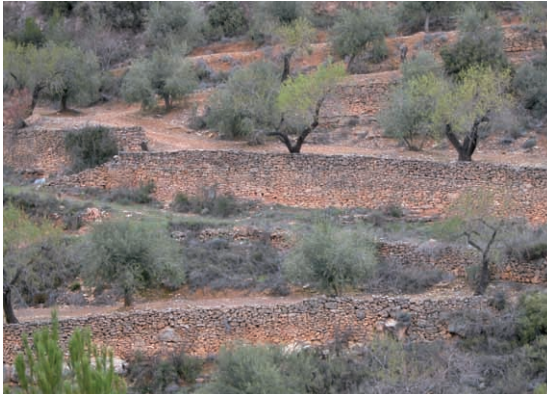
Figura 4. Murs de pedra seca del Camp de Tarragona.

ció- per canviar les dinàmiques que porten a una ruptura entre la població i el seu territori. En aquest sentit, els catàlegs de paisatge tenen el repte de definir línies estratègiques i directrius concretes que puguin contribuir a millorar la qualitat dels paisatges de Catalunya i, d'aquesta manera, la qualitat de vida dels seus ciutadans i ciutadanes. Els catàlegs de paisatge han de permetre avançar cap a una