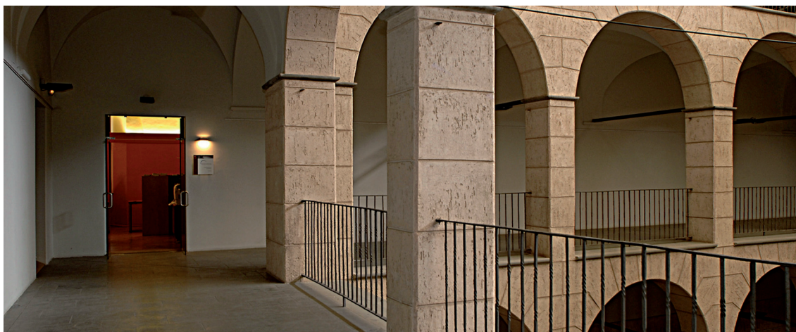
Figura 1. Claustre de l'edifici Hospici d'Olot, seu tècnica de l'Observatori del Paisatge de Catalunya.

de Catalunya destinats a identificar, classificar i qualificar els diferents paisatges existents; impulsar campanyes de sensibilització social respecte al paisatge, la seva evolució, les seves funcions i la seva transformació; difondre estudis i informes i establir metodologies de treball en matèria de paisatge; estimular la col·laboració científica i acadèmica en matèria de paisatge, així com els intercanvis de treballs i experiències entre especialistes i experts d'universitats i altres institucions acadèmiques i culturals; fer el seguiment de les iniciatives europees en matèria de paisatge; preparar seminaris, cursos, exposicions i conferències, així com publicacions i programes específics d'informació i formació sobre les polítiques de paisatge; crear un centre de documentació obert a tots els ciutadans i ciutadanes de Catalunya (fig. 2); i elaborar cada quatre anys un informe per al Parlament de Catalunya sobre l'estat del paisatge a Catalunya.