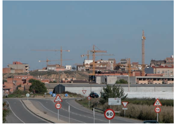
Figura 5. Paisatge en construcció a Terres de Lleida.

ció- per canviar les dinàmiques que porten a una ruptura entre la població i el seu territori. En aquest sentit, els catàlegs de paisatge tenen el repte de definir línies estratègiques i directrius concretes que puguin contribuir a millorar la qualitat dels paisatges de Catalunya i, d'aquesta manera, la qualitat de vida dels seus ciutadans i ciutadanes. Els catàlegs de paisatge han de permetre avançar cap a una