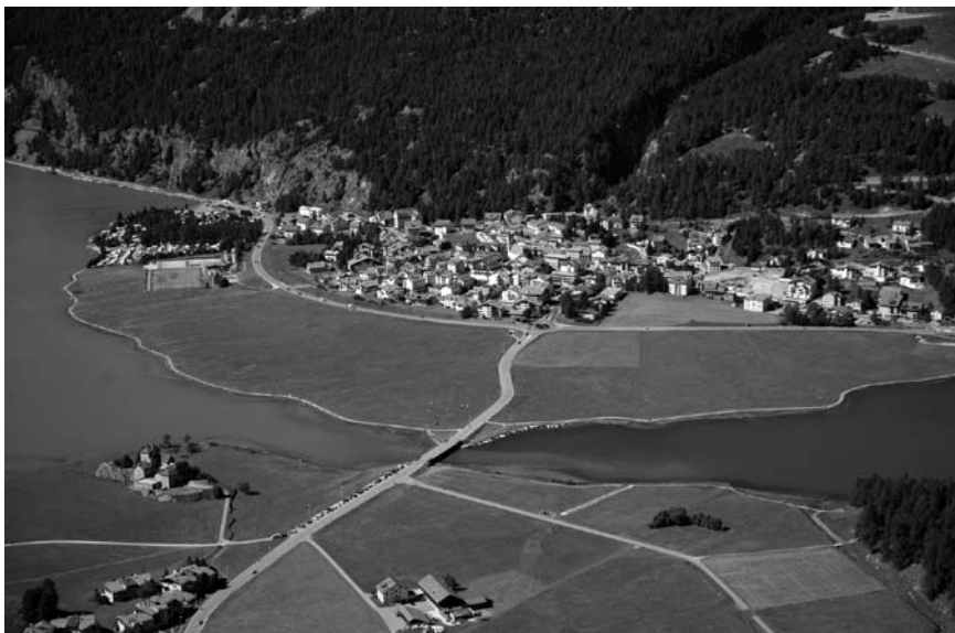
Imatge 3. El projecte Paysage 2020 aposta per un paisatge caracteritzat per l'existència d'espais no construïts entre les aglomeracions urbanes amb la transició clarament visible a les perifèries urbanes.

En l'àmbit de les espècies i el medi natural, cal recordar que les plantes i els animals simbolitzen l'expressió de la vida al planeta; per tant, deixar espai a la natura representa una mostra de respecte envers la creació de la qual formem part. La xarxa verda suïssa exigeix un comportament responsable amb relació als medis naturals, la fauna i la flora.