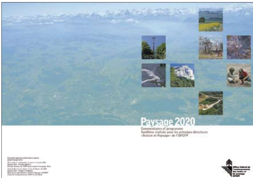
Imatge 1. Paysage 2020 descriu els canvis desitjables per al paisatge suís amb l'horitzó de l'any 2020.

ha de potenciar el desenvolupament sostenible dels hàbitats de la flora i la fauna i també de les zones en què la població resideix, treballa i s'esbargeix. A més, ha de facilitar la transformació d'aquests indrets en actius culturals que permetin identificar-s'hi positivament. Per això, és fonamental preservar i desenvolupar, amb independència de l'evolució del context general, els recursos naturals i els actius patrimonials del paisatge per tal de donar resposta a les necessitats de les generacions futures en aquest camp.