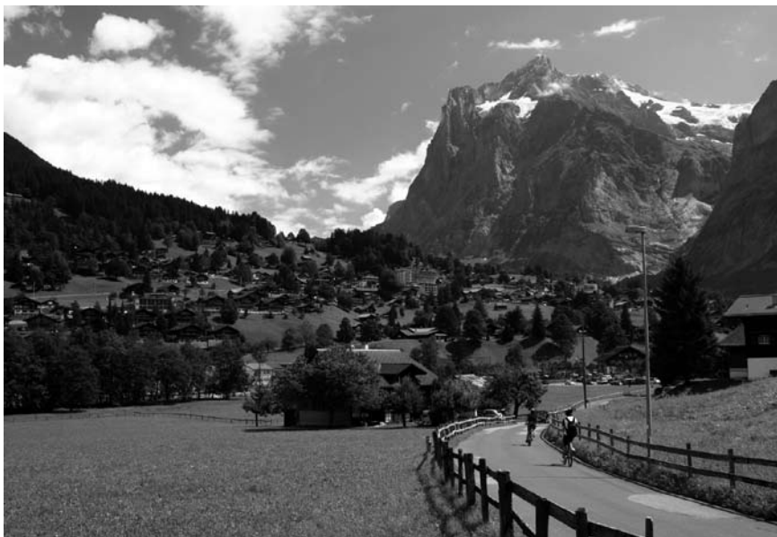
Imatge 2. Un dels objectius de qualitat paisatgística del projecte Paysage 2020 és “un paisatge accessible per a tothom”.

sos naturals i les transformacions paisatgístiques que es poden realitzar. Des d'aquest enfocament, l'objectiu general consisteix a vetllar per tal que cadascun dels usos es dugui a terme respectant la multifuncionalitat dels recursos a llarg termini, sense excloure de manera definitiva altres possibles usos. Concretament, es tracta que el desenvolupament d'aquests usos no es tradueixi en la desaparició d'elements insubstituïbles, ja siguin éssers vius o no, com ara espècies animals, vegetals o geòtops únics. Per tant, per tal de definir una gestió sostenible del paisatge és imprescindible tenir present un factor clau: la capacitat de regeneració dels recursos. En segon lloc, la perspectiva sociocultural considera els aspectes socials i emocionals de la nostra relació amb el paisatge i se centra en l'estètica i en les interaccions entre aquest i la naturalesa humana; és a dir, el paisatge es presenta com un conjunt d'elements naturals i físics que transmeten significats i emocions. Així doncs, la lectura d'un paisatge permet accedir a nombrosos indicadors, unes dades fonamentals per al desenvolupament de les persones, el seu benestar i el seu sentiment de pertinença a un territori i una cultura.