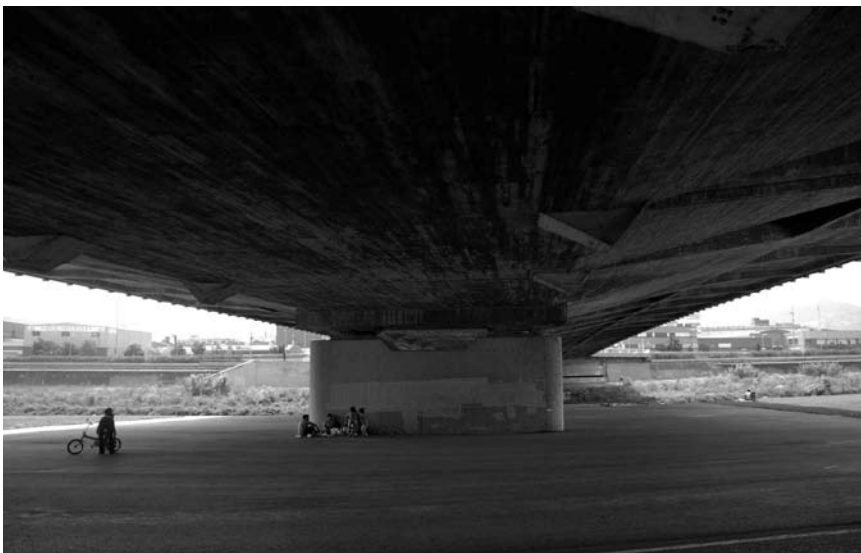
Imatge 2. La satisfacció paisatgística és un indicador que expressa el grau d'accontentament o descontentament de la població amb el paisatge que l'envolta.