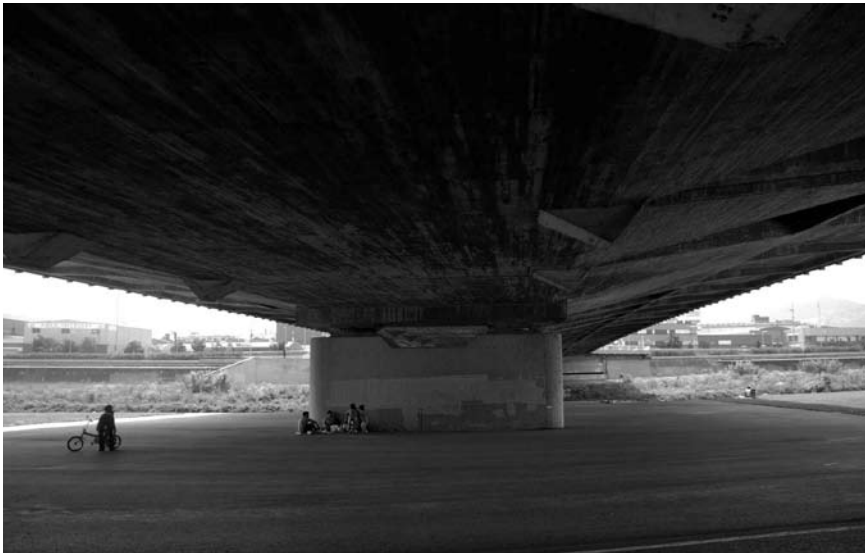
Imatge 2. La satisfacció paisatgística és un indicador que expressa el grau d'accontentament o descontentament de la població amb el paisatge que l'envolta.