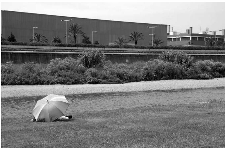
Imatge 1. Cal buscar indicadors vinculats a l'ús social del paisatge.

La conclusió que se n'extreu és que la majoria d'indicadors de paisatge que actualment estan disponibles tenen, en la seva gènesi, els indicadors de biodiversitat i de desenvolupament sostenible, basats en la conservació dels ecosistemes i la reducció dels impactes que sobre aquests generen les activitats antròpiques. Tenen, en termes generals i deixant de banda alguna excepció, un caràcter marcadament parcial, ambiental, no suficientment paisatgístic, pel fet que no aborden directament la manera de percebre el paisatge que té una societat.