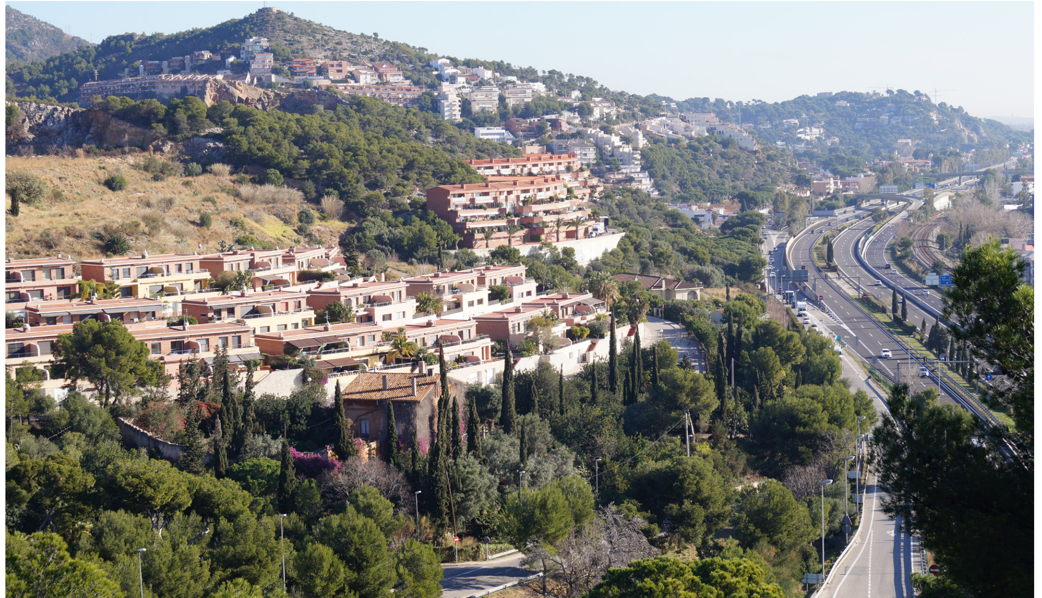
Un tret característic del Penedès és que hi ha nombroses urbanitzacions ubicades dalt o al vessant de turons ondulats i, per tant, molt visibles, com les presents al sector penedesenc del Delta del Llobregat. Observatori del Paisatge de Catalunya

Unes urbanitzacions integrades amb l'entorn però, també, amb uns espais i elements amb valor social i identitari dignes.