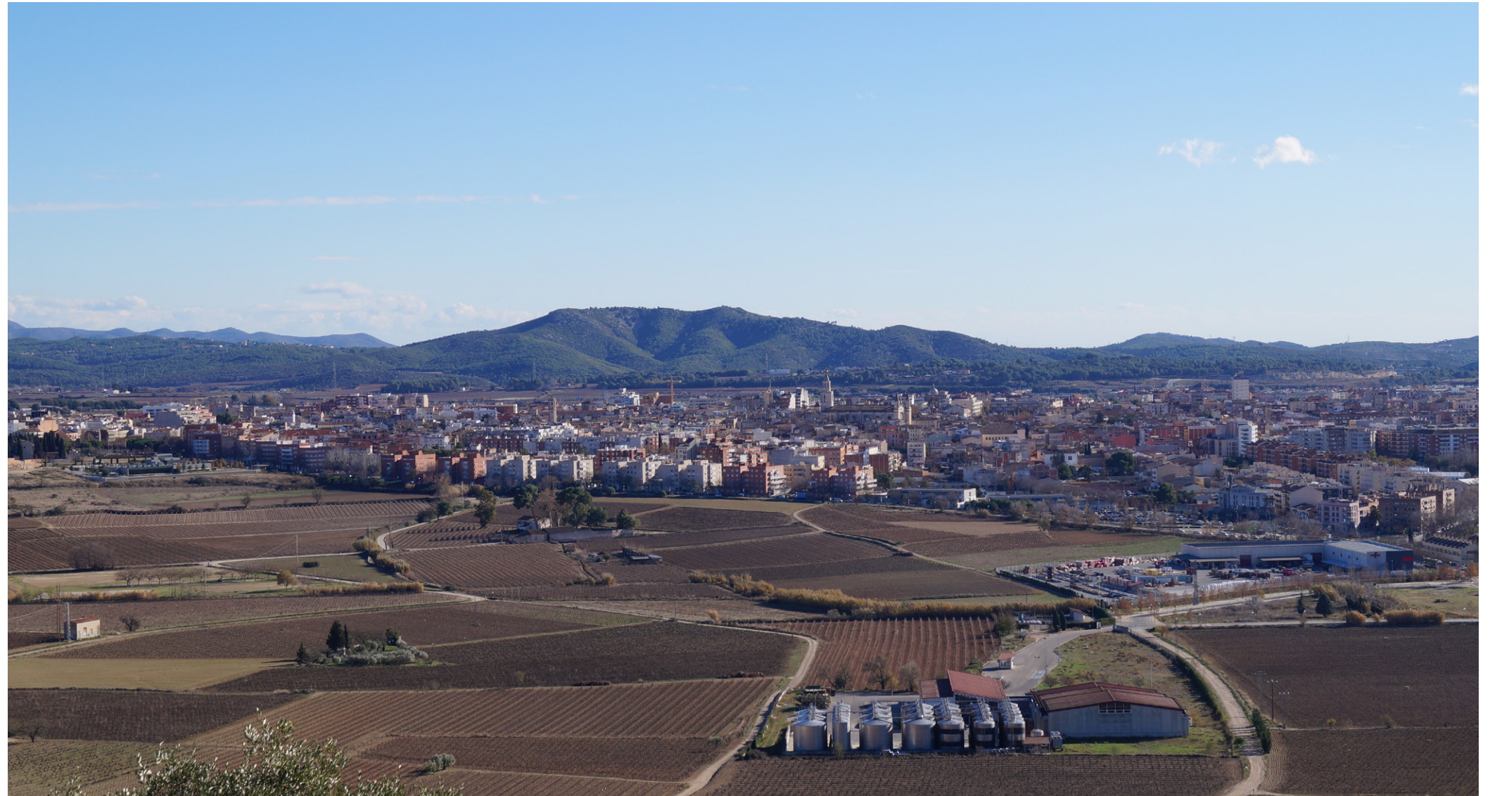
Els paisatges dels nuclis urbans penedesencs s'han mantingut raonablement compactes, com és el cas de Vilafranca del Penedès, especialment al seu sector nord, que té un límit clar amb els conreus de vinya i els camins que condueixen cap a la muntanya de Sant Pau.

Uns nuclis urbans percebuts com un conjunt harmoniós amb especial atenció a la silueta i a les façanes perimetrals i les entrades però, també els parcs, les places i els carrers.