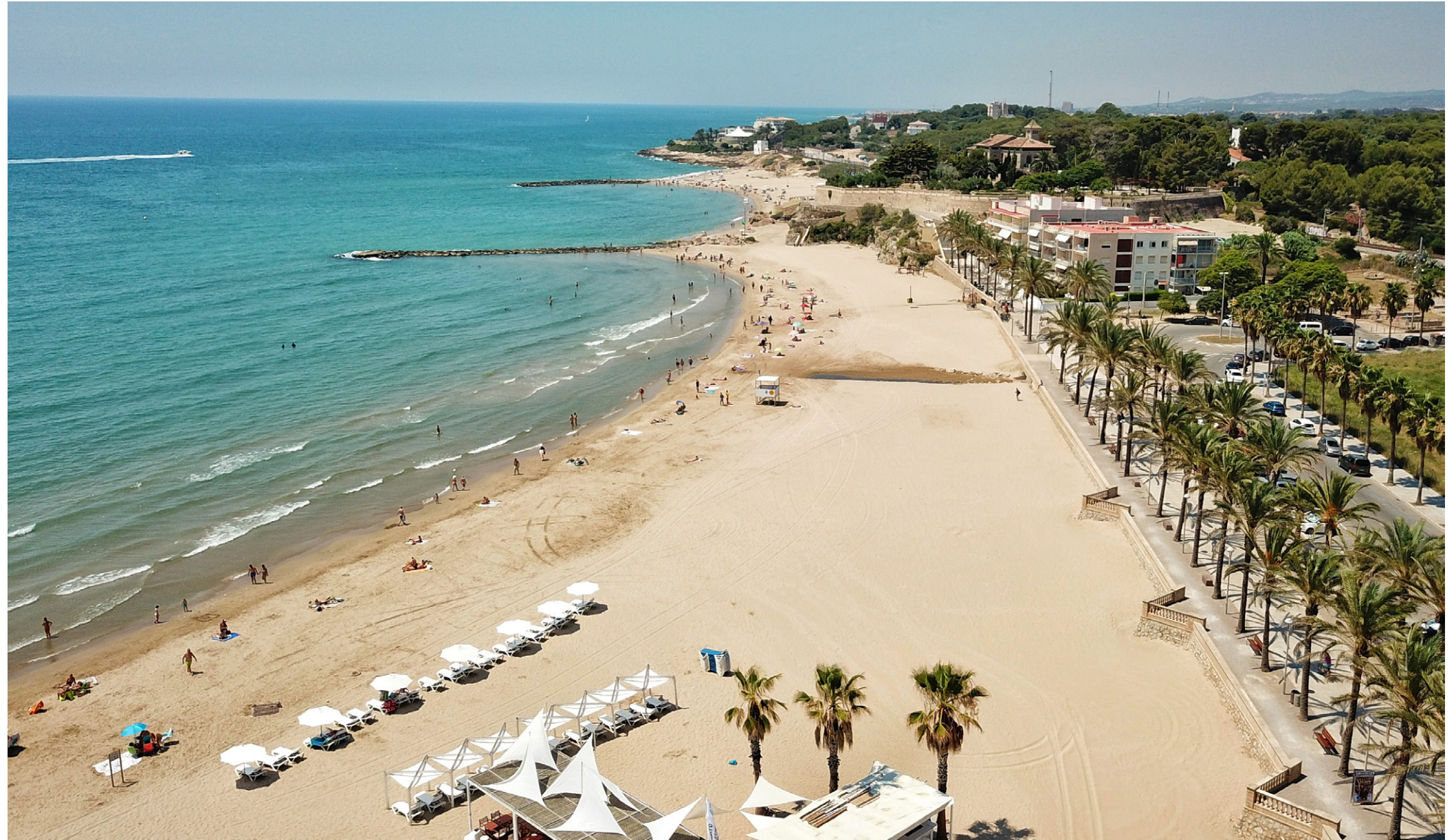
Malgrat la intensa transformació, la façana marítima encara compta amb nombrosos valors naturals, històrics, estètics i socials en indrets com la punta de Sant Gervasi de Vilanova i la Geltrú. Vilanova Turisme

Una façana marítima diversa, respectuosa amb les singularitats de cada lloc, amb un fons escènic del massís del Garraf de qualitat i amb una interfície entre la segona línia de mar i la primera ordenada i de qualitat.