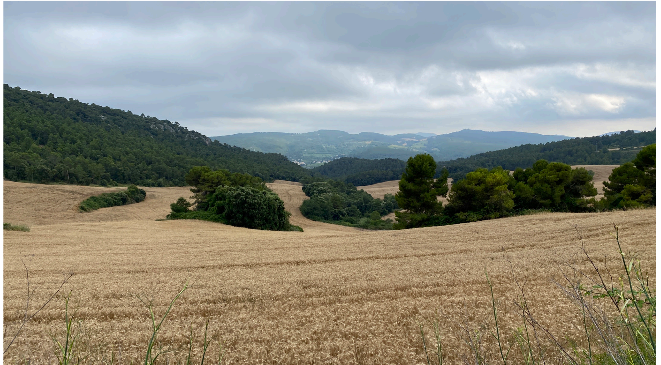
A les zones amb relleu ondulat es creen mosaics paisatgístics complexos, amb peces puntuals de bosc entre els camps de cereal com aquests de l'Alt Gaià. Observatori del Paisatge de Catalunya

Uns paisatges forestals i agroforestals que compaginin l'activitat agrícola, ramadera i forestal amb els usos socials i les funcions ecològiques, i posant una especial atenció en les seves principals amenaces (abandonament, incendis, canvi climàtic, etc.).