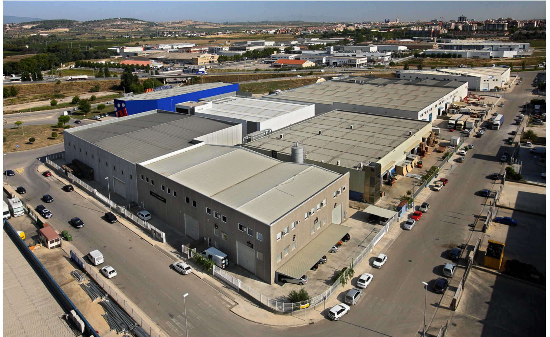
Les àrees especialitzades per a l'activitat econòmica se solen ubicar en llocs ben comunicats, propers a les infraestructures viàries, com és el cas del polígon Clot de Moja, situat al costat de la carretera N-340.

Unes àrees d'activitat econòmica (industrial, comercial, empresarial, tecnològica, logística o d'oci) que es percebin com un conjunt ordenat a nivell global però, també, pel que fa a les parts configurades per les cinc façanes perimetrals, les respectives volumetries, els diferents espais lliures i els vials.