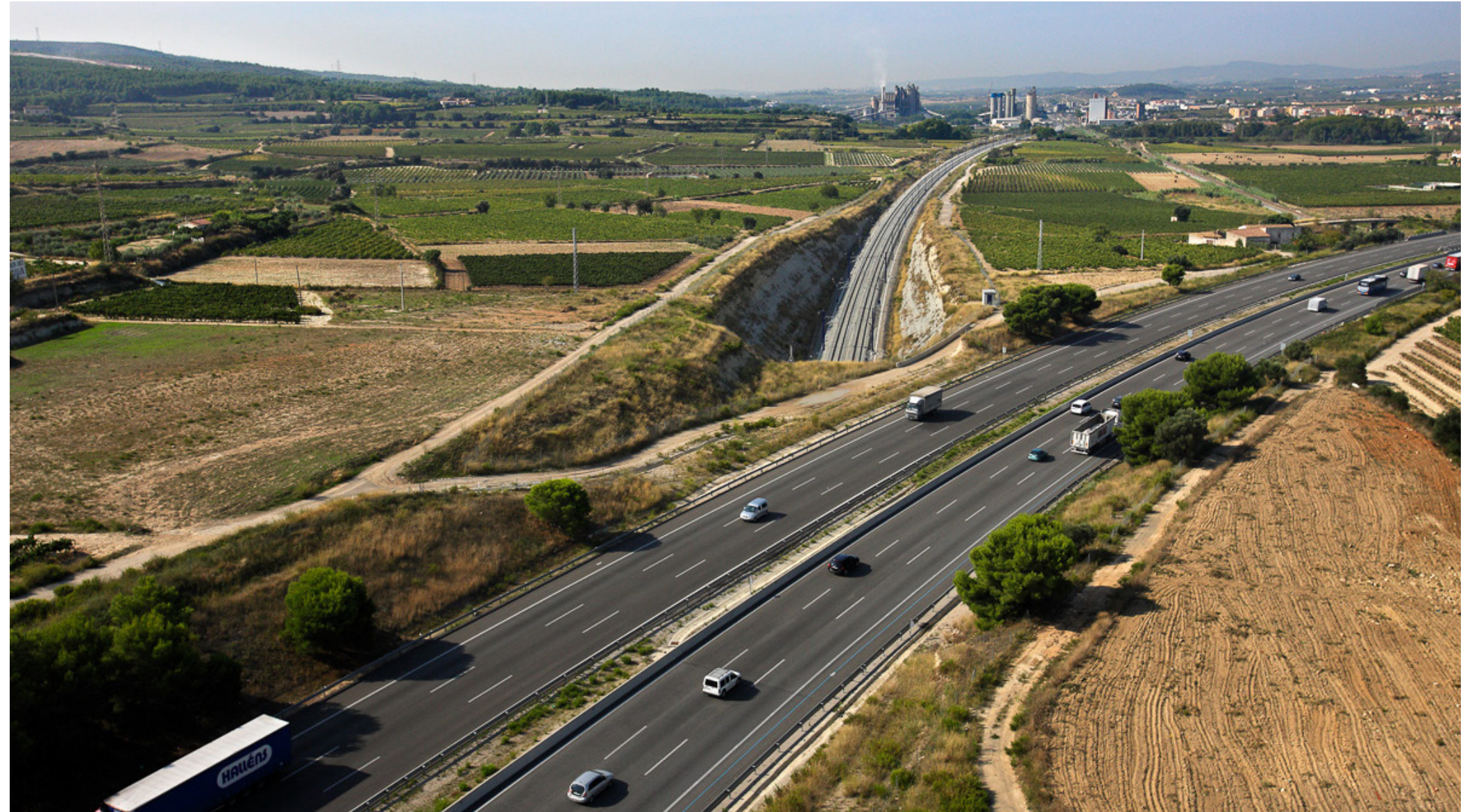
Les grans infraestructures de mobilitat es concentren en zones planes, com a la Plana del Penedès, on sovint conflueixen en un mateix espai, com és el cas de l'encreuament entre l'autopista AP-7, la línia ferroviària d'alta velocitat i el tren convencional entre els municipis d'Olèrdola i Santa Margarida i els Monjos.

Unes infraestructures de mobilitat i energètiques amb una bona integració paisatgística, que garanteixin la permeabilitat (ecològica i social), i que promoguin l'observació i el gaudi del paisatge.