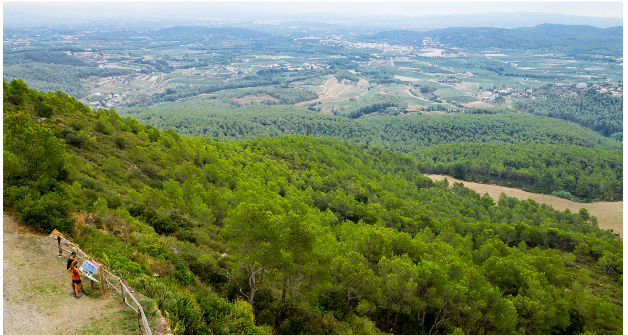
Els millors punts d'observació del paisatge acostumen a localitzar-se en llocs elevats, accessibles, de gran amplitud escènica i amb vistes atractives i variades que permeten captar tots els matisos dels paisatges. A la imatge, mirador del santuari de Foix. Observatori del Paisatge de Catalunya

Un sistema de punts d'observació del paisatge i d'itineraris que a més d'afavorir la interconnexió entre nuclis habitats penedesencs, emfatitzi les vistes panoràmiques més rellevants, i permeti descobrir la diversitat i els matisos dels seus paisatges.