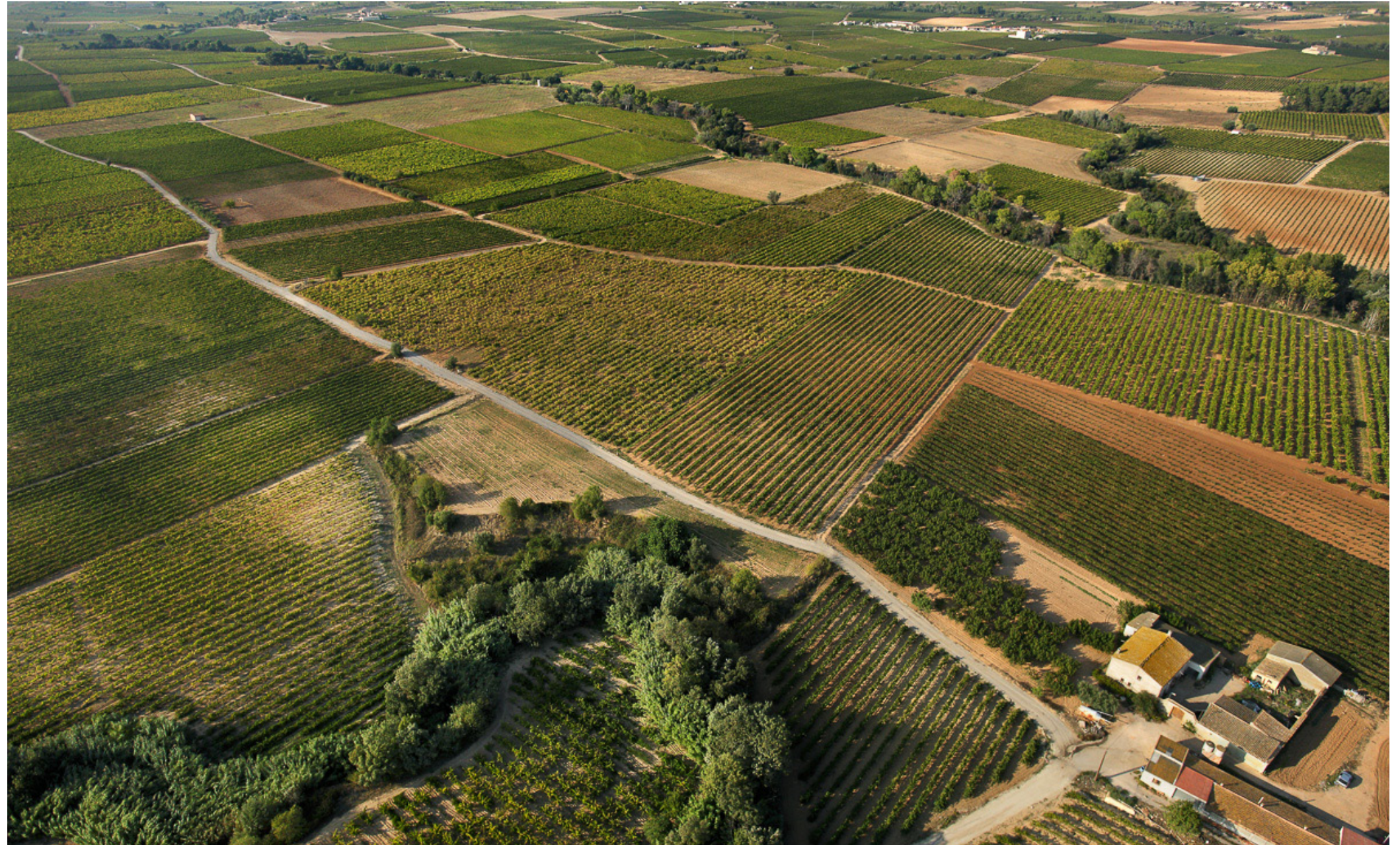
El paisatge vitivinícola està associat a una gran varietat d'elements i d'estructures paisatgístiques, un dels principals són els cursos fluvials encaixats en fondos amb vegetació de ribera i bosquines pròpies, com la riera de la Múnia.

Un paisatge de la vinya, associat a altres conreus o formant part d'un paisatge agroforestal, ben preservat, dinàmic i productiu, que mantingui la combinació de referents culturals (parcel·lari, camins, murs, barraques, pous, masies, cellers, etc.) que els dotin d'identitat pròpia amb la finalitat de motivar el valor afegit dels productes agrícoles.