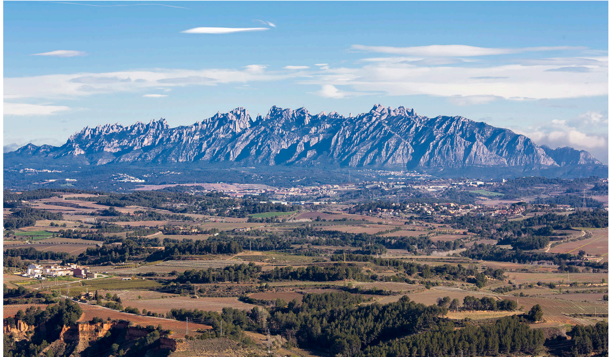
Montserrat és el fons escènic emblemàtic per excel·lència de bona part del Penedès.

Unes fites i fons escènics de qualitat, preservats i revalorats, que mantinguin els referents visuals i identitaris del Penedès.