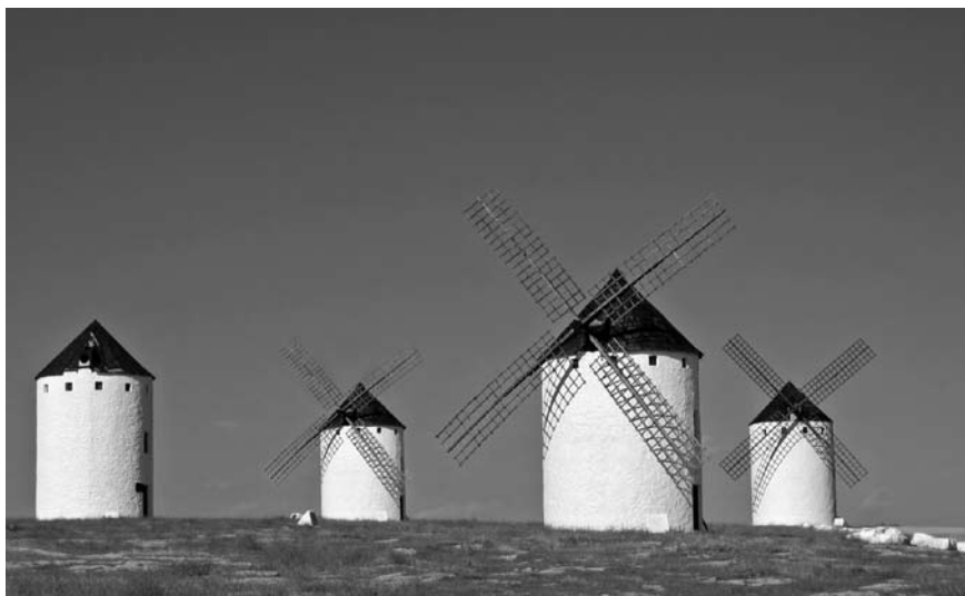
Imatge 4. El Pla especial de la zona dels molins del Campo de Criptana és un bon exemple d'ordenació paisatgística a escala local.

En efecte, a l'empara de la legislació autonòmica d'ordenació (Decret legislatiu 1/2004, de 28 de desembre, pel qual s'aprova el Text refós de la Llei d'ordenació del territori i de l'activitat urbanística), en l'actualitat estan en marxa cinc plans d'ordenació subregionals (plans d'ordenació territorial) i el pla d'ordenació regional anomenat Estratègia territorial de Castella-la Manxa. Dos dels plans d'ordenació territorial són per a les àrees urbanes d'Albacete i Ciudad Real, mentre que els altres tres es dissenyen per a tot l'entorn de Madrid que pertany a Castella-la Manxa (La Sagra, Mesa de Ocaña i Corredor del Henares), una àrea caracteritzada per unes transformacions territorials i paisatgístiques fortes. Els avanços d'aquests sis documents, tal com estan disponibles al web www.potcastillalamancha.com a agost de 2009, consideren el Conveni europeu del paisatge com un antecedent normatiu i, en conseqüència, es plantegen introduir el paisatge dins el model ordenador. Com s'esdevé en altres comunitats, hi ha experiències d'ordenació paisatgística a escala local; és el cas dels coneguts molins del Campo de Criptana, enormement connotats per la ploma de Cervantes, on un pla especial recent, a més de tractar els aspectes urbanístics, satisfà el Conveni europeu del paisatge (Mata i Galiana, 2008).