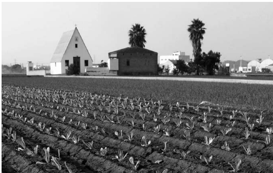
Imatge 3. Els darrers anys l'Horta de València està essent objecte d'iniciatives de planificació del paisatge.

l'Horta de València. Aquest darrer pla ha estat desenvolupat mitjançant el Pla d'acció territorial de protecció de l'Horta de València, que el 2008 ha estat en exposició pública. Amb una marcada dimensió paisatgística, aquest pla hauria de permetre preservar bona part dels espais agraris que resten a l'Horta de València, així com endreçar-hi els creixements urbanístics i d'infraestructures. Altres plans d'acció territorial (com ara el del Litoral de la Comunitat Valenciana, sotmès a informació pública el 2006 però encara tampoc aprovat) contenen disposicions en matèria de paisatge, tal com determina la legislació aplicable. Alhora, es té notícia que estan en procés d'elaboració almenys dos plans d'acció territorial només de paisatge, tot i que no s'han fet públics, d'àmbits corresponents a conques fluvials de les comarques centrals valencianes: el Pla d'acció territorial del paisatge de l'àmbit supramunicipal de la vall del riu Serpis i la vall del riu Gallinera, i el Pla d'acció territorial del paisatge de l'àmbit supramunicipal de la vall del riu Guadalest. Recentment ha aparegut una publicació que sistematitza aquests darrers esforços en matèria de paisatge, anomenada significativament La nova política del paisatge de la Comunitat Valenciana (Generalitat Valenciana, 2009).