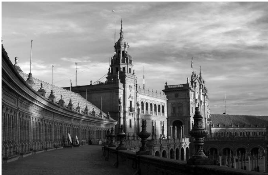
Imatge 2. Sevilla és la ciutat on es va signar la Carta del paisatge mediterrani, considerada la base del Conveni europeu del paisatge.

voluntat de reunir les produccions més significatives del paisatge andalús dels dos darrers segles (Fernández Lacomba, et al. , 2007). D'altra banda, el Centro de Estudios Paisaje y Territorio es concep amb una funció d'òrgan assessor de les administracions públiques en l'àmbit del paisatge i té la responsabilitat d'impulsar la creació d'un ens específic tipus observatori del paisatge, que es preconfigura com un instrument per al seguiment de l'evolució del territori i del paisatge en aquesta comunitat.