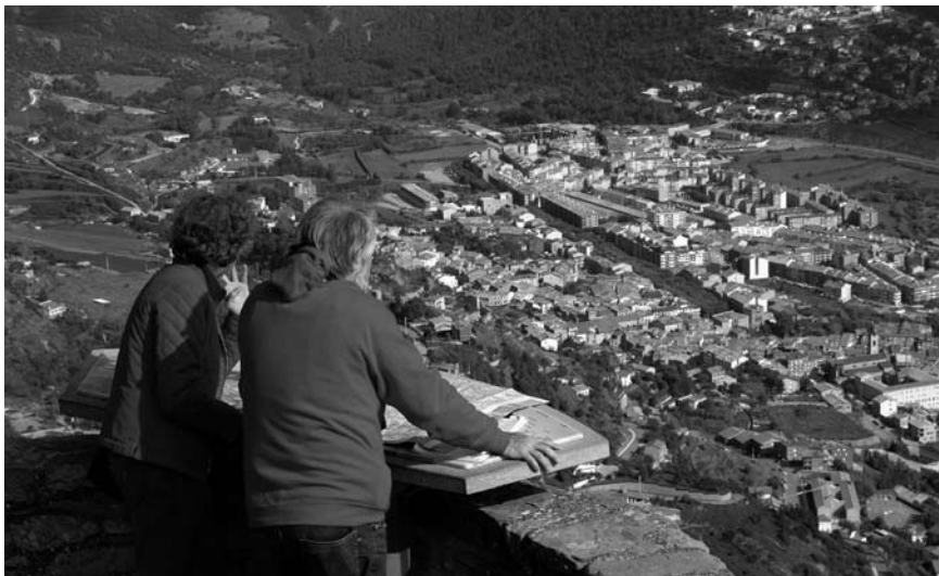
Imatge 1. Els catàlegs de paisatge de Catalunya identifiquen els miradors més adequats per a interpretar i gaudir del paisatge.

En aquesta mateixa publicació hi ha capítols monogràfics que expliquen aquestes eines i les solucions concretes que s'han adoptat en cada cas 6 . Convé fer palès en aquest punt, però, que Catalunya s'ha significat en el desenvolupament de polítiques i instruments del paisatge, fins al punt que ha esdevingut un referent per als altres territoris de l'Estat, i que ja ha avançat en la línia marcada pel seu propi marc legislatiu i normatiu.