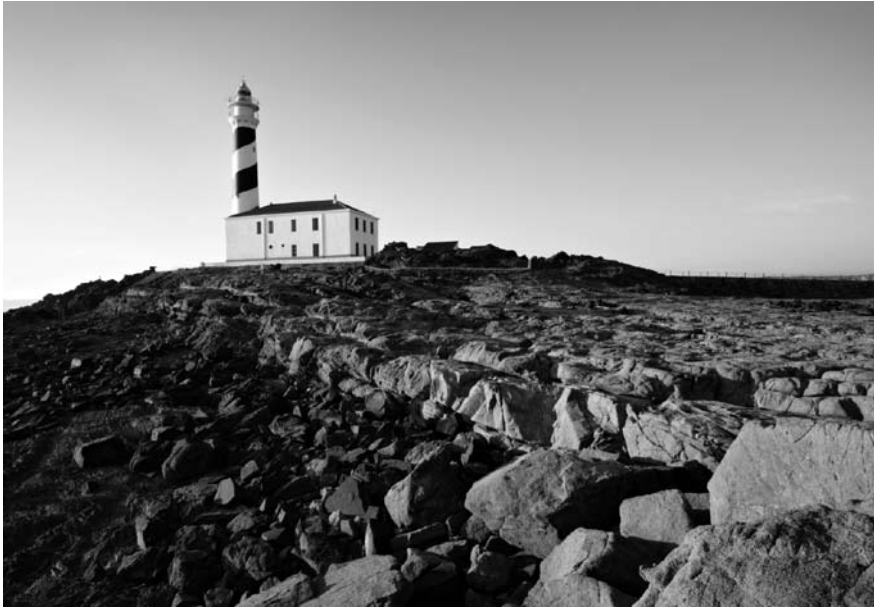
Imatge 5. La dimensió paisatgística del Pla territorial insular de Menorca del 2003 és considerada un referent arreu de l'Estat espanyol.

oberta, que pretén posar les bases per establir una política del paisatge prou sòlida dins del marc normatiu i competencial del Consell de Mallorca” (Dubon, 2009: p. 58). Es parteix de les unitats de paisatge establertes pel Pla territorial insular del 2004, en el marc del qual ja s’efectuaven restriccions específiques per a unitats considerades molt amenaçades i accions de millora del paisatge arreu de l’illa. Tanmateix, l’Estratègia va més enllà i proposa nous objectius, que en part reprenen els propòsits definits el 2004, entre els quals es poden destacar: el compromís de promoure la serra de Tramuntana perquè esdevingui patrimoni de la humanitat, el desenvolupament de projectes de recuperació i millora del paisatge mitjançant les eines previstes pel Pla territorial (per exemple, a la perifèria metropolitana de Palma) i la cerca de la coordinació de la política agrària amb la del paisatge per tal que es mantingui el paisatge rural illenc per mitjà de la promoció de productes de qualitat i d’indicació geogràfica. Alhora, l’Estratègia proposa la creació d’un observatori del paisatge de Mallorca.