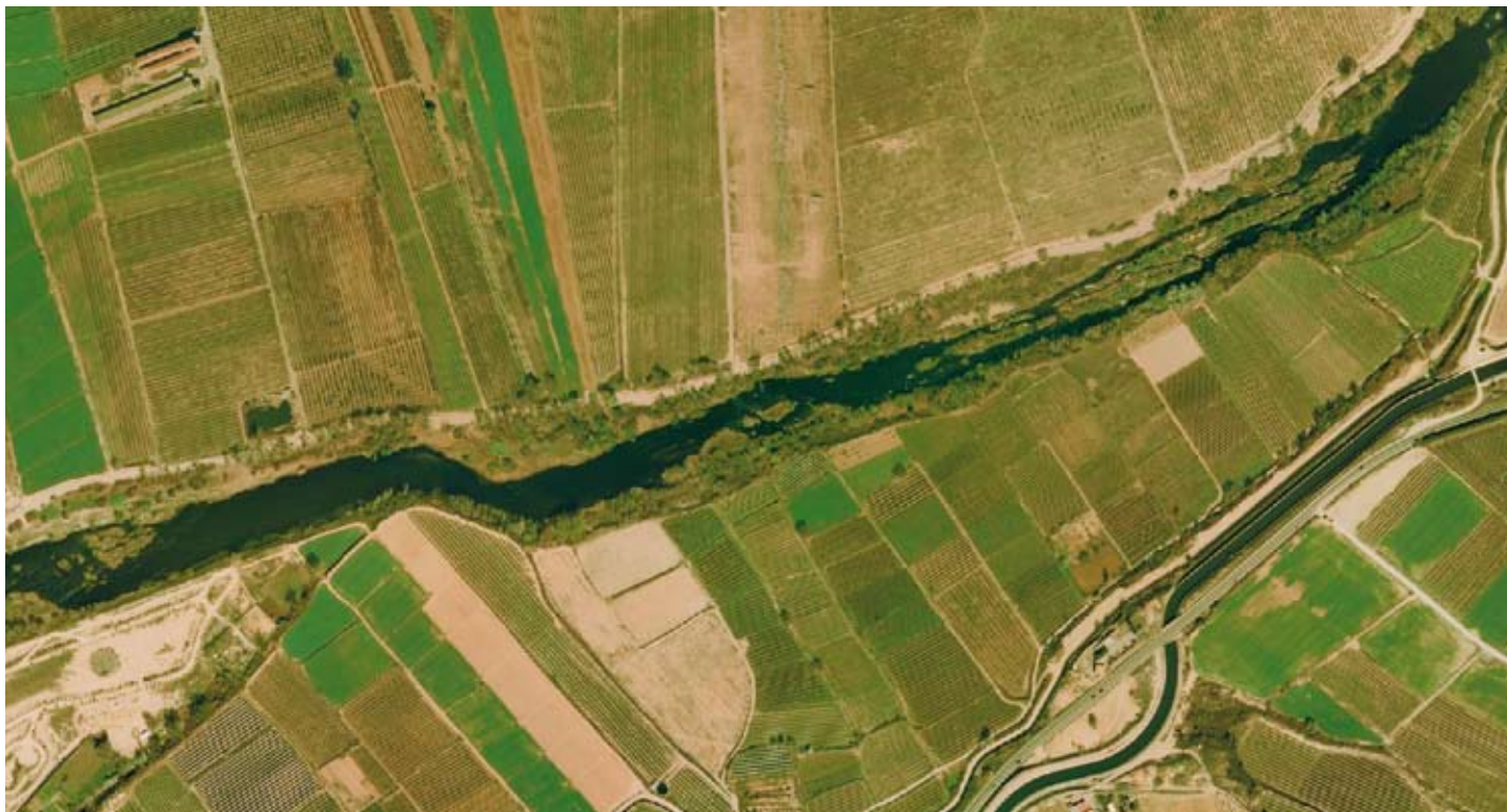
Parcel·les d'horta a la llera del riu Segre. ICC