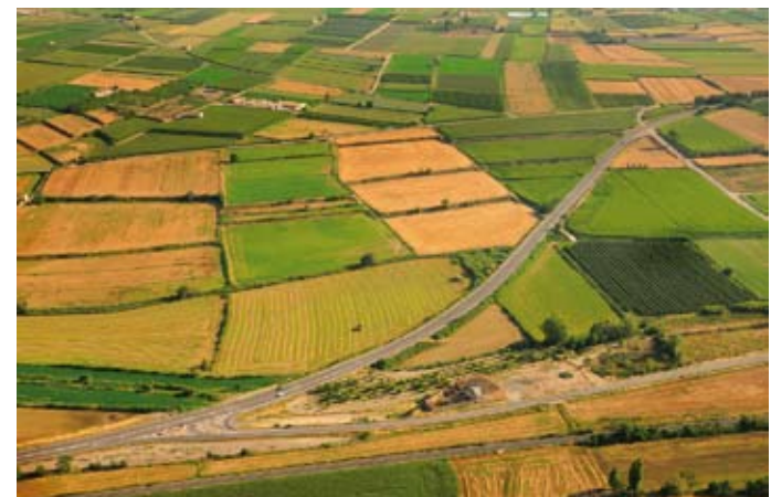
Antiga carretera N-II i el ferrocarril amb conreus de regadiu entre les poblacions de Golmés i Bellpuig. Jordi Bas