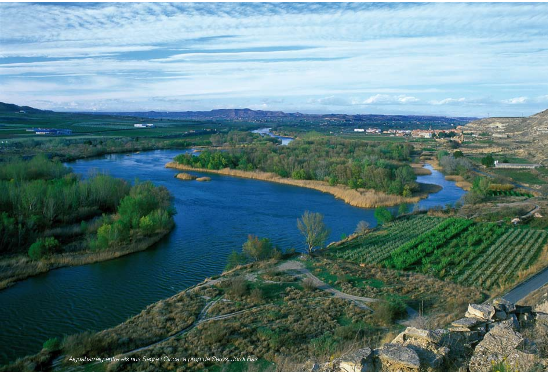
Aiguabarreig entre els rius Segre i Cinca, a prop de Seròs. Jordi Bas

El paisatge d'atenció especial del parc fluvial del Segre reuneix una faixa de territori allargada i estreta que dibuixa un paisatge lineal homogeni i que adopta una forma d'i grega en comprendre la riba del riu Segre des del partidor de Balaguer, on el riu eixampla la llera aigües avall dels darrers estreps prepirinencs, fins gairebé a l'aiguabarreig amb l'Ebre, i la riba del riu Noguera Ribagorçana, afluent per l'oest del Segre, des d'Andaní fins a l'aiguabarreig amb aquell riu, ja a la localitat de Corbins.