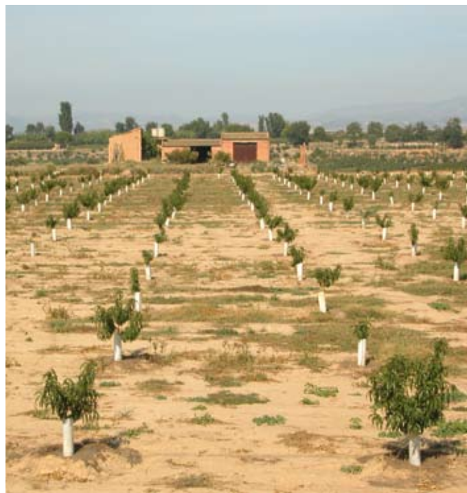
Nous conreus a les rodalies de la Portella. Observatori del Paisatge