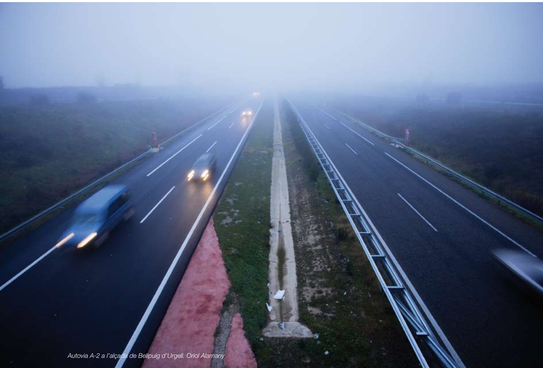
Autovia A-2 a l'alçada de Bellpuig d'Urgell. Oriol Alamany

Per l'àmbit de Terres de Lleida hi creuen dues vies de comunicació molt importants: l'autovia A-2 i el ferrocarril, on destaca el tram entre Lleida i Barcelona. Ambdues, conjuntament, configuren un important eix de mobilitat del territori.