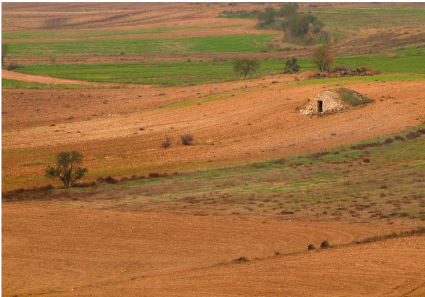
Cabana de volta i conreus de secà al pla dels Estinclells, a prop de Verdú. Jordi Bas

L'evolució d'aquest paisatge d'atenció especial haurà de complir també els objectius de qualitat paisatgística per a tot l'àmbit de Terres de Lleida (vegeu el bloc 5). També cal tenir present de: