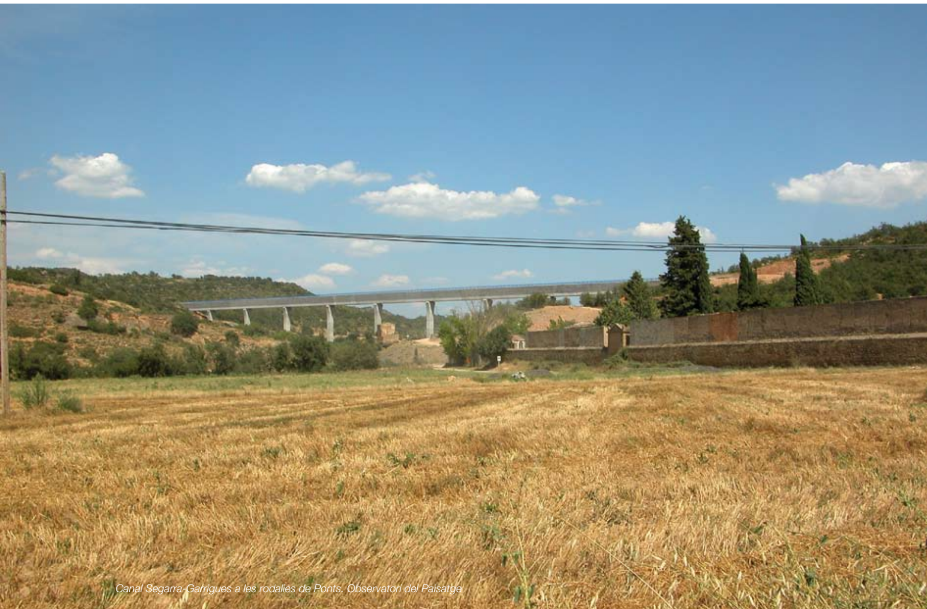
Canal Segarra-Garrigues a les rodalies de Ponts. Observatori del Paisatge

El paisatge d'atenció especial constituït pels nous regadius del canal Segarra-Garrigues engloba unitats de paisatge molt diverses, amb tipologies de relleu i usos del sòl actuals bastant diferents. Aquest fet afegeix complexitat a l'hora d'establir pautes d'actuació sobre el paisatge.