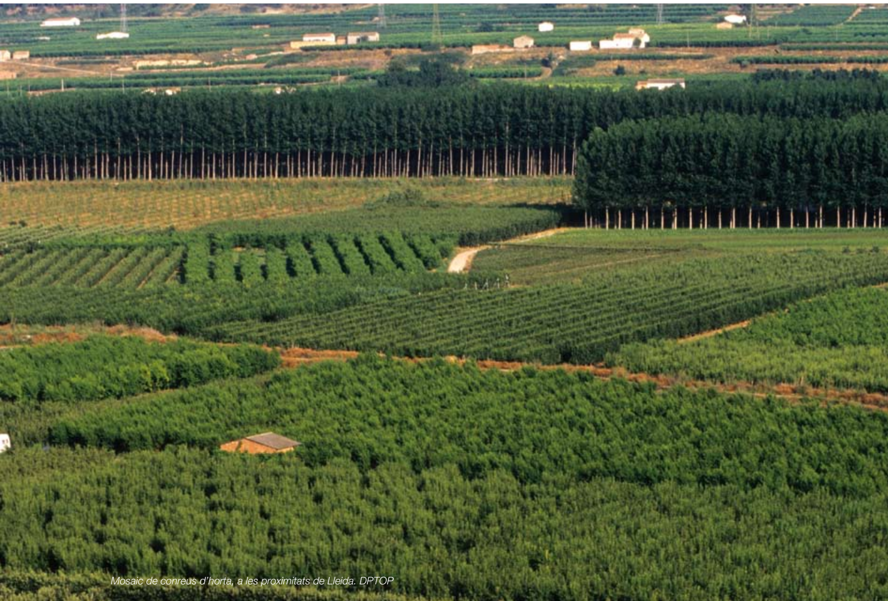
Mosaic de conreus d'horta, a les proximitats de Lleida. DPTOP

L'horta de Lleida, situada a la plana nord-oest de la ciutat de Lleida, constitueix una àrea agrícola d'alt interès social, productiu i paisatgístic. L'estructura d'aquestes terres, fonamentalment destinades a un aprofitament agrícola de regadiu i amb una població disseminada en torres o petits nuclis dispersos d'agrupacions gairebé familiars, prové de l'època musulmana. El capítol 7 del bloc 3 descriu amb més detall aquest paisatge tan singular.