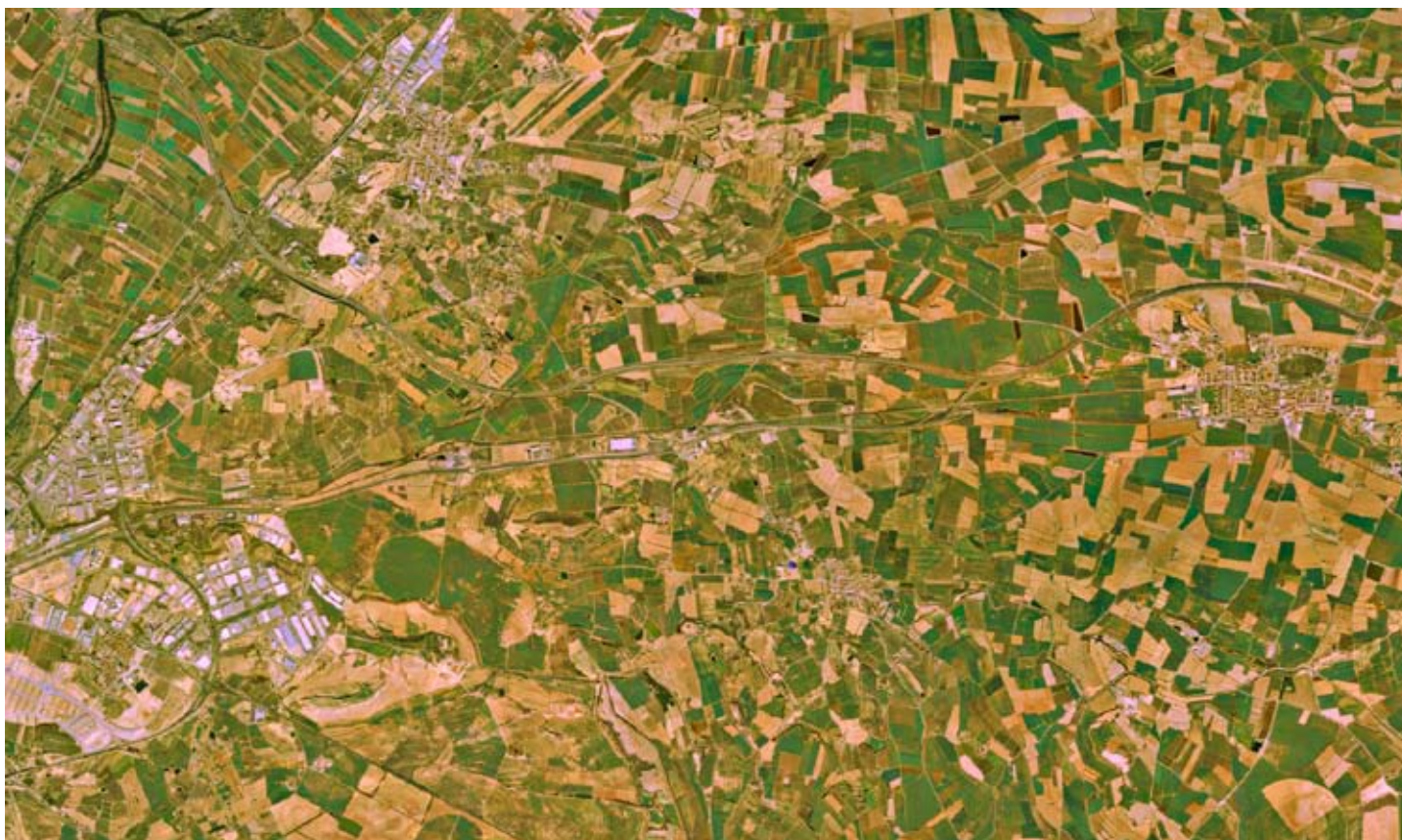
L'eix d'infraestructures entre Lleida i Bell-lloc d'Urgell. ICC