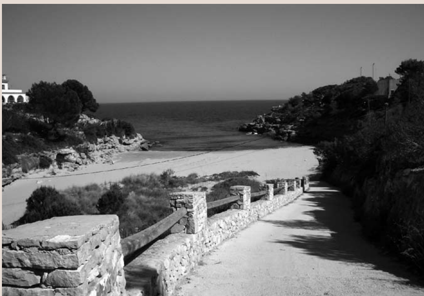
Imatge 4. El Fons per a la protecció, gestió i ordenació del paisatge destina una part dels seus recursos a subvencionar la construcció de camins de ronda per mitjà de convocatòries públiques anuals.

amb recursos financers del pressupost general del Departament de Política Territorial i Obres Públiques s'ha contribuït al finançament d'actuacions de caràcter pilot de millora del paisatge, com ara les obres de millora paisatgística de l'accés sud de Granollers o les obres del parc de Pinar de Peruquet de Vila-seca.