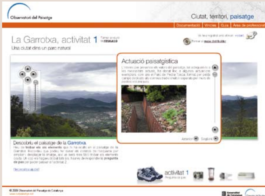
Imatge 3. Web del projecte Ciutat, territori, paisatge, dirigit a fomentar l'educació en el paisatge entre l'alumnat d'educació secundària obligatòria de Catalunya.

Les actuacions de formació i suport als especialistes previstes per la llei inclouen tant activitats de formació com l'elaboració d'instruments de gestió. En aquests àmbits, la Direcció General d'Arquitectura i Paisatge ha donat suport a diversos cursos de formació organitzats per col·legis professionals, ha participat en mestratges i cursos especialitzats organitzats per les universitats i ha organitzat jornades tècniques monogràfiques. Així mateix, ha iniciat la publicació de guies pràctiques d'integració paisatgística, de les quals s'han editat dos números ( Polígons industrials i sectors d'activitat econòmica i Horts urbans i periurbans ). A més, Guia pràctica