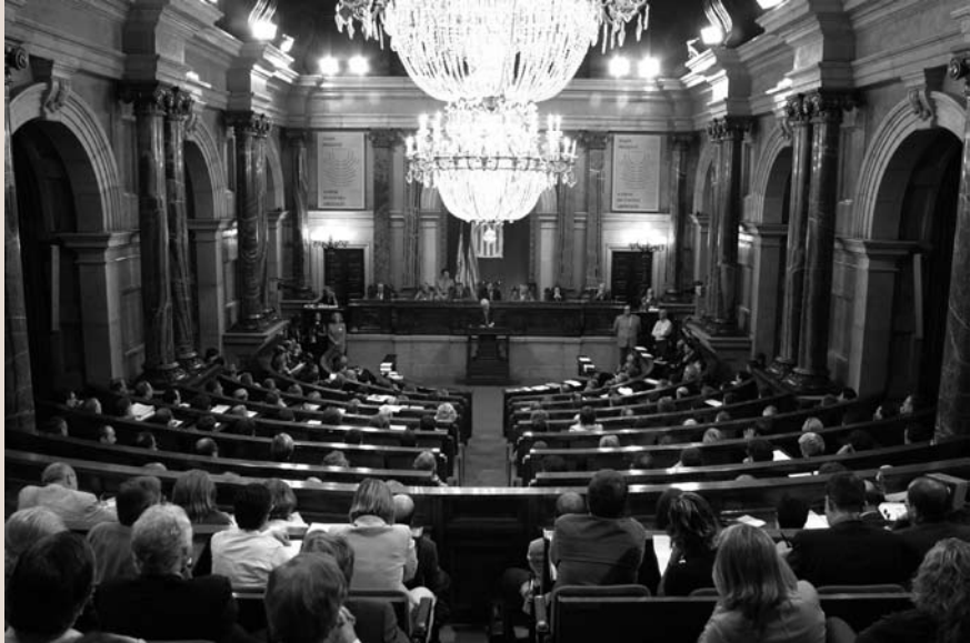
Imatge 1. El Parlament de Catalunya va ser la primera cambra parlamentària europea a adherir-se al Conveni europeu del paisatge.

nació del paisatge. Els objectius de qualitat paisatgística són la formulació que les administracions públiques competents fan, per a un paisatge concret, de les aspiracions de la població pel que fa a les característiques paisatgístiques del seu entorn. Per protecció del paisatge s'entenen les accions de conservació i de manteniment dels aspectes significatius o característics del paisatge, justificades pels valors patrimonials d'aquests últims. Segons el conveni, la gestió del paisatge són les accions destinades a mantenir-lo tot guiant i harmonitzant les transformacions induïdes per les evolucions socials, econòmiques i ambientals. En canvi, per ordenació del paisatge s'entenen les accions que tenen un caràcter prospectiu, destinades a la valoració, la restauració o la creació de paisatges.