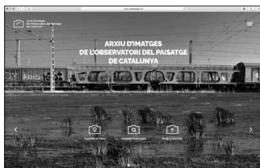
Imatge 4. Pàgina principal del web de l'Arxiu d'Imatges on hi figuren tres icones, dues per buscar imatges –a través de la barra de cerca i a través d'un mapa–, i la tercera permet col·laborar amb l'Arxiu amb l'apartat "Penja la teva foto".

La informació que es recull de cada imatge s'ha agrupat en cinc apartats. En primer lloc, la "Identificació", que inclou el nom de l'autor, el contacte, el tipus de llicència, com cal citar la foto (anomenem aquest camp "crèdits") i dades internes com ara la data d'ingrés a l'Arxiu, si està catalogada, si és un donatiu, etc. El segon apartat és el que hem anomenat "Contingut", i s'hi descriu el contingut de la fotografia a través de la llista de matèries i elements que es va elaborar amb els tècnics; també hi ha un camp per descriure la imatge utilitzant text lliure i incloure qualsevol observació i un apartat reservat per al títol, en cas que en tingui. El tercer grup és el de la "Localització", que a més d'indicar el municipi, la comarca, les coordenades i els topònims també inclou el camp "unitat de paisatge". El quart grup és la 'Descripció física', que es refereix a la disposició de la foto (horitzontal o vertical), el format (jpeg, tiff...), les dimensions en píxels i el pes en bytes. L'últim