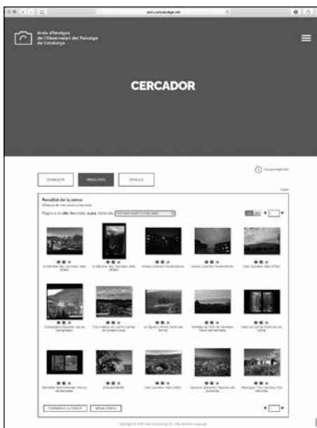
Imatge 3. Exemple de la pàgina de resultats d'una cerca a l'Arxiu d'imatges de l'Observatori del Paisatge de Catalunya.