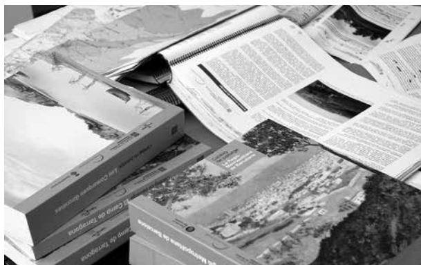
Imatge 1. Els catàlegs són documents que identifiquen i descriuen els paisatges de Catalunya, els seus valors, la seva evolució, l'estat de conservació i les seves dinàmiques, entre altres aspectes.

de consultar i gestionar. A més, calia afegir-hi les fotografies preses durant altres treballs de camp i sortides dels tècnics de l'Observatori. L'alt volum d'imatges va obligar a buscar una eina més adequada per gestionar-les.