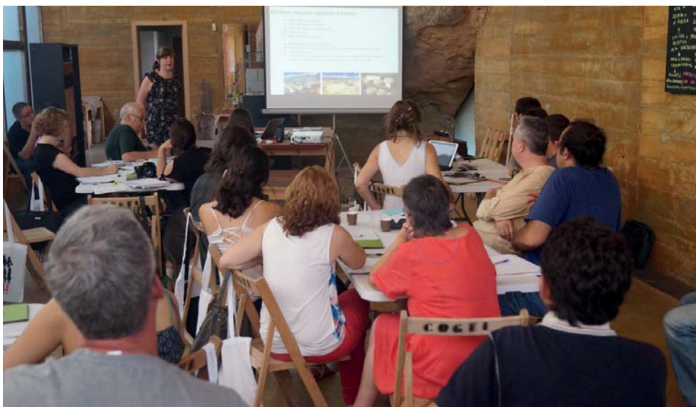
Imatge 4. Jornada de Territoris pel Paisatge celebrada l'any 2018 a les Garrigues.

L'interès per redactar plans i cartes de paisatge, així com altres iniciatives locals a favor del paisatge, ha evidenciat que algunes administracions locals han començat a veure el paisatge com un motor de desenvolupa-