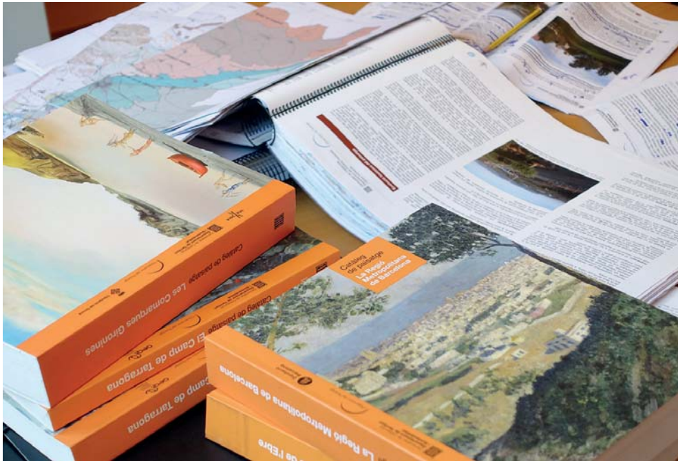
Imatge 2. El principal objectiu dels catàlegs de paisatge és contribuir a la incorporació del paisatge en el planejament territorial i urbanístic, i per això l'abast territorial es correspon amb els àmbits d'aplicació dels plans territorials parcials.

L'elaboració dels catàlegs de paisatge ha suposat un gran repte metodològic per a l'Observatori del Paisatge, ja que, tot i que hi havia alguna experiència interessant d'àmbit europeu, no existia un mètode reconegut universalment per estudiar, identificar i avaluar els paisatges i la seva diversitat, i encara menys per aplicar les directrius resultants dels objectius de qualitat paisatgística en el planejament territorial. La metodologia d'elaboració dels catàlegs de paisatge (Nogué, Sala i Grau, 2016) es basa en quatre fases: la identificació i caracterització del paisatge, l'avaluació del paisatge, la definició dels objectius de qualitat paisatgística i l'establiment de propostes de criteris i accions. Val a dir que, tot i comptar amb una guia o prototipus a l'hora d'iniciar els catàlegs, durant el procés d'elaboració dels vuit catàlegs s'han anat millorant alguns aspectes de la metodologia.