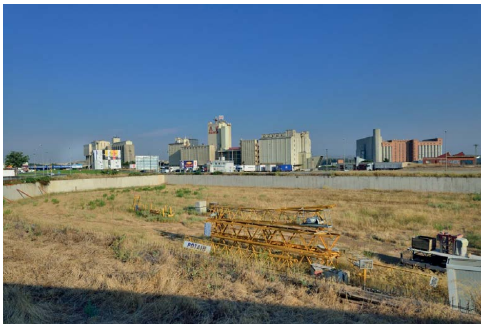
Imatge 1. El Conveni europeu del paisatge amplia el concepte de paisatge al conjunt del territori, i no només a aquelles àrees d'especial bellesa.

aquests objectius, s'insta a la integració del paisatge en el planejament territorial i urbanístic, així com en les polítiques sectorials. Aquesta Llei i el Decret 343/2006, de 19 de setembre, que la desenvolupa són la base de la política de paisatge a Catalunya. Aquesta legislació defineix un marc legal per protegir els paisatges catalans i crea instruments per ordenar-los i gestionar-los. Són l'instrument de col·laboració i suport de l'Administració i la societat (l'Observatori del Paisatge de Catalunya), els instruments de protecció, gestió i ordenació (els catàlegs de paisatge i les directrius de paisatge), els instruments de concertació d'estratègies (les cartes de paisatge), els instruments d'integració paisatgística (estudis i informes d'integració paisatgística), l'instrument de finançament (el Fons per la protecció, gestió i ordenació del paisatge) i els instruments de sensibilització i educació.