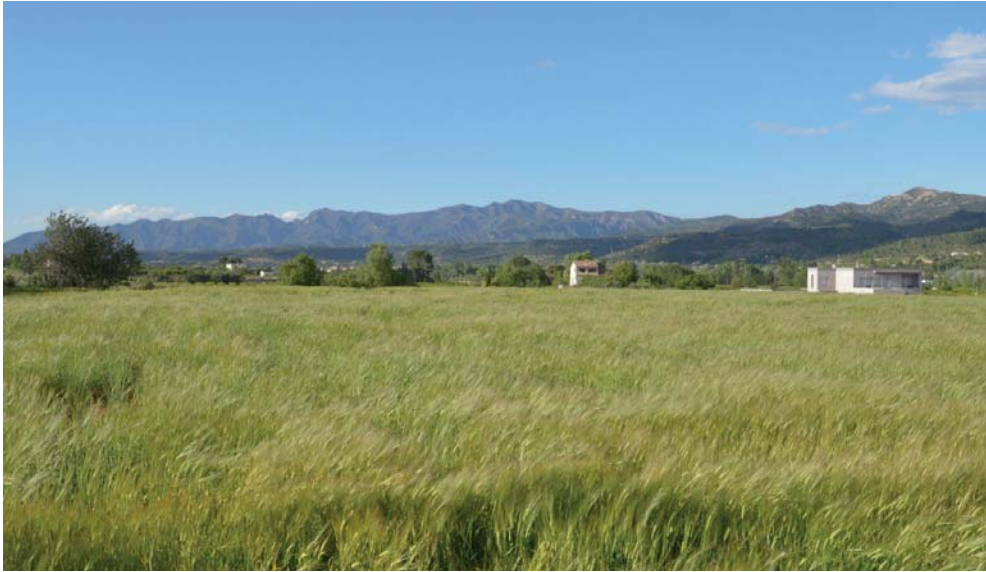
Imatge 3. Els criteris i accions donen les pautes per poder assolir els objectius de qualitat paisatgística. Per exemple, la bona integració de les construccions aïllades (criteri/acció) té un paper cabdal en la percepció de la nitidesa del paisatge de les Terres de l'Ebre (objectiu).

directrius de paisatge són el de les Terres de l'Ebre i el de les Comarques Gironines, i en aquests moments, el Departament de Territori, Habitatge i Transició Ecològica ho està fent en el del Pla territorial parcial del Penedès.