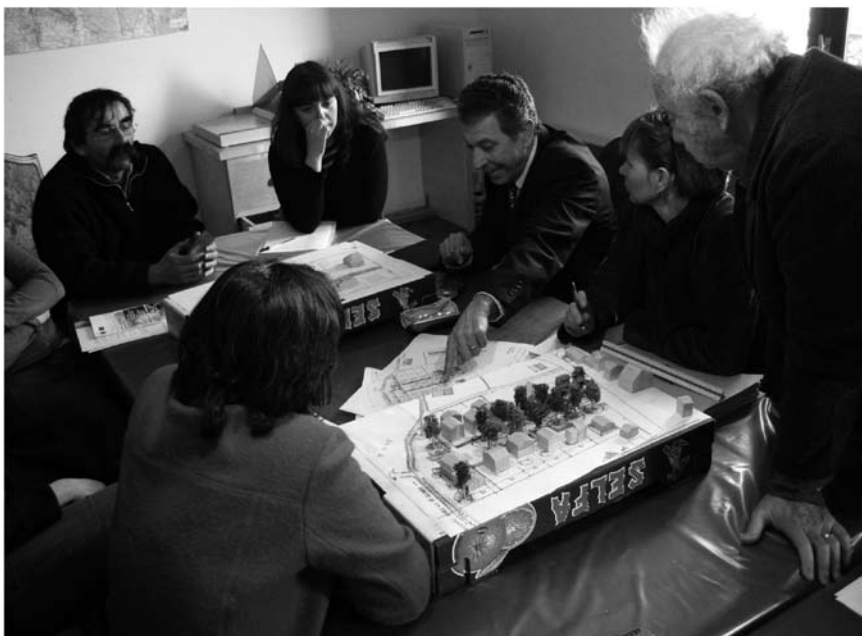
Imatge 3. Reunió entre un representant polític, el Consell d'Arquitectura, Urbanisme i Medi Ambient, el promotor i els habitants per a adaptar una urbanització al context i a la manera de viure locals.

Així doncs, aquesta carta és fruit de la reacció d'una part de la població i dels representants polítics de la zona davant de diverses iniciatives que consideraven que podien destruir inexorablement el paisatge i, per tal de garantir-ne la conservació, van demanar el suport de l'Estat. La carta del paisatge ha aconseguit que els habitants prenguin consciència de la fragilitat de la zona i del valor que té. A més, ha provocat una apropiació comunitària del lloc, que de vegades ha desembocat en discussions agitades, però també constructives, sobre el futur d'aquesta regió. Les administracions, per la seva banda, han pres consciència dels impactes a què està exposat el paisatge sense una adequada gestió. En aquest cas concret, el fet de rebre un milió de visitants en un espai no preparat per a aquest propòsit ni gestionat en aquest sentit havia ocasionat una progressiva pèrdua del seu valor original. Gràcies a la carta, les administracions locals han entès millor la relació existent entre paisatge i economia, i entre paisatge i benestar de la població. Es pot dir que la carta del paisatge ha permès crear un autèntic