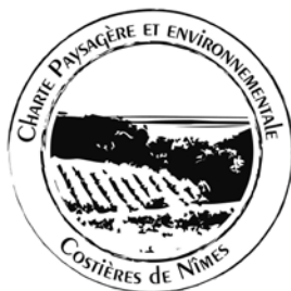
Imatge 4. Logotip de la Carta del paisatge de Costières de Nîmes.

laboradors (locals i nacionals). A més, es van crear materials de difusió de la carta (vegeu la imatge 4).