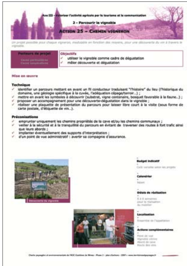
Imatge 5. Fitxa d'acció de la Carta del paisatge de Costières de Nîmes.

què adoptin un enfocament més transversal que tingui en compte el valor del paisatge. També és l'encarregat de construir les aliances necessàries per a desenvolupar les accions que recull la carta en funció de les prioritats fixades. L'any 2008 es va posar en marxa una primera sèrie d'accions: l'elaboració d'una guia sobre la construcció agrícola amb el Consell d'Arquitectura, Urbanisme i Medi Ambient de Gard adreçada al conjunt de representants polítics i agricultors amb l'objectiu de millorar la inserció d'aquestes construccions al paisatge de Costières de Nîmes; la creació de paquets d'enoturisme anomenats Vi i patrimoni i Vi i golf amb l'Oficina de Turisme de Nîmes; el registre d'espais i selecció de materials per a la