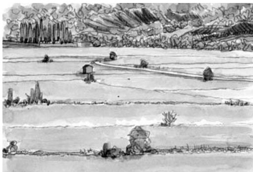
Imatges 1 i 2. A partir d'una fotografia de l'estat actual, els redactors de la carta imaginem una possible evolució del paisatge fent servir un sistema de representació accessible a tothom.