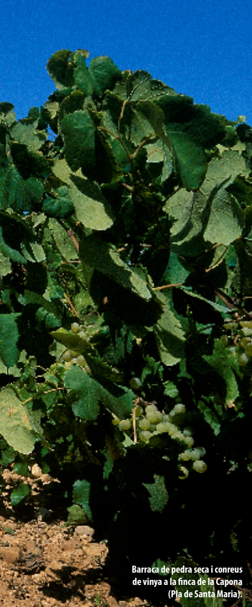
Barraca de pedra seca i conreus de vinya a la finca de la Capona (Pla de Santa Maria).