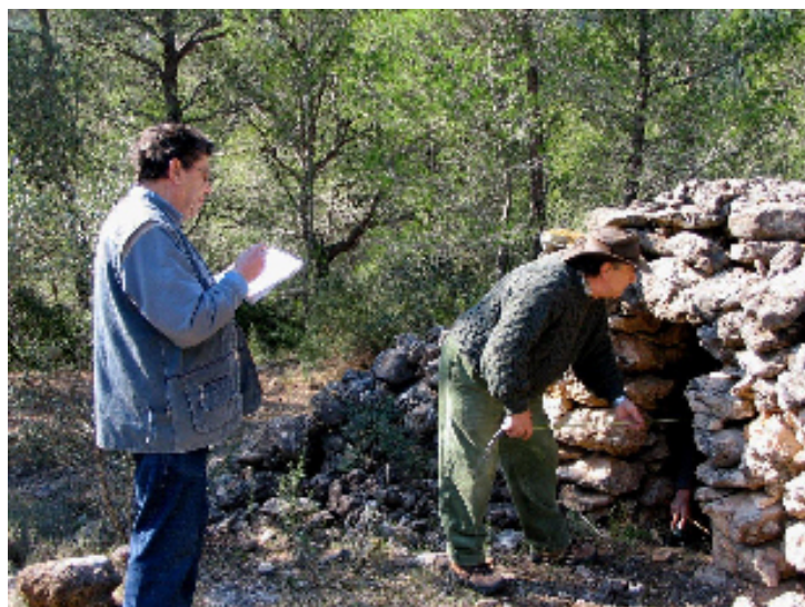
Imatge del portal Wikipedia. Membres del Grup Drac Verd de Sitges inventarien una barraca de pedra seca.