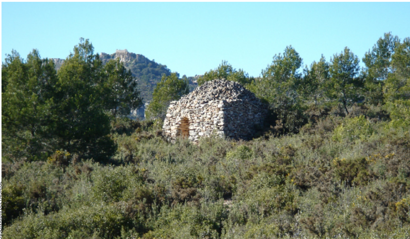
Antiga barraca d'agricultor a la unitat de l'Alt Gaià.

exemple, la bassa, un dipòsit rudimentari emplaçat a l'aire lliure i sense cobrir. Són de base plana circular amb paret lateral en pedra seca, tot i que en alguns casos (probablement més recents) la forma és quadrada o rectangular. El substrat de la base solia ser d'argila, material gairebé impermeable. Normalment tenien un accés interior mitjançant una escala. Les escales servien per anar a buscar el nivell de l'aigua quan aquest era més baix i per procedir a la periòdica neteja del fons, on anaven a parar la brutícia i les impureses que l'aigua hi arrossegava. Per evitar-hi l'entrada de bestioles, s'alçava la paret al voltant de la bassa i, en algun cas, es cobria amb falsa cúpula.