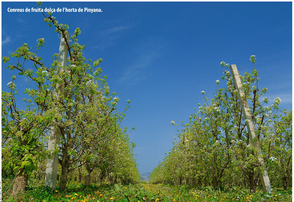
Conreus de fruita dolça de l'horta de Pinyana.

Actualment l'estructura del paisatge està condicionada per la morfologia parcel·laria basada en petites unitats agrícoles regades pel canal de Pinyana. El sistema