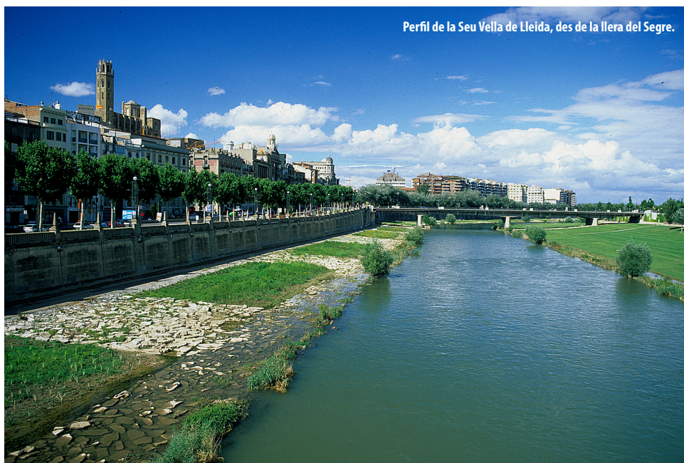
Perfil de la Seu Vella de Lleida, des de la llera del Segre.

DEPARTAMENT DE TERRITORI I SOSTENIBILITAT