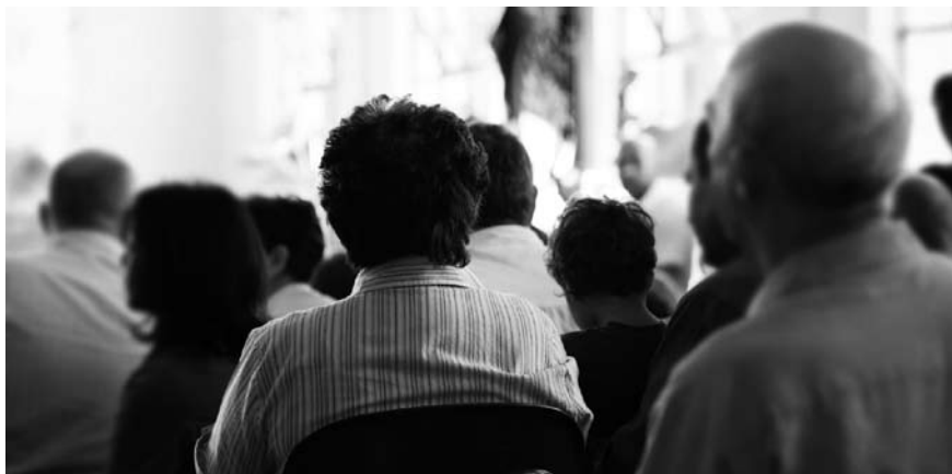
Imatge 1. La participació ciutadana és imprescindible en la definició dels objectius de qualitat paisatgística i de les estratègies d'intervenció.

L’agent o els agents que liderin el procés d’elaboració de la carta hauran d’elegir el model i els mitjans de participació tenint en compte els hàbits de consulta, les diverses organitzacions administratives, les característiques de les diferents realitats territorials, les tipologies d’instruments operatius, les escales d’intervenció i l’experiència tant passada com present, així com el grau de cultura de cooperació i participació existent en el territori afectat per la carta del paisatge. En qualsevol cas, la participació ha d’anar adreçada a tots els agents implicats: administracions públiques, població en general, societat civil organitzada (associacions, entitats i fundacions), agents econòmics, mitjans de comunicació, centres educatius i universitaris, així com als científics, artistes, professionals i tècnics més motivats pels aspectes territorials i del paisatge.