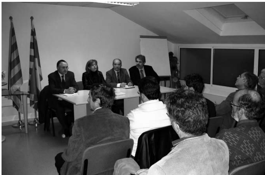
Imatge 4. Acte de signatura de la Carta del paisatge del Berguedà.

els poders públics adopten el compromís d'establir les polítiques i les mesures concretes que permetin la millor protecció, gestió i ordenació dels paisatges de la comarca. I, finalment, que els agents privats que signen la carta adopten el compromís d'integració del paisatge en els seus respectius projectes i actuacions, implementant les mesures específiques per a la conservació dels paisatges del Berguedà.