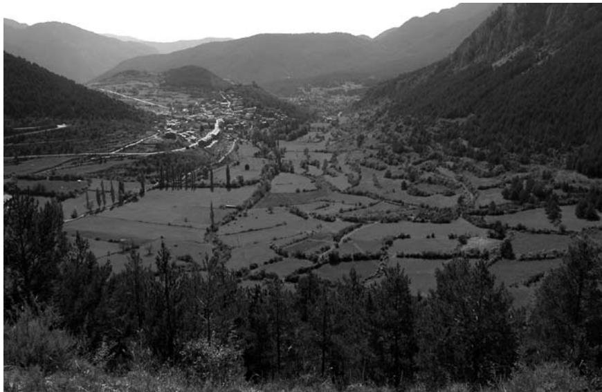
Imatge 6. Una de les línies d'actuació que estableix la Carta del paisatge del Berguedà és la implantació d'una xarxa de miradors del paisatge vinculats a les carreteres i vies locals.

paisatgística dels contenidors en els nuclis urbans i rurals; la implantació d'una xarxa de miradors del paisatge vinculats a les carreteres i vies locals del Berguedà; la realització d'actuacions paisatgístiques de millora als accessos urbans mitjançant avingudes arbrades, i l'elaboració d'una guia de recomanacions per a la integració paisatgística dels establiments de turisme rural i els càmpings, entre d'altres.