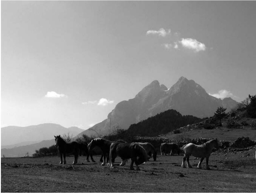
Imatge 5. Paisatge de muntanya a l'Alt Berguedà.