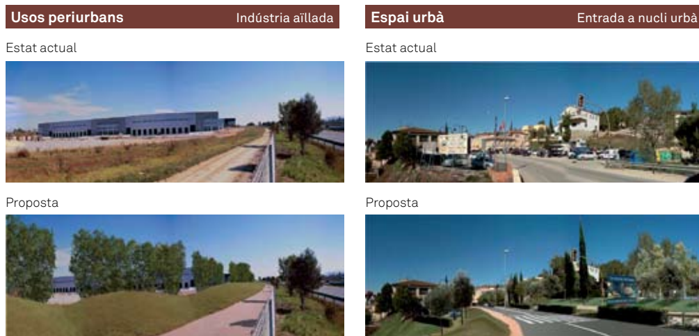
Imatge 3. Catàleg de propostes de restauració i millora del paisatge: integració paisatgística dels polígons industrials i de les entrades a nuclis urbans de la Carta del paisatge de l'Alt Penedès.

sentit, el Consell Comarcal ha signat convenis de col·laboració amb vuit ajuntaments de la comarca per a executar projectes d'integració paisatgística dins del programa de desenvolupament de la carta del paisatge. Les actuacions s'han previst en espais característics dels municipis escollits, les entrades als nuclis de població i determinades zones de lleure tradicionals.