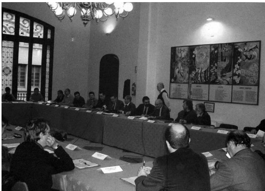
Imatge 2. Acte de signatura de la Carta del paisatge de l'Alt Penedès.

Pesca de la Generalitat de Catalunya, en el qual es va acordar redactar una carta del paisatge 2 .