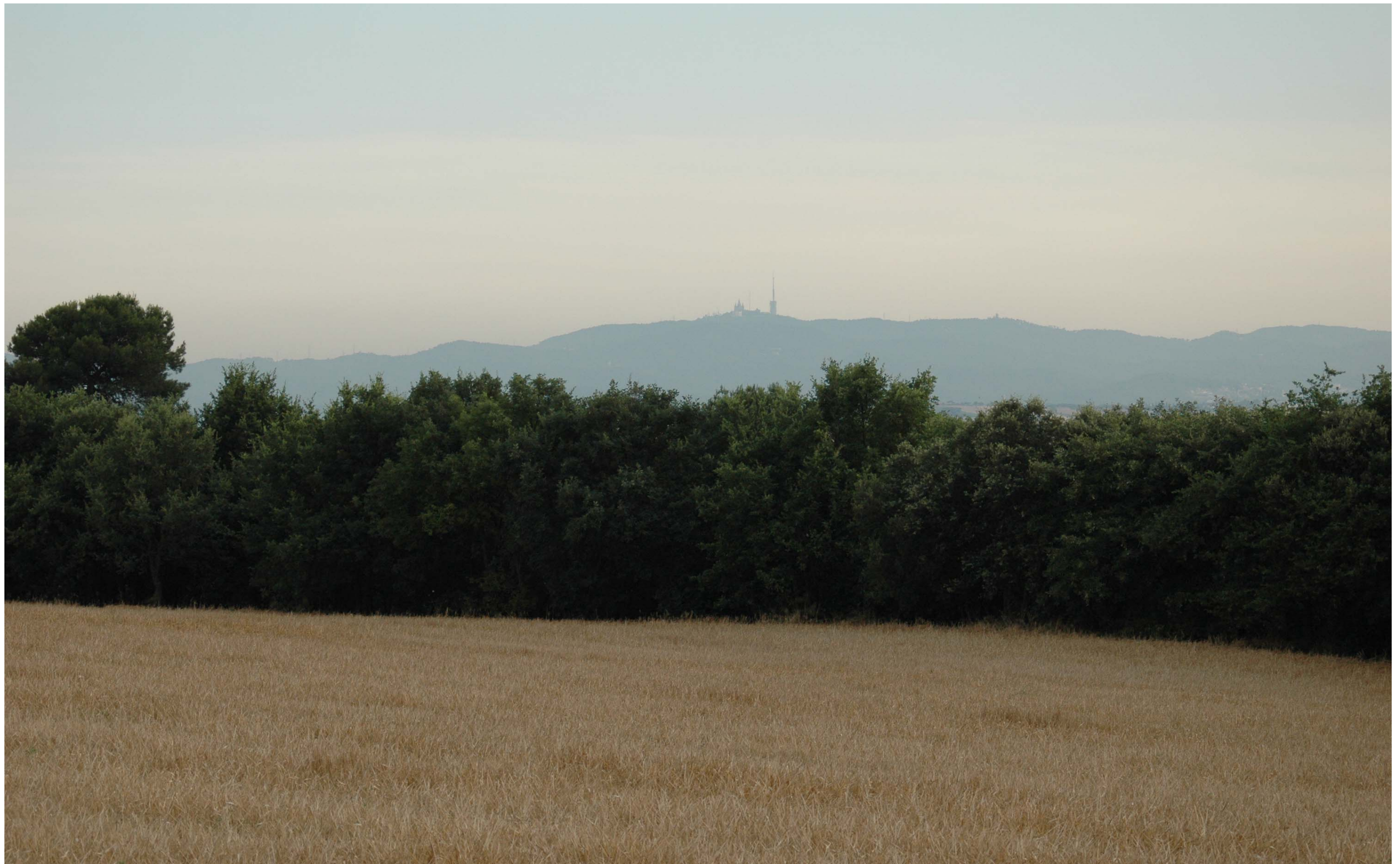
Figura 13.7: El fons escènic de la serra de Collserola, amb les fites del Tibidabo i la torre de Collserola, és visible des de molts indrets de la Regió Metropolitana de Barcelona.