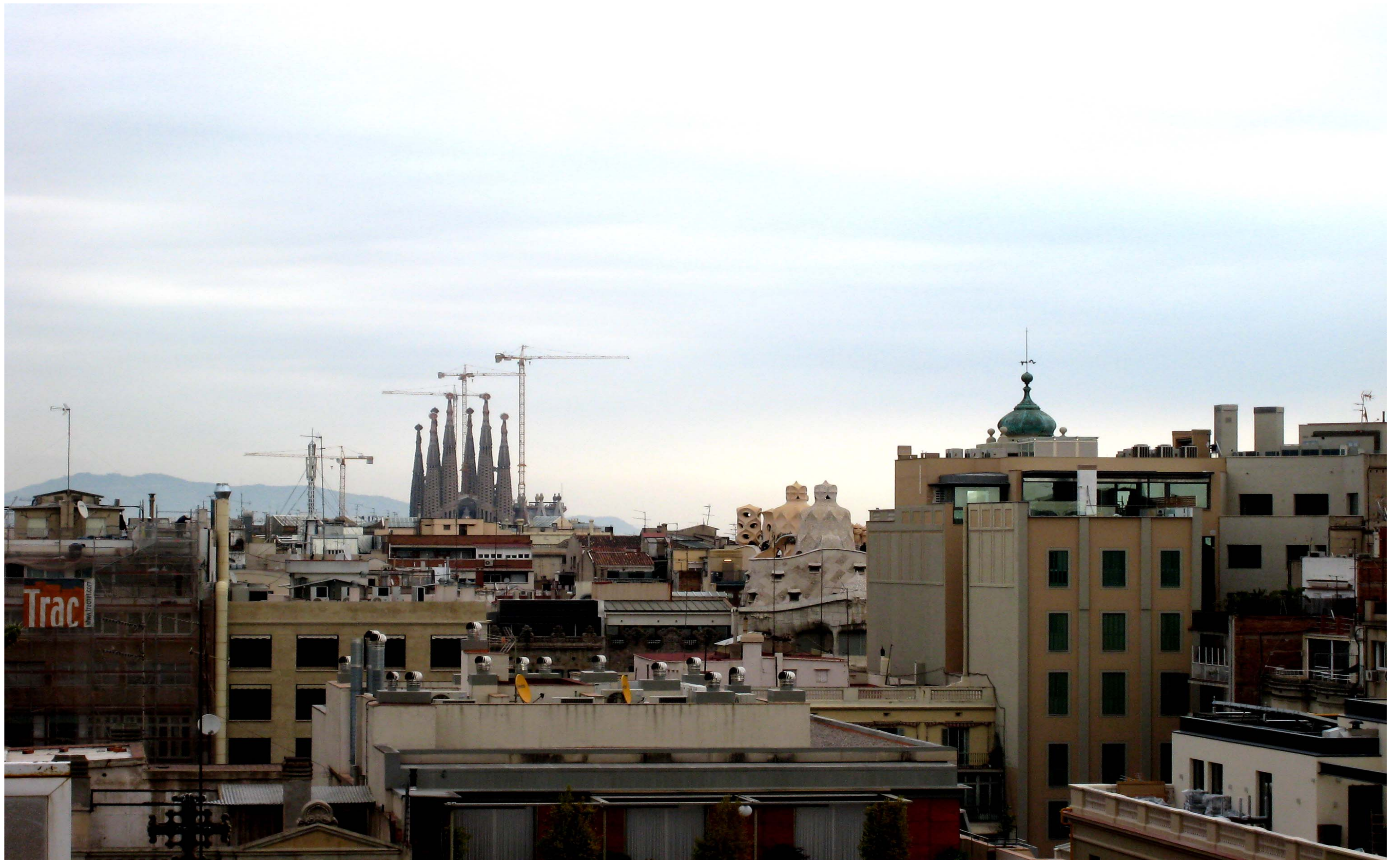
Figura 13.8: El paisatge urbà de Barcelona comprèn elements de gran valor patrimonial i simbòlic en una trama urbana de gran densitat.