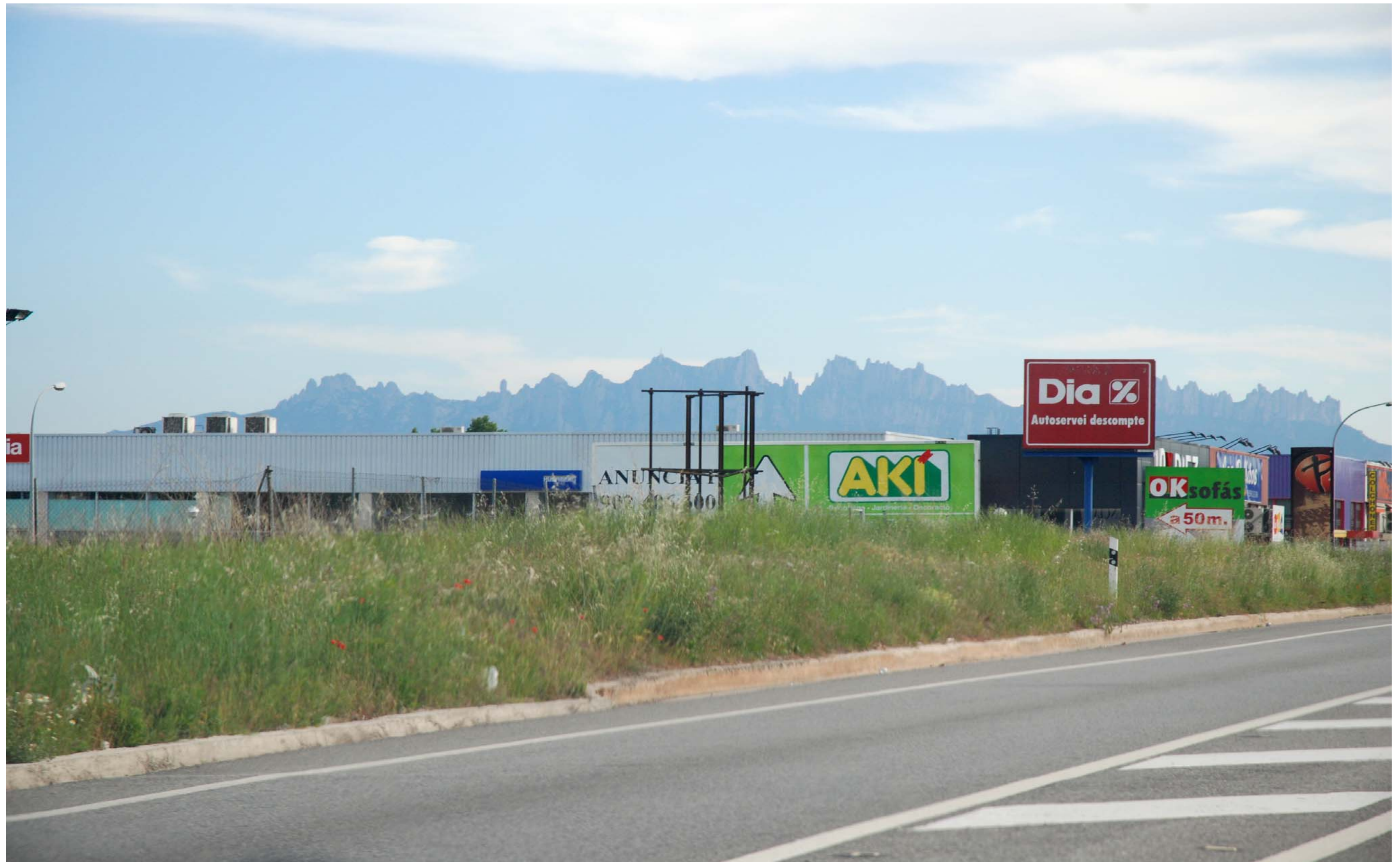
Figura 13.10: Els polígons industrials sovint van acompanyats d'una gran quantitat de rètols publicitaris que contribueixen a donar una imatge poc ordenada i sense tenir en compte el paisatge preexistent.