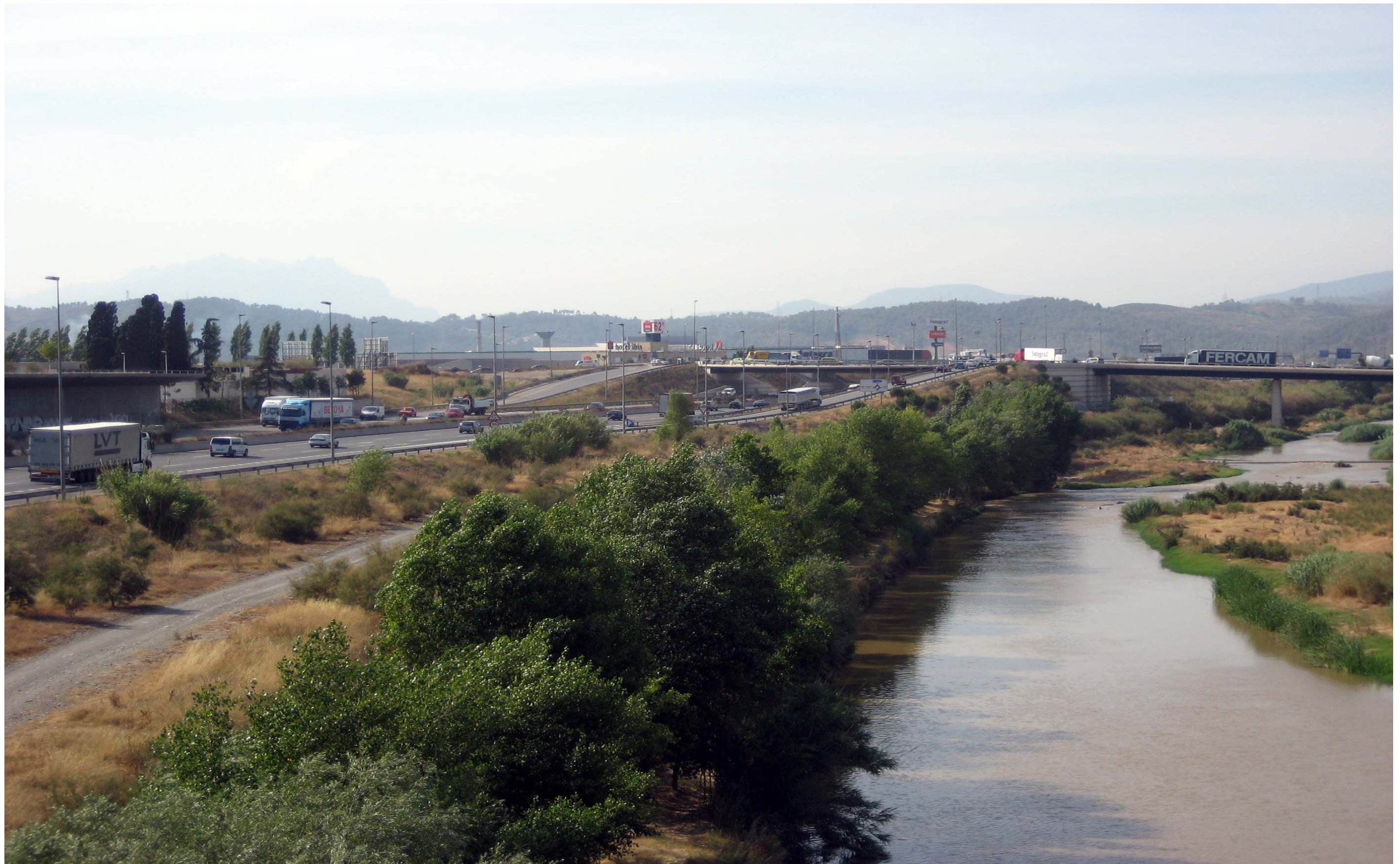
Figura 13.4: El riu Llobregat rep una gran pressió per part de les infraestructures, especialment viàries, ja que és un dels principals eixos d'accés a la ciutat de Barcelona.