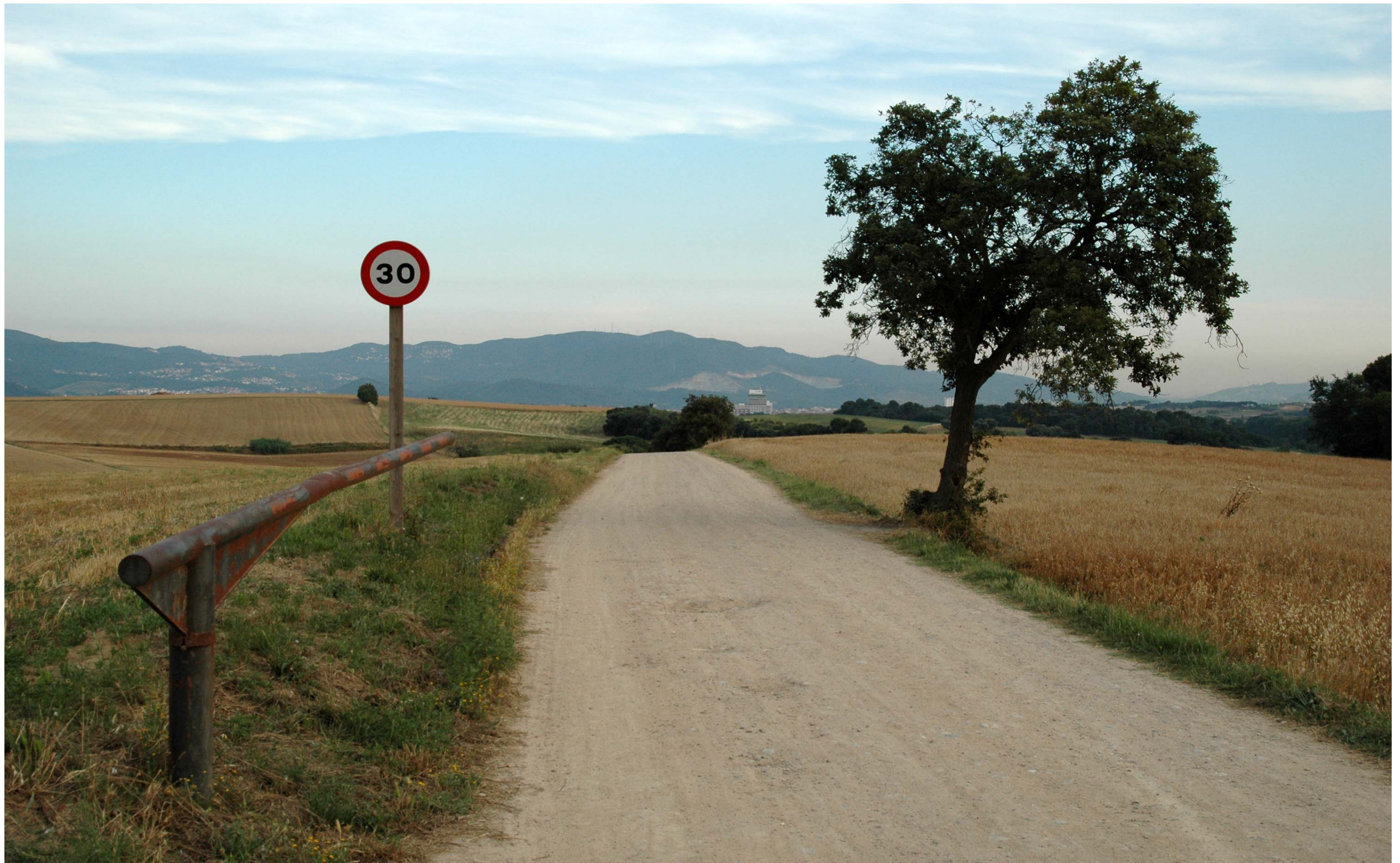
Figura 13.2: L'espai agrari de Gallecs compagina els valors productius amb els socials, els identitaris i els naturals.