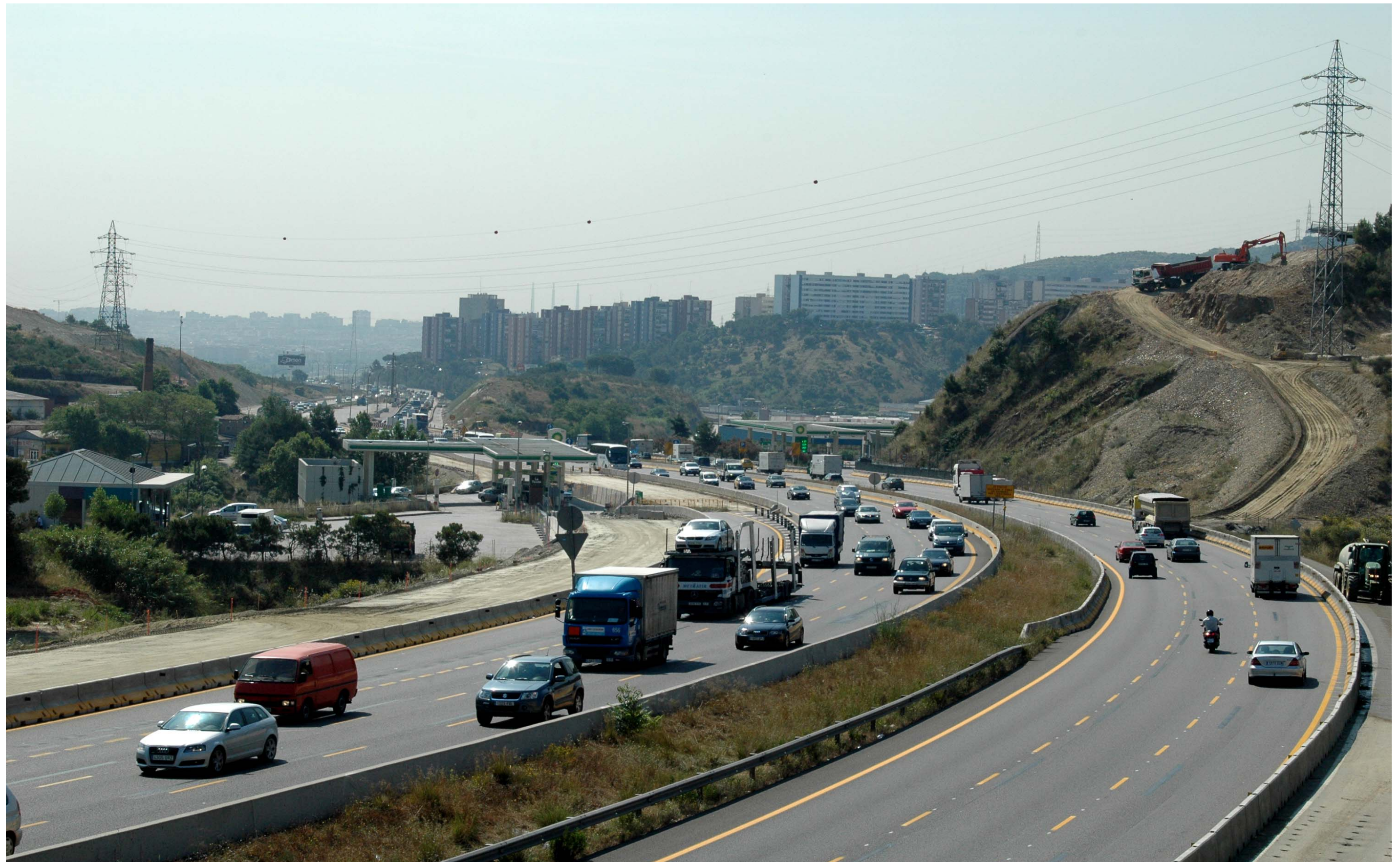
Figura 13.5: L'accés a Barcelona pel congost de Montcada és un dels espais on hi ha una concentració més elevada d'infraestructures de la Regió Metropolitana de Barcelona.