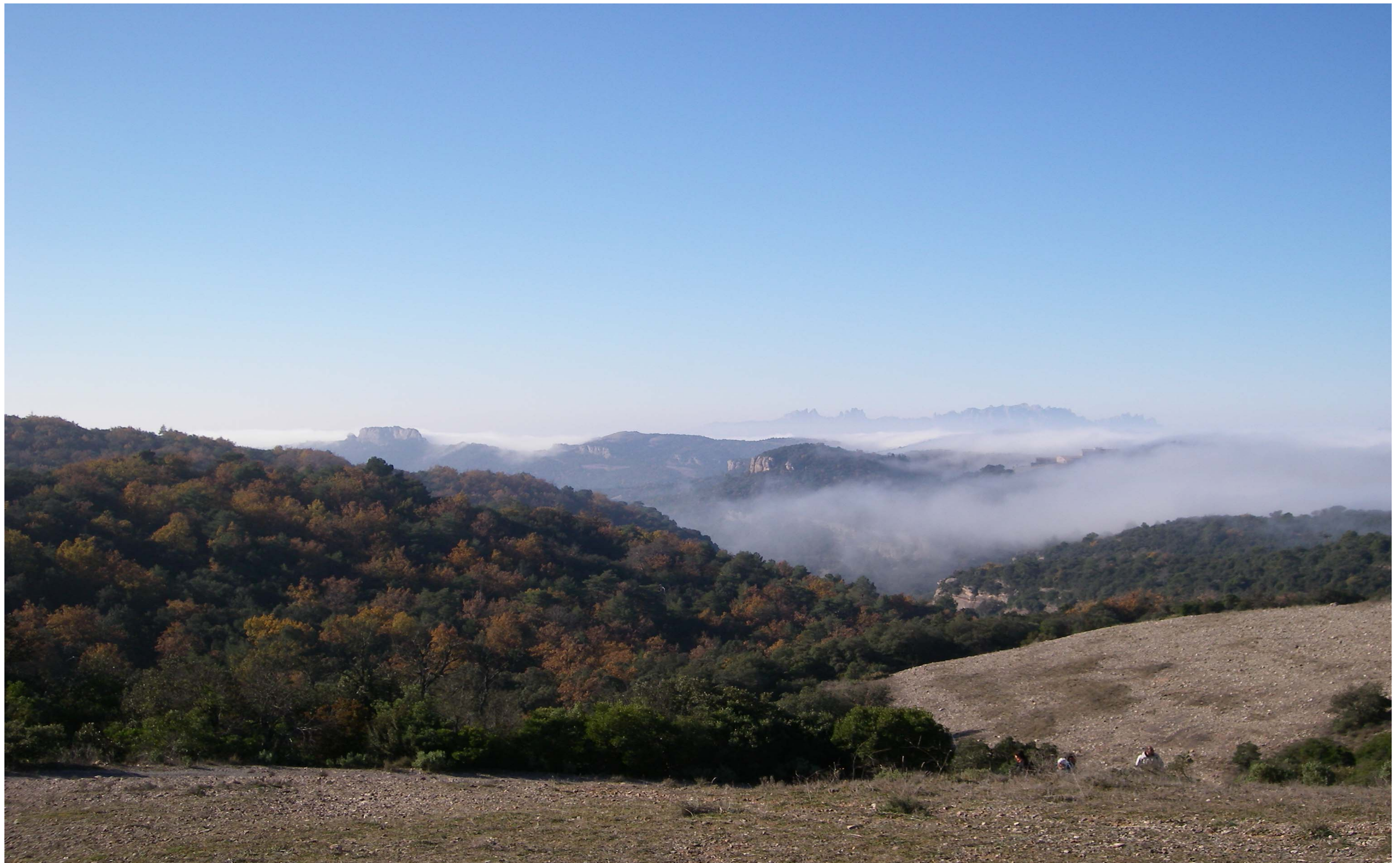
Figura 13.3: Parc natural de Sant Llorenç del Munt i l'Obac. Al fons, Montserrat.