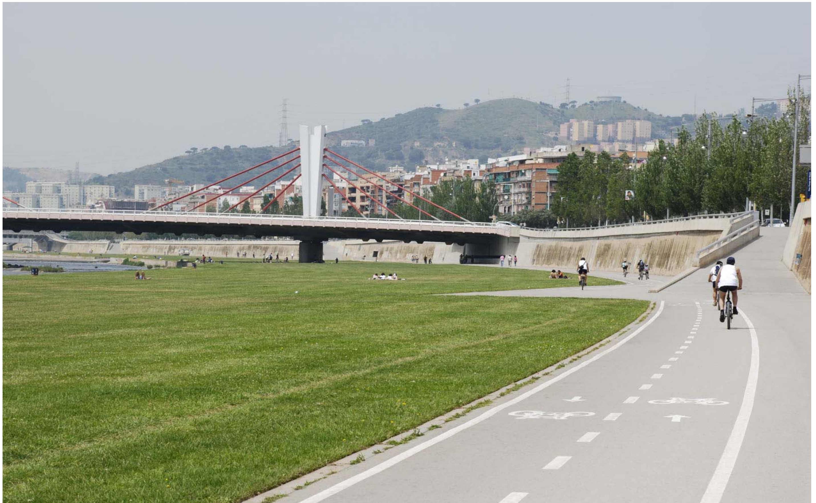
Figura 13.6: El parc fluvial del Besòs és un dels exemples de recuperació d'espais degradats i habilitats per al gaudi i ús social.