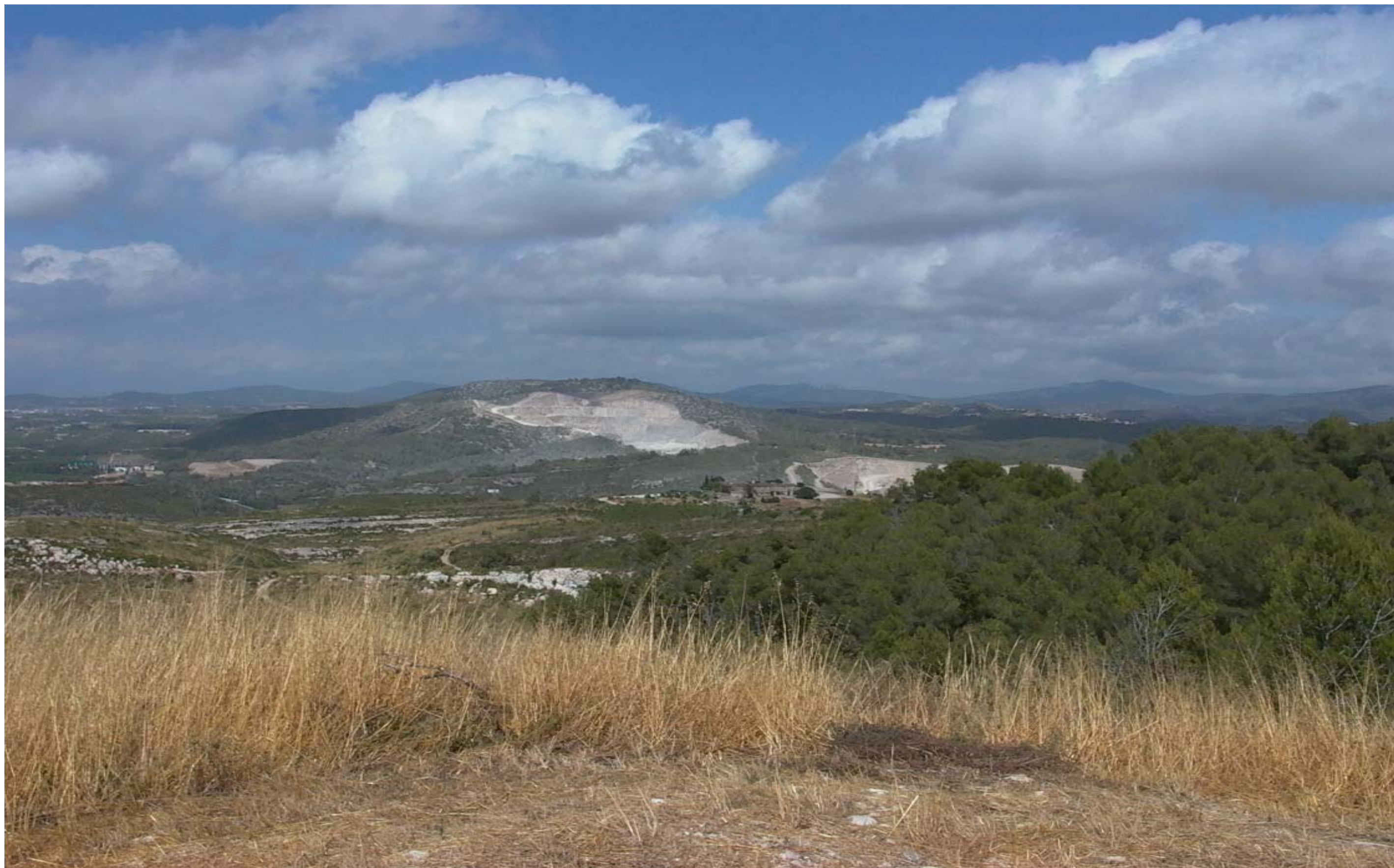
Figura 13.12: El Garraf és una de les zones on hi ha una major concentració d'activitats extractives.