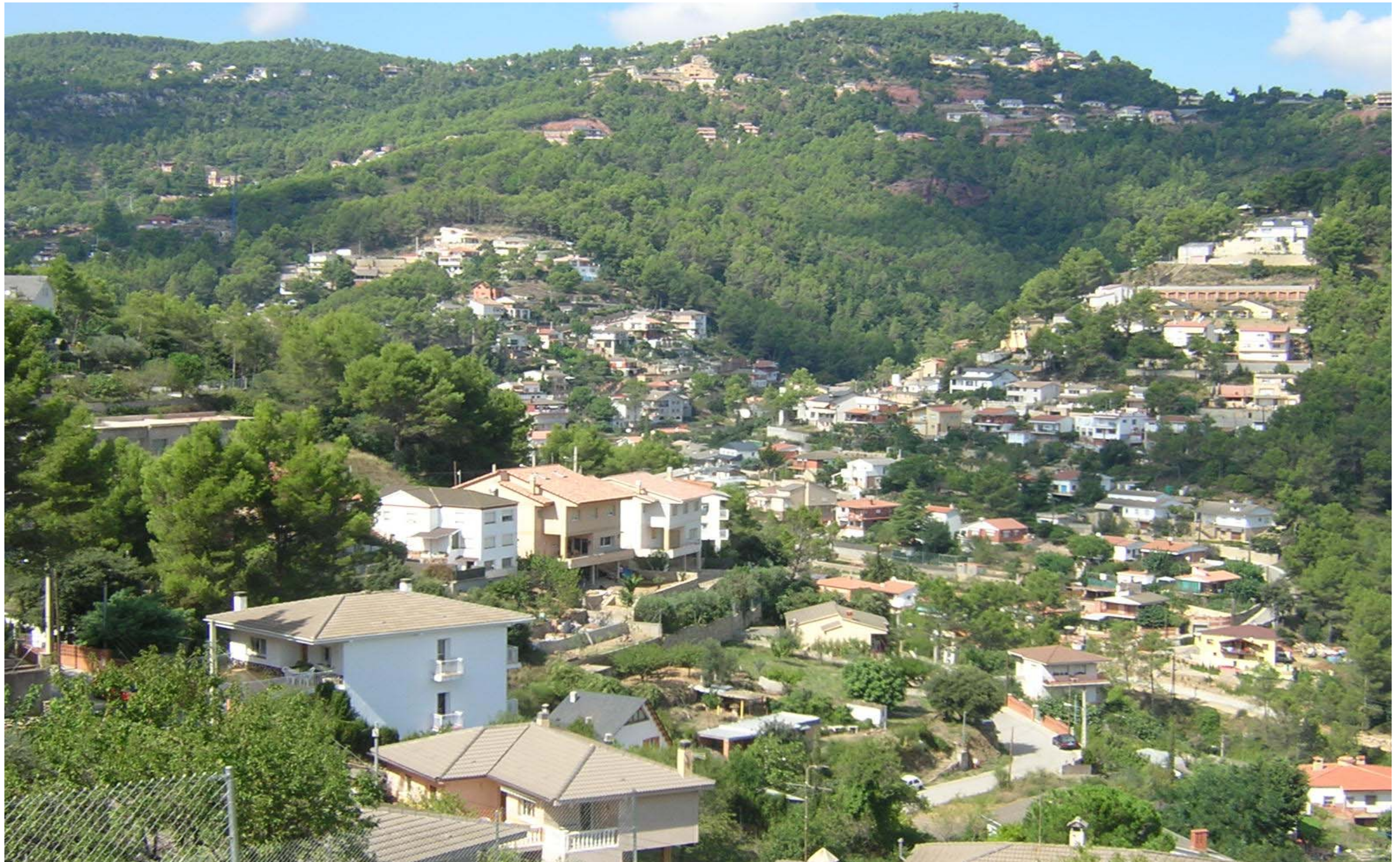
Figura 13.9: Les muntanyes d'Ordal són un dels espais on hi ha una gran quantitat d'urbanitzacions de baixa densitat.