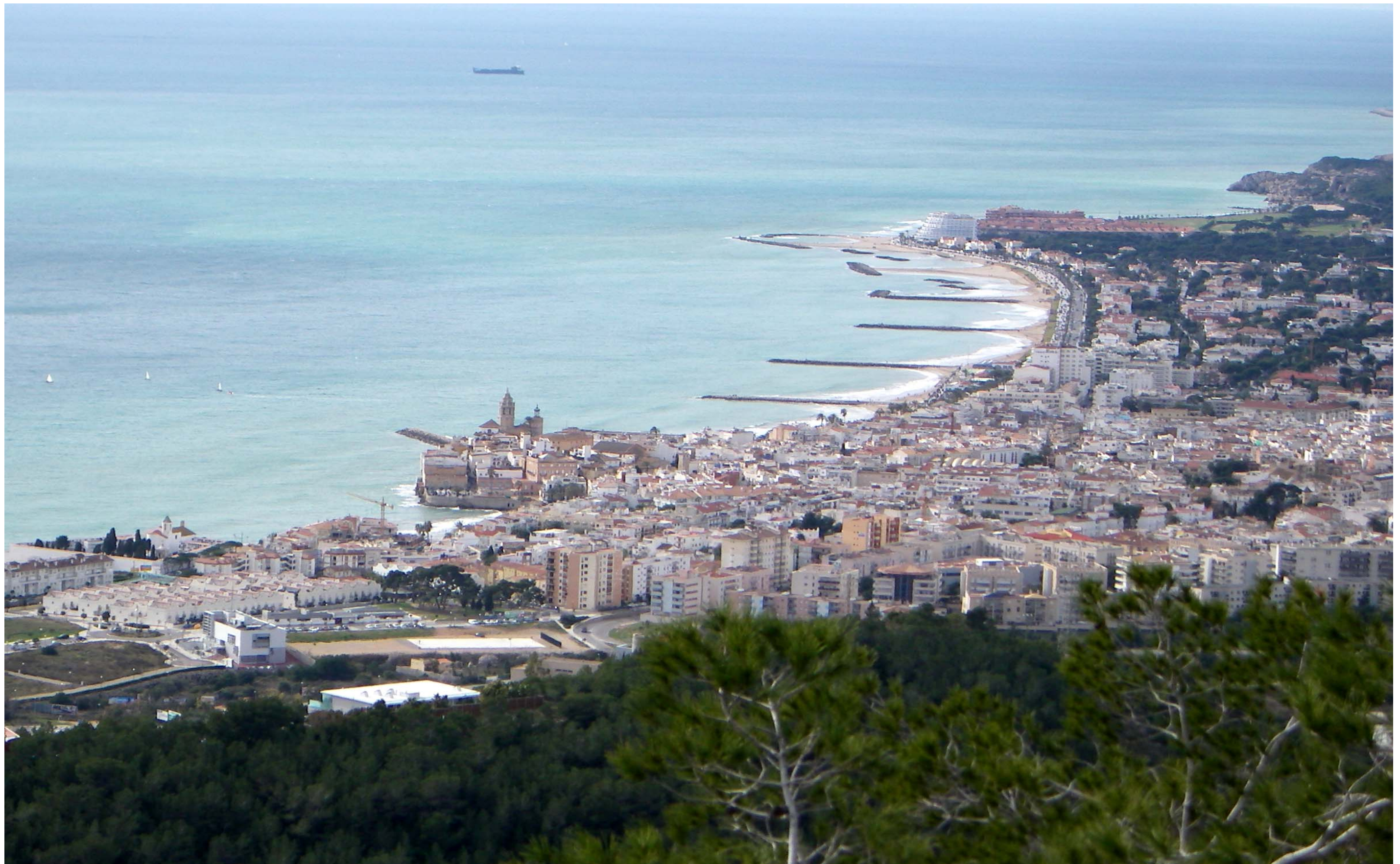
Figura 13.11: La façana litoral de Sitges, amb l'església de Sant Bartomeu i Santa Tecla és un indret característic del litoral metropolità.