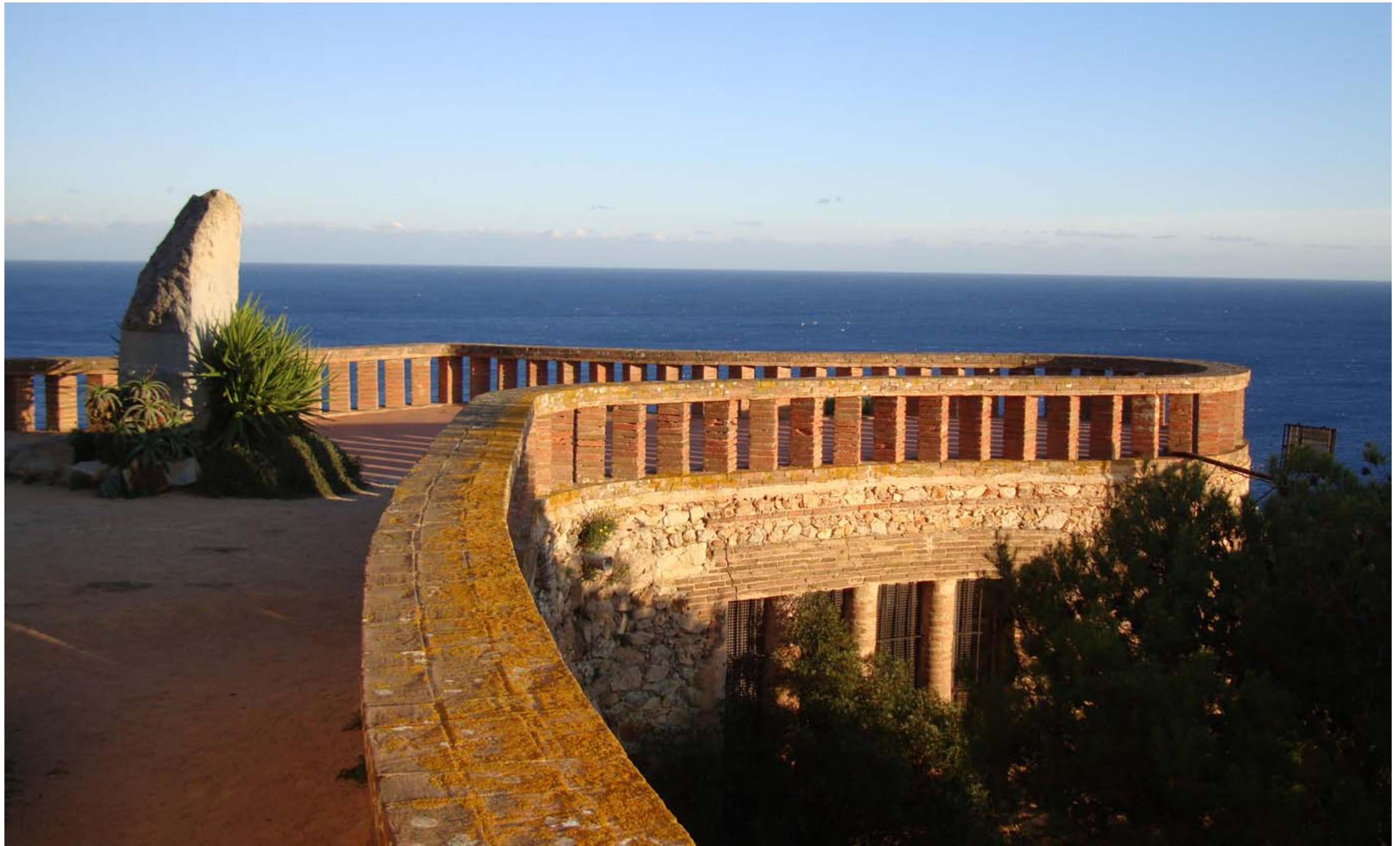
Figura 13.17. El mirador de Sant Elm, a Sant Feliu de Guíxols, és un dels més reconeguts per la població de les Comarques Gironines, i gaudeix de grans perspectives del litoral gironí.