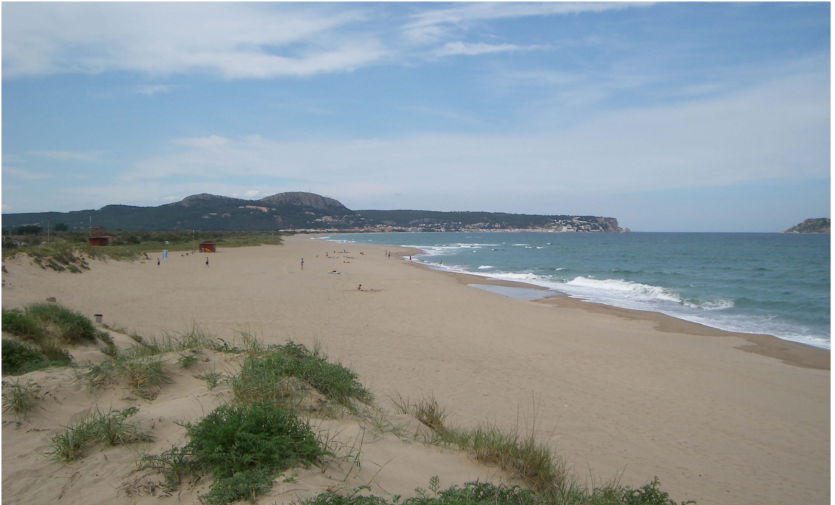
Figura 13.12. Les dunes del baix Ter són un dels relictos dels grans espais dunars que històricament hi havia al litoral de les Comarques Gironines.