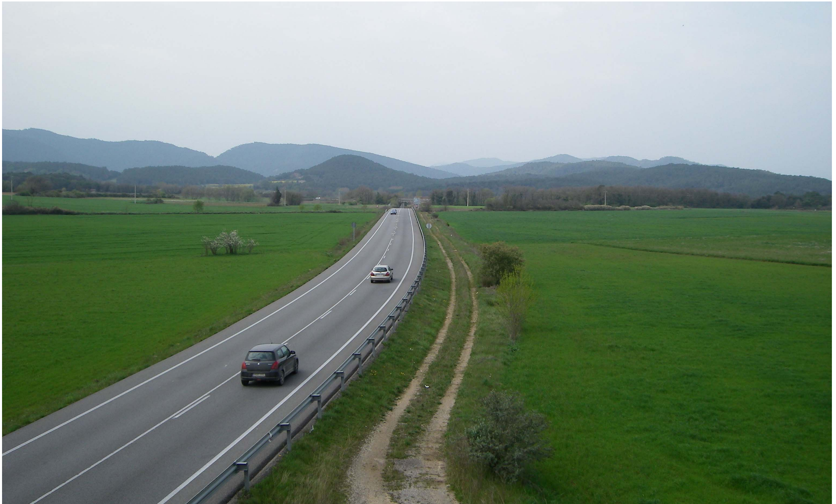
Figura 13.4. La carretera C-66, al seu pas pel pla d'Usall, presenta un entorn ordenat caracteritzat pels camps de conreu.