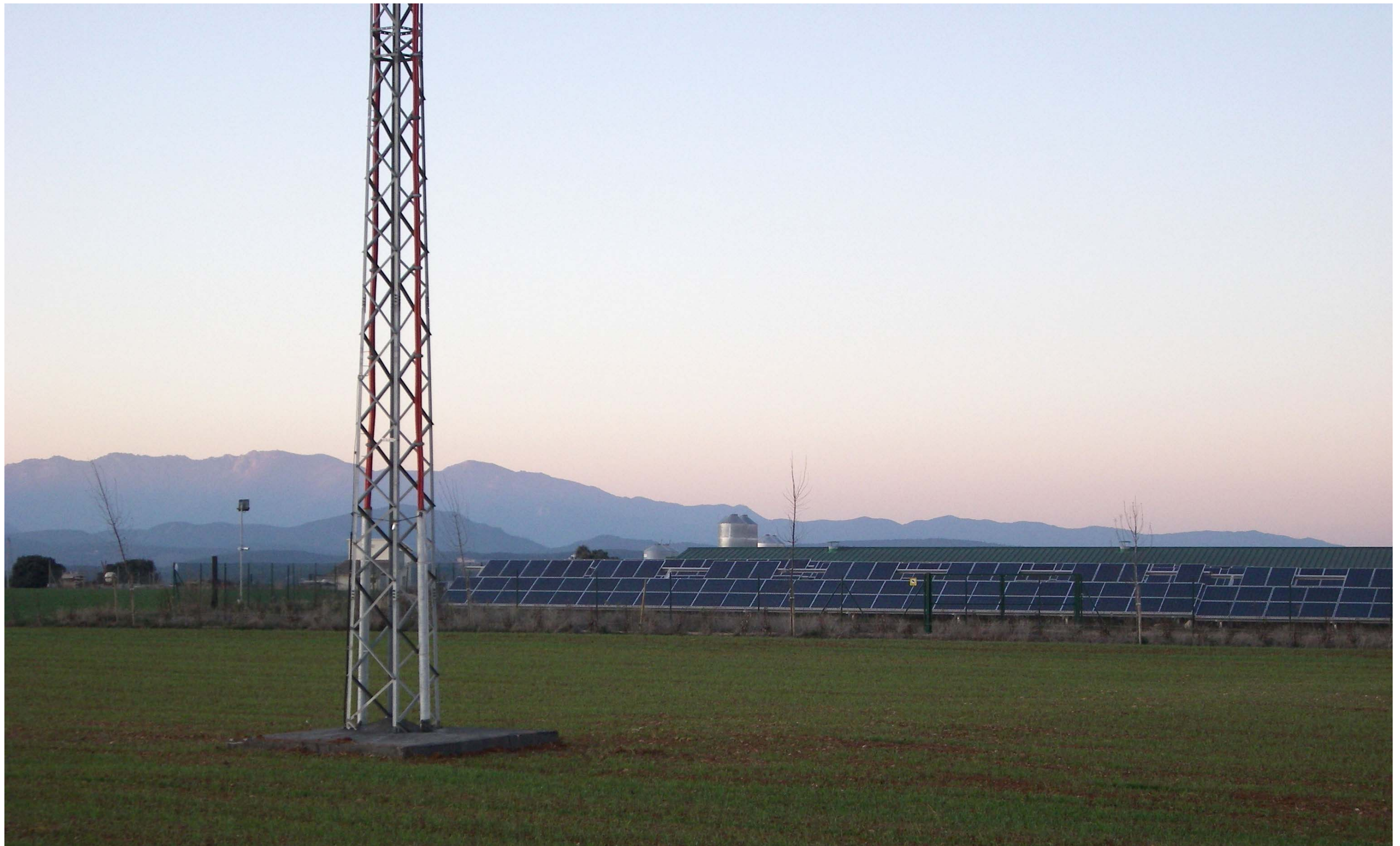
Figura 13.6. El parc fotovoltaic del municipi d'Ordis se situa annexat a unes construccions dedicades a l'explotació ramadera.