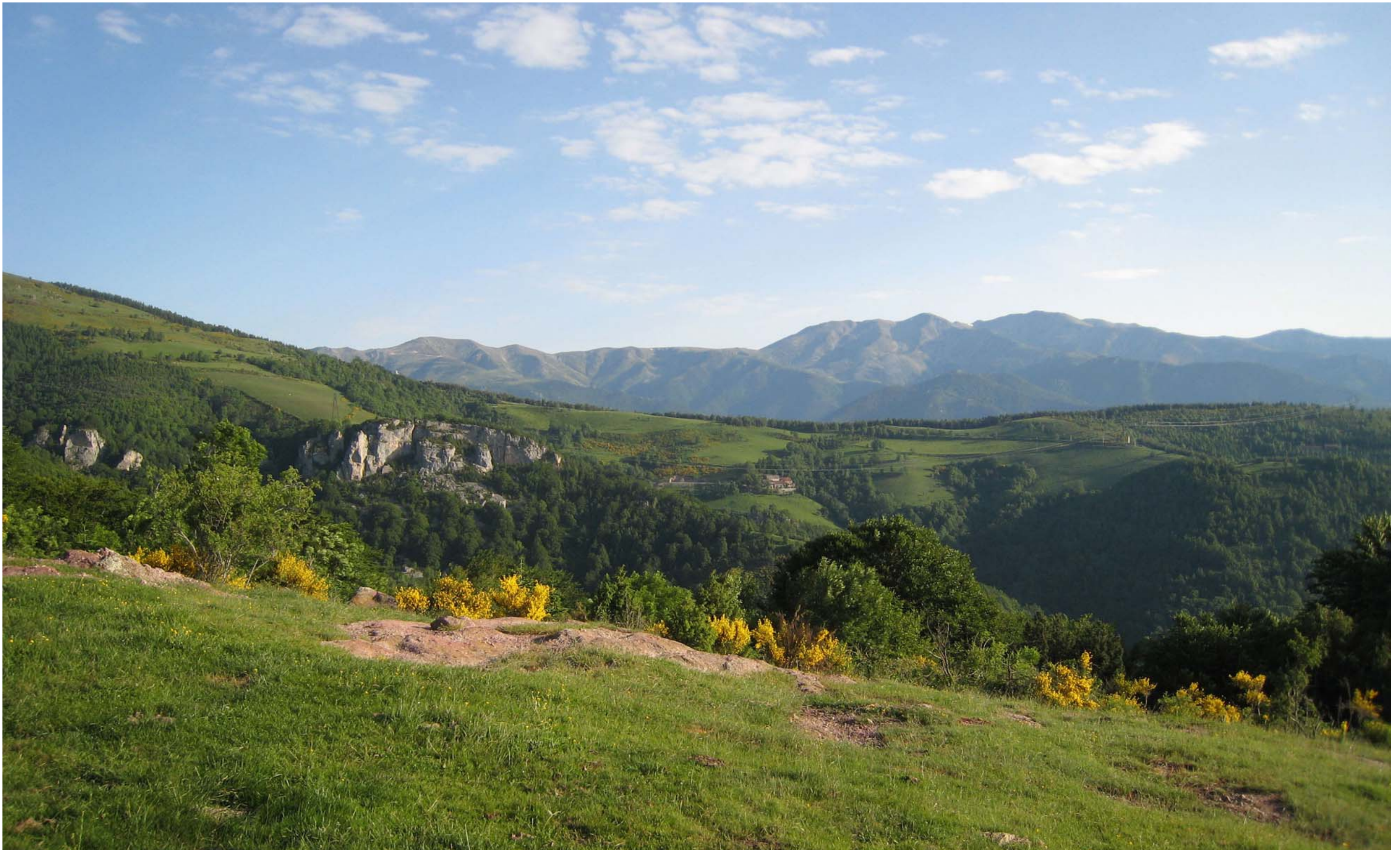
Figura 13.14. Els paisatges naturals, a part del seu contrast cromàtic, especialment a la tardor, tenen un gran valor social.