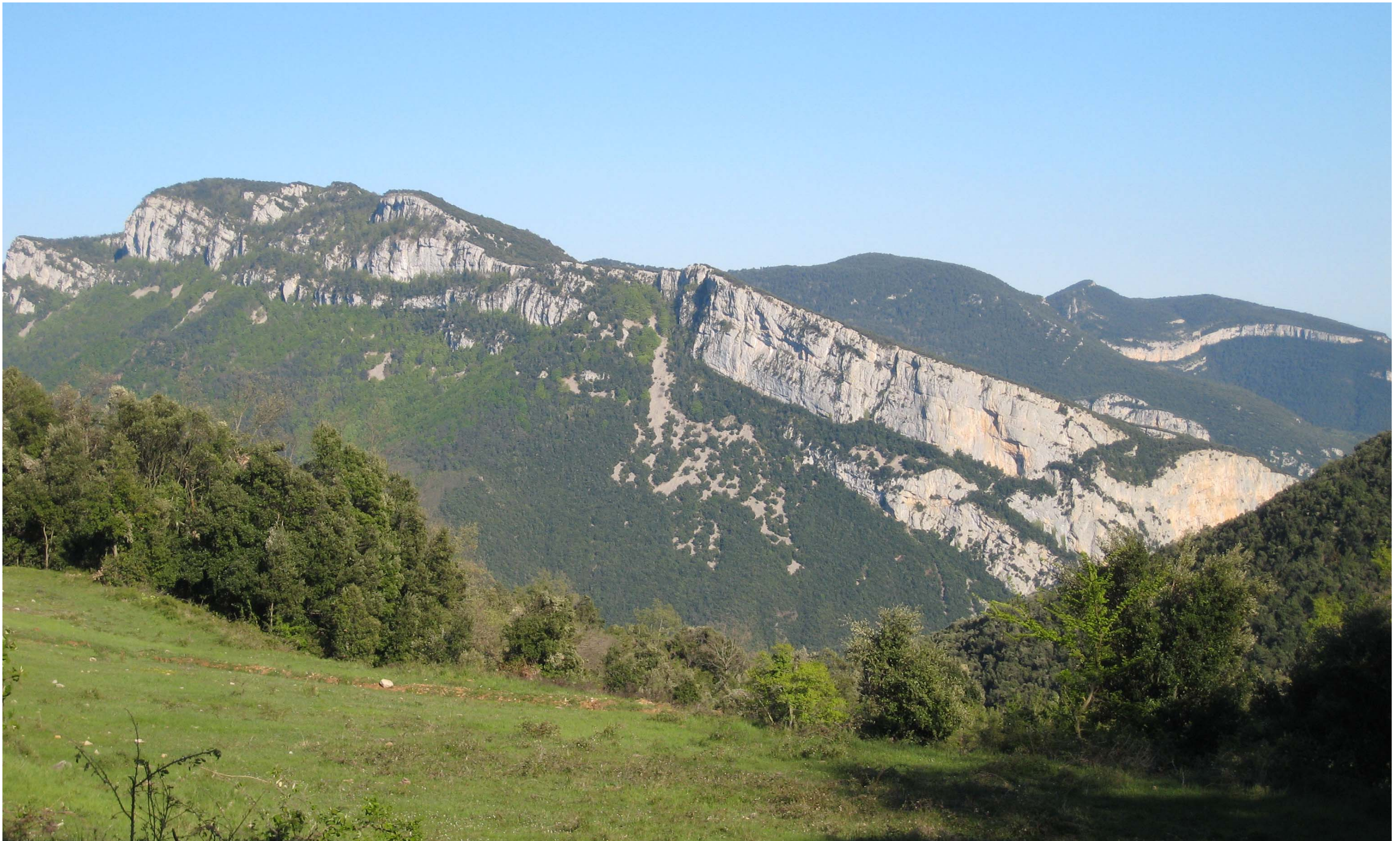
Figura 13.16. L'Alta Garrotxa és un dels espais de les Comarques Gironines on les formacions geomorfològiques prenen més força i espectacularitat.