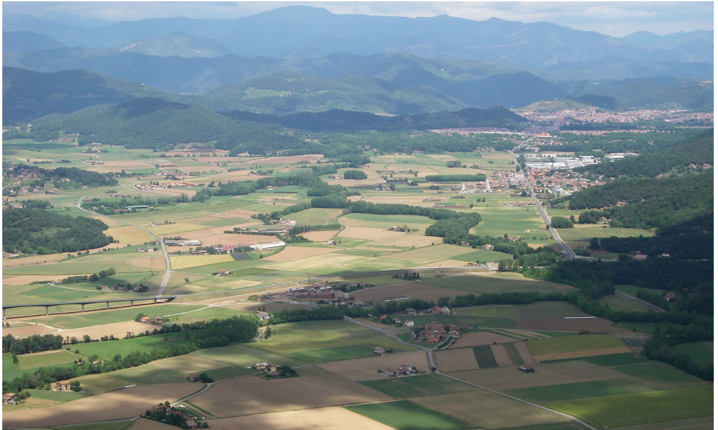
Figura 13.15. El paisatge agrícola de la vall d'en Bas, estructurat pel riu Fluvià i una trama viària capil·lar, té un gran valor històric, estètic i productiu que cal conservar.