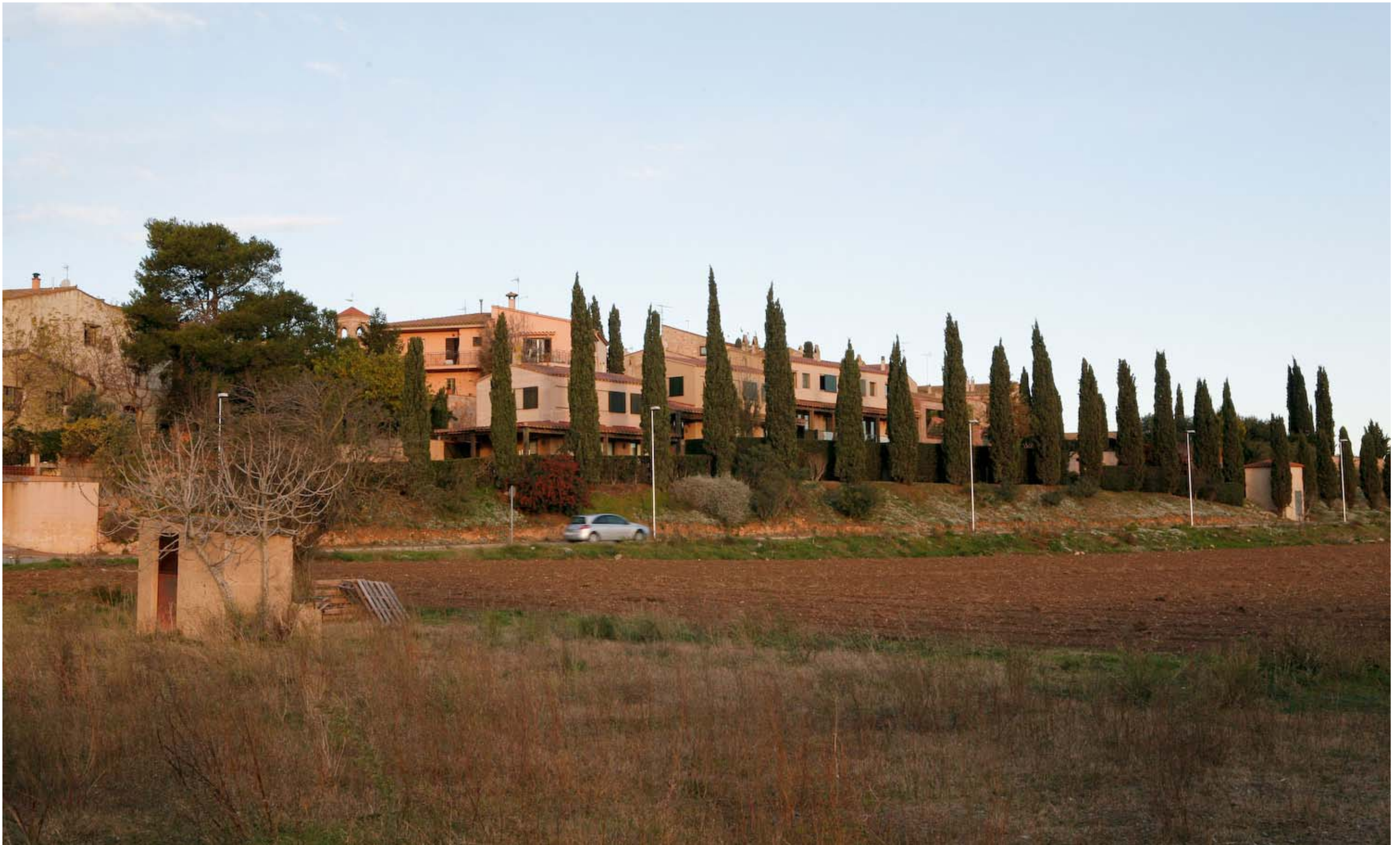
Figura 13.11. Les urbanitzacions construïdes tenint en compte el paisatge preexistent i utilitzant criteris d'integració paisatgística poden contribuir a donar caràcter al paisatge.