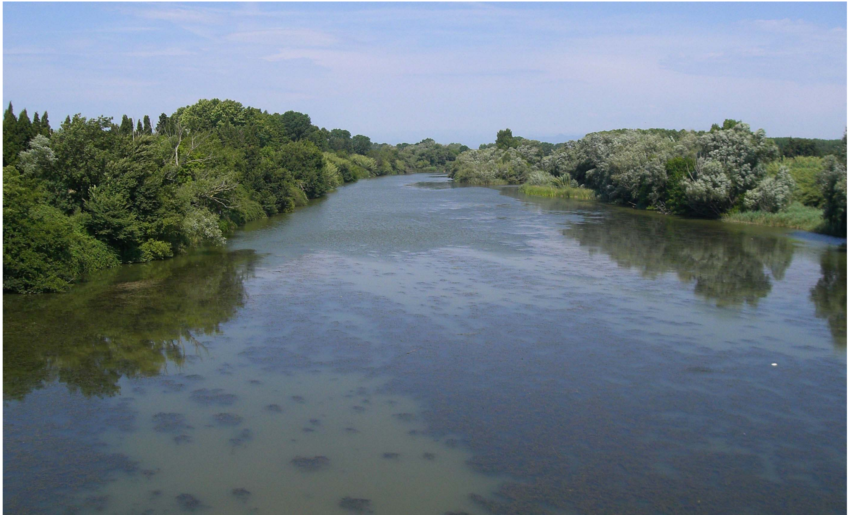
Figura 13.9. Paisatge fluvial del tram baix del Ter, a les proximitats de Torroella de Montgrí, on es pot observar un bosc de ribera en bon estat.