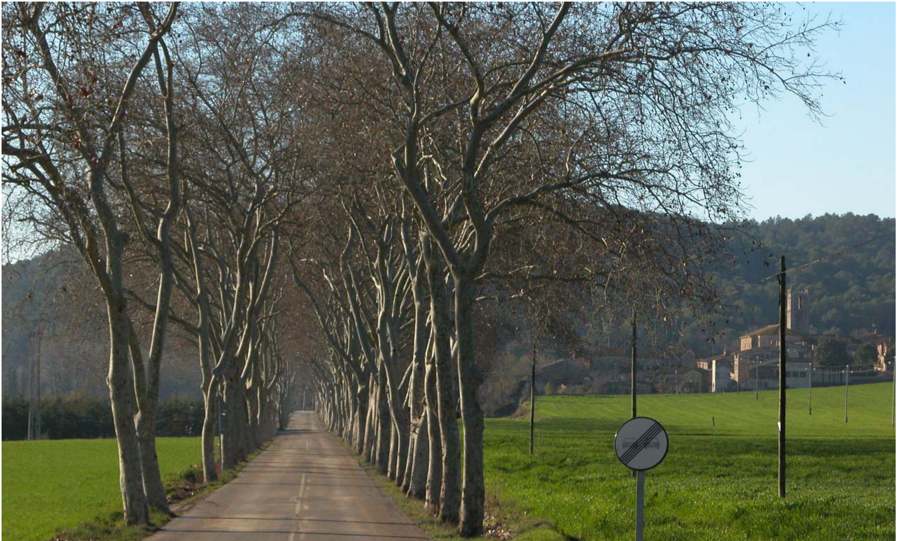
Figura 13.3. L'accés al petit nucli d'Orfes és un dels que encara conserva les fileres arbrades de plataners a banda i banda de la carretera.