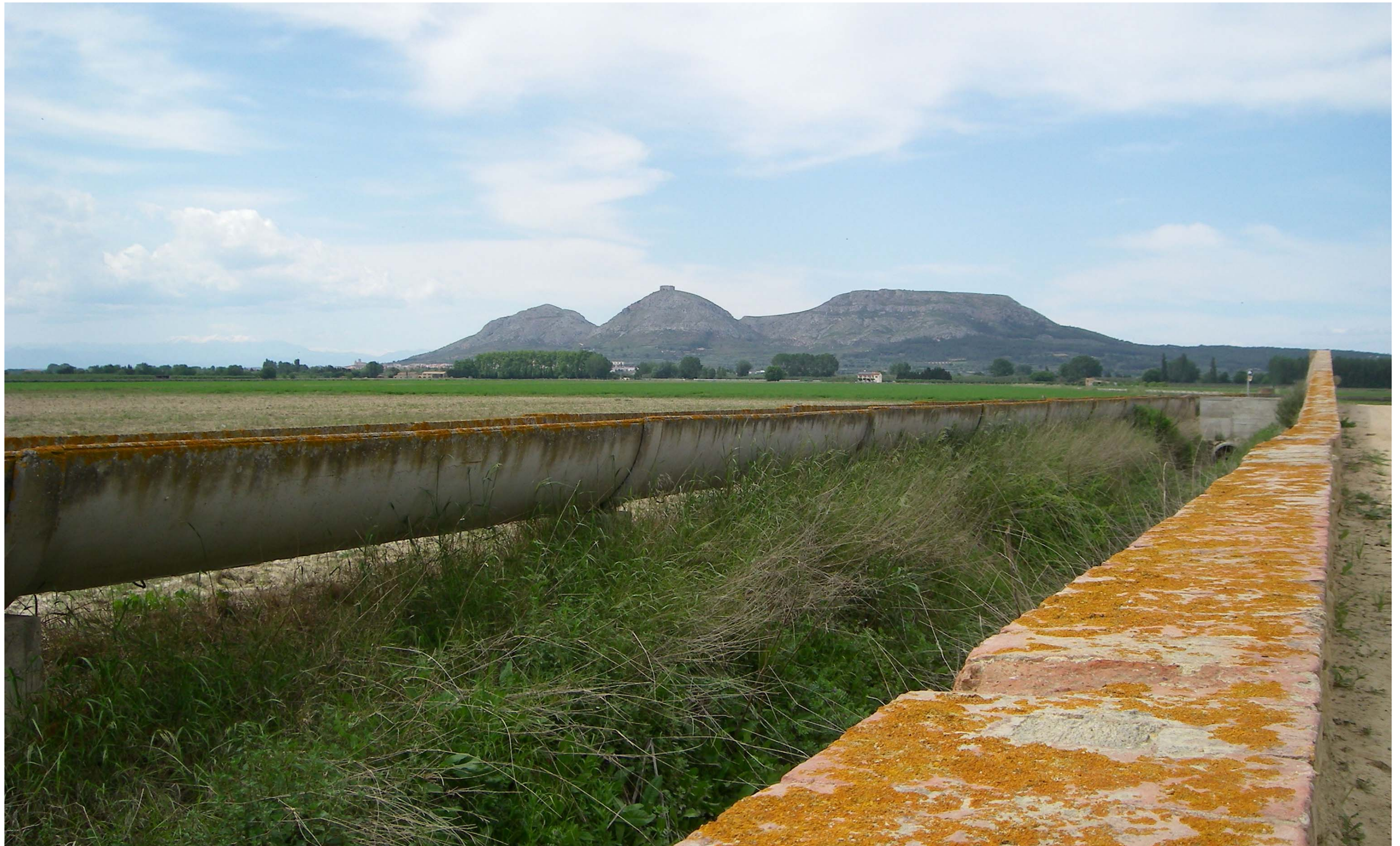
Figura 13.8. Els canals de reg són un dels elements que configuren el paisatge de les planes i estructuraven les parcel·les de conreu.