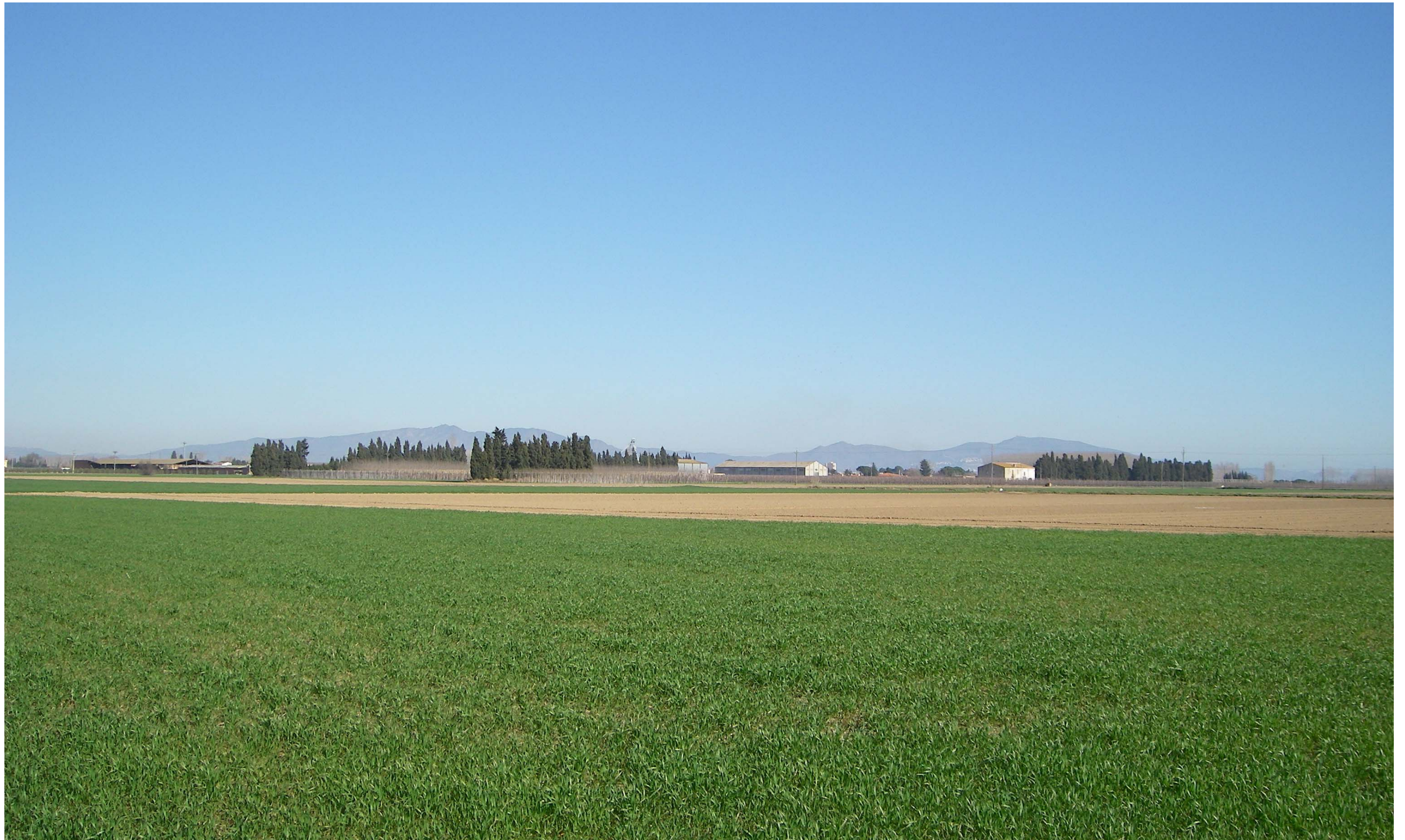
Figura 13.7. Els paravents de xiprers defineixen els camps visuals de les planes, principalment de l'Alt Empordà, i representen un gran valor estètic, simbòlic i històric d'aquest paisatge.