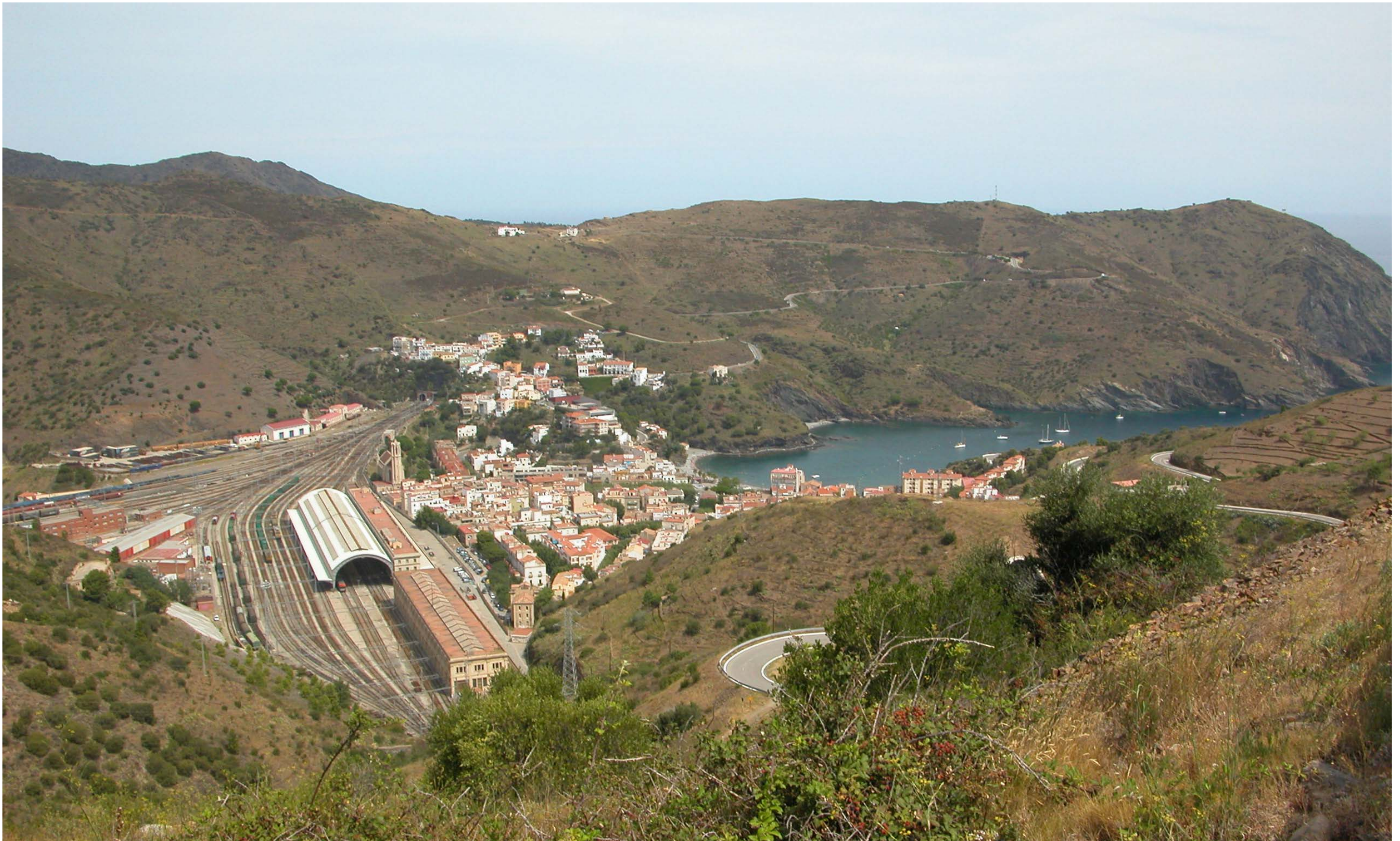
Figura 13.19. El litoral de Portbou, espai fronterer amb carreteres sinuoses, penya-segats pronunciats i vessants abancalats amb murs de pedra seca, entre d'altres valors, és una porta d'entrada excel·lent al litoral gironí pel nord.