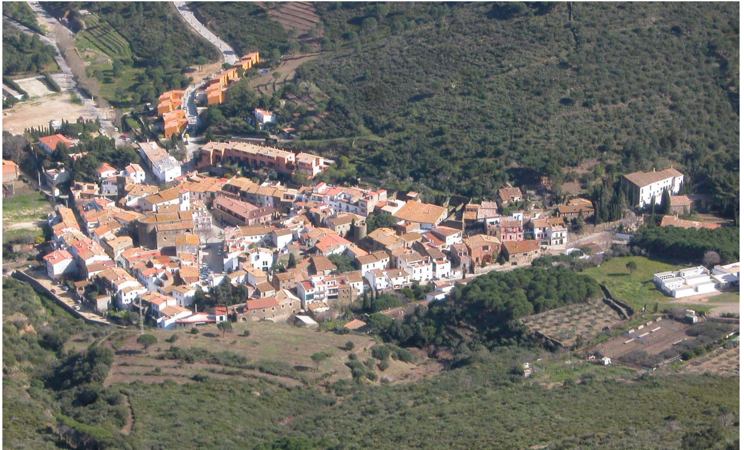
Figura 13.2. La Selva de Mar, un dels pobles amb una fesomia singular que identifica el Catàleg, té uns límits clars entre el sòl urbà i l'entorn agroforestal .