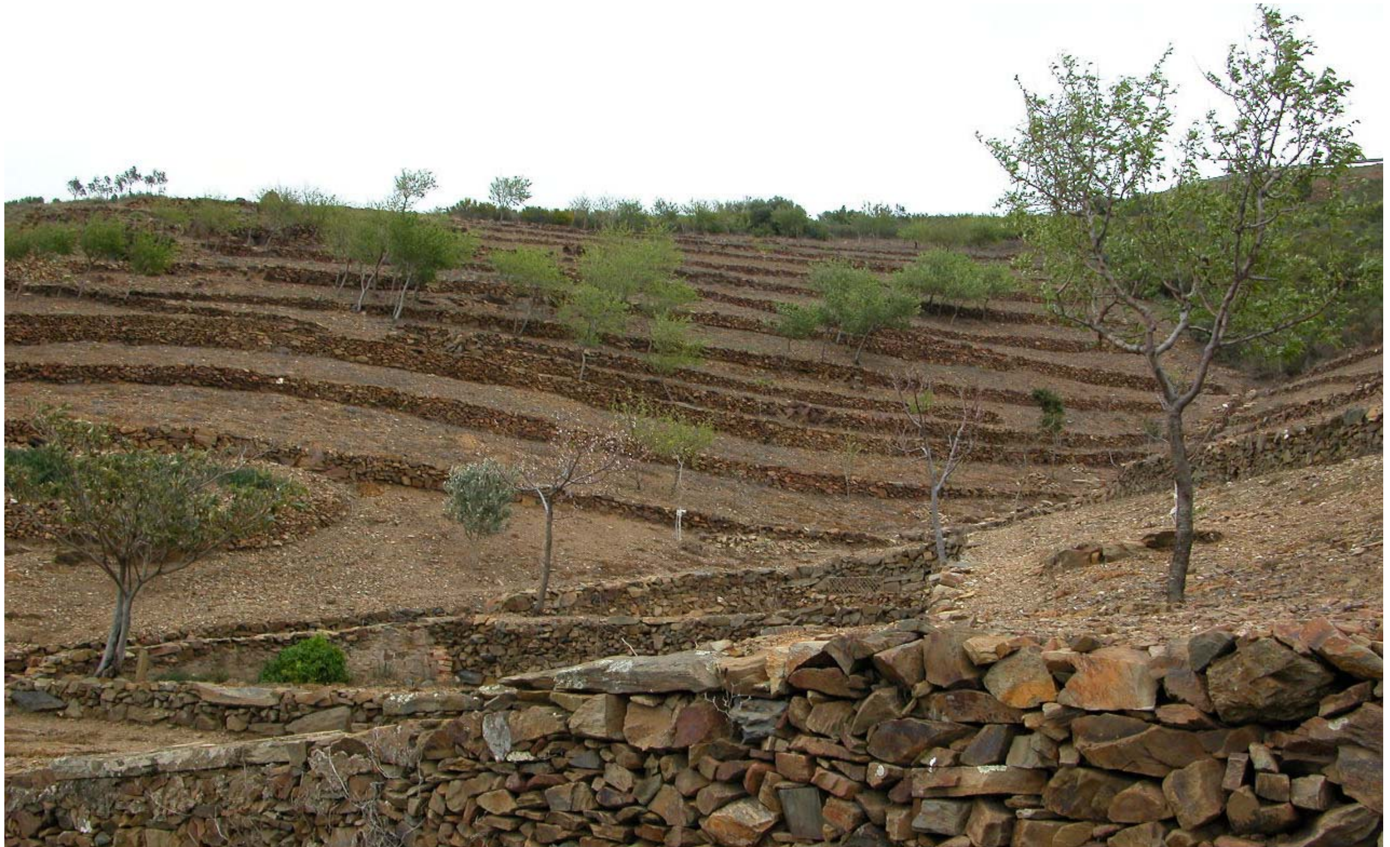
Figura 13.13. El paisatge format per murs de pedra seca té un gran valor històric i estètic i presenta una gran variabilitat tipològica i funcional al llarg de les Comarques Gironines.