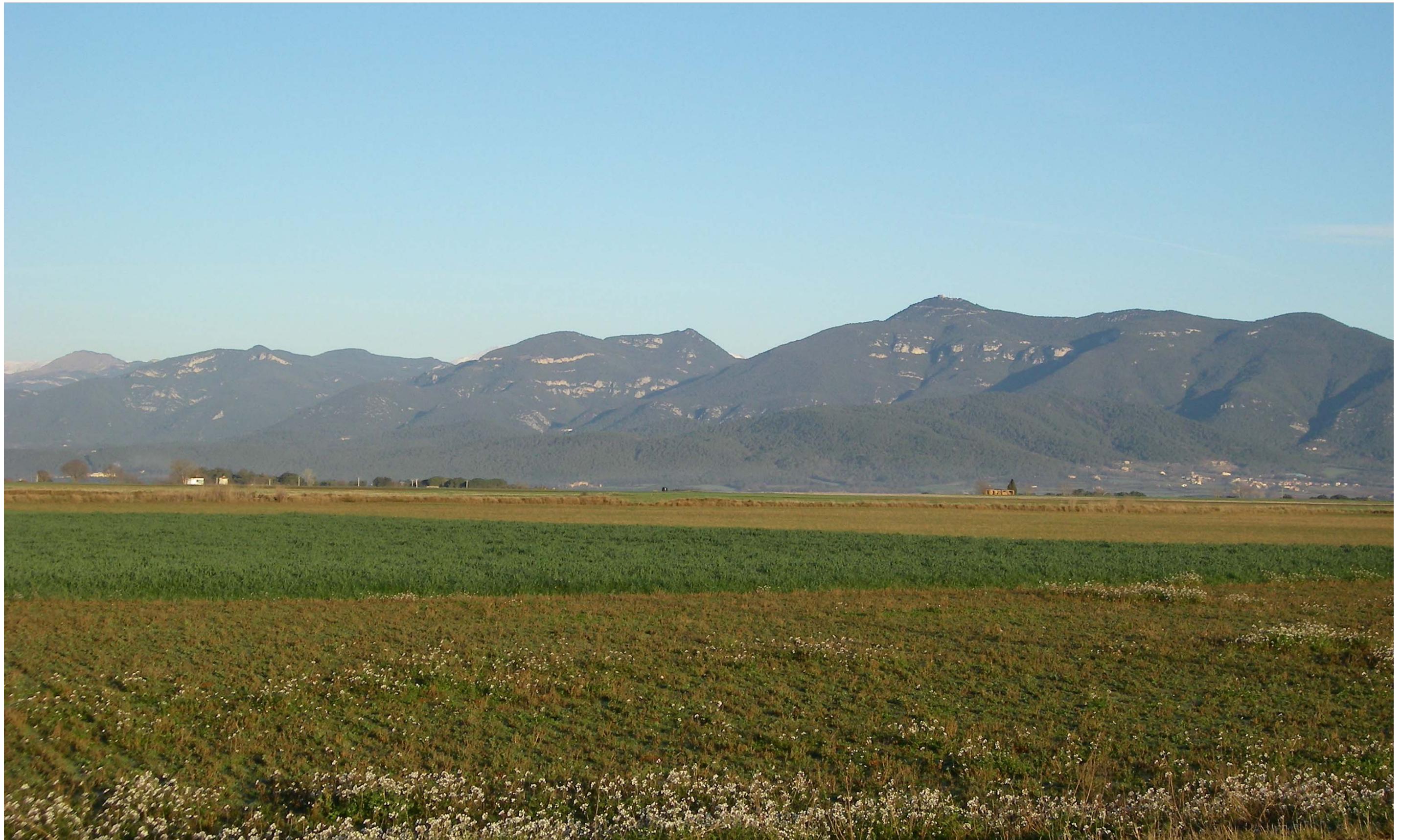
Figura 13.18. La muntanya del Mont, amb el santuari de la Mare de Déu del Mont al capdamunt, esdevé un fons escènic emblemàtic per a bona part de la població de les Comarques Gironines.