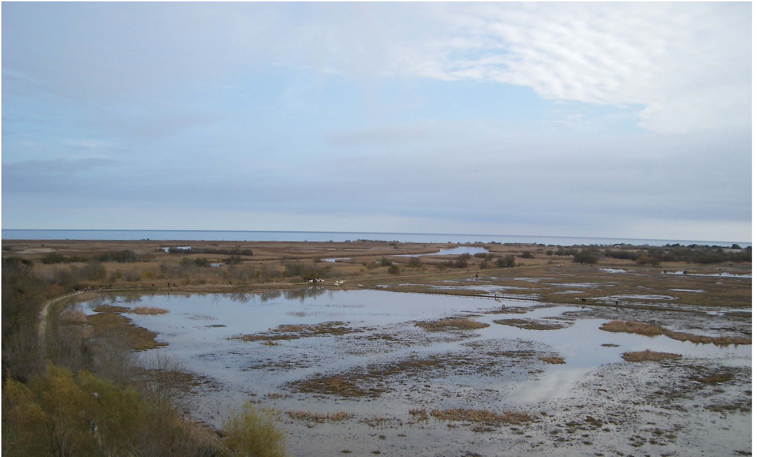
Figura 13.10. Els aiguamolls de l'Empordà confereixen un paisatge singular de gran valor natural i estètic que és difícil d'observar a la resta de les Comarques Gironines.