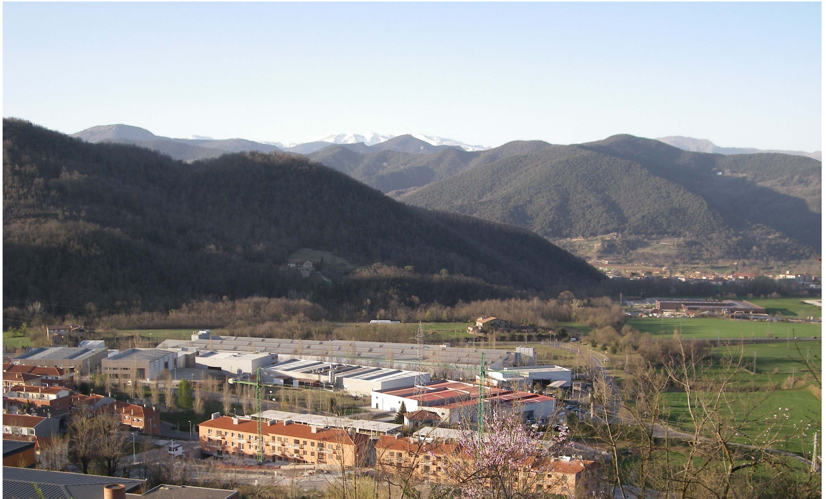
Figura 13.5. El polígon industrial del Pla de Baix, a Olot, es troba annexat al nucli urbà i presenta uns espais lliures ordenats.