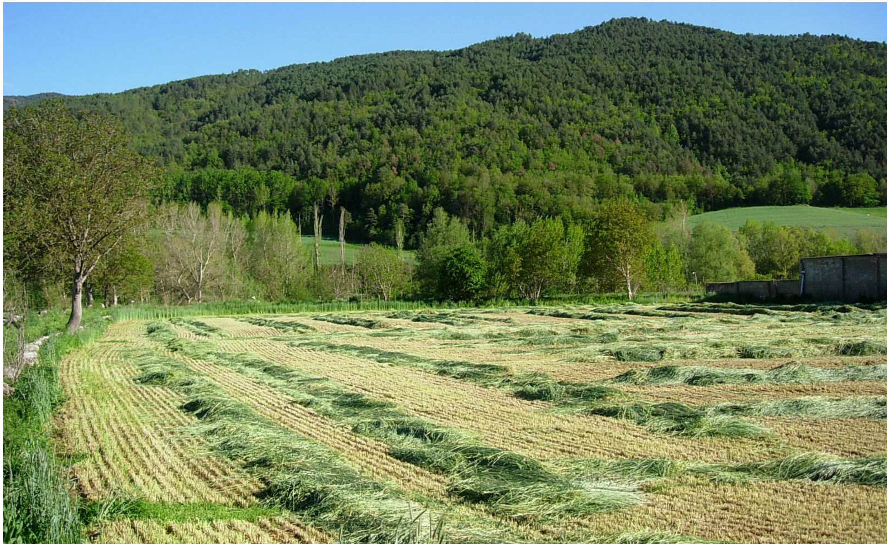
Figura 13.5. La major part de la plana al·luvial del Segre és ocupada per prats de dall i per vegetació de ribera