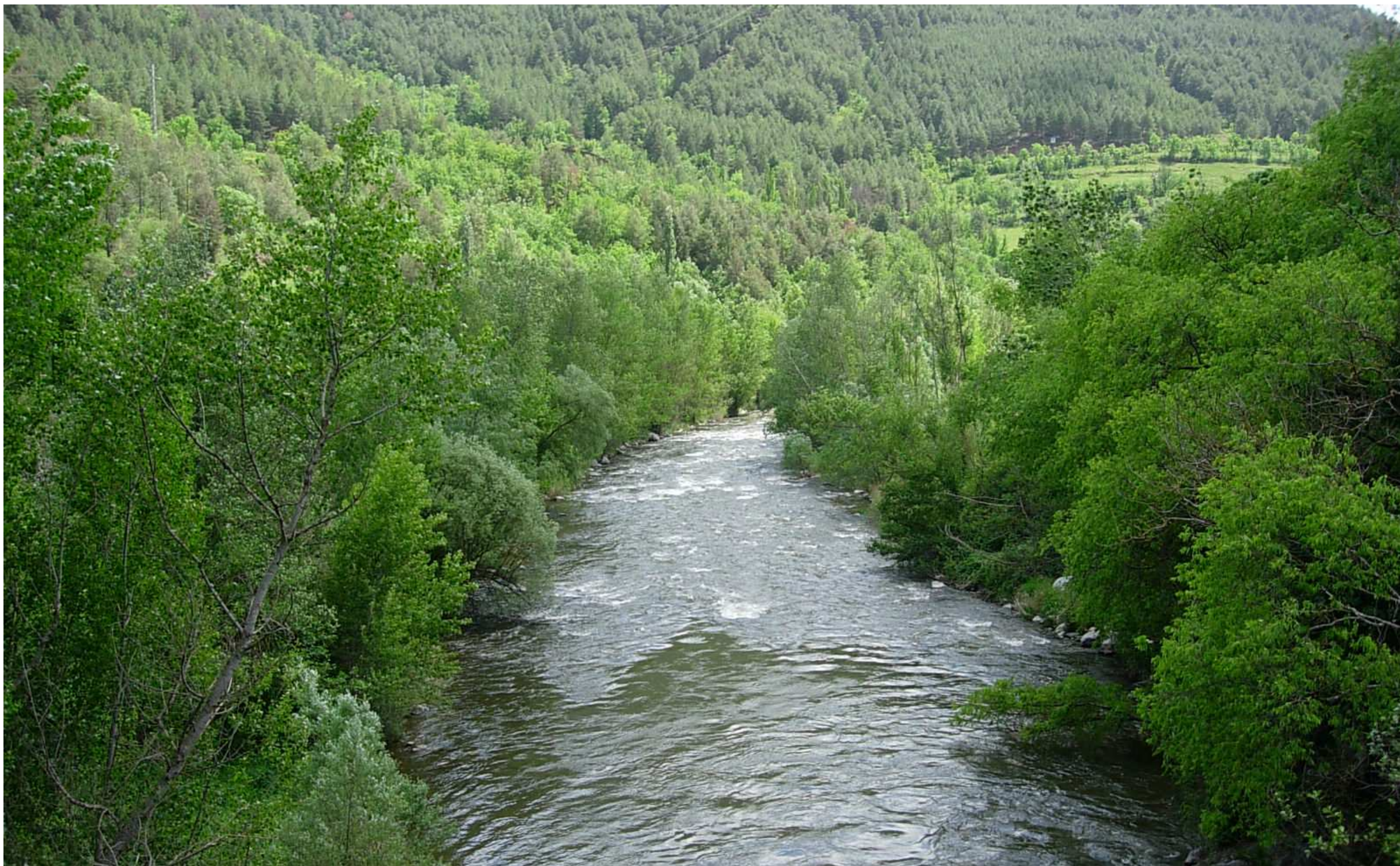
Figura 13.6. Molts cursos fluvials, com el Segre al seu pas pel pont d'Arsèguel, conserven llargs trams de bosc de ribera, tant si aquests discorren plàcids entre prats com si ho fan amb fúria en alguns dels molts engorjats