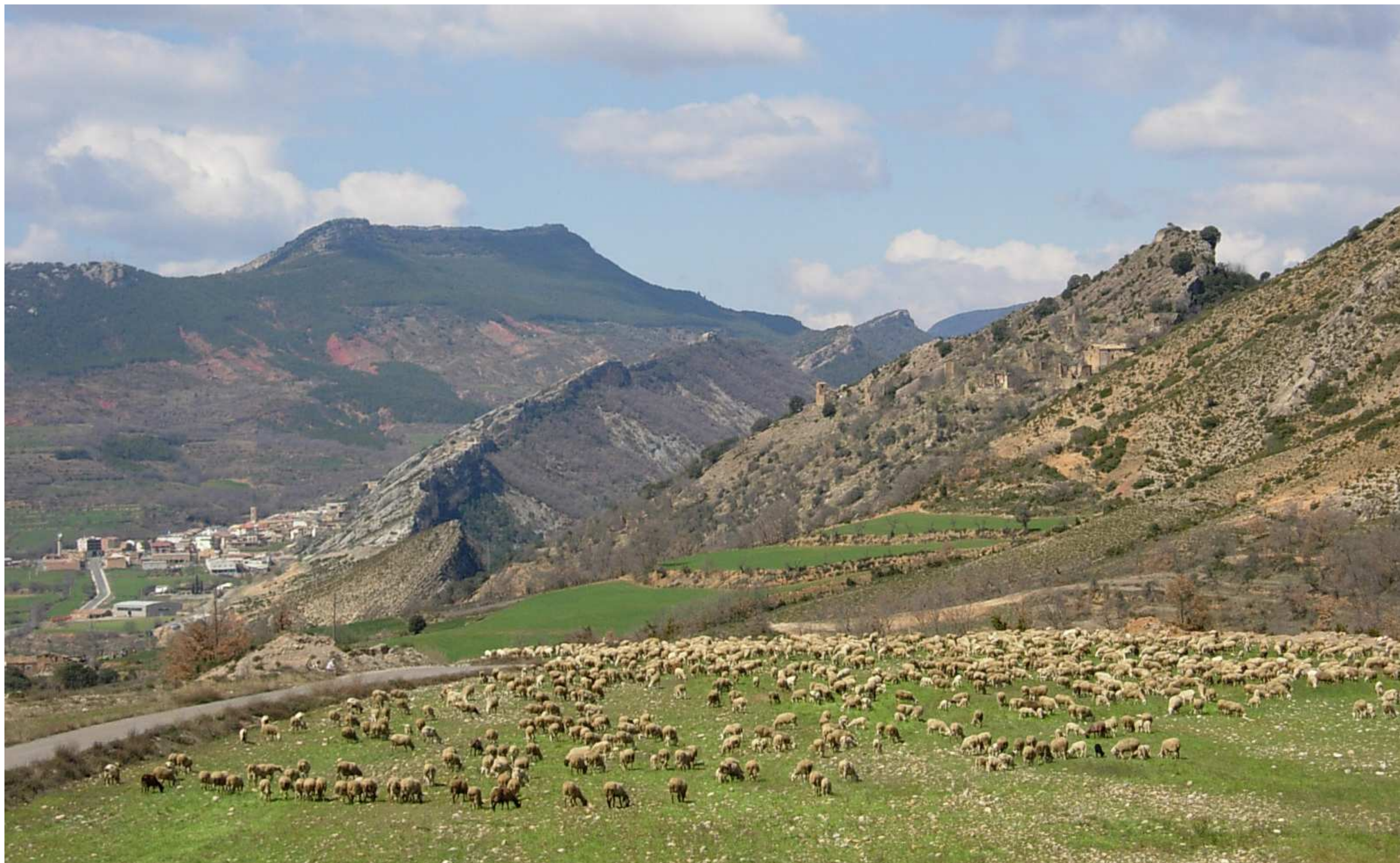
Figura 13.4. Camps de conreu i ramaderia extensiva a prop d'Orrit, a la Terreta