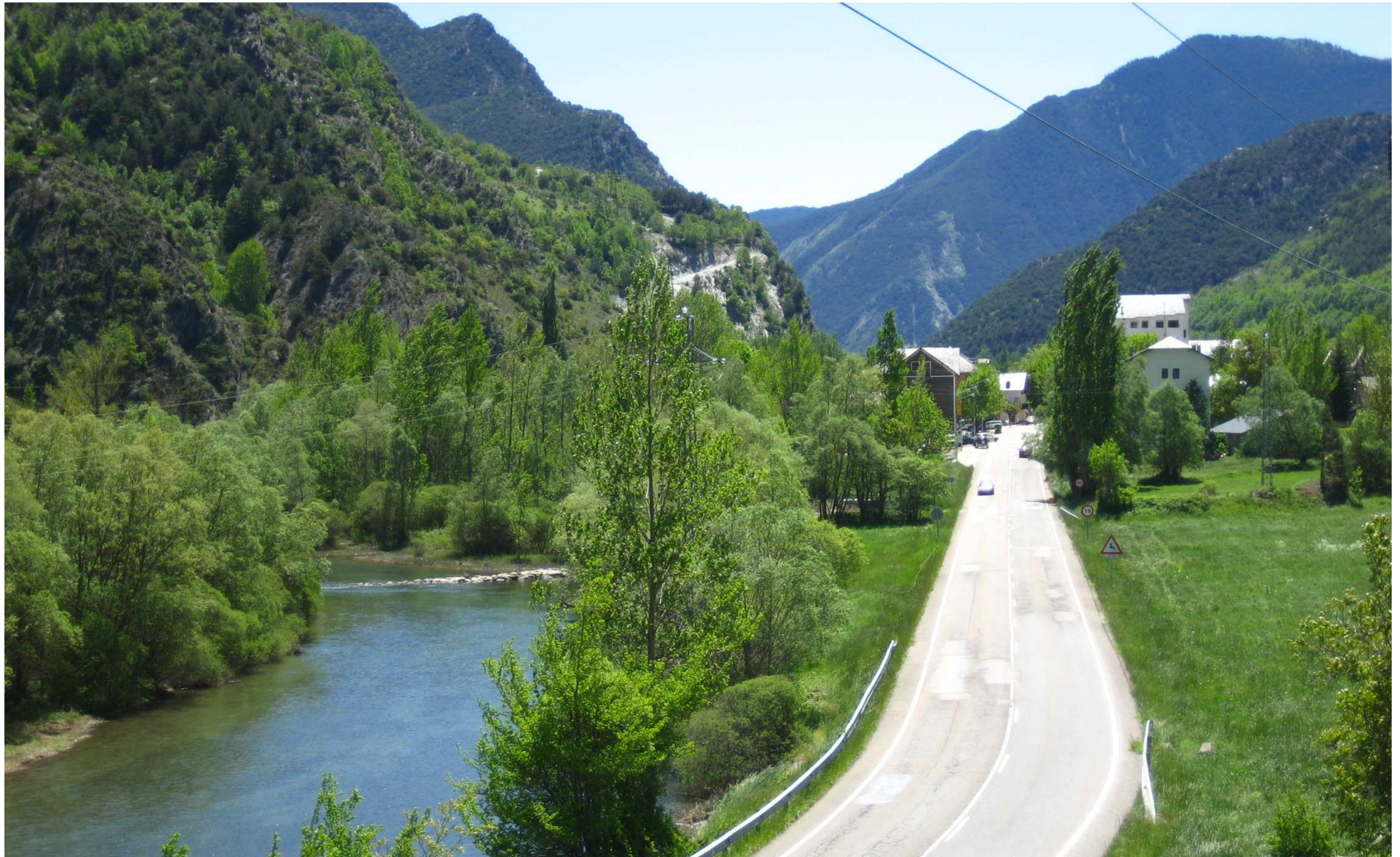
Figura 13.7. Infraestructures energètiques i de comunicació a l'entrada nord del nucli de la Guingueta d'Àneu