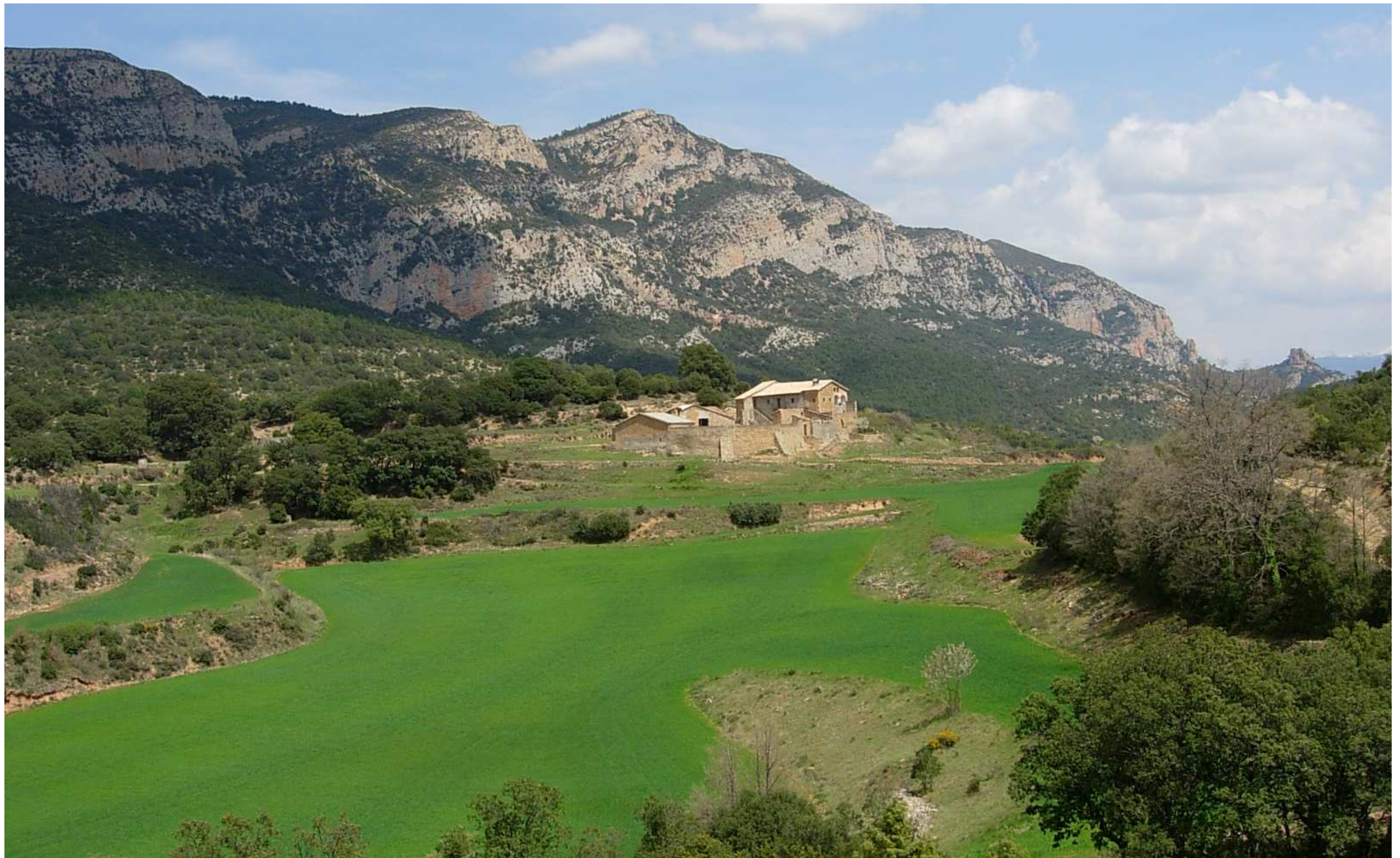
Figura 13.3. Juntament amb les bordes, les masies conformen un dels patrons de poblament del paisatge de l'Alt Pirineu i Aran, com la masia de Cortiuda, a la Rodalia d'Oliana