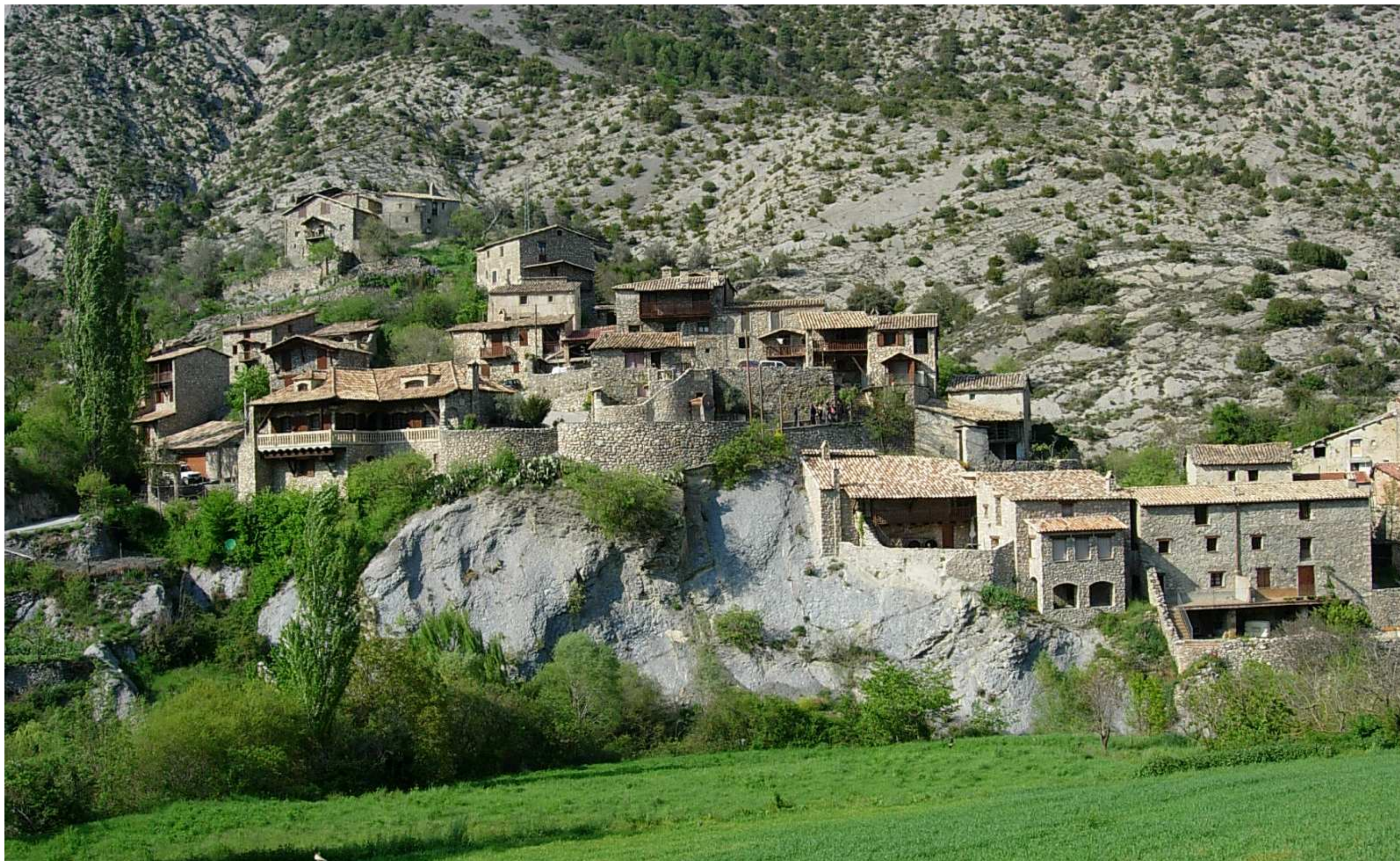
Figura 13.10. El poble de Cabó (Congosts del Segre), a la vall del mateix nom, és un clar exemple de combinació entre el sector agrari i el turisme al detall