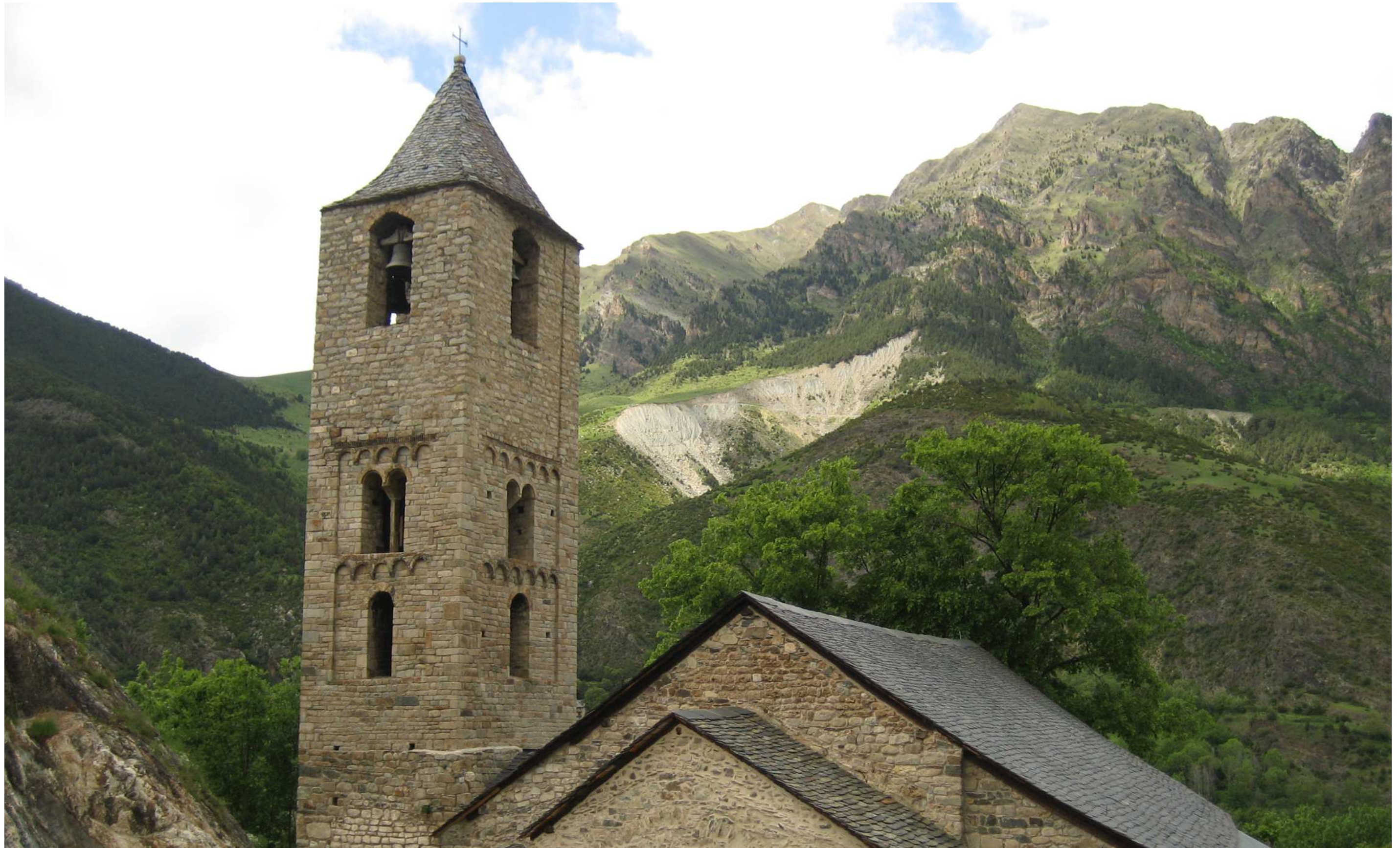
Figura 13.11. El temple de Sant Joan de Boí es troba situat en un indret de gran bellesa on es fon amb el paisatge muntanyenc d'aquesta zona de la vall de Boí