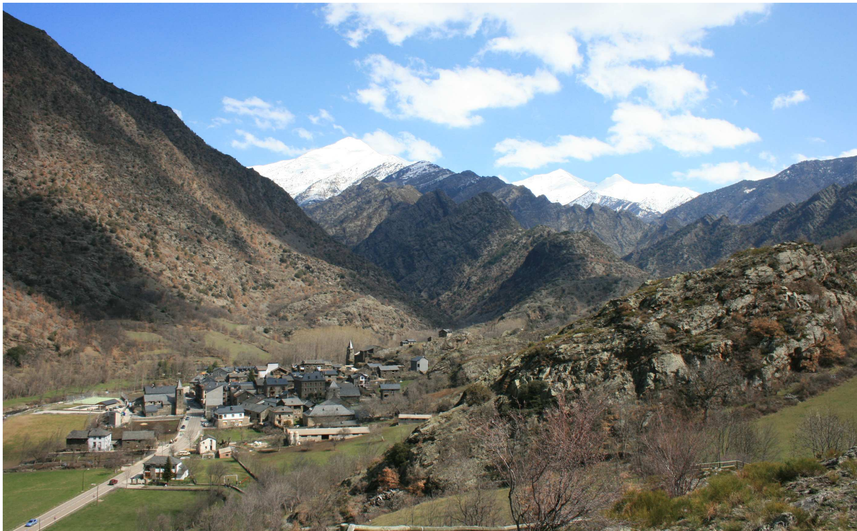
Figura 13.2. El poble d'Alins és un nucli al fons de la Vall Ferrera, una vall tancada que conserva el seu caràcter rural