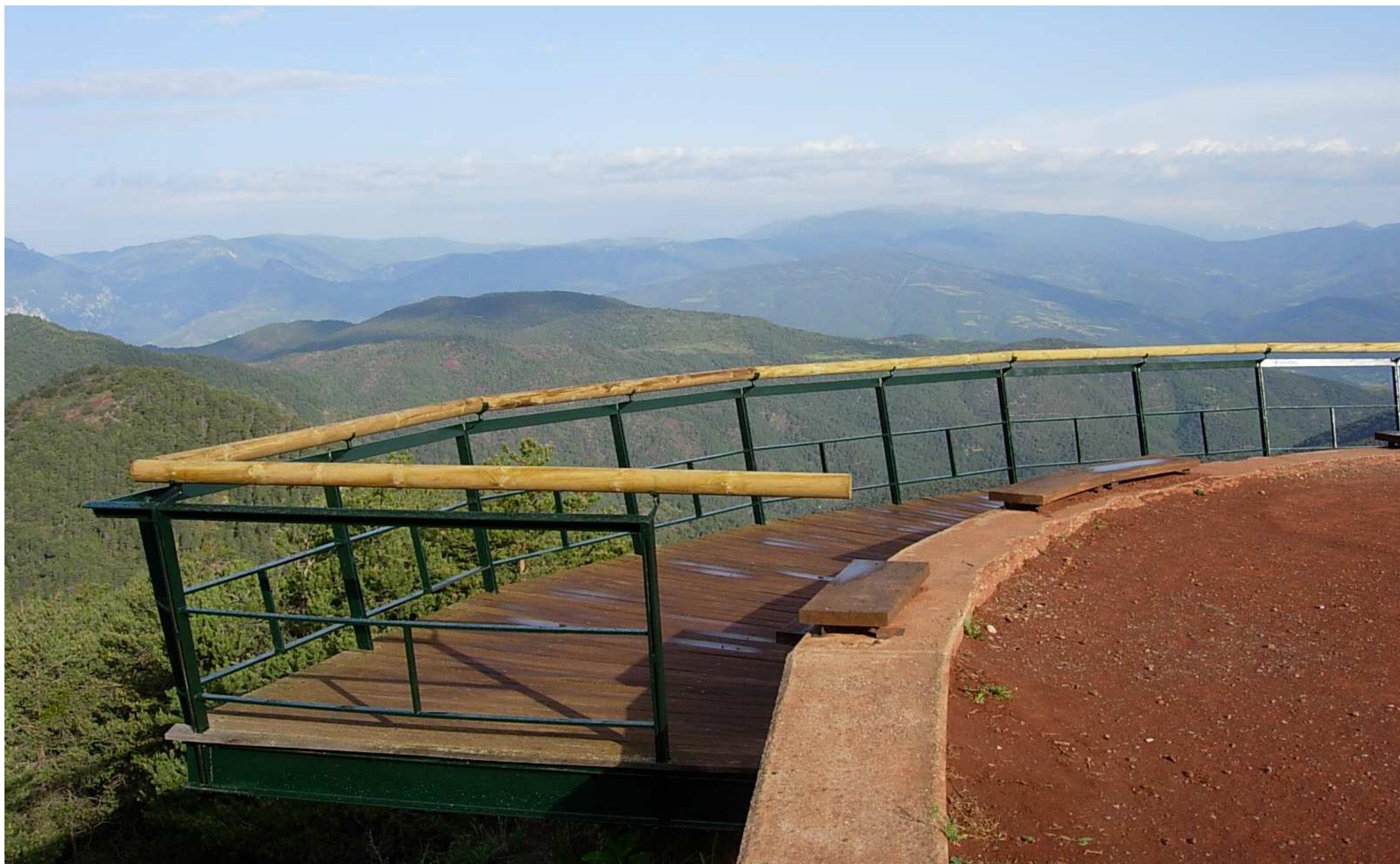
Figura 13.9. El mirador de la Trava gaudeix de grans vistes sobre la Plana de l'Urgellet i les muntanyes que l'envolten