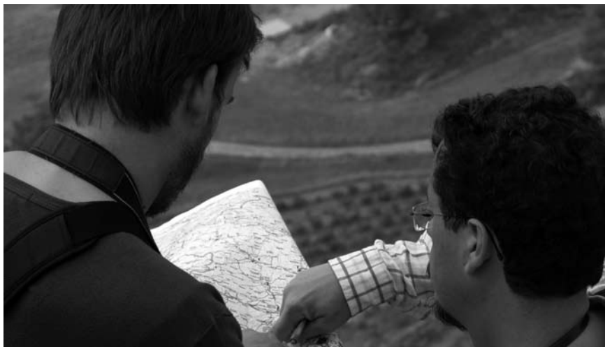
Imatge 4. L'avaluació dels impactes visuals requereix l'anàlisi sobre el terreny.

A l'hora de valorar els impactes visuals, és possible que s'avaluï el conjunt de l'àrea des de la qual és visible la transformació. Tanmateix, a la pràctica, sovint l'avaluació es limita a la zona específica en la qual es concentren els impactes visuals més significatius. Mitjançant un treball previ d'oficina, s'analitzen les dades perimetrals i es defineixen la zona preliminar d'influència visual, els principals punts de percepció i els receptors visuals sensibles, és a dir, aquells individus o grups que experimenten, de forma positiva o negativa, els canvis en el paisatge. A més, l'estudi ha de reflectir la naturalesa del paisatge analitzat i si és més obert o tancat, fet que normalment exigeix treball de camp. Aquest darrer pot servir també per a identificar fites valuoses tant de la rodalia com de la zona afectada, així com per comprovar els efectes sobre la visibilitat d'elements més concrets, com ara parets, arbres i edificis. Entre els receptors visuals, cal incloure-hi els residents, treballadors i altres usuaris dels diferents elements del paisatge (com ara les carreteres i els camins). Finalment, és possible que calgui tornar-hi de nit per tal de valorar els possibles impactes de la il·luminació associada al projecte.