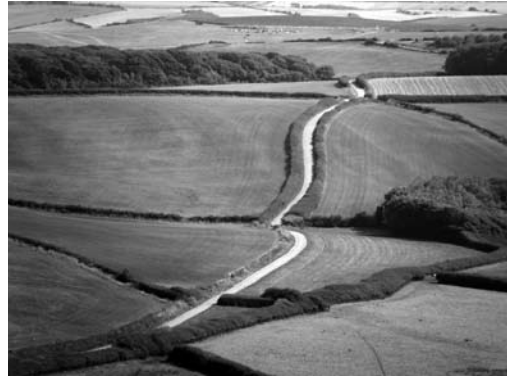
Imatges 2 i 3. Exemples il·lustratius de diferents caràcters del paisatge del Regne Unit: llac Maree i muntanya Slioch, zona de Ross and Cromarty, Escòcia (esquerra); Dorset, Anglaterra (dreta).

cuperació o la millora paisatgística. L'ús de materials il·lustratius, com ara fotografies, pot ajudar a transmetre una descripció detallada del caràcter del paisatge, tot i que cal procurar que la selecció es faci amb criteris estrictament objectius.