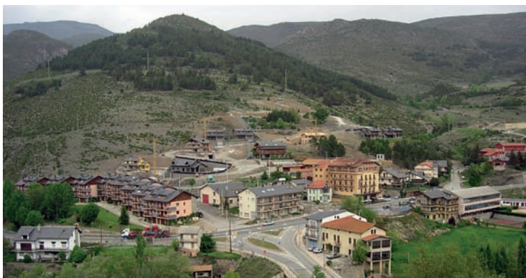
Imatges 3, 4 i 5. Segons la seva ubicació, les perifèries mostren elements urbans i rurals ben diferents, i representen realitats ben diverses. A les imatges, les perifèries de Sant Adrià del Besòs, Alguairè i Bellver de Cerdanya.