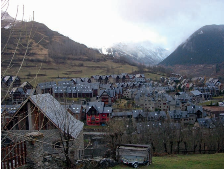
Imatge 7. A les urbanitzacions és, probablement, on més es manifesten els efectes d'una uniformització progressiva dels paisatges, ben palpable al conjunt de les perifèries. A la imatge, una urbanització al Pirineu.

qualitat i la pèrdua de funcionalitat ecològica dels sòls que s'han conservat; l'increment del risc d'incendi; l'alteració i l'obstaculització de línies d'horitzó, fons escènics i altres referents paisatgístics de primer ordre, o l'impediment de l'ús recreatiu d'un paisatge determinat.