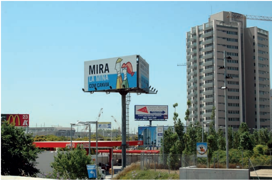
Imatge 6. Molts dels paisatges de les perifèries s'han convertit en autèntics contenidors de múltiples i diversos artefactes que sovint confegeixen una mena de cacofonia territorial.

Ha influït en la construcció d'aquests nous paisatges el fet que el sòl no urbanitzable, malgrat que exclou l'edificació, ha admès usos que sovint porten associats construccions amb capacitat de transformació de la qualitat del paisatge. Ho il·lustra clarament aquesta dada: entre els anys 2005 i 2010, el Servei de Paisatge de la Generalitat de Catalunya va rebre més de set mil sol·licituds per elaborar informes d'impacte i integració paisatgística 3 en sòl no urbanitzable. Però aquest no n'és l'únic motiu. Un altre motiu té a veure amb l'estructura de la propietat del sòl, que condiona la ubicació de qualsevol instal·lació. La pobra qualitat arquitectònica de la majoria de les intervencions i la manca de sensibilitat paisatgística provoquen la resta. Cal incidir seriosament en aquesta qüestió. La percepció real de desordre, de dissonància i d'insatisfacció que té la població en relació