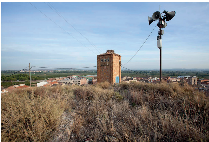
Imatge 2. Cal invertir la tendència dominant fins ara i començar a narrar la perifèria des de la mateixa perifèria i no fer-ho des de la ciutat, ja que els arguments de les dues realitats difereixen completament.

El repte que cal superar és, doncs, el d'incrementar i gestionar la qualitat d'uns paisatges —els de les franges— enormement variables en una nova lògica territorial organitzada en fluxos (financers, de productes, etc.) on les ciutats concentren cada cop més poder, riquesa i informació, quan els escenaris econòmics, socials, culturals o tecnològics se succeeixen, se sumen o se substitueixen a gran velocitat, i un cop s'ha arribat a una situació d'incertesa, de punxada general del model expansiu, de fi de cicle.