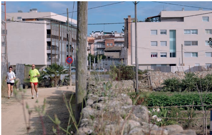
Imatge 10. Projectes com la recuperació de les hortes de Salt i Santa Eugènia contribueixen a una reconstrucció col·lectiva del sentit de pertinença a un lloc, ja que ajuden la comunitat a identificar-se amb un espai.

de ciutats grans mencionen com a paisatges imaginats els relacionats amb el seu paisatge urbà, o els habitants de pobles assenyalen principalment elements agrícoles i muntanyes, els que viuen a les zones residencials periurbanes tenen com a paisatges imaginats les imatges més mítiques (Sagrada Família, Montserrat, Collserola), és a dir, paisatges ben coneguts per l'àmplia majoria de la gent però que tenen molt poc a veure amb les zones residencials on viuen. En aquests indrets es produeix un profund conflicte de representació i de significació del lloc. Què cal fer perquè els habitants d'aquestes àrees residencials periurbanes s'hi sentin lligats emocionalment? Es constata que en algunes franges, sobretot les dels barris perifèrics més antics de les grans ciutats, alguns dels seus habitants senten una certa identificació amb elements propis dels paisatges perifèrics, com per exemple els blocs de pisos, els passos sota ponts de nusos de comunicació, els magatzems, etc., de manera que acaben sentint-se més propers a aquests mateixos elements però ubicats en altres perifèries, encara que aquestes perifèries es trobin a molts quilòmetres de distància, que amb el centre de la mateixa ciutat on viuen.