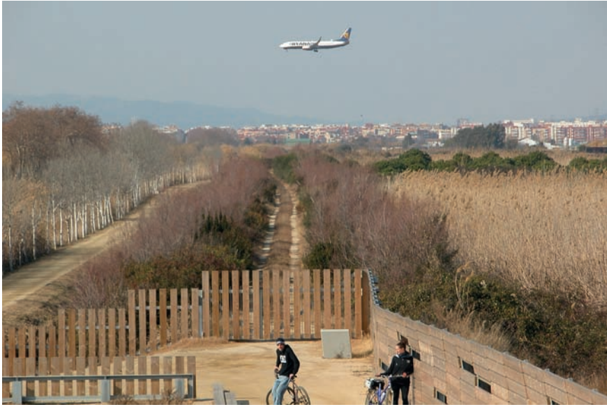
Imatge 13. És important educar la població per tal que sigui conscient que les perifèries són també portadores de significats i de valors, tant en l'àmbit rural com urbà.

Els catàlegs de paisatge de Catalunya apunten que una de les moltes vies per assolir aquest objectiu és per mitjà de les carreteres i els miradors. Ambdós conviden, estimulen i faciliten la percepció —i la reflexió— dels paisatges urbans i rurals; una percepció que no és exclusivament visual, sinó també emocional i vivencial. Massa sovint a casa nostra la contemplació del paisatge està associada a la cerca de l'espectacularitat o la singularitat (als valors escenogràfics), atribuïts cada vegada més instaurats en la nostra societat, i això fa deixar de banda aquells paisatges que es perceben com a menys atractius, com ara els de les perifèries. Doncs bé, 21 dels més de 400 miradors que identifiquen els catàlegs de paisatge estan situats en espais periurbans i poden fomentar-ne la comprensió (com, per exemple, el mirador del turó de Sant Pau, a Bellaterra, i el del castell de Sant Ferran, a Figueres); més de vuitanta tenen les seves visuals dirigides cap a aquests espais (com ara el mirador del santuari de Queralt, a Berga, i el del castell d'Eramprunyà, a Gavà), i prop de cinquanta itineraris definits en els catàlegs també creuen aquests tipus d'espais.