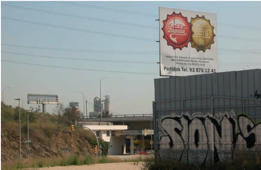
Imatge 1. Els paisatges de la perifèria acostumen a ser paisatges híbrids, sovint caòtics i confusos, que han perdut els seus significats, simbolismes, formes i funcions originals que permetien entendre'n l'especificitat.

increment d'infraestructures, terciarització econòmica, relocalització industrial i mobilitat laboral, etc). Així doncs, els paisatges de les perifèries ni han seguit els models de la ciutat compacta, cohesionada i formalitzada que els anava creant, ni han sabut conservar les funcions, les traces i els valors preexistents dels espais rurals, de manera que els límits i les diferències físiques i socials entre camp i ciutat s'han anat tornant cada vegada més imprecisos i les tensions paisatgístiques s'han incrementat. La conseqüència d'aquesta absència d'interpretació i planificació ha estat l'emergència —sovint imprevista, indesitjada i fins i tot ignorada— d'un tipus de paisatges, els de les perifèries, amb una personalitat pròpia, que reclama amb urgència una revisió i una ordenació sostenibilista diferent de la de qualsevol altre paisatge, però sense perdre'n de vista les potencials sinergies positives.