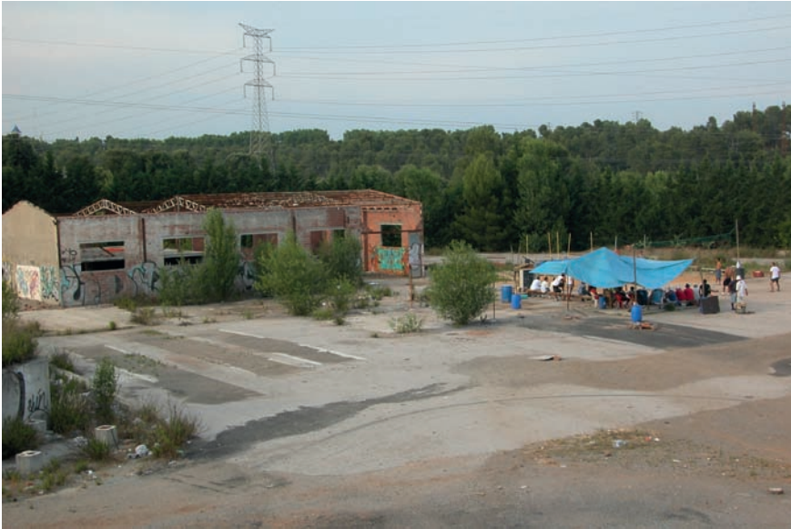
Imatge 11. Les franges són també l'espai d'acollida temporal d'artefactes o esdeveniments, la qual cosa transforma per un període més o menys breu aquests paisatges, els seus valors i la seva percepció.

la de custòdia urbana, 4 semblant a la coneguda custòdia del territori que s'aplica als paisatges més rurals.