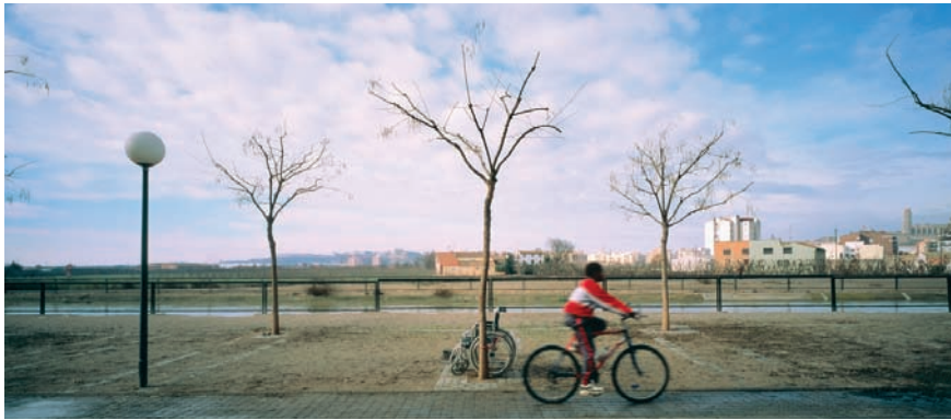
Imatge 9. El poder evocador que té la perifèria també ha inspirat en els últims anys fotògrafs de casa nostra que, amb les seves creacions, contribueixen a la reivindicació de les franges contemporànies. A la imatge, fotografia de Jordi Bernadó.

L'art, la literatura i, més recentment, el cinema han estat tradicionalment els vehicles més eficients per a la transformació de la mirada i la sensibilitat paisatgístiques i, molt probablement, el fet que hagin estat pocs els escriptors, els artistes i els cineastes a casa nostra que dialoguessin amb el paisatge de la perifèria explica, en gran part, que aquesta perifèria es continuï coneixent i apreciada poc. Avui, però, la via més influent per incidir sobre una determinada imatge o percepció d'un lloc són, com s'ha esmentat abans, els mitjans de comunicació, que continuen traient ben poc rèdit d'aquests espais. Aquest desinterès continu per un territori tan intensament transformat els darrers anys contribueix a incrementar encara més la distància ja existent entre les imatges mítiques del paisatge català, els paisatges tradicionals de referència, forjats en la literatura i la pintura, i la realitat dels paisatges catalans del principi del segle XXI, que són els paisatges quotidians per a milers de persones, sobretot les perifèries.