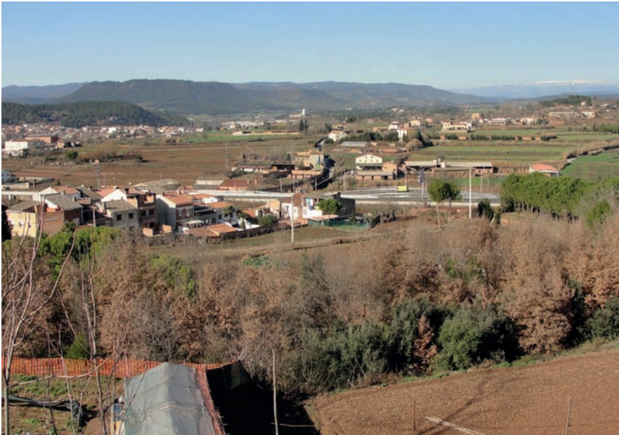
Imatge 12. Els espais agrícoles dels voltants de les ciutats ajuden a generar identitat, per la qual cosa haurien d'esdevenir els principals conductors i reestructuradors de les perifèries del futur.

Aquests espais agrícoles, a més a més, haurien de ser vistos com a aliats excel·lents i com a complements idonis per als productes turístics dominants de neu, sol i platja, com ja passa al Priorat o al Penedès, on s'han adonat del valor afegit que representa que el paisatge estigui ben cuidat i tingui personalitat, tant per al foment del turisme rural com per a la mateixa activitat agropecuària.