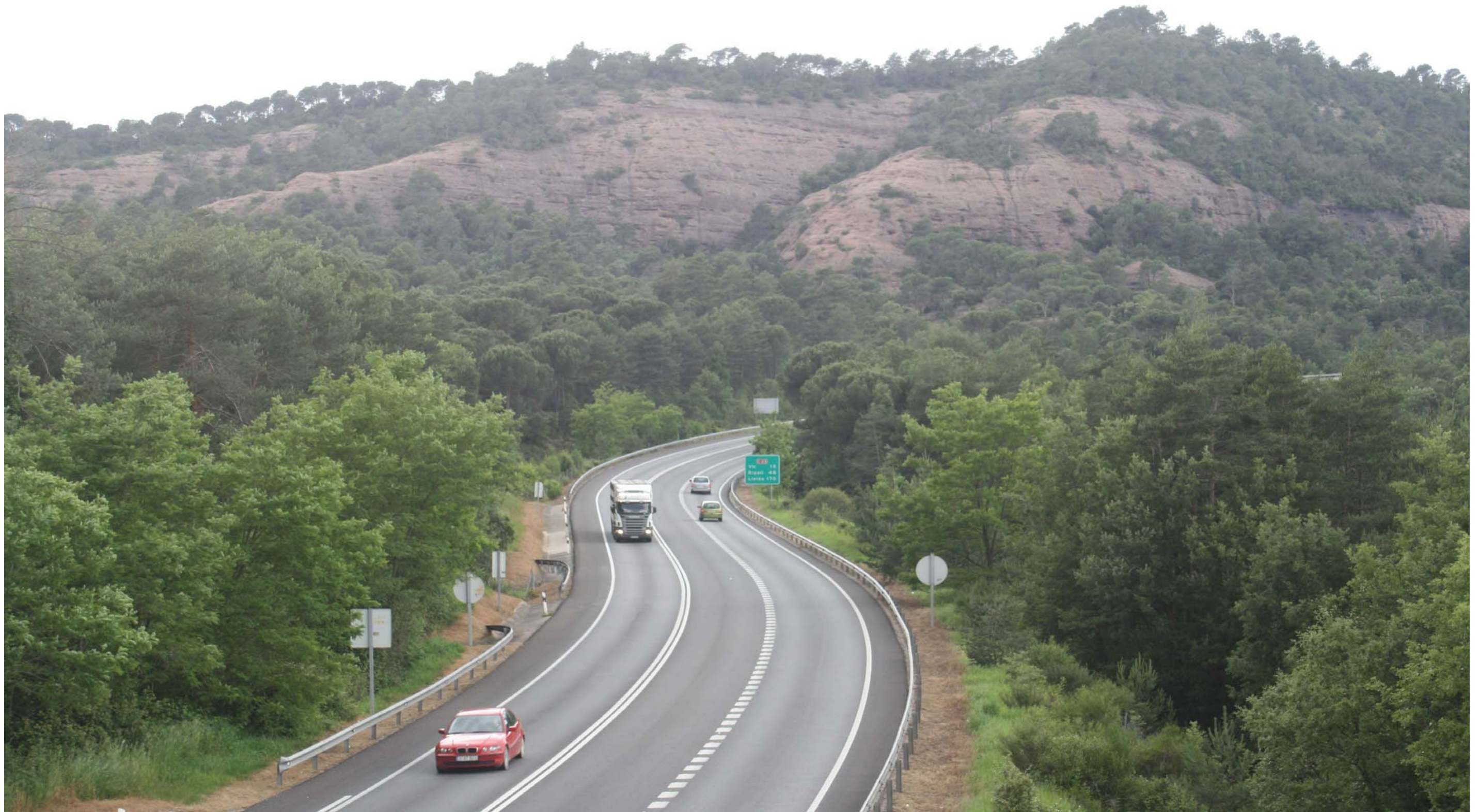
Figura 11.3. L'Eix Transversal (C-25) al seu pas per Romegats. Guillerries.