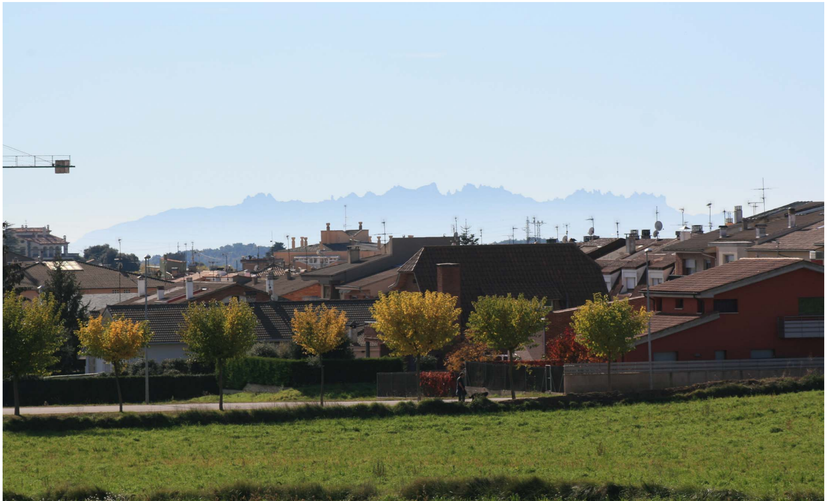
Figura 11.13. Prats de Lluçanès, amb Montserrat com a fons escènic. Lluçanès.