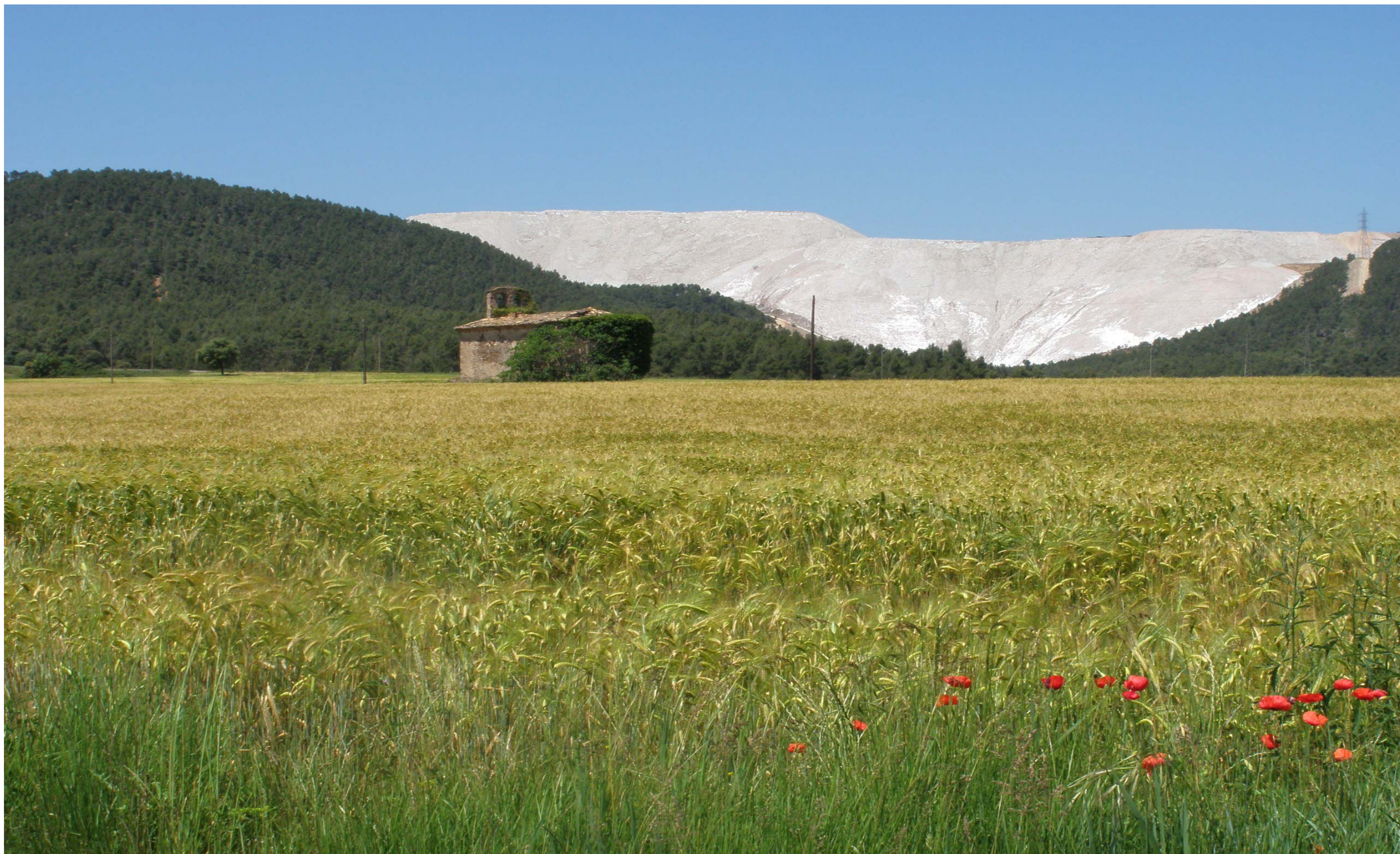
Figura 11.5. Els runams són un dels elements que configuren els paisatges miners. Runam salí a Sallent. Conca Salina.