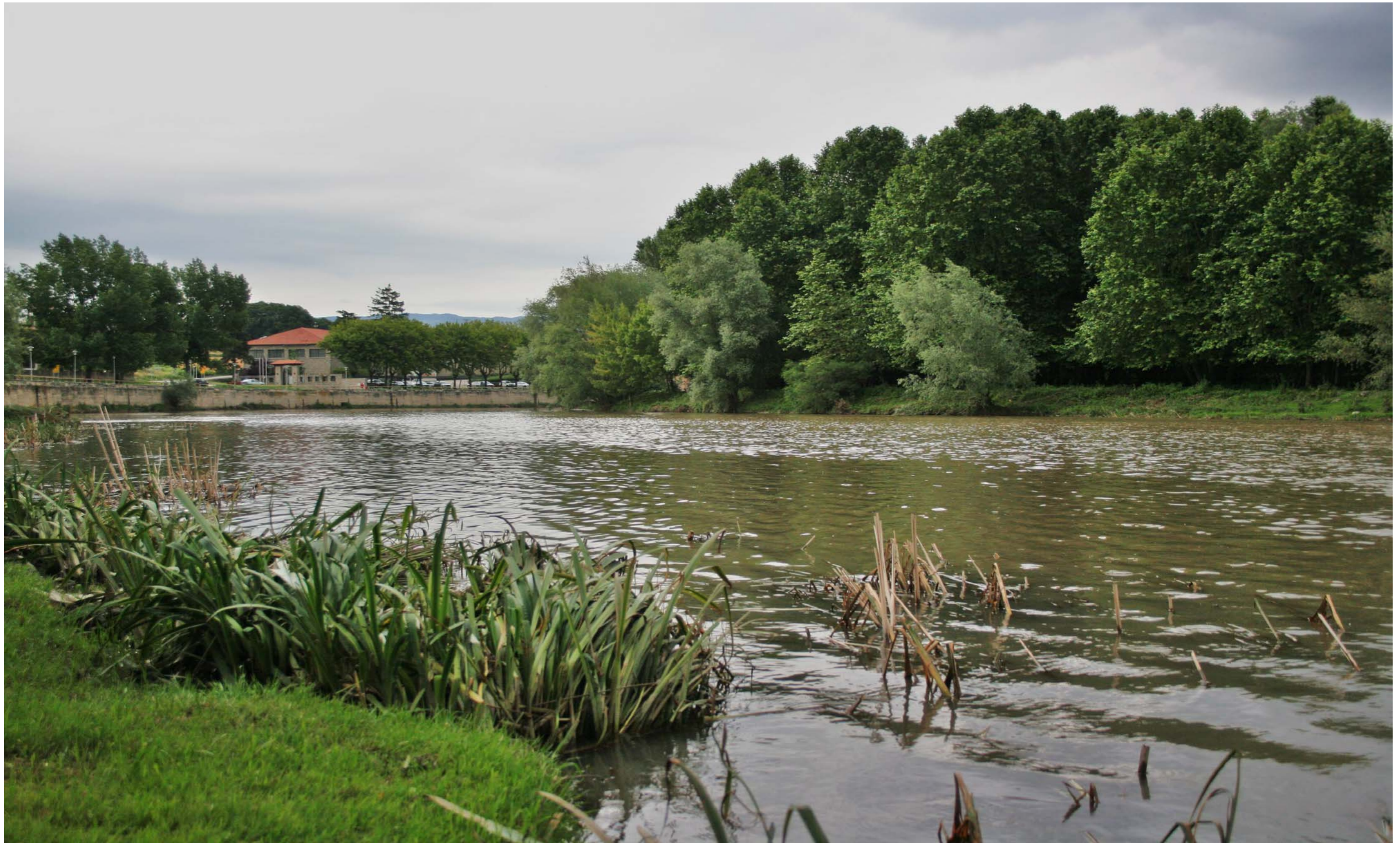
Figura 11.7. El Ter al seu pas per Manlleu. Plana de Vic.