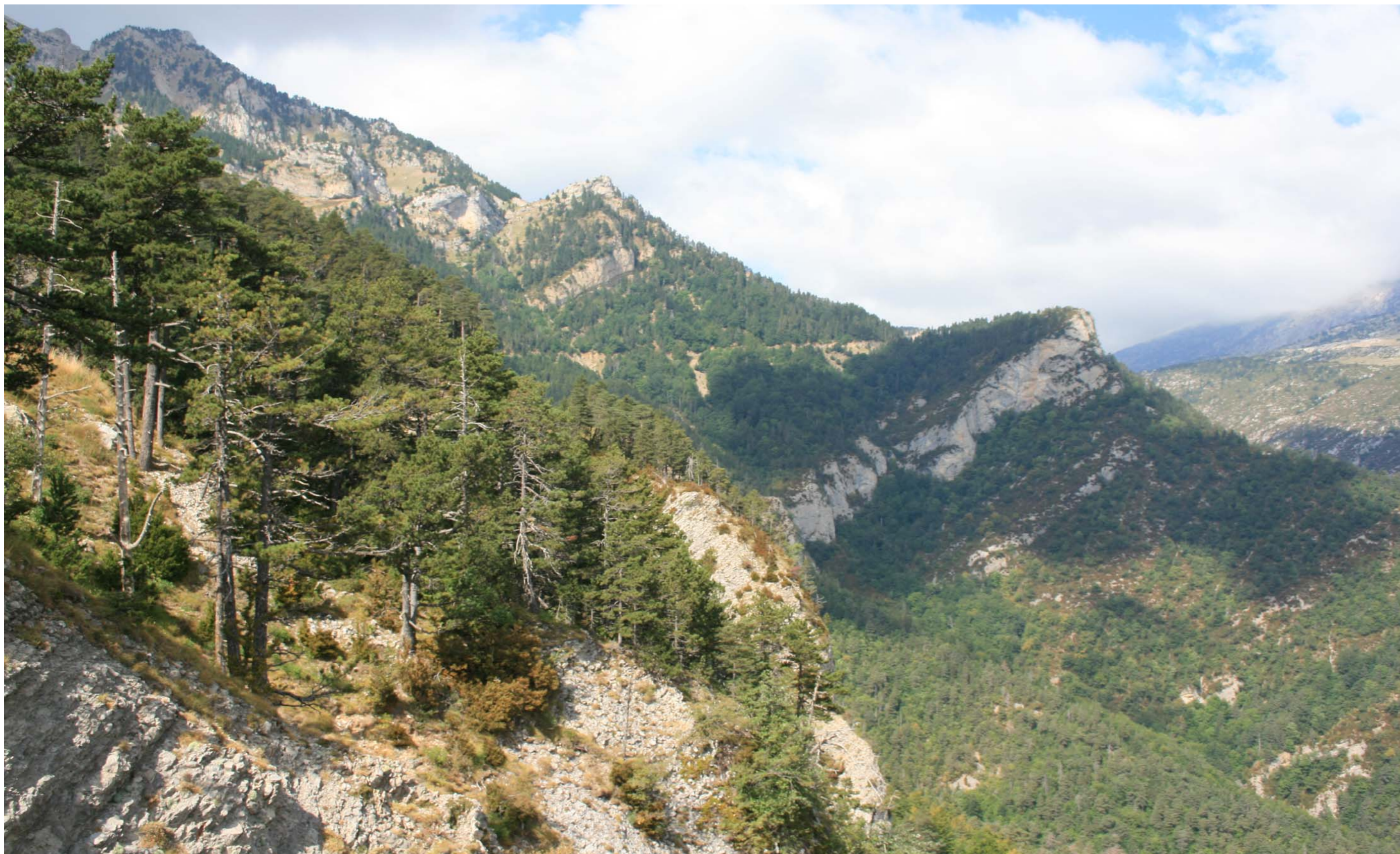
Figura 11.10. El Roc del Pi Ajagut. Saldes. Capçaleres del Llobregat.