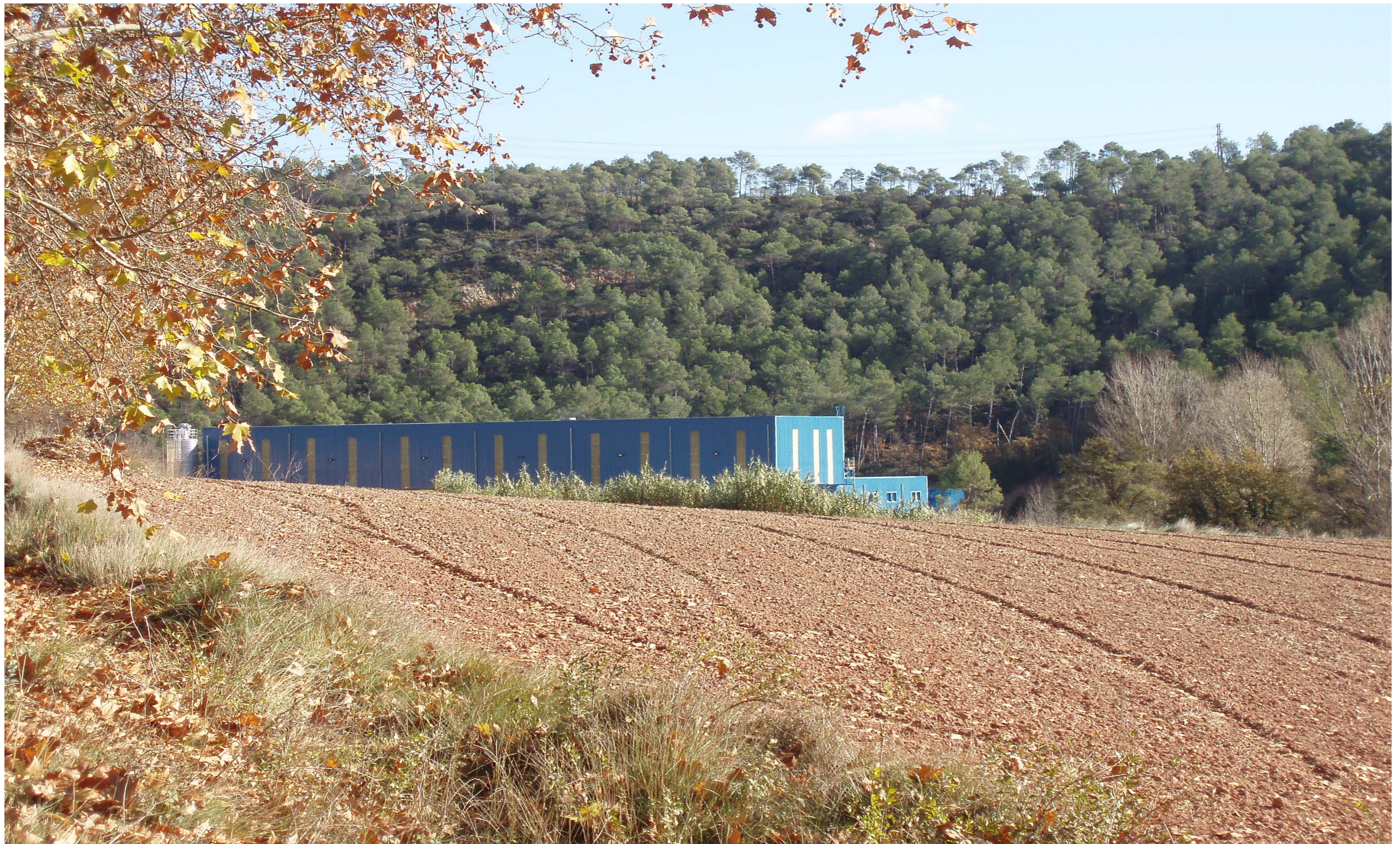
Figura 11.4 Indústria estratègicament ubicada, amb poc impacte visual. Carne. Valls de l'Anoia.