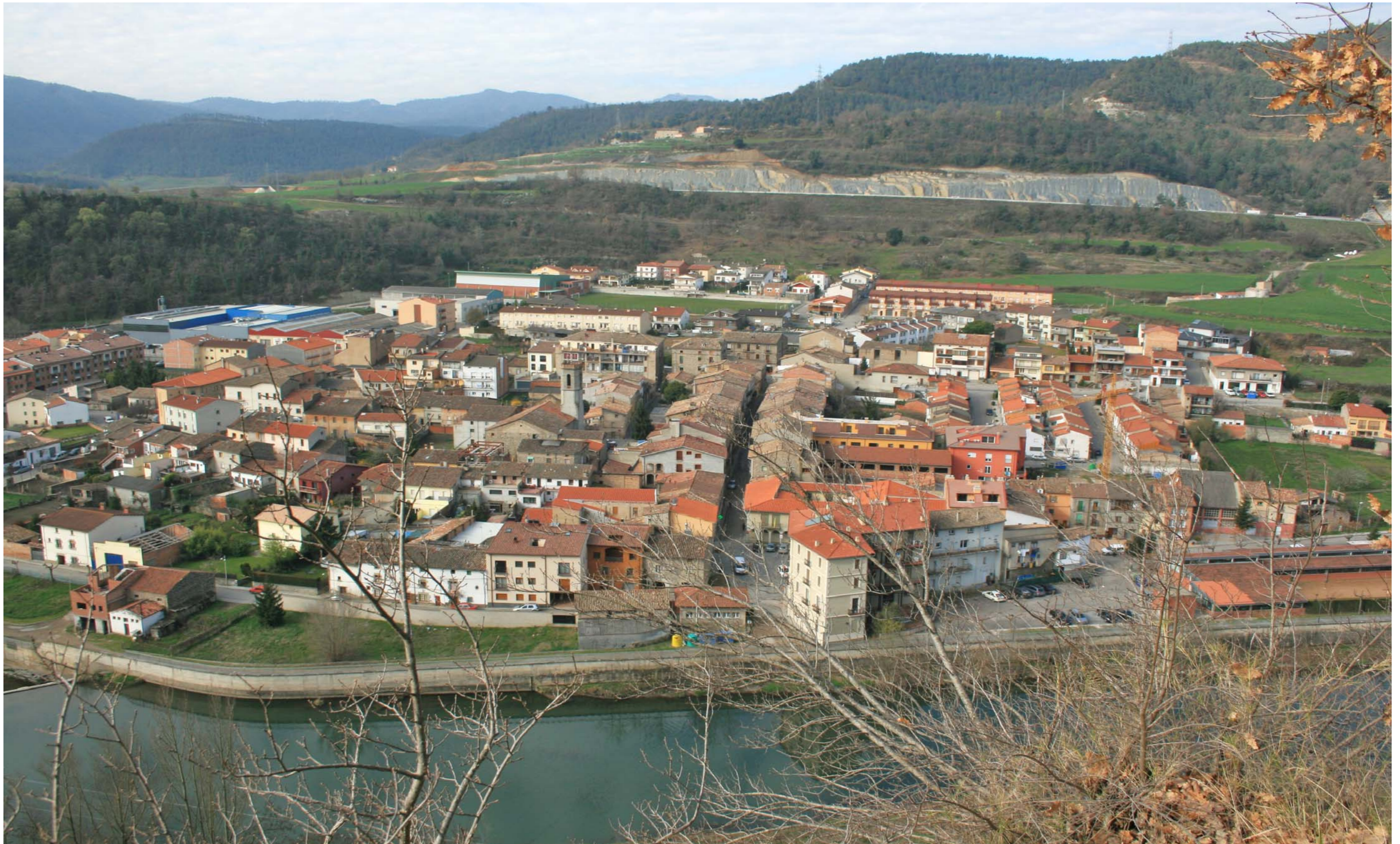
Figura 11.2. Montesquiú, exemple de nucli agrupat amb perímetre nítid. Alt Ter.