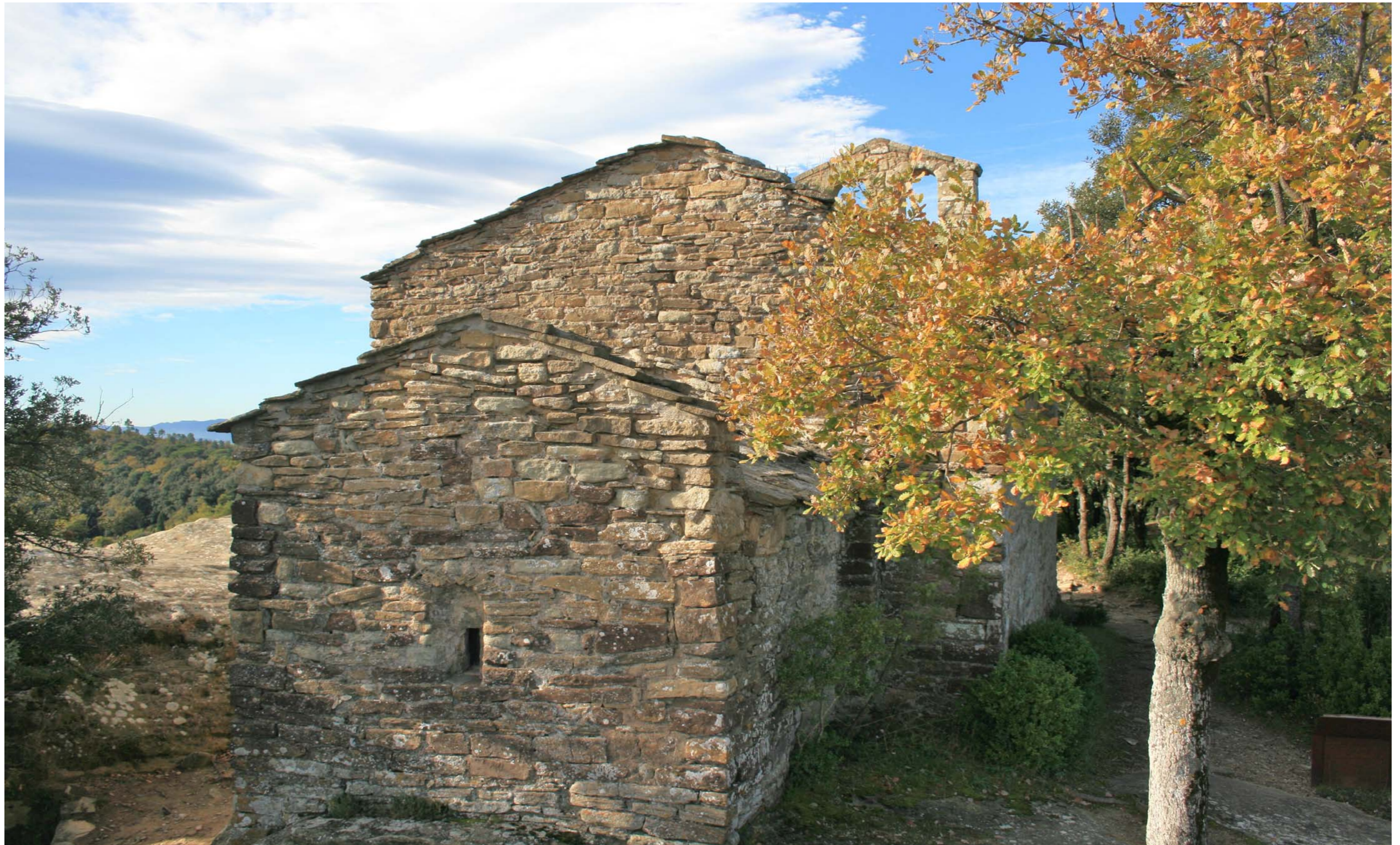
Figura 11.9. Sant Feliu de Savassona. Tavèrnoles. Cabrerès-Puigsacalm.