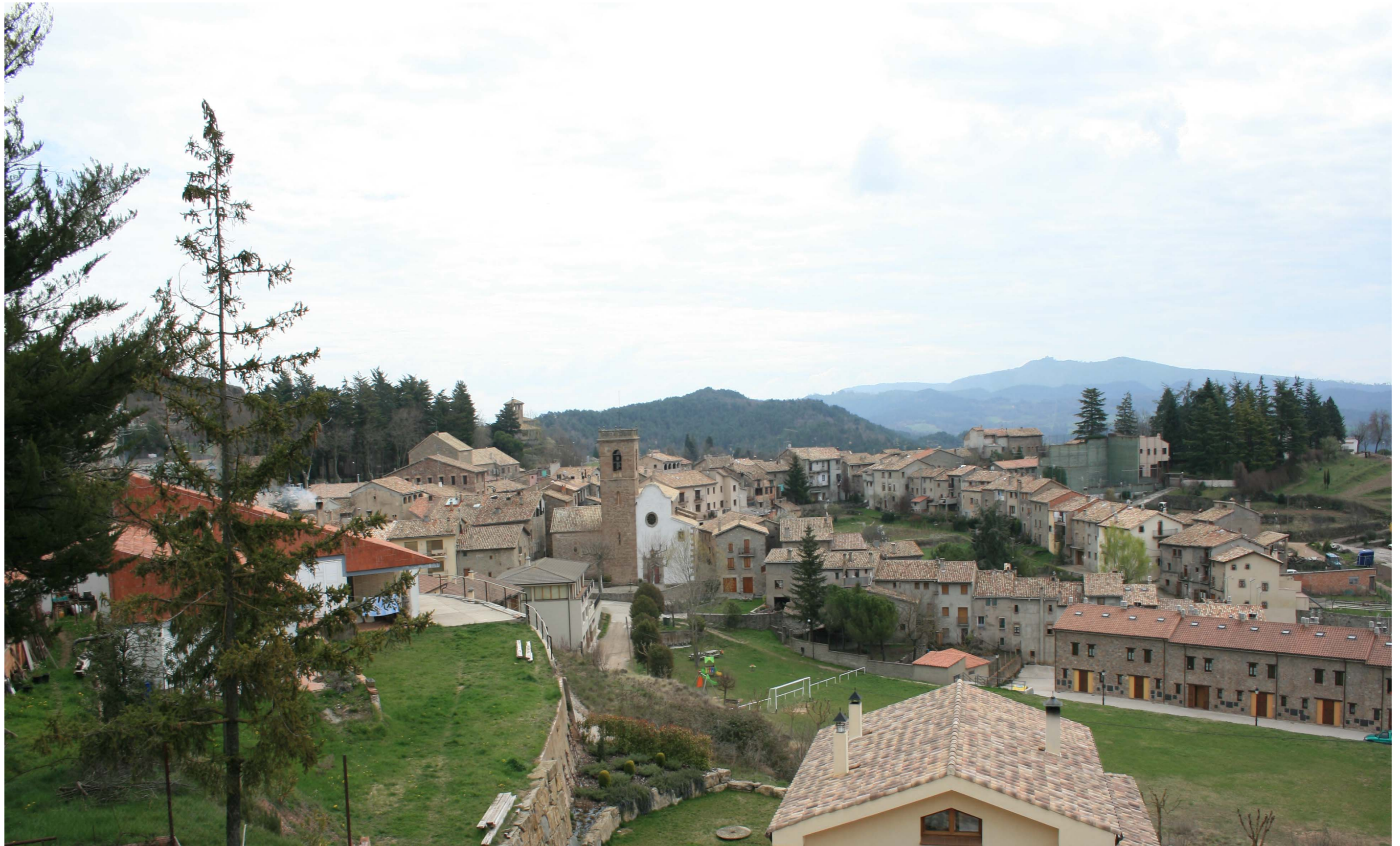
Figura 11.8. Els nous sectors urbanitzats d'Alpens s'integren en el context paisatgístic del poble. Alt Ter.