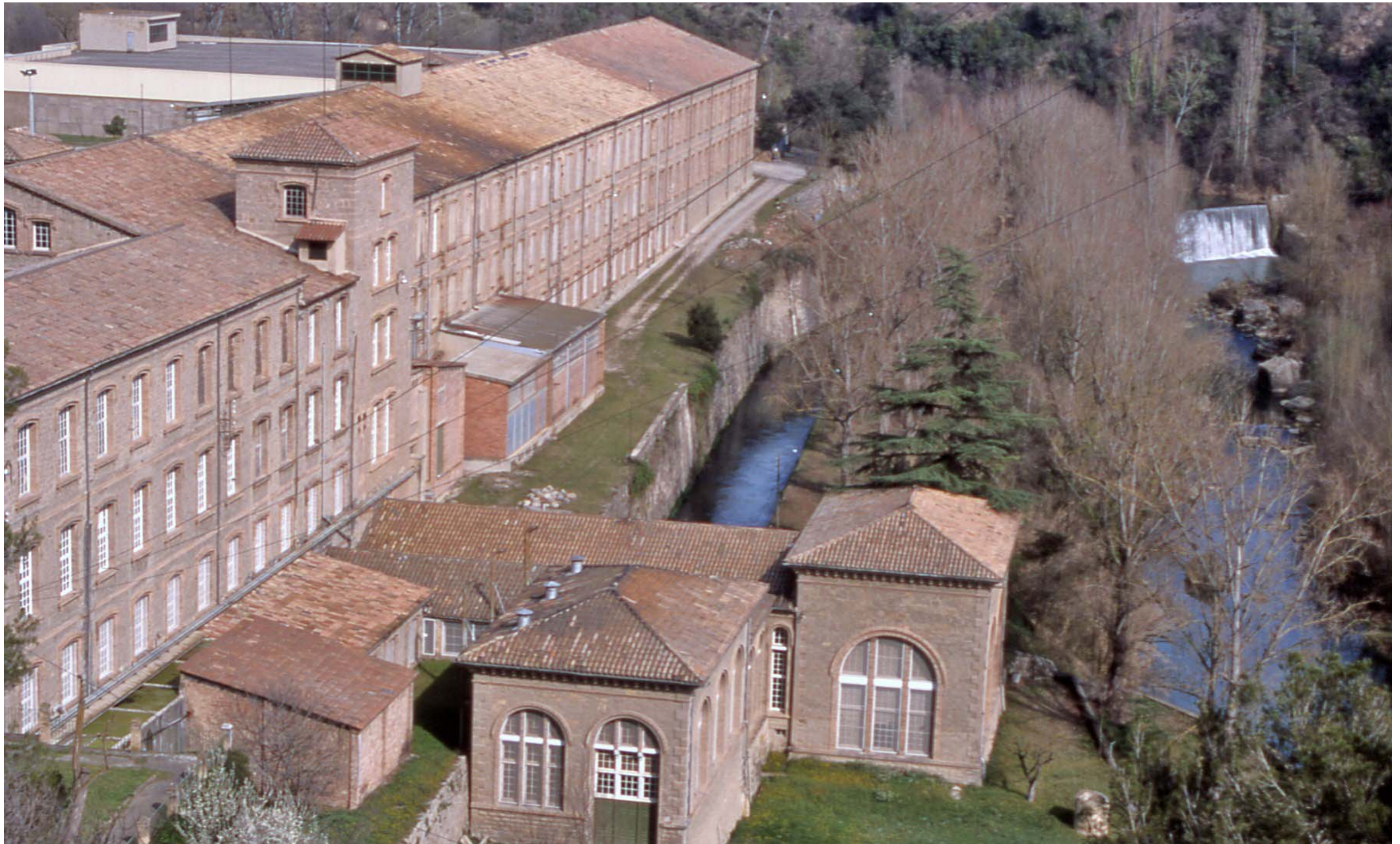
Figura 11.6. Cal Marçal, exemple de colònia tèxtil a la riba del Llobregat. Puig-reig. Replans del Berguedà.