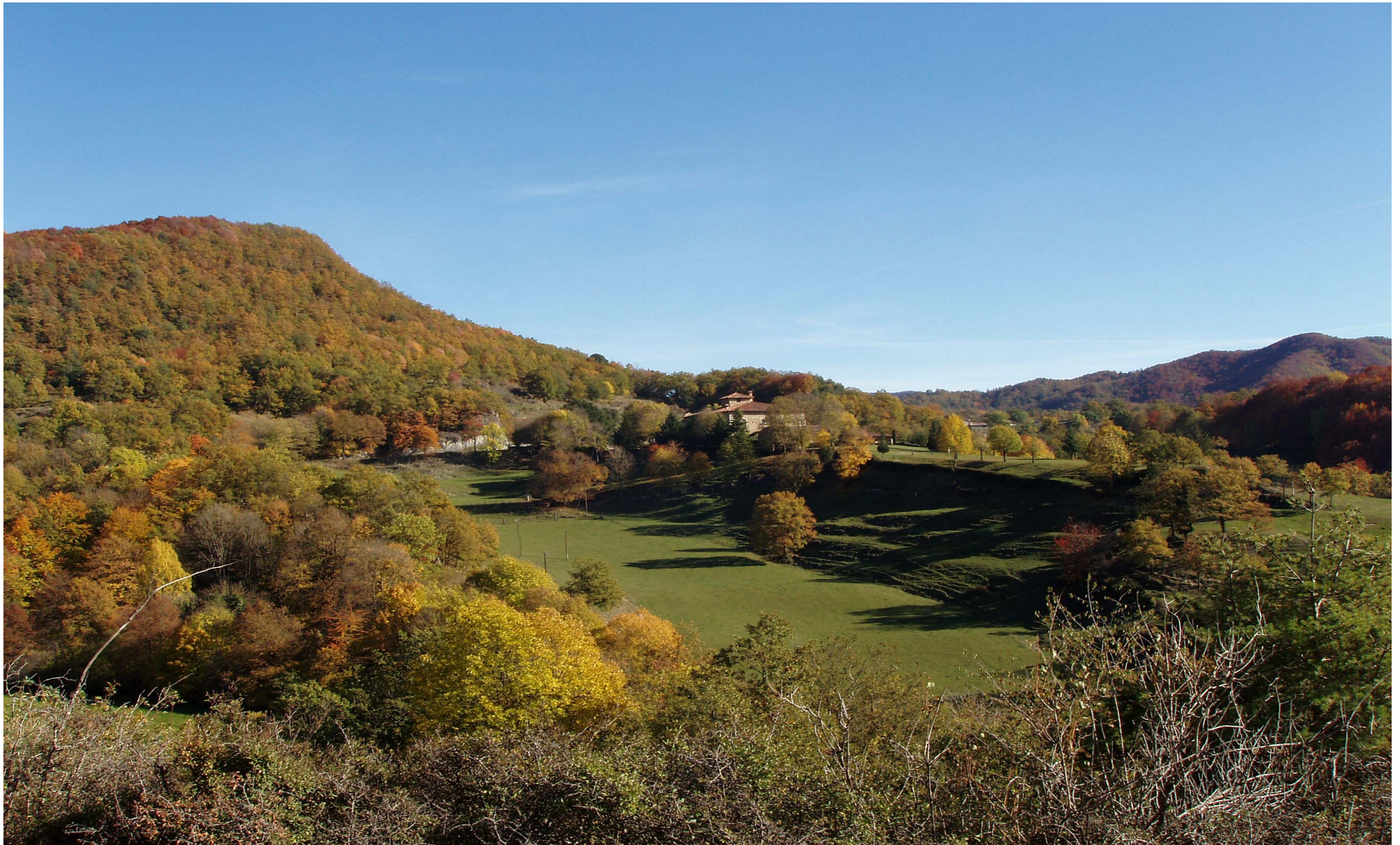
Figura 11.11. Paisatge agroforestal a Vidrà. Cabrerès-Puigsacalm.