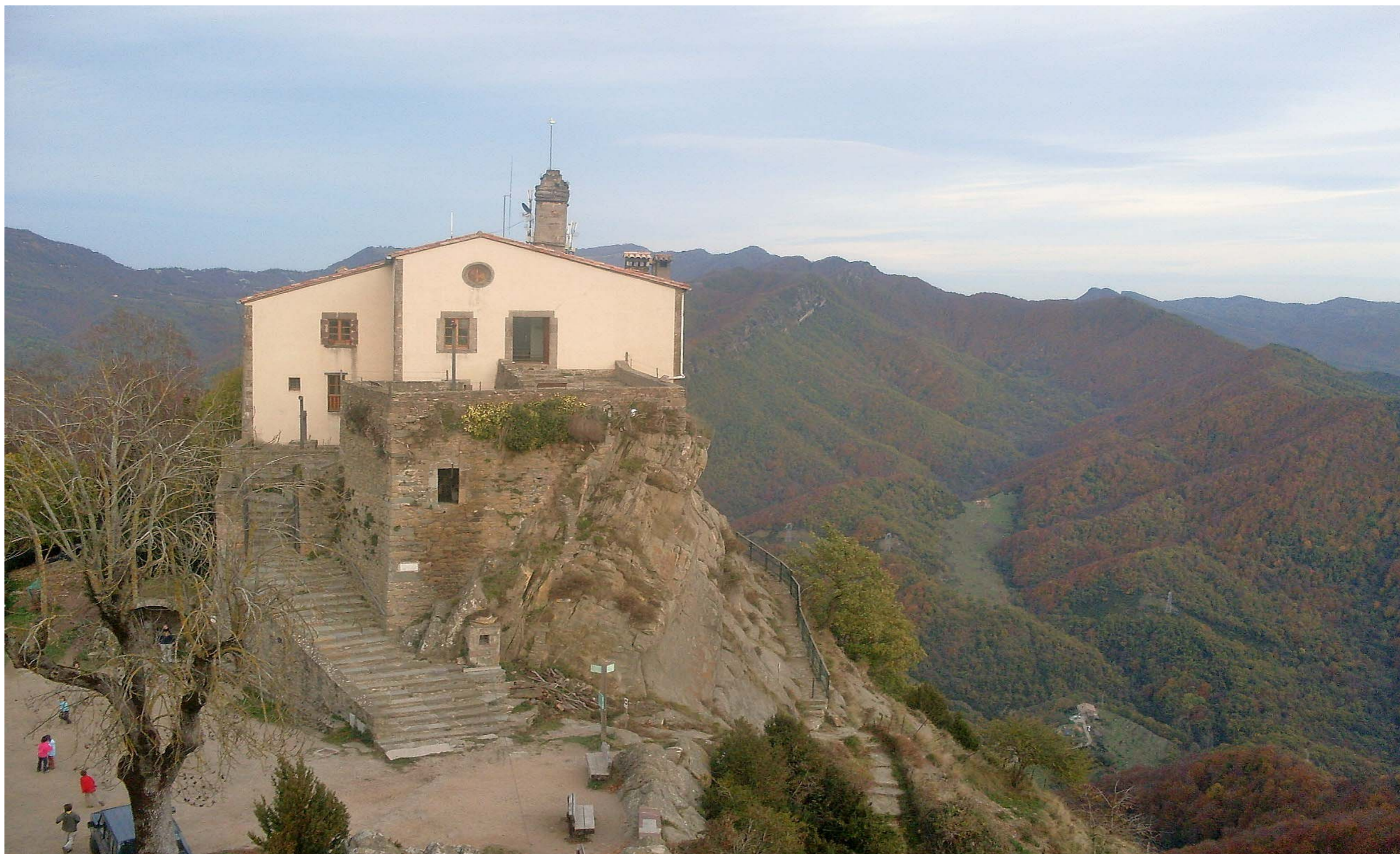
Figura 11.12. El santuari de Bellmunt. Sant Pere de Torelló. Cabrerès-Puigsacalm.