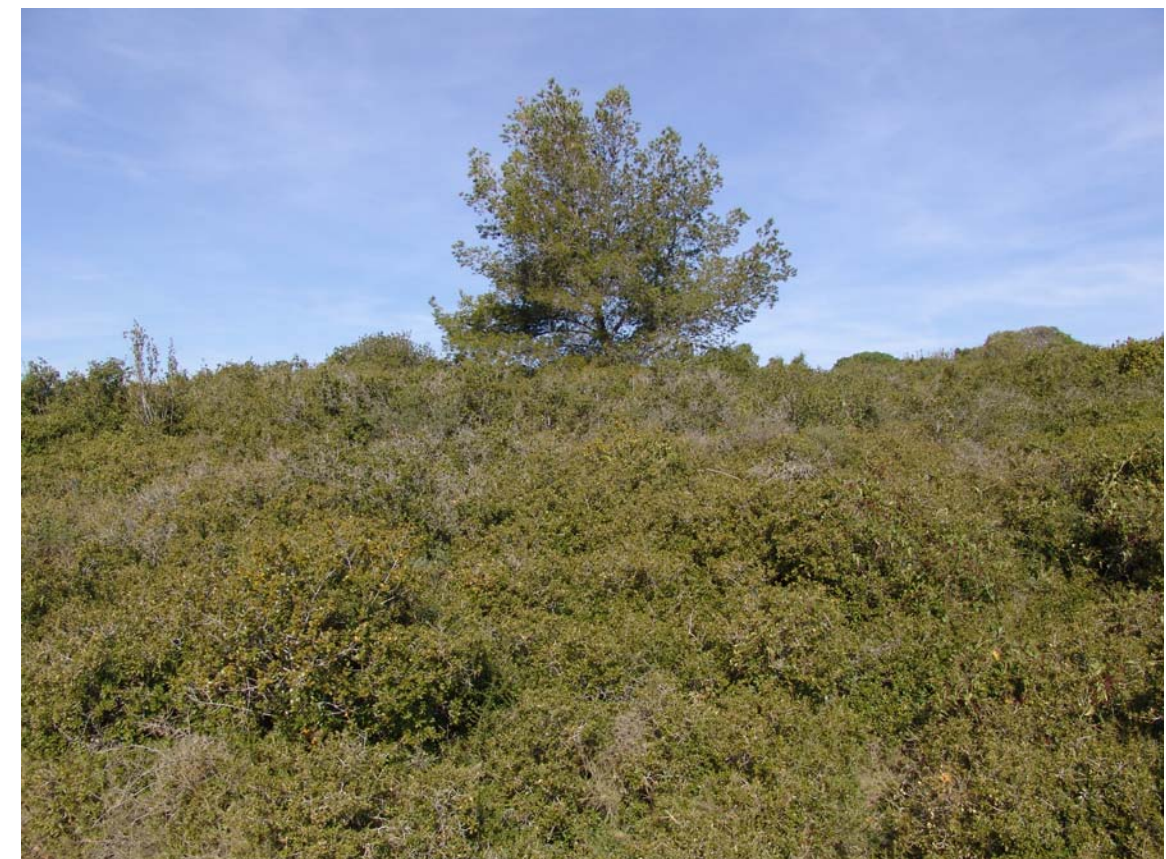
Figura 10.1: Les brolles i garrigues colonitzaran en una primera fase els conreus abandonats.

El manteniment dels valors inherents a aquests paisatges dependrà, entre altres polítiques proactives, de l'adopció de tasques conscienciació paisatgística i del compliment íntegre de la legislació ambiental i paisatgística existent (Llei 9/1985 d'espais naturals, Llei 9/1995 de regulació d'accés motoritzat als espais naturals i les modificacions introduïdes mitjançant la