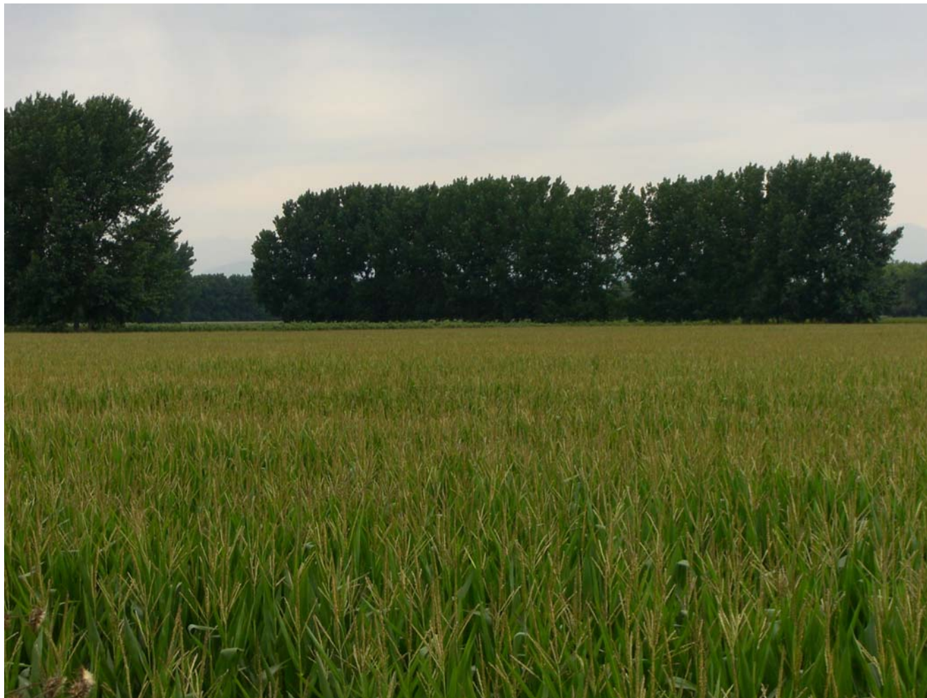
Figura 10.4: La política agrària comunitària (PAC) influirà sobre les dinàmiques i evolució del paisatge agrari. Camps de blat de moro a l'Empordanet.

La davallada del sector agrari gironí es va iniciar a mitjans del segle XX, període a partir del qual s'anà produint un llarg degoteig d'abandonament de l'activitat agrícola. Actualment, tot i que l'envelliment de la població agrària és molt acusat, s'està produint una redefinició de les explotacions, un augment de la seva superfície mitjana, canvis en la producció i una intensa mecanització del sector. Als espais muntanyencs, la zona més afectada per aquest procés, les poques explotacions agrícoles que encara queden tendeixen a la desaparició. La supervivència d'explotacions a muntanya anirà lligada, possiblement, a la diversificació de les activitats, és a dir, a la combinació de la producció agrícola amb una orientació preferent cap a la producció de productes autòctons o amb denominació d'origen, amb activitats vinculades a l'educació ambiental o al turisme rural.