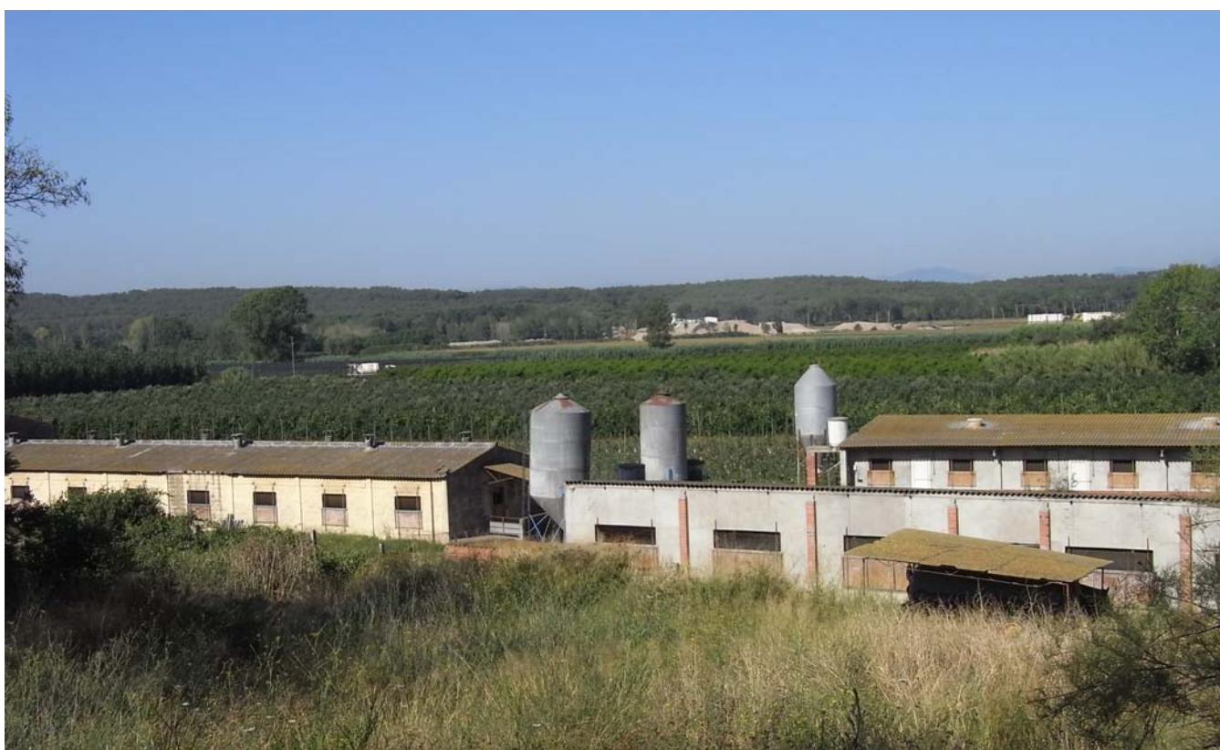
Figura 10.5: Granges de bestiar porcí prop de Jafre.

L'activitat ramadera de caràcter intensiu continuarà essent de ben segur un sector important a l'àmbit, especialment a les planes de l'Alt i Baix Empordà, Pla de l'Estany i plana de la Selva. Els impactes que genera avui en alguns paisatges rurals fan necessari l'establiment de mesures correctores que en permetin una millor integració paisatgística i ambiental. L'efecte dels nitrats, provinents dels purins, és un dels principals impactes. A banda dels problemes de potabilitat de l'aigua d'alguns aqüífers (especialment al Baix Empordà i al Pla de l'Estany), la seva dinàmica està generant una modificació de la diversitat de la flora i la fauna.