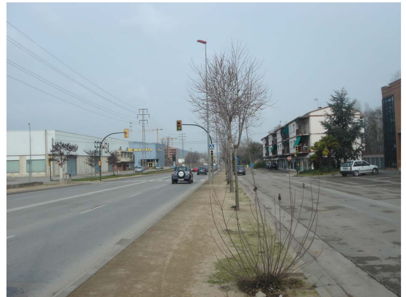
Figura 10.8: Paisatge periurbà a l'àrea urbana de Girona.

Les disposicions de la Llei d'urbanisme i la implementació del planejament territorial i urbanístic supramunicipal (PDUSC, Pla territorial parcial de les Comarques Gironines (PTPCCGG), Pla director territorial de l'Empordà, Pla urbanístic del sistema urbà de Girona, del sistema urbà de Figueres, del Pla de l'Estany, així com normativa nova com ara la Llei d'equipaments comercials)