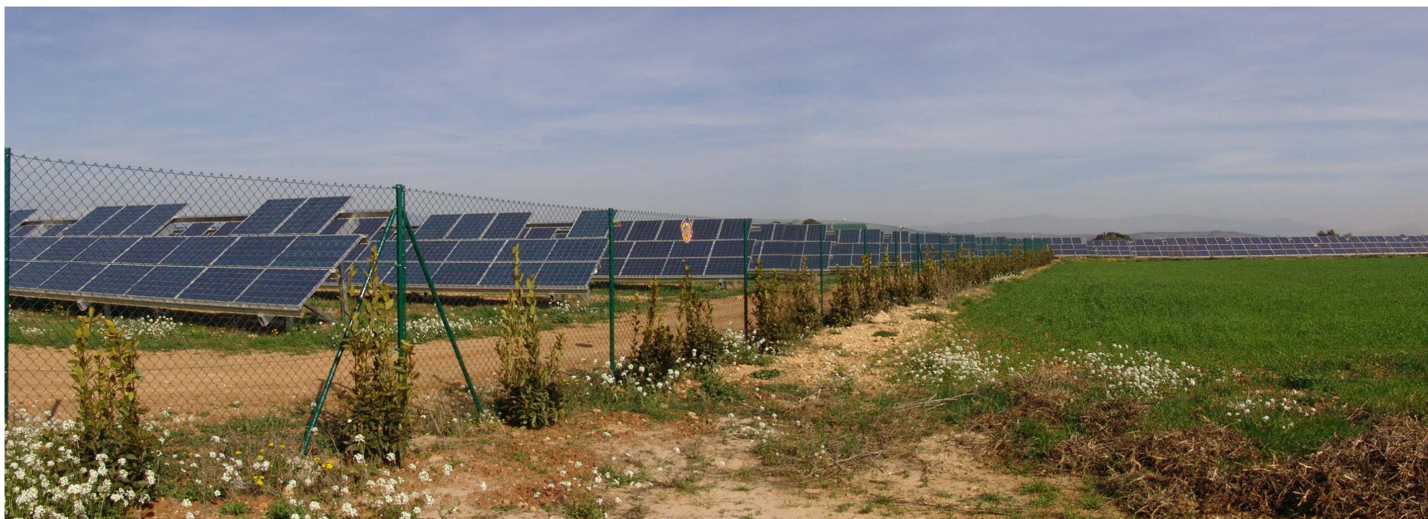
Figura 10.11: Hort solar a l'Alt Empordà.

Per la seva banda, a l'àrea urbana de Figueres, el creixement del Centre de Logística Intermodal LOGIS Empordà al Far d'Empordà com a gran plataforma logística de transport de mercaderies anirà acompanyada d'altres operacions de gran envergadura, com l'anell d'infraestructures de l'oest de la ciutat (A-2, TAV i ferrocarril convencional), que tindrà el seu punt neuràlgic en la nova estació de l'AVE Figueres-Vilafant. En tercer lloc, a l'àrea de l'enllaç entre l'AP-7 i l'autovia C-35 en el triangle Maçanet de la Selva-Vidreres-Sils, on hi ha el polígon Trety SA és previsible un augment de la demanda d'implantació de noves activitats econòmiques de Maçanet de la Selva. Per altra banda, en un futur podrien desenvolupar-se noves àrees allà on l'avantprojecte del PTPCG ha delimitat reserves de sòl de potencial interès estratègic. Aquestes zones són: el polígon industrial de la Banyeta (municipis de Palol de Revardit i de Cornellà del Terri) i les estacions d'esquí de Núria i Vall Ter.