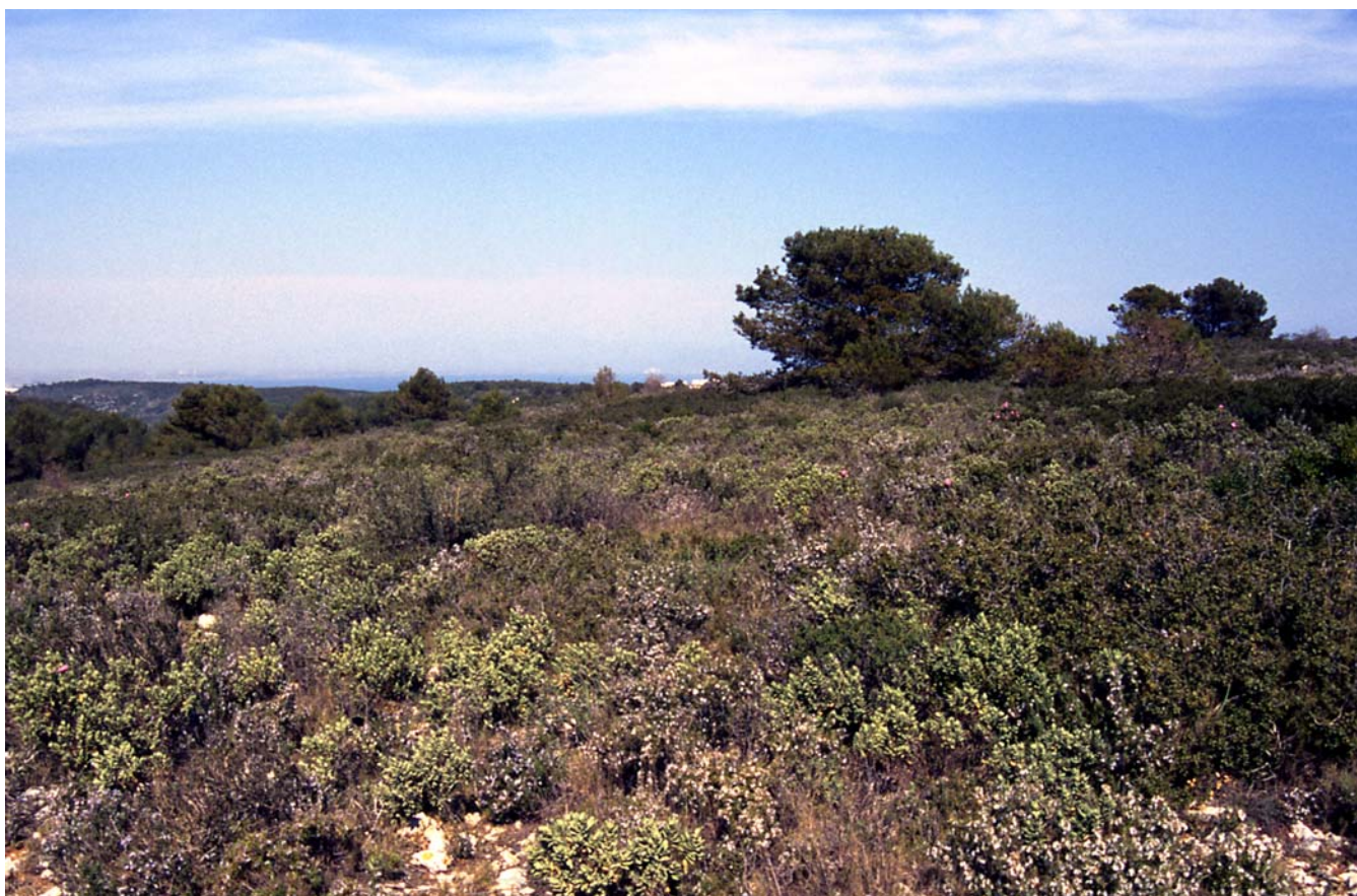
Figura 10.3: Les formacions arbustives com aquesta brolla del Montgrí, seguiran sent molt vulnerables al risc d'incendi forestal.

el foc ha estat sempre un dels agents principals en el modelat del paisatge, en les darreres dècades s'ha produït un augment significatiu, tant de la recurrència com de la intensitat, dels incendis forestals. Les causes d'aquest augment són tant de tipus natural com social. Els canvis en l'estructura física dels boscos, producte de la desaparició dels aprofitaments tradicionals, o la major presència de factors de risc (línies elèctriques, presència humana) són els principals factors que expliquen aquesta tendència general a l'augment del risc d'incendi.