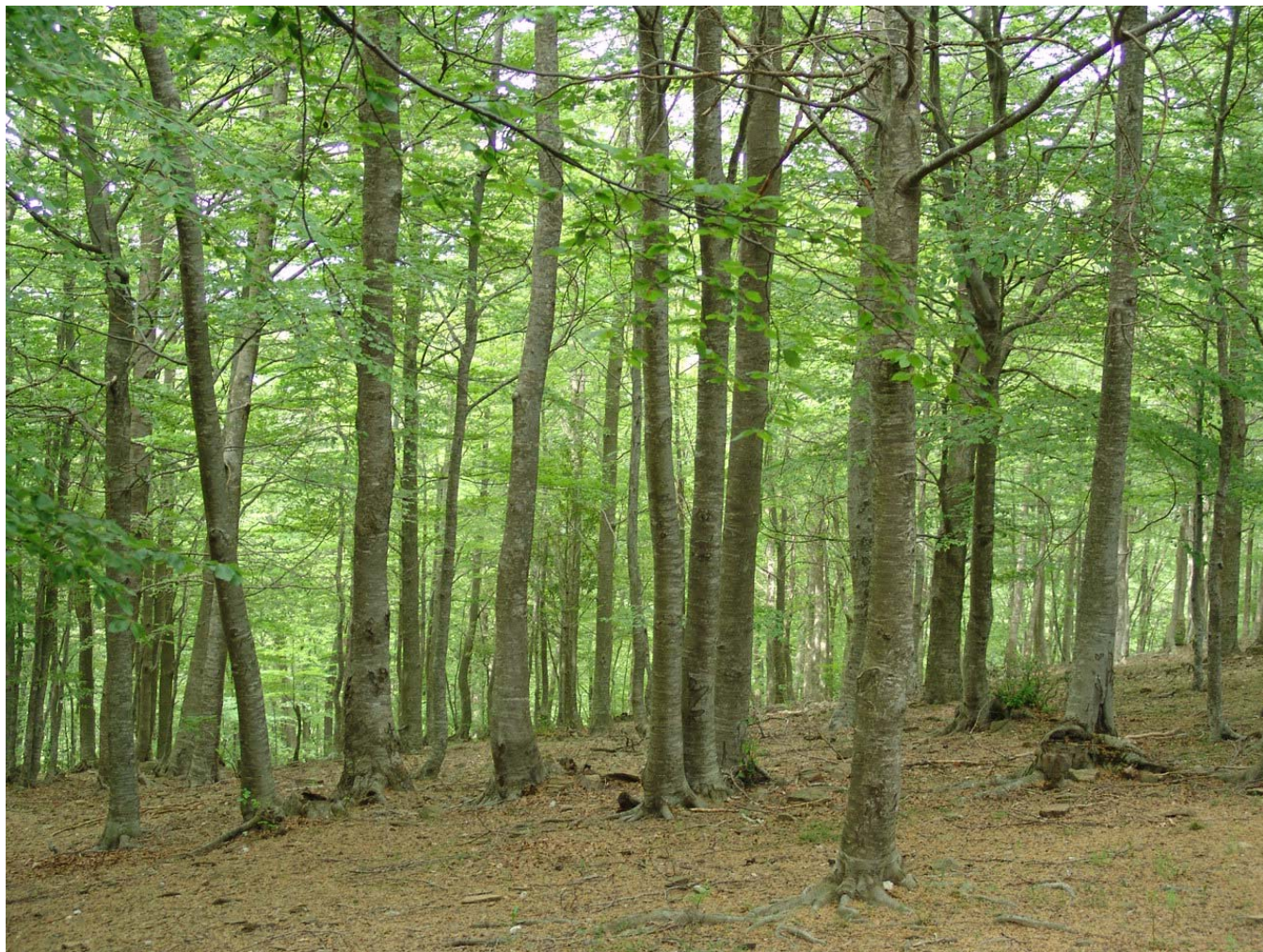
Figura 10.2: Els boscos caducifolis com aquesta fageda del Montseny, es veuran afectats pel canvi climàtic.

Pel que fa a la distribució de les diferents espècies forestals, a les Comarques Gironines es detecta un major augment de les frondoses, mentre que les coníferes estan en un lleuger retrocés. Aquest canvi es deu en bona mesura a la disminució de la pràctica de plantar noves pinedes, i la seva substitució pels boscos climàtics de terra baixa: l'alzinar i la sureda principalment. Així, les espècies amb major presència són l'alzina, l'alzina surera, el pi roig i el pi blanc. El roure de fulla gran i el pinastre són dues espècies que estan també en expansió, mentre que el castanyer està en un retrocés important. Aquest fet es deu a l'afectació de les plagues del xancre i la tinta sobre aquesta espècie.