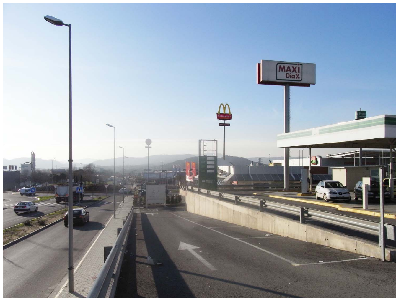
Figura 10.9: Paisatge periurbà a Blanes.

auguren un reforçament de la compacitat dels nous creixements però no un control de les dinàmiques de mercat que es puguin produir, cada cop més canviants. Així, la crisi econòmica està significat una dràstica aturada del sector immobiliari i, per tant, de l'expansió urbana. Ara bé, és previsible que la recuperació econòmica activi de nou un creixement urbanístic que hauria d'evitar algunes dinàmiques perniciosos, com el consum massiu de sòl o la pèrdua del caràcter del paisatge urbà i rural per manca d'integració, o la banalització de les noves extensions urbanes. Les dinàmiques de mercat tendiran a reforçar els nuclis i ubicacions situats al llarg dels corredors de les vies de comunicació i això pot incidir en la transformació de les entrades als municipis. Finalment, a banda de la dinàmica endògena caldrà tenir en compte la influència de la regió metropolitana de Barcelona, l'extensió de la qual avança sobre l'àrea de Blanes - Lloret i la Plana de la Selva, i que tindrà un impacte en l'augment de la demanda de sòl per al creixement urbà. Així mateix, la implementació del tren d'alta velocitat, pot produir un efecte similar a l'àrea urbana de Girona.