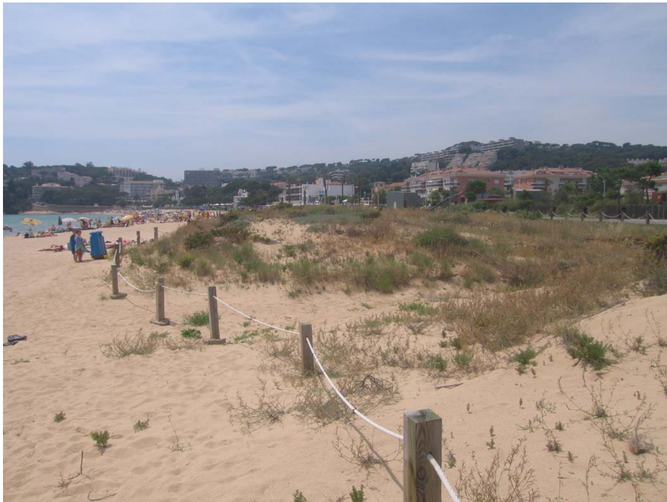
Figura 10.10: Protecció del cordó dunar a la platja de Sant Pol, Sant Feliu de Guíxols.

de visitants a curt termini, per tant, és d'esperar que el nombre d'equipaments turístics no augmenti considerablement en un futur proper. És més provable una progressiva reforma i transformació d'instal·lacions hoteleres obsoletes que la construcció de nous equipaments, així com un reforçament dels serveis i els equipaments culturals per enriquir qualitativament l'oferta turística.