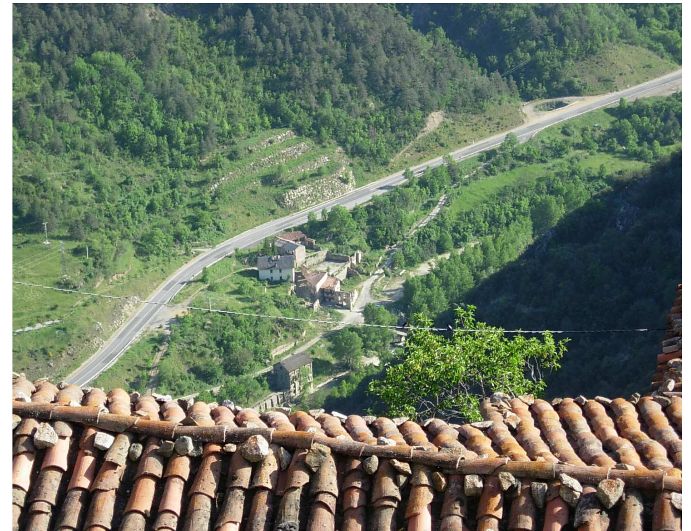
Figura 9.5. El Segre, al seu pas pel Baridà, ofereix imatges que demostren l'efecte destructiu de les seves aigües i de la inestabilitat dels seus vessants, com el cas del Pont de Bar vell durant els aiguats del 1982

més pressionats urbanísticament. D'una banda, aquesta pressió incrementa el risc d'inundació, sobretot als trams urbans dels rius Segre, Noguera Pallaresa, Flamicell i Garona, potencialment molt destructius com ja es va comprovar amb els aiguats del 1982. D'altra banda, la proliferació de polígons industrials i noves trames urbanes poc o gens integrats en el paisatge i l'arquitectura local tradicional, contribueixen a la banalització del paisatge i a l'increment d'un efecte carretera-aparador reproduït a molts indrets urbans del territori català