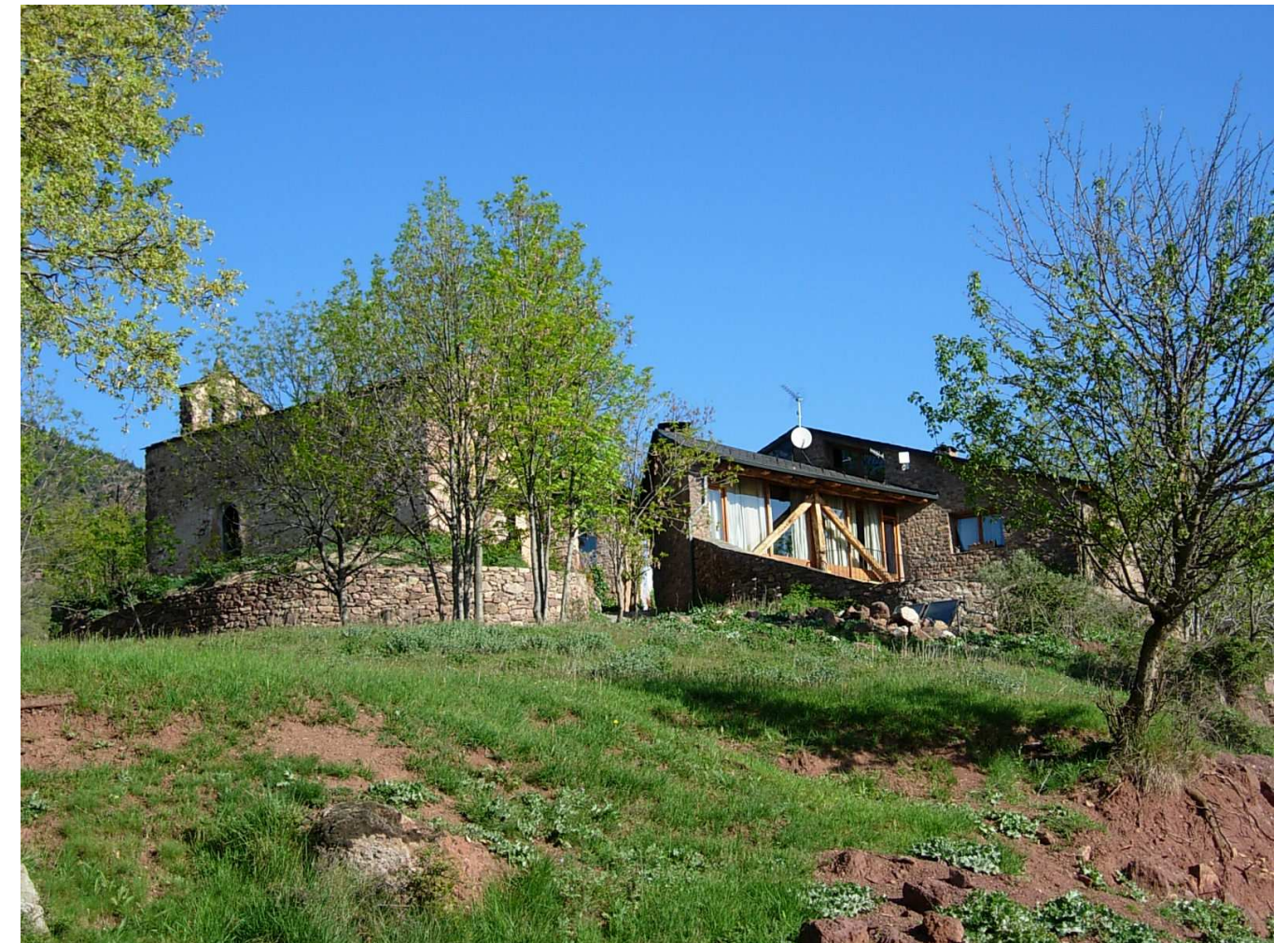
Figura 9.3. Alguns pobles de les valls d'Aguilar han sabut aprofitar turísticament el paisatge dels poblets del silenci i la tranquil·litat a través de diverses iniciatives de turisme rural