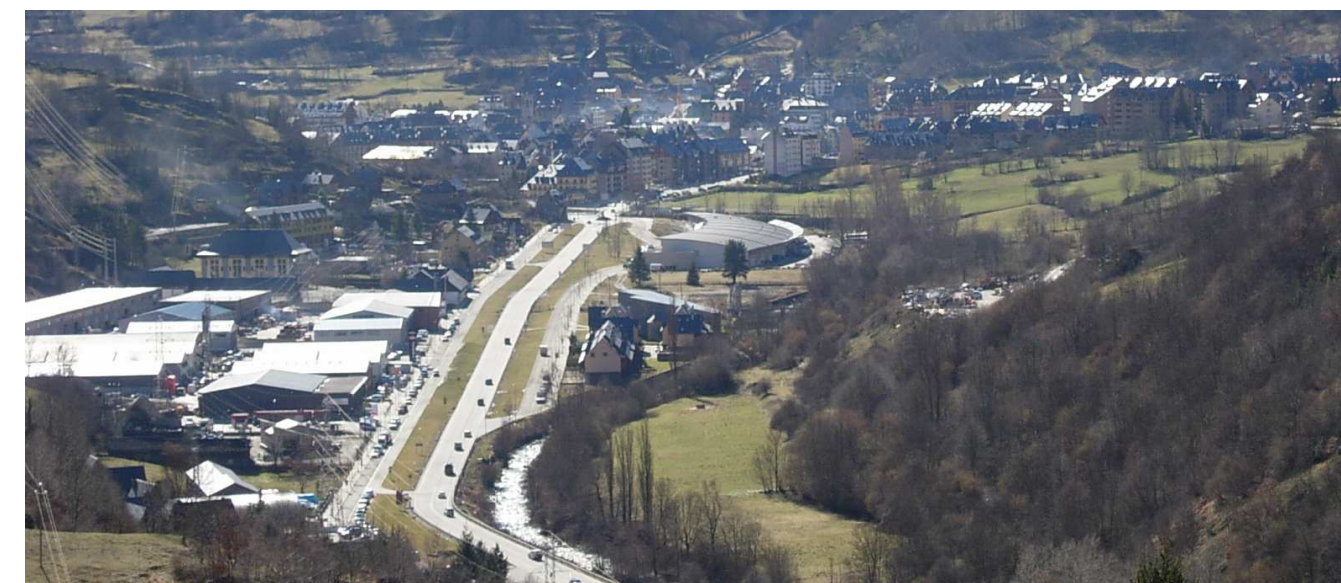
Figura 9.7. Accés nord al nucli urbà de Vielha on es poden apreciar polígons de caràcter comercial al fons de vall

Finalment, cal fer una menció especial a la influència del turisme en el desenvolupament urbà del terme municipal de La Seu d'Urgell. Si bé el turisme directe que rep és poc potent encara que existent (amb el centre històric, La Seu i el Parc del Segre), és la seva situació privilegiada com a zona de pas cap a Andorra la que condiciona un turisme indirecte molt influent, amb una potencialitat futura molt important. Paradoxalment, La Seu d'Urgell, no ha estat el nucli principal del terme que ha crescut més per la incidència del turisme, sinó que han estat nuclis pròxims més petits, com el de Montferrer, els que, en forma d'urbanitzacions residencials construïdes a les vessants de muntanya o en «balconada», han estat més agressius amb el paisatge.