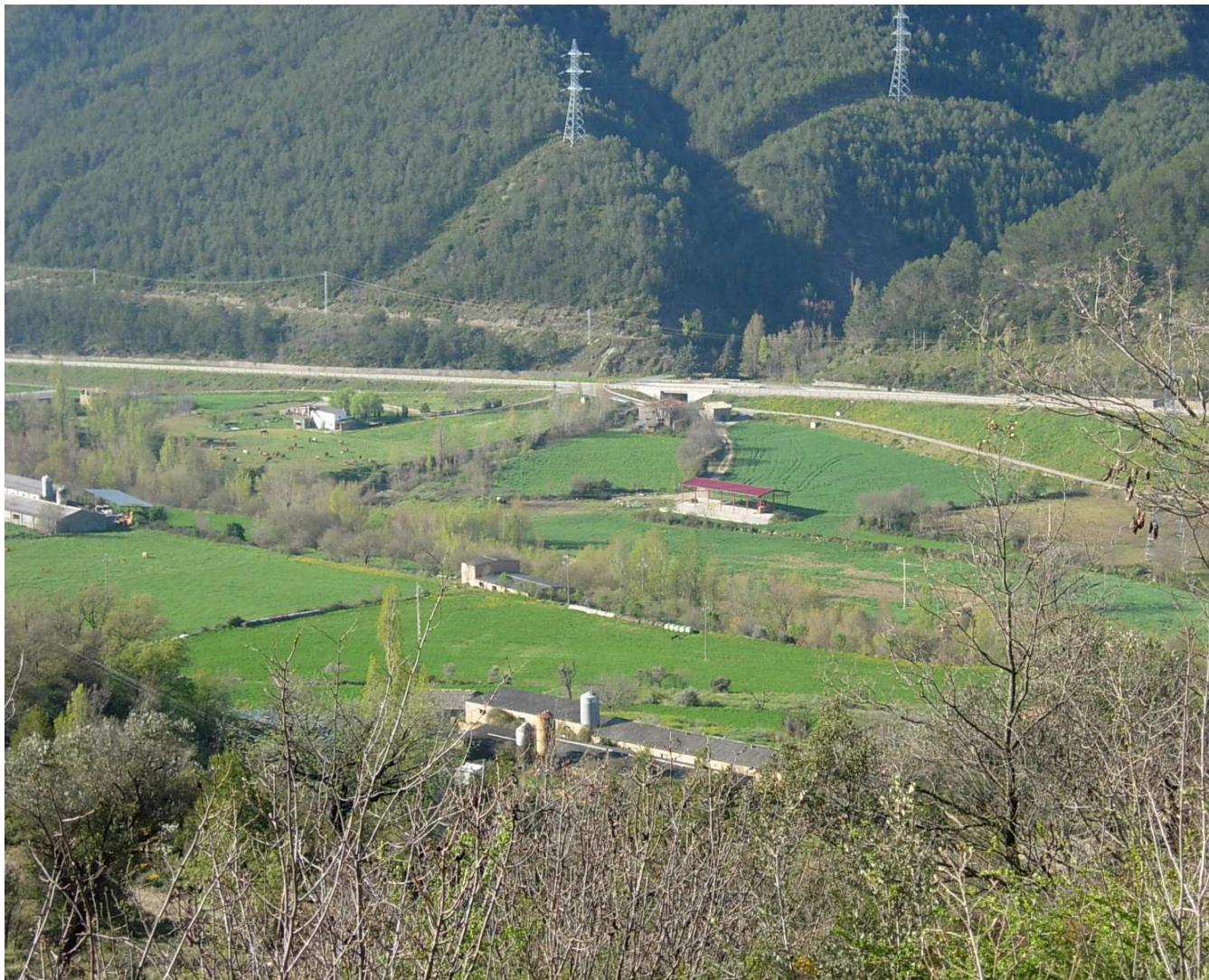
Figura 9.4. Prats de regadiu i ramaderia intensiva a la plana al·luvial del Flamisell, a la vora de la Pobla de Segur, amb la presència d'algunes granges disseminades