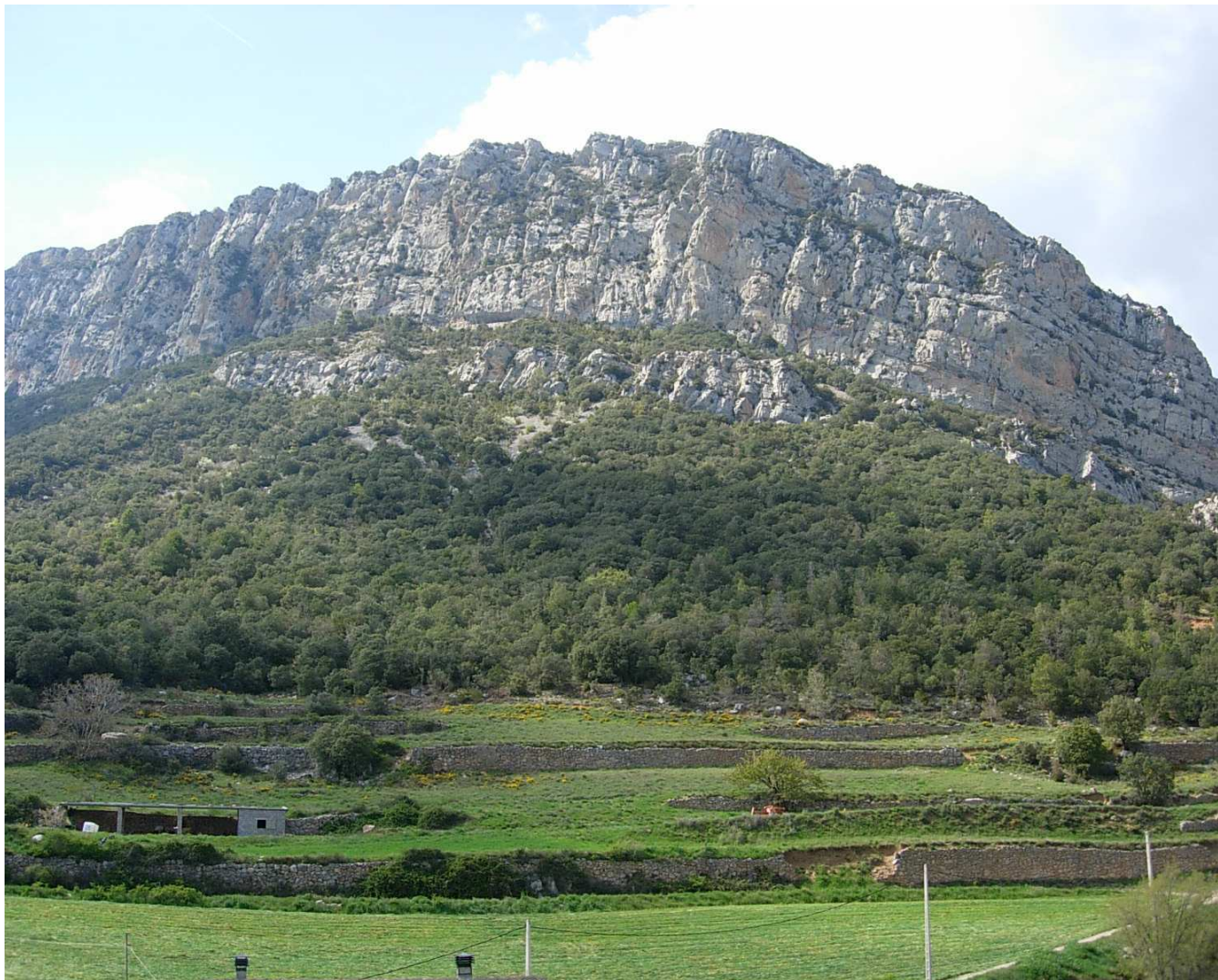
Figura 9.2. Les feixes dels antics camps que envolten els indrets habitats són un testimoni històric de l'aprofitament extensiu del territori que cada cop va quedant més restringit a la vora de les poques àrees amb explotació ramadera

Si bé encara existeixen vestigis d'una activitat econòmica més diversa, com són les explotacions salines o extractives o l'aprofitament hidroelèctric, actualment es preveu que sigui el turisme rural la potència econòmica d'aquest àmbit, com ho ha estat en zones veïnes, però sense substituir completament l'actual model basat en les pistes d'esquí, sinó complementant-lo. Cal afegir que, paradoxalment a l'abandonament agrícola, cada vegada és més freqüent un nou moviment migratori de la població urbana cap al món rural, establint comunitats neorurals que reviu antics nuclis destinats a desaparèixer, com ha passat a Ossera o Castellar de Tost.