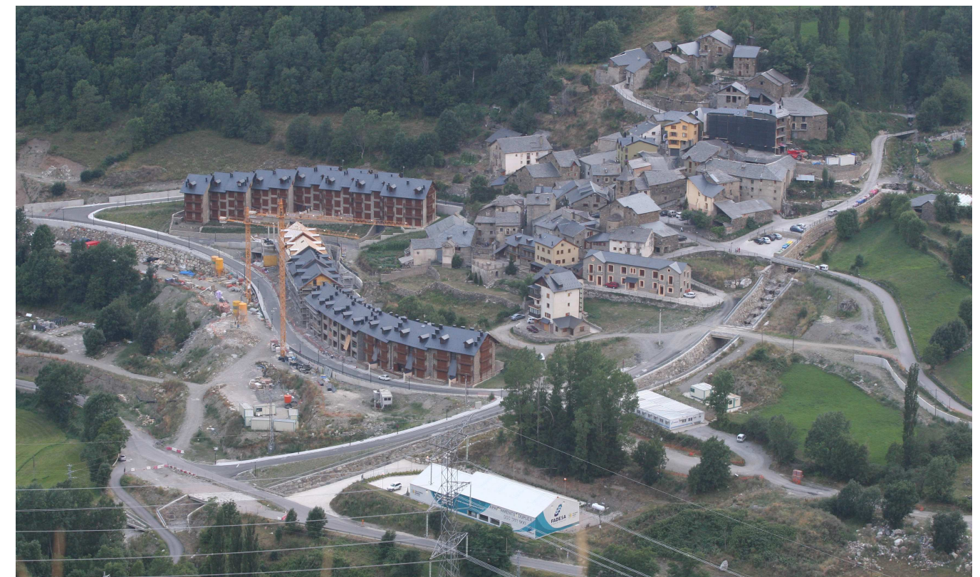
Figura 9.6. Noves construccions al nucli d'Espui, a la vall Fosca, que alteren la seva fesomia tradicional i distorsionen el clar límit entre l'espai construït i l'espai obert que hi sol haver en els nuclis petits i compactes del Pirineu

Pel que fa als nuclis més petits, tot i que la dinàmica d'abandonament d'aquests assentaments és si fa no fa la mateixa arreu del territori pirinenc, en les dinàmiques d'expansió dels nuclis en creixement es poden distingir dues situacions: aquelles que s'han desenvolupat com a conseqüència del creixement dels sectors primari i secundari i aquelles que ho han fet principalment pel turisme.