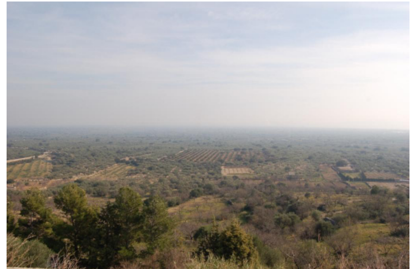
Figura 8.11. Vistes des del mirador de Mas de Barberans sobre la Plana del Baix Ebre-Montsià.