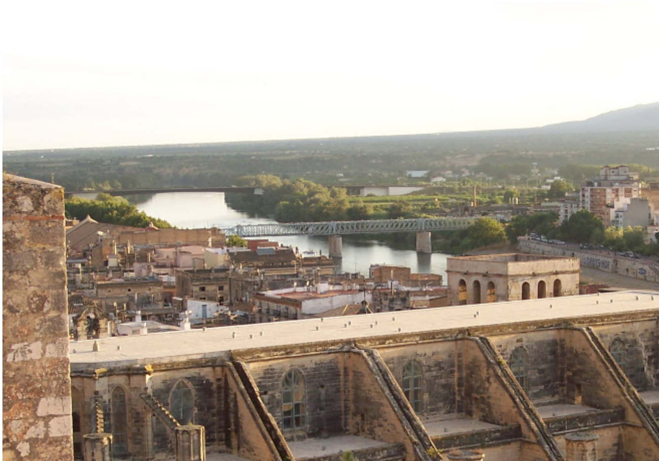
Figura 8.10. Vistes des del castell de la Suda, amb la catedral de Tortosa en primer terme.