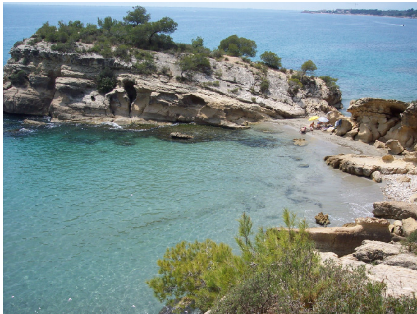
Figura 8.6. Fragment del paisatge litoral del Baix Ebre que es pot contemplar des del GR-92 al seu pas pel municipi de l'Ametlla de Mar.

Ebre pel pont penjat i resseguir les terrasses fluvials de l'Ebre fins Campredó, on s'enfila pels vessants del coll de l'Alba, entre restes d'antics conreus d'olivera sobre marges de pedra seca, per acabar ascendint fins les escarpades i descarnades moles litorals de la serra del Boix. Des d'aquí descendeix bruscament fins als mosaics agroforestals dels Burgans, per acabar enfilant-se cap als barrancs, moles i cingles de les Muntanyes de Tivissa-Vandellòs.