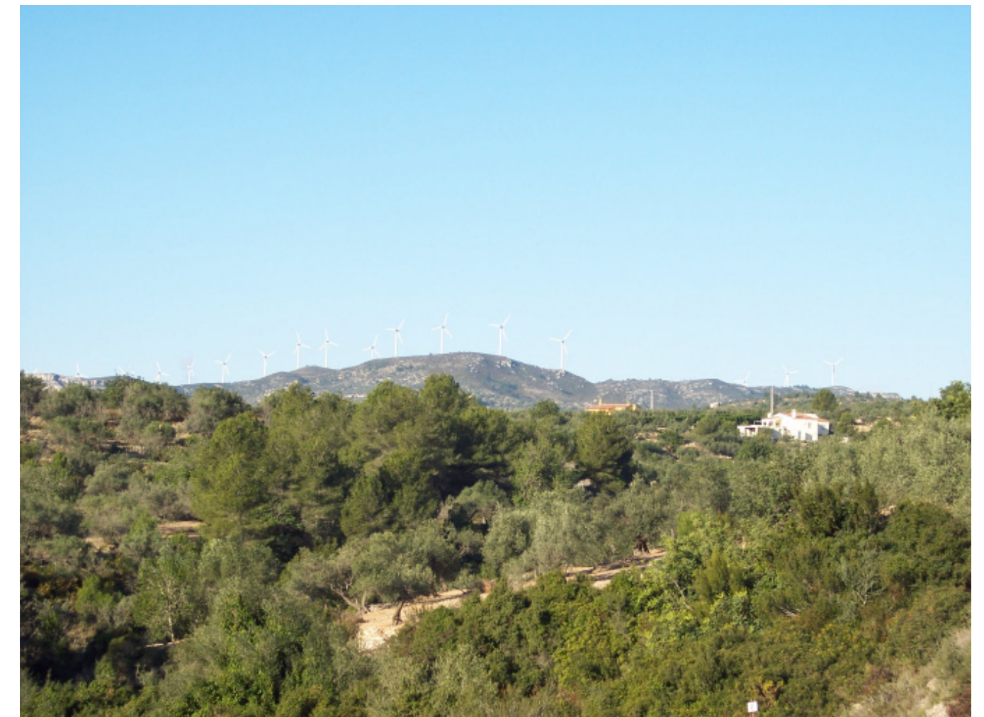
Figura 8.3. Els aerogeneradors, els conreus d'oliveres i l'assentament disseminat, són tres dels elements del paisatge que es poden observar durant bona part del recorregut de la carretera N-340 per les Terres de l'Ebre, especialment quan passa pel litoral del Baix Ebre.

Les altres rutes motoritzades que permeten contemplar i gaudir dels paisatges del conjunt de les