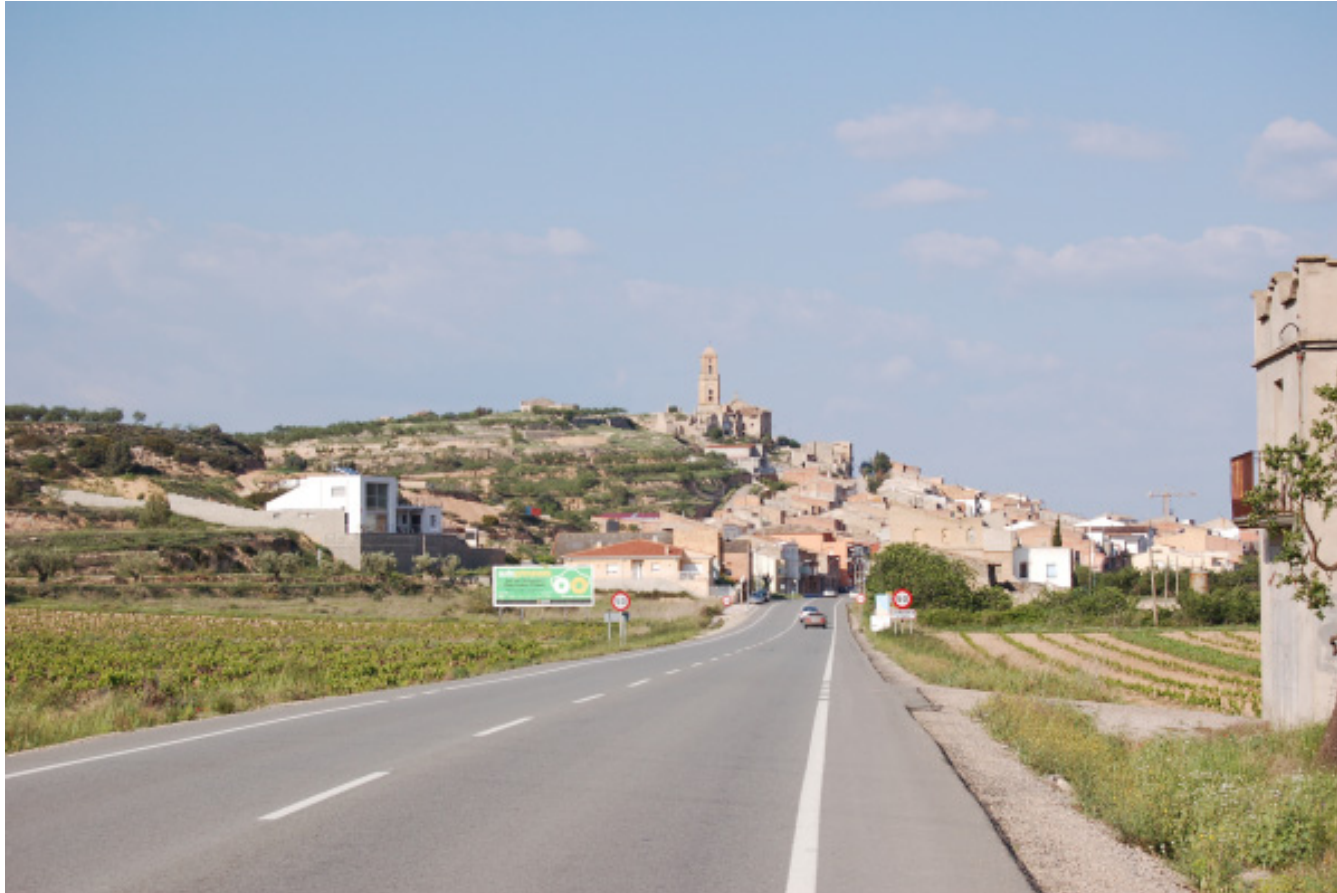
Figura 8.2. Vistes del nucli urbà de Corbera i el Poble Vell des de la carretera N-420, en direcció a Móra d'Ebre.

La N-340, entre Alcanar i l'Almadrava , passant per les Cases d'Alcanar, Sant Carles de la Ràpita, Amposta, l'Aldea, Camarles, l'Ampolla, el Perelló i l'Ametlla de Mar, fa un recorregut pel sector litoral de les Terres de l'Ebre, recorrent-lo de sud a nord, i recorrent els vessants marítics de les Serres de Montsià-Godall, el Paisatge fluvial de l'Ebre en el sector del pre-Delta, i el litoral del Baix Ebre. Així mateix, des de diversos punts del recorregut, quan la carretera agafa una relativa alçada, s'obtenen àmplies panoràmiques sobre el conjunt del Delta de l'Ebre i de les seves puntes (de la Banya i del Fangar). Resseguint aquesta carretera, es poden contemplar: