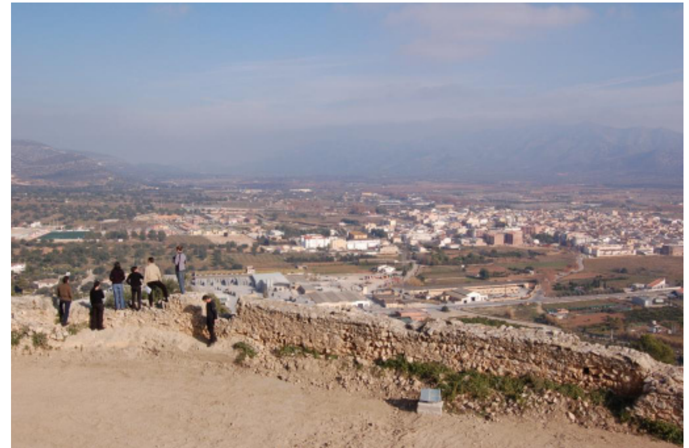
Figura 8.9. Vistes des del mirador del Castell d'Ulldecona, sobre la foia d'Ulldecona i les Serres de Montsià-Godall.

amb vistes dels barrancs i camps d'oliveres marginades del sector sud de les Serres de Cardó-Boix, de la part meridional del Delta de l'Ebre, del el Paisatge fluvial de l'Ebre en el sector densament urbanitzat de Tortosa-Roquetes, de la plana del Baix Ebre-Montsià, de la façana est dels Ports, i dels vessants septentrionals de les Serres de Montsià-Godall.