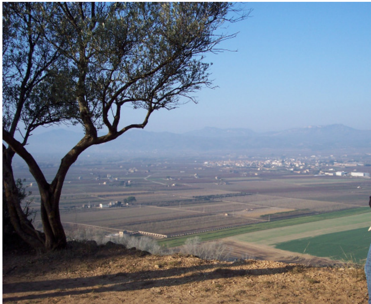
Figura 8.8. Vistes des del mirador del poblat iber del Castellet de Banyoles, al municipi de Tivissa, sobre la Cubeta de Móra i les Serres de Pàndols-Cavalls.