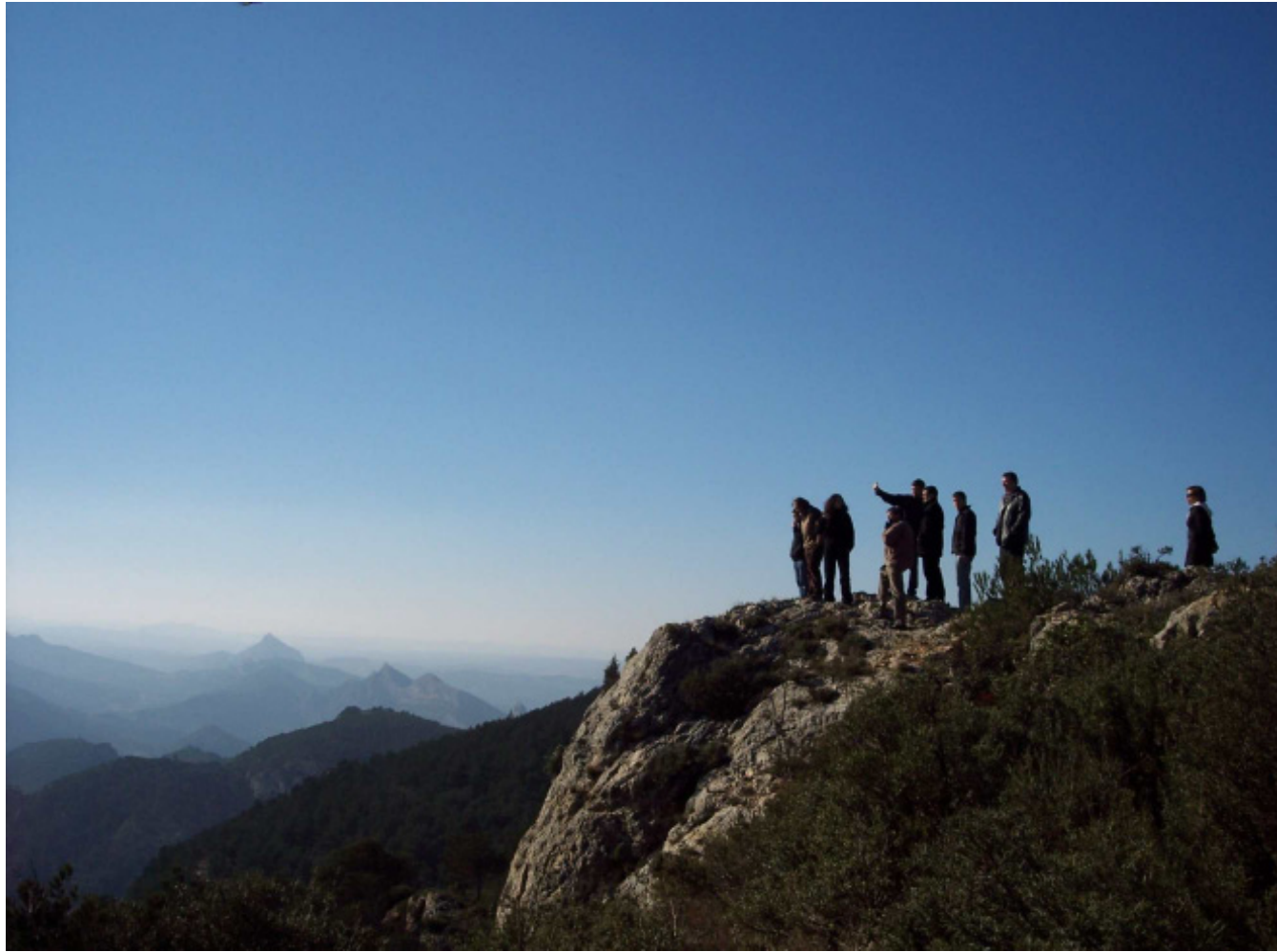
Figura 8.12. El mirador de la cota 705 a la serra de Pàndols és el que permet contemplar més quantitat de paisatges diferents de les Terres de l'Ebre.

Darrerament, des de la Direcció General de Carreteres de la Generalitat de Catalunya, s'estan habilitant a la vora de la carretera C-12 (Eix de l'Ebre), entre Tortosa i Móra la Nova, un seguit de miradors i llocs de repòs. De moment, estan adequats els de Xerta, el de l'Assut de Xerta, el de l'estret de Barrufemes i el de l'estret del Pas de l'Ase. Els dos primers permeten contemplar de prop diversos racons del Paisatge fluvial de l'Ebre (inclòs l'assut de Xerta-Tivenys), el de Barrufemes ofereix panoràmiques sobre el riu Ebre i les seves espectaculars vessants excavades en la roca calcària. El mirador del pas de l'Ase permet contemplar el riu Ebre al seu pas per la Serra del Tormo, així com el sector meridional dels Costers de l'Ebre, amb la contundent vista de la torre de refrigeració de la Central Nuclear d'Ascó.