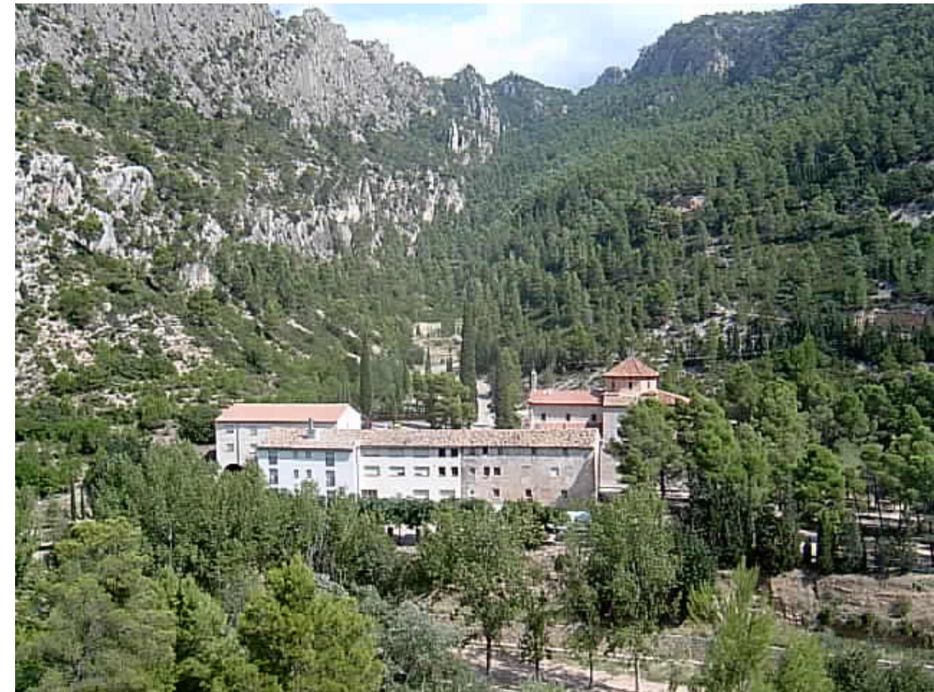
Figura 8.4. Vistes del santuari de la Fontcalda des de la Via Verda de la Terra Alta, al seu pas per les Serres de Pàndols-Cavalls.

El tram de la Terra Alta són 23 quilòmetres que transcorren entre Arnes i el Pinell de Brai, passant pels termes d'Horta de Sant Joan, Bot, Prat de Compte, Gandesa. És possible contemplar els paisatges de la ribera del riu Algars, part dels mosaics agroforestals de la foia de Bot, parets de pedra calcària de les Serres de Pàndols-Cavalls, i els engorjats del riu Canaleta, així com el Santuari de la Fontcalda (segle XVI), el convent de Sant Salvador d'Horta o l'ermita de Sant Josep de Bot. Un dels elements destacats del paisatge és precisament part de l'obra d'enginyeria que es va construir, com són els 5 viaductes i els 20 túnels que es van fer per salvar les serres i barrancs existents entre Bot i el Pinell de Brai. També són interessants els paisatges construïts que conformen el conjunt d'antigues estacions del ferrocarril, ara en un estat d'abandonament i deteriorament progressiu.