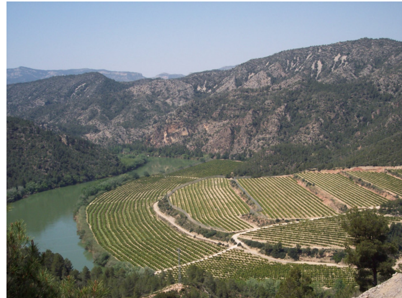
Figura 8.1. Vistes de l'estret de Barrufemes des de la carretera C-12.