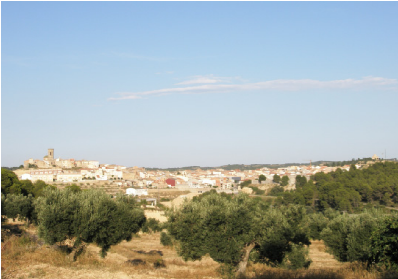
Figura 8.5. Vistes del nucli urbà de Batea i del mosaic agroforestal que es poden contemplar des del camí de Sant Jaume de l'Ebre al seu pas per aquest municipi.

- Via Augusta: és una ruta interessant per observar els diversos paisatges que es configuren en els sectors del litoral de les Terres de l'Ebre. A la Plana del Baix Ebre-Montsià es poden contemplar