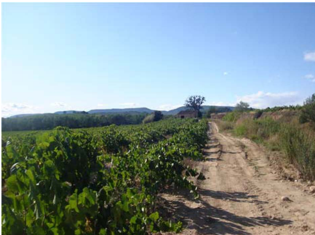
Figura 8.5: Els petits camins del vi i del cava del Penedès, un paisatge obert i acollidor.

El recorregut entre Badalona-Pavelló Penya a Montgat per l'autopista, prenent la sortida de Mongat i arribant fins a Mataró per la N-II. Aquest itinerari permet veure els usos històrics de la costa del Maresme: les activitats marineres tradicionals, com la llotja del peix a Montgat o alguns palauets de «marinos», l'edificació de segones residències o «torres» de la burgesia barcelonina, l'estiueig més popular com el de la platja d'Ocata, els conreus sovint en hivernacles i la residència suburbana de baixa densitat.