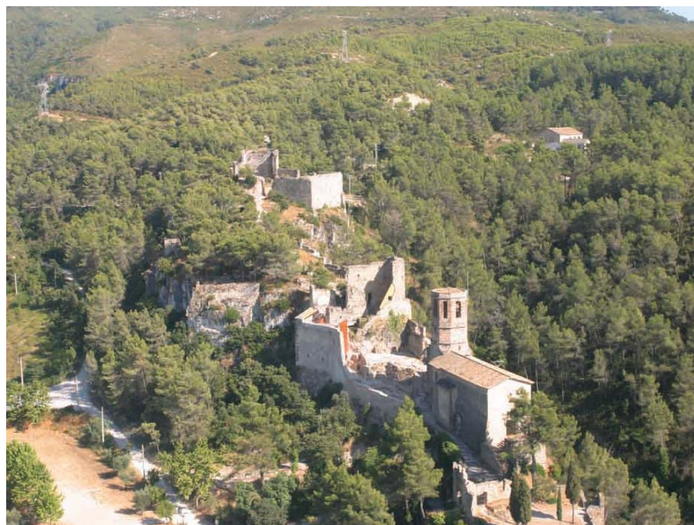
Figura 8.3: El castell de Gelida ofereix excel·lents panoràmiques sobre la Plana del Penedès.

4. Diversitat. Miradors des dels quals es poden percebre els principals valors del paisatge (naturals, estètics, històrics, socials, simbòlics...).