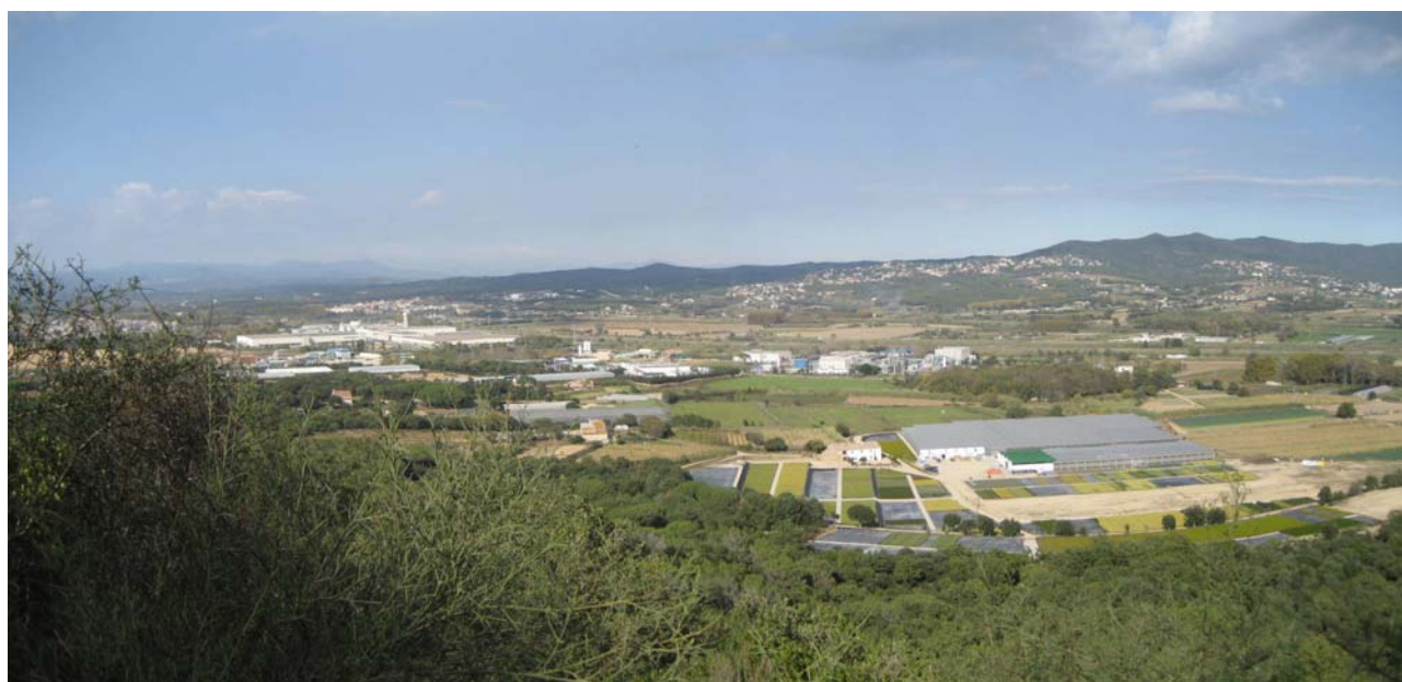
Figura 8.11: Panoràmica de la plana al·luvial del delta de la Tordera des del castell de Palafoles.

Al segon grup de miradors es troben aquells que ensenyen la part més natural i agrícola, i menys edificada del territori de la Regió. Aquests miradors se situen generalment a la serralada Prelitoral, especialment al Montseny (Turó de l'Home, Matagalls), Moianès (castell de Granera, el Pedrós, o a escala més local Santa Coloma Sasserra) i a Sant Llorenç de Munt, l'Obac i el Cairat, (miradors de la Mola i el Montcau). És especialment destacable el mirador del Turó de l'Home, per l'extraordinària panoràmica que ofereix de bona part de la Regió Metropolitana de Barcelona, especialment de les boscuries i relleus aixecats de les serralades Litoral i Prelitoral, així com el mirador de la Mola per les panoràmiques fantàstiques sobre tota la Serra de l'Obac i sobre Sant Llorenç del Munt, que permeten veure les variacions del relleu, materials, usos i colors, entre d'altres. Pel que fa als miradors amb predomini del paisatge agrícola destaquen els situats a l'entorn de la plana penedesenca, entre els quals destaquen el mirador del castell de Gelida, el mirador de la Mare de Déu de Foix i el mirador del castell de Sant Martí Sarroca, que ofereixen unes extraordinàries visuals del paisatge agrícola de la plana i donen una idea molt clara de la magnitud i bellesa del paisatge de la vinya.