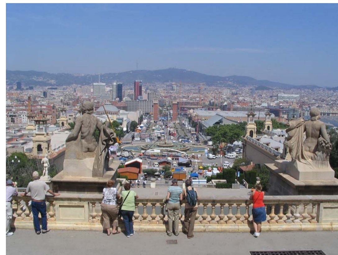
Figura 8.13: Mirador del Palau Nacional (Museu Nacional d'Art de Catalunya - MNAC).