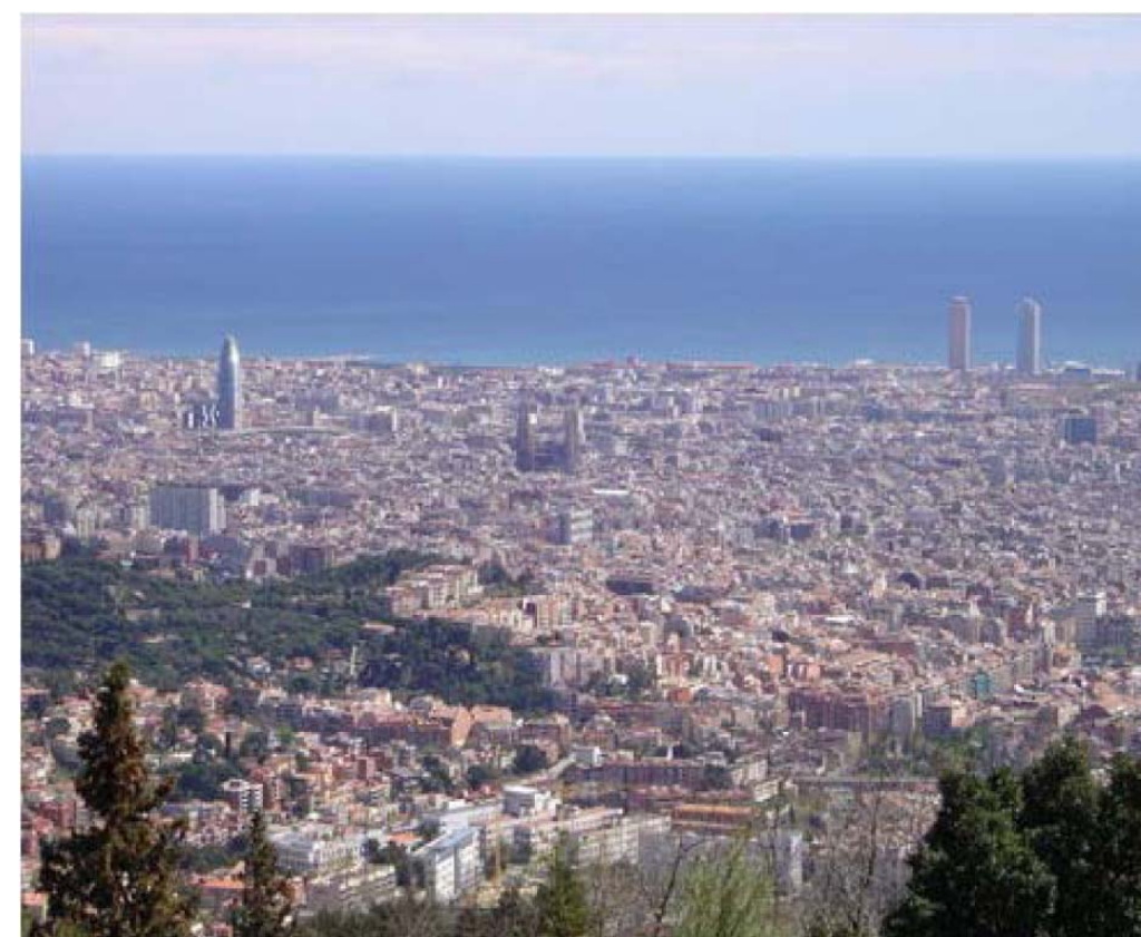
Figura 8.10: Vista de Barcelona des de Collserola.

Els miradors seleccionats en el Catàleg estan repartits per tota la geografia de la Regió Metropolitana de Barcelona (veure mapa 4.1 Miradors). La xarxa de miradors està formada, com ja s'ha esmentat, per un conjunt de 115 llocs i elements que ofereixen unes bones panoràmiques sobre els paisatges més representatius de la Regió Metropolitana de Barcelona. En la majoria de casos són indrets d'observació del paisatge força coneguts per la població, de manera que molts d'ells posseeixen, a més, una forta càrrega simbòlica i identitària, fet que s'ha posat de manifest en els processos de participació que s'han portat a terme durant l'elaboració del Catàleg.