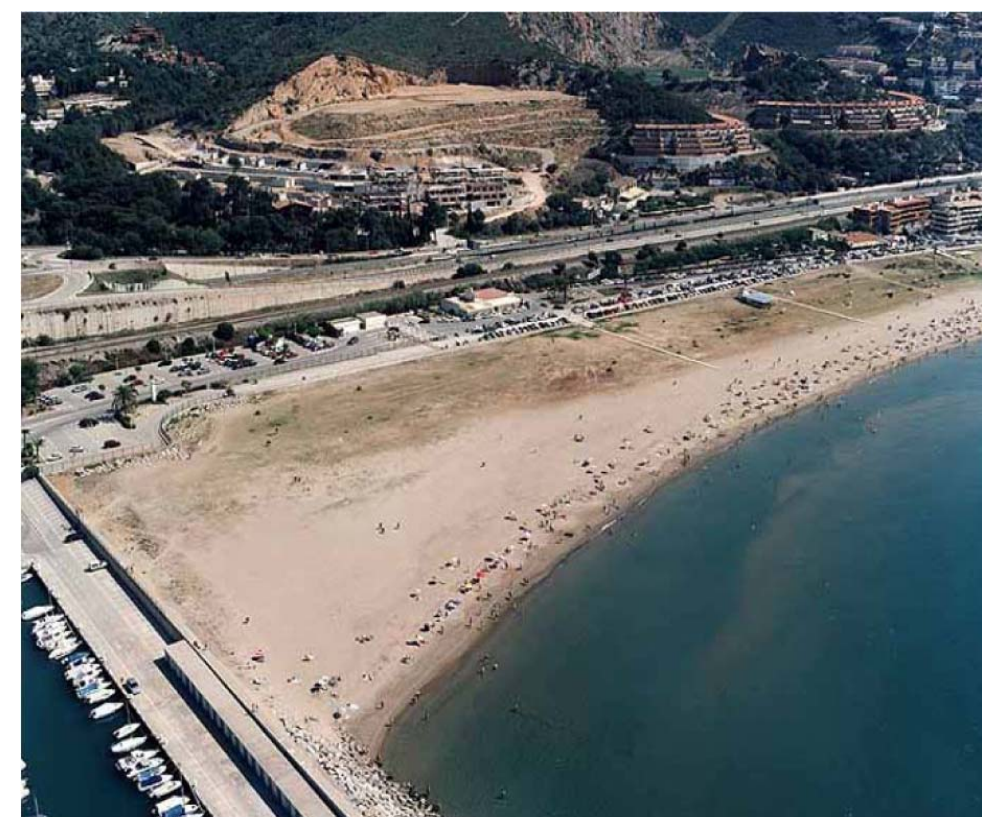
Figura 8.9: Les Botiges de Sitges, on es pot apreciar tant el desert càrstic com les ondulacions característiques del massís del Garraf.