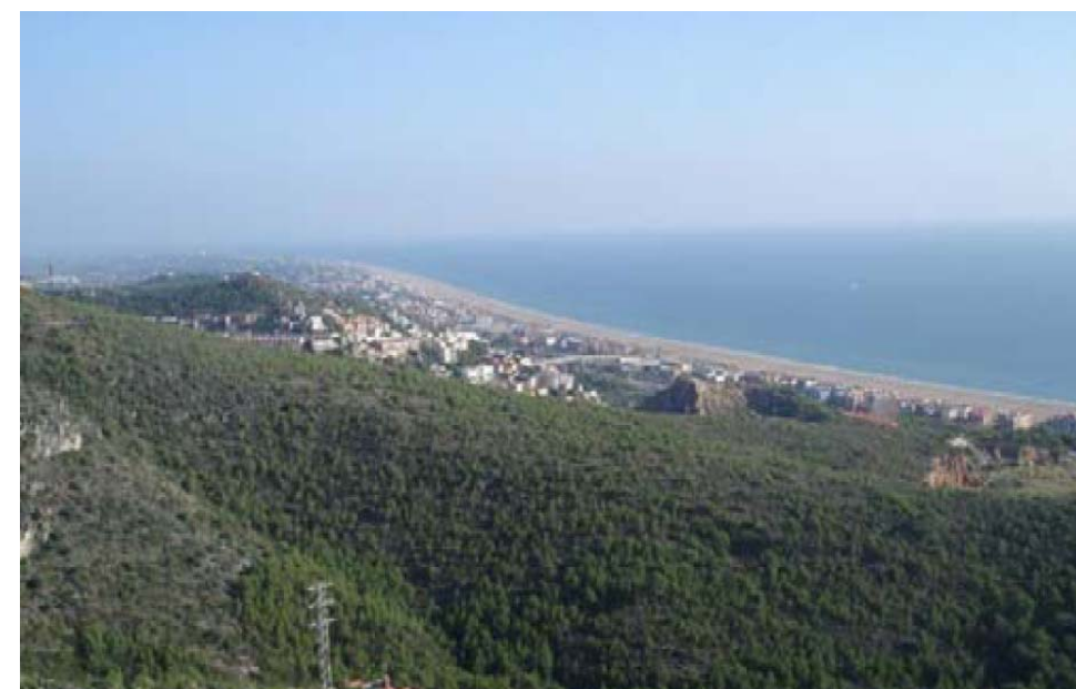
Figura 8.4: Vista de la Plana Novella cap a Sitges.

Una reflexió en relació amb les rutes de la Regió Metropolitana de Barcelona és que s'hi poden distingir clarament dues menes d'itineraris: els que recorren paratges singulars i els que permeten interioritzar o redescobrir els paisatges habitualment menys valorats.