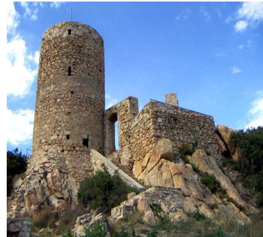
Figura 8.12: El castell de Burriac.

Tanmateix, el tercer grup és el que reflecteix més genuïnament la natura del paisatge metropolità, basat en la barreja sovint indistinguible entre el medi rural o natural i l'espai construït o solcat d'infraestructures. Dins d'aquest grup destaca el mirador de Sant Climent de Llobregat a la unitat de Muntanyes d'Ordal, per les fantàstiques panoràmiques sobre Gavà, Viladecans, Sant Boi de Llobregat i, fins i tot, sobre el corredor de la Vall Baixa del Llobregat, on la presència de les infraestructures és el tret paisatgístic preponderant.