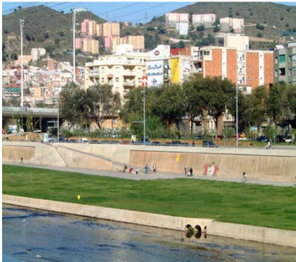
Figura 8.2: Imatge del Parc del Besòs a l'alçada de Montcada.

10. Seguretat. Itineraris que tenen un accés fàcil i un recorregut d'escassa dificultat, per a un gaudi del paisatge òptim.