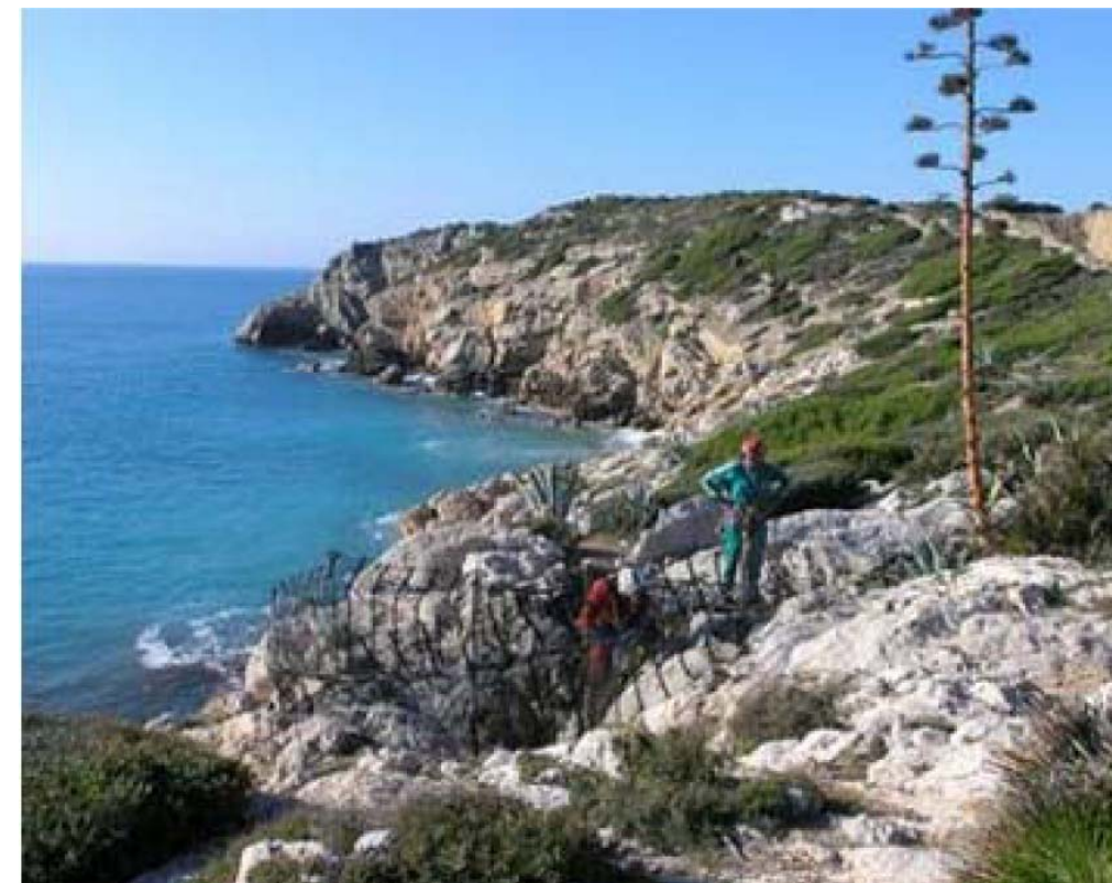
Figura 8.7: Vista de l'accés a la Cova del Gegant.

concentrades entorn un o pocs carrers estructuradors, masos nobles vinculats a explotacions d'horta o vinyes de certa extensió...) i les tipologies urbanes contemporànies, d'eixamples uniformants i cases altes en filera, que trenquen els perfils tradicionals del lloc. Aquest contrast, de fet, caracteritza molt aquest paisatge.