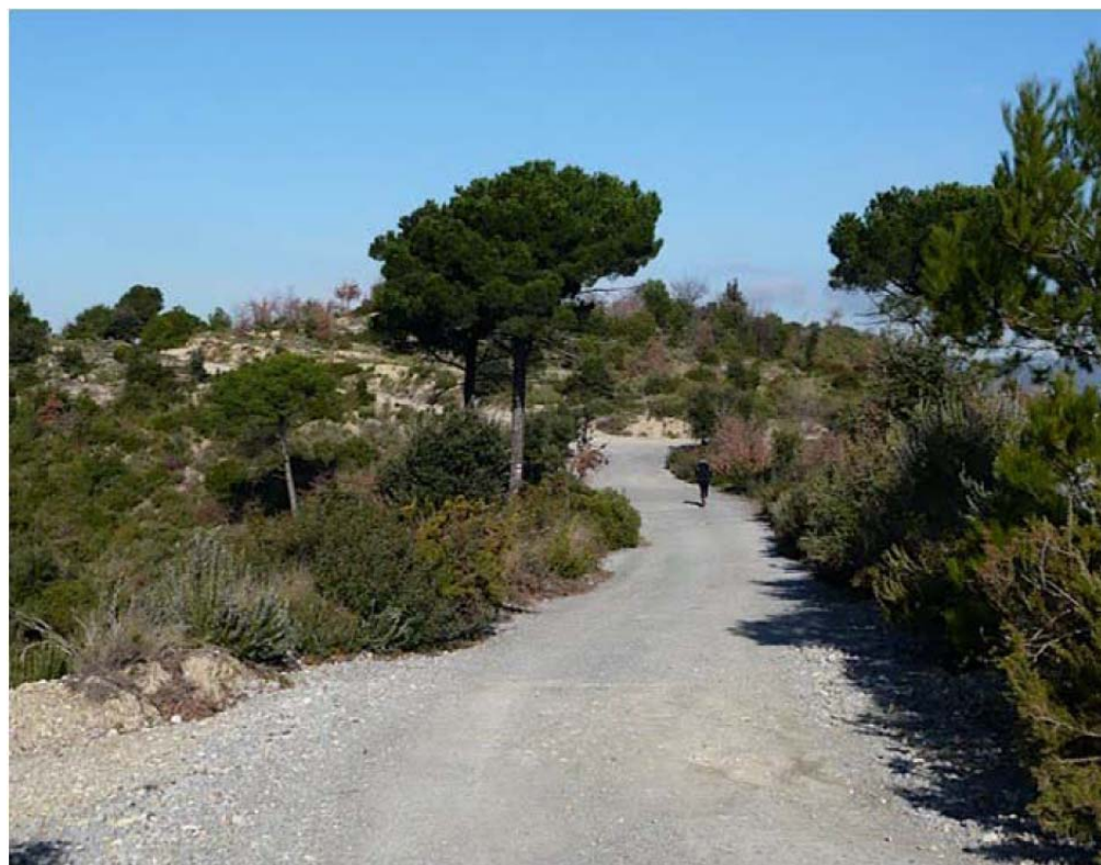
Figura 8.6: Ascens pel Camí dels Monjos cap al punt més alt de la serra de Galliners.