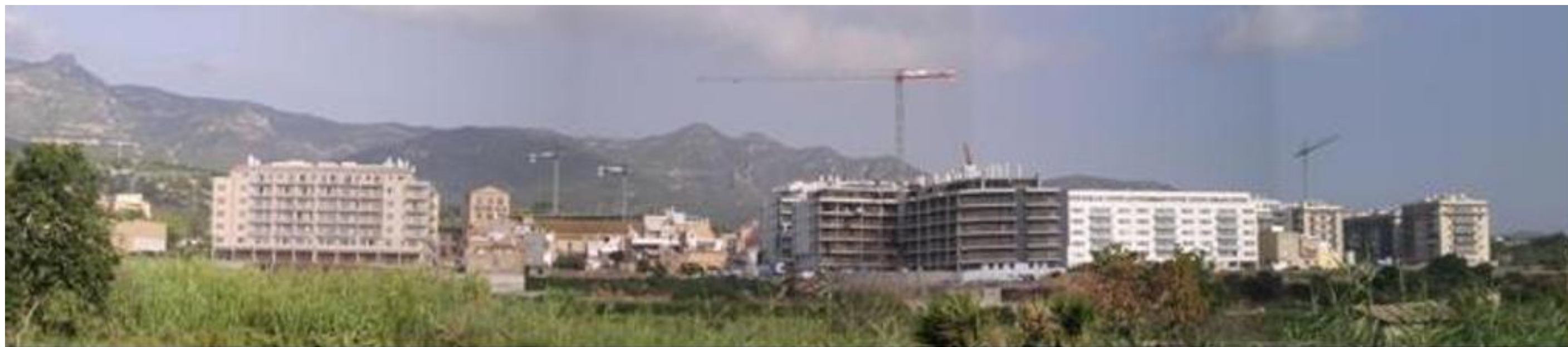
Figura 5.18. Nous sectors urbanitzats al marge nord de Sant Carles de la Ràpita.

Aquí destaca el paisatge urbà que conforma Sant Carles de la Ràpita, amb un traçat neoclàssic ortogonal perfectament planificat, que per les reduïdes dimensions del terme municipal, ha desplegat una estratègia de creixement immobiliari vertical. Així doncs, destaquen els edificis alts que generen una densitat urbana important. Per la seva banda, el tram sud de litoral, al sector de les Cases d'Alcanar, predomina l'assentament urbà dispers, caracteritzat per edificacions unifamiliars aïllades.