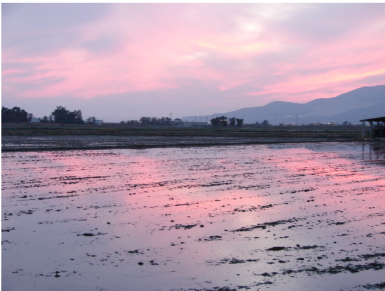
Figura 5.35. Camps d'arròs inundats al capvespre formen paisatges efímers i canviants a l'interior del Delta de l'Ebre.

pel predomini quasi absolut dels arrossars i de l'arquitectura generada pels canals, amb un poblament agrari disseminat envoltat d'horta, i restes de llacunes, canyissars i sorrals al marge litoral.