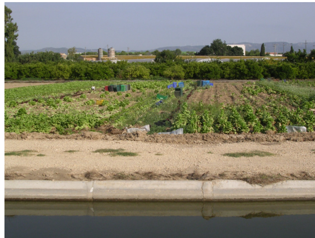
Figura 5.26. Restes de conreu d'horta a les terrasses fluvials de l'Ebre, prop del nucli de l'Aldea.

En aquest sector els nuclis urbans es caracteritzen per un predomini de l'estructura urbana radial, desenvolupada a partir de petits enclavaments que han anat creixent i que estan situats en els punts més elevats. Precisament tenen el seu origen en encreuaments de camins, la qual cosa vol dir que el pas a través d'aquests nuclis urbans és relativament fàcil i sovint prenen la forma d'estrella. La situació de la majoria de nuclis urbans de les terrasses fluvials està enmig de dos possibles itineraris, o de vegades al fons d'una vall perpendicular al riu Ebre.