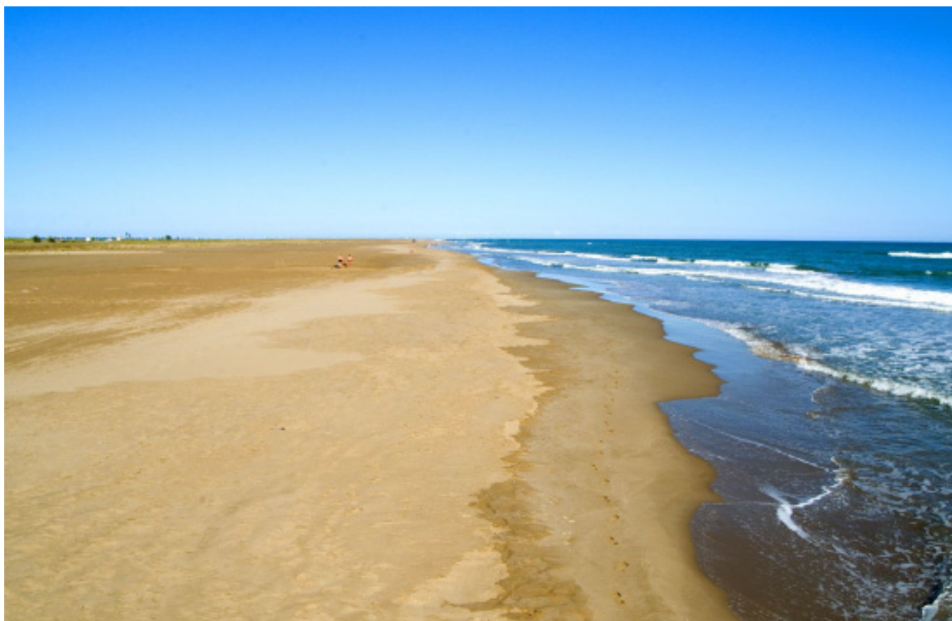
Figura 5.33. Paisatge característic del front marítim del Delta de l'Ebre. A la imatge, la platja de l'Eucaliptus.

Fangar, a l'hemidelta sud, unides al delta per sengles tómboles. A sobre d'aquestes formacions s'hi han desenvolupat platges estretes i allargades, amb dunes de sorra colonitzades per vegetació psammòfila.