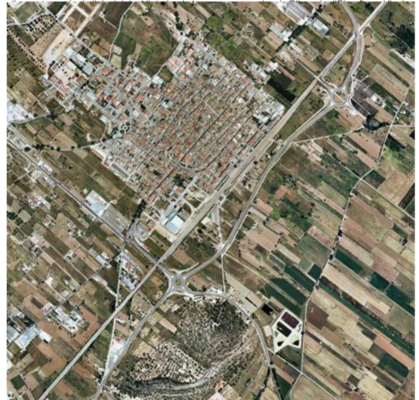
Figura 5.22. Ortofoto del nucli urbà d'Ulldecona, on es pot observar l'estructura de poble-camí, que creua pel centre del nucli.

En resum, les planes interiors en general es caracteritzen pel domini aclaparador dels conreus d'olivera amb marges i arquitectura de pedra seca, que defineixen i estructuren el paisatge. Tot i això, els conreus de cítrics s'han anat imposant pel sector sud de la Plana del Baix Ebre-Montsià, així com els conreus de fruita dolça han anat remuntant pels seus pendents de la Cubeta de Móra, cada cop