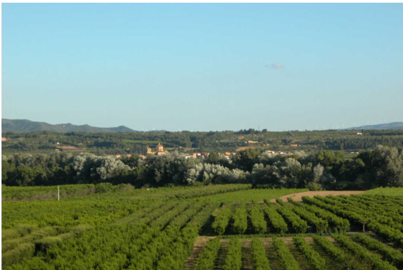
Figura 5.23. Les terrasses fluvials de la Cubeta de Móra han estat profundament transformades amb conreus de fruita dolça que han substituït les antigues sènies. A la imatge, fruiters de fruita dolça entre Benissanet i Miravet, amb Ginestar al fons.

L'eix simètric d'aquest àmbit el constitueix el riu Ebre. Es tracta doncs, d'un ambient constituït per una franja relativament estreta, vinculada als dipòsits al·luvials que el riu Ebre ha construït en els seus marges. Els paisatges de les terrasses no formen una unitat contínua al llarg de les Terres de l'Ebre, sinó que es poden diferenciar fins a tres grans sectors: el de la Cubeta de Móra i l'eix Xerta-Amposta, on les terrasses fluvials són més importants, i el de la conca situada entre Riba-roja d'Ebre i Vinebre, on les terrasses fluvials són eixugues.