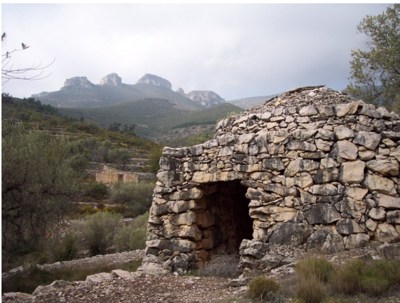
Figura 5.12. Les serres de les Terres de l'Ebre contenen multitud de restes d'arquitectura rural de pedra seca, que durant segles havien estructurat bona part d'aquests paisatges. A la imatge, barraca de pedra seca a les falces dels Ports, prop de la Sénia.