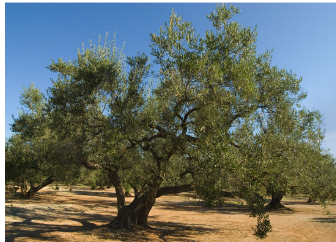
Figura 5.20. Monoconreu d'oliveres a la Plana del Baix Ebre-Montsià.

Però l'espai planer més important de les Terres de l'Ebre és el de la Plana del Baix Ebre-Montsià, que s'estén des de Xerta fins a la Sénia, des d'on es prolonga cap a terres valencianes, i entre les Serres de Montsià-Godall i Los Ports. Des del punt de vista paisatgístic destaca pel predomini quasi absolut dels conreus d'oliveres, que es combinen amb els garrofers, que representen un autèntic mar d'oliveres conformat per multitud de parcel·les i per murs de pedra seca baixos i d'una doblària considerable i que actuen com a dipòsit de reble o de partició de les propietats. Però per la part sud de la plana, aquest paisatge tradicional de secà es veu modificat pels conreus de cítrics, de plantació més recent que s'han constituït en base a la implantació de sistemes de regadiu i a la concentració