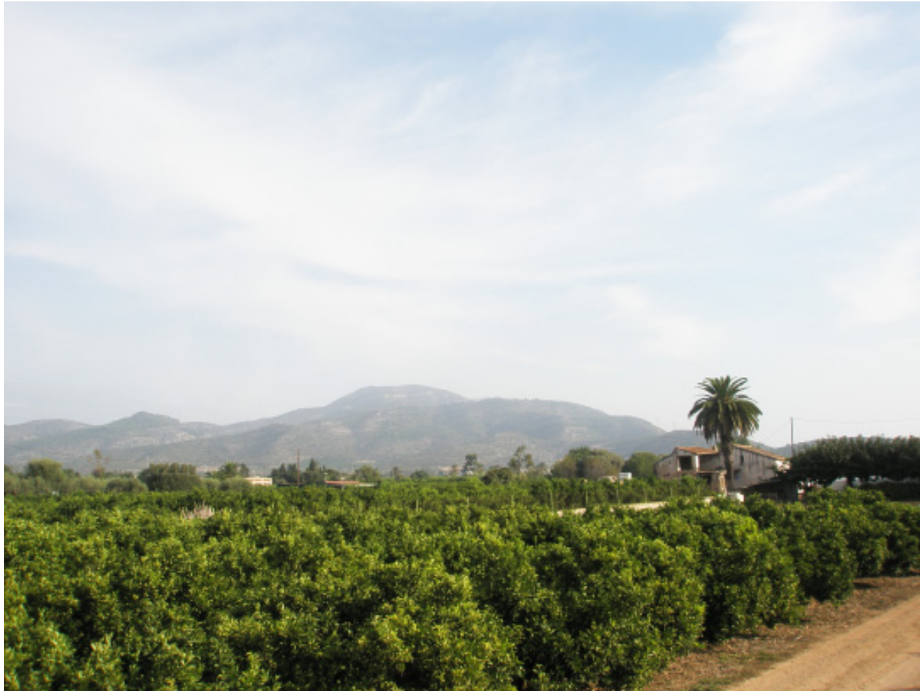
Figura 5.21. Plantació de cítrics prop d'Alcanar, al sud de la Plana del Baix Ebre-Montsià.

parcel·lària, amb resultats paisatgístics uniformitzadors i l'eliminació quasi total de l'arquitectura de pedra seca.