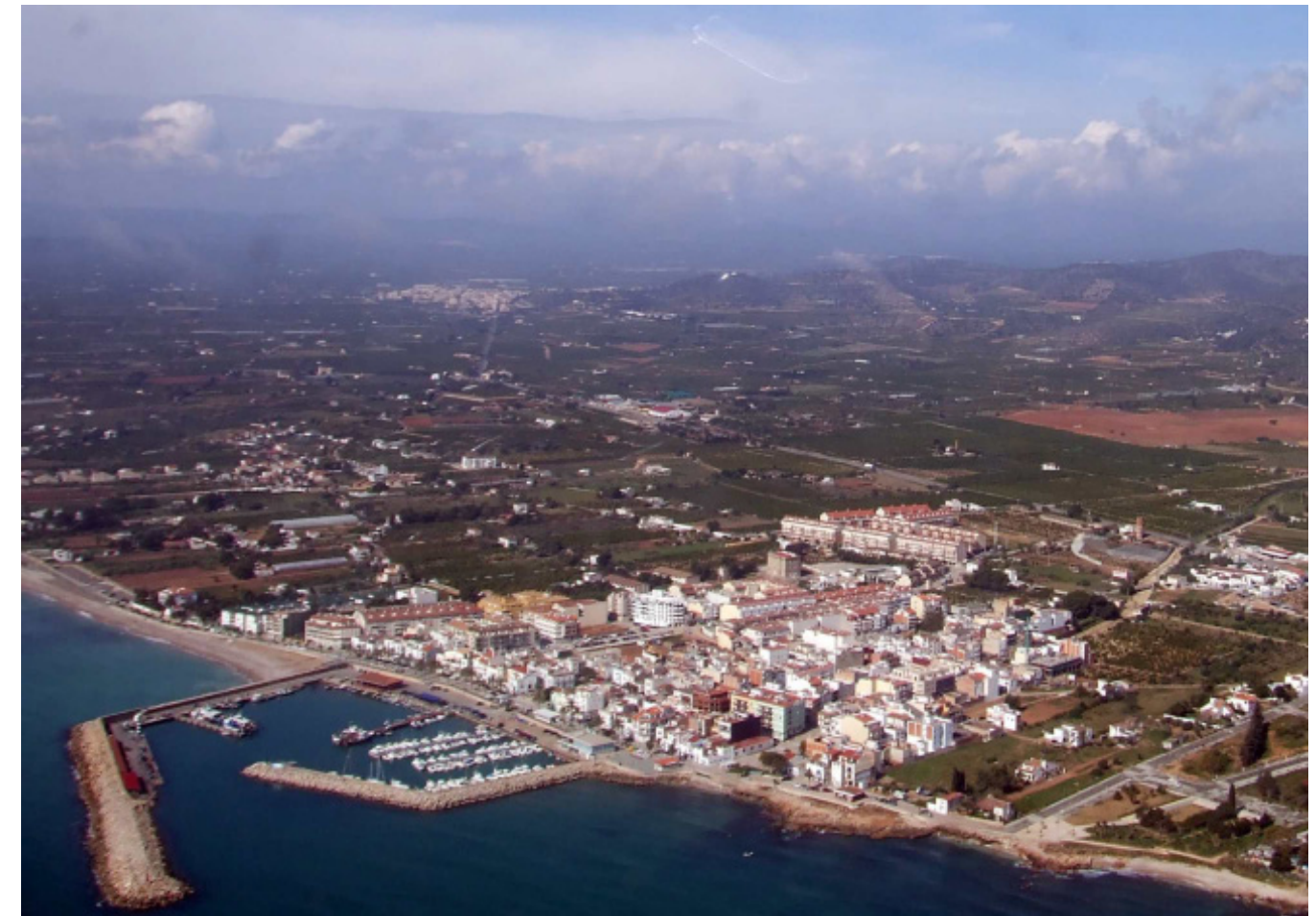
Figura 5.15. Panoràmica de la plana litoral del sector d'Alcanar. A la imatge, panoràmica del nucli urbà de les Cases d'Alcanar i els seus voltants.

En resum, el paisatge actual de les serres de les Terres de l'Ebre es caracteritza per un predomini quasi absolut de les masses forestals, acompanyant el substrat geològic calcari, compostes sobretot de bosquines, garrigues, màquies, i brolles, en els vessants assolellats, i pinedes i alzinars, als vessants d'obaga, amb pocs assentaments humans, petits i compactes, i masos disseminats en avançat estat de degradació arquitectònica. És doncs, un paisatge condicionat pels d'incendis forestals, que quan s'originen troben un terreny propici, compost per masses molt contínues formades per comunitats vegetals molt piròfites, per a la seva propagació. La pèrdua d'interès de l'ús forestal i de ramaderia extensiva ha donat lloc a l'abandonament dels masos i del patrimoni cultural.