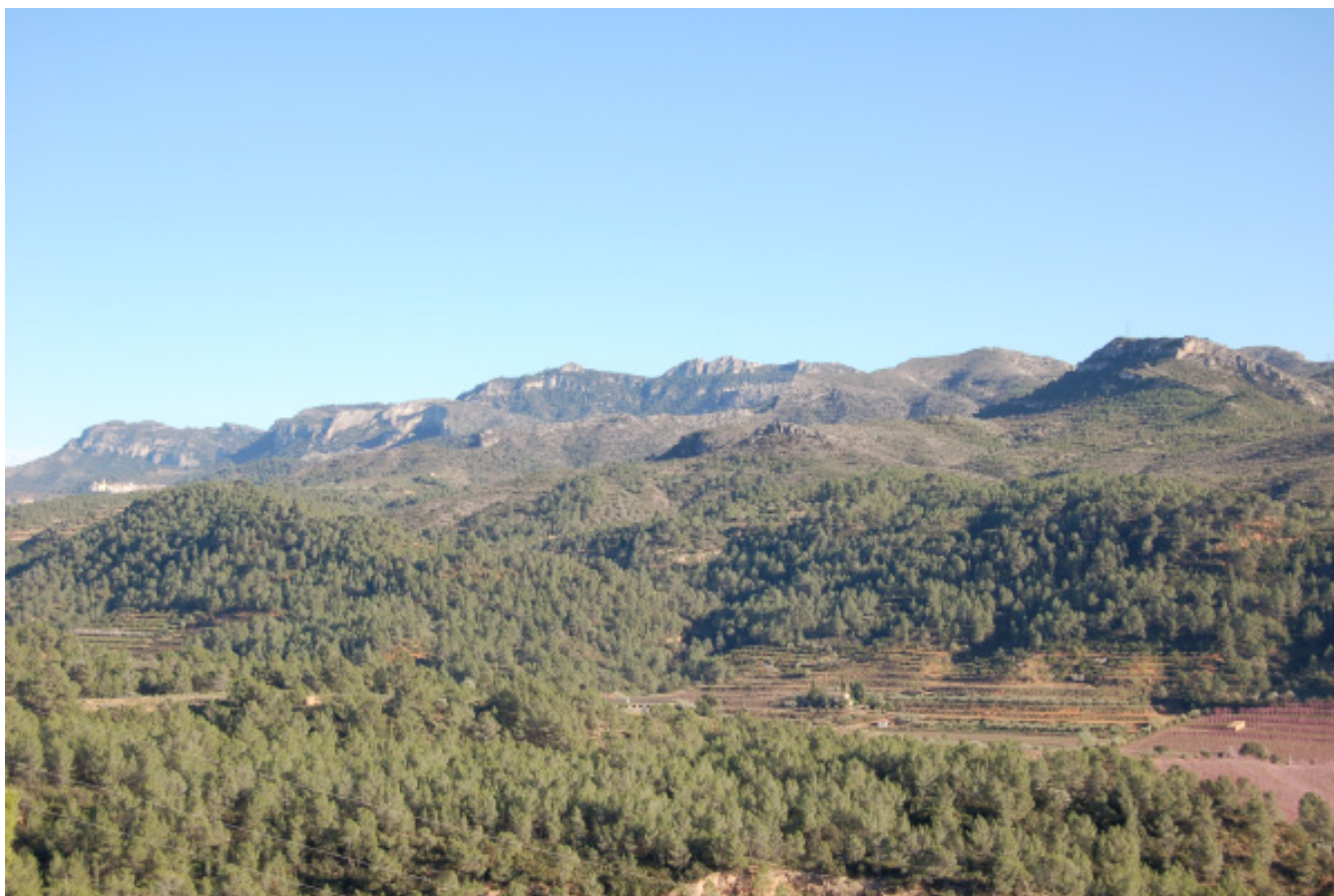
Figura 5.9. Vista actual del sector interior de les Muntanyes de Tivissa-Vandellòs.

Paral·lelament al litoral, s'eleva el conjunt discontinu format, de nord a sud, per les Muntanyes de Tivissa-Vandellòs, les Serres de Cardó-Boix i les de Montsià-Godall. La part septentrional (muntanyes de Tivissa, serra de la Creu i la Llena i serra de Cardó) està constituïda per materials juràssics, principalment dolomies, margues i calcàries; mentre que en la part més meridional (serra de Boix, de Montsià-Godall) el substrat està format per calcàries del cretaci. La geologia, juntament amb altres característiques ambientals com el clima o l'orientació dels relleus, han condicionat un paisatge mixt molt humanitzat. Els pinars i els carrascars conformen, en alguns sectors, boscos madurs, mentre que en les obagues i barrancs més humits es poden localitzar formacions de roures de fulla petita (roure valencià) i teixos, tot i que no constitueixen masses de gran entitat. El forest ha jugat un paper molt important per a les poblacions, antigament pels seus valors econòmics i, en l'actualitat, degut als seus valors ambientals i culturals.