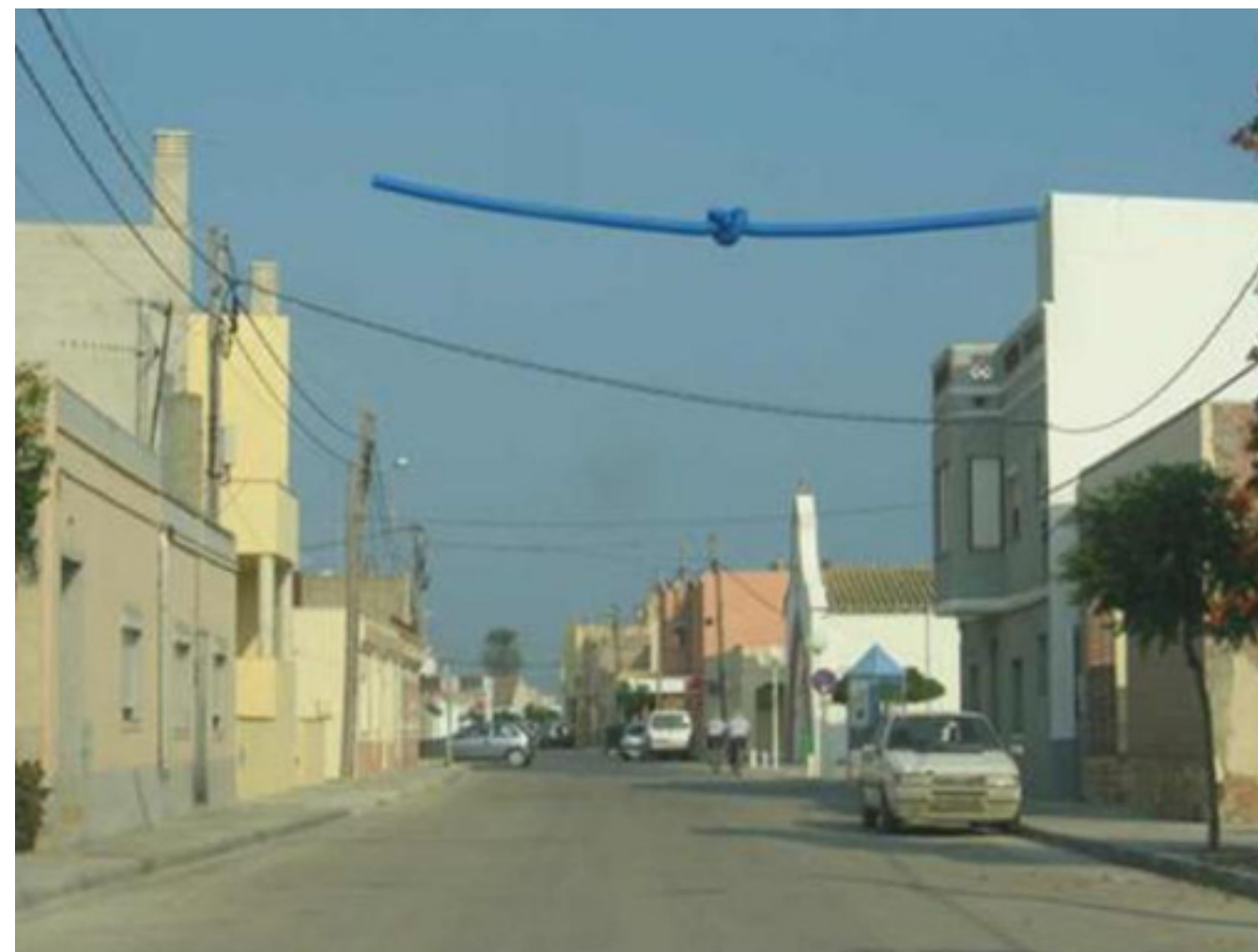
Figura 5.34. Paisatge urbà de Sant Jaume d'Enveja, amb el nus, símbol del moviment antitransvasament des de finals del segle XX

Al Delta, els nuclis urbans s'originen a partir de l'agrupament d'edificacions agrícoles, per això presenten una important extensió superficial que origina uns paisatges urbans força peculiars. L'aspecte dels nuclis, aparentment caòtic i desordenat, respon, com ja s'ha esmentat en el capítol anterior, a una lògica de distribució familiar entre els descendents de les propietats (construcció d'habitatges adossats seguint l'estructura de les propietats), a una forma cultural de relacionar-se amb el medi (existència d'horts urbans en quasi cada parcel·la), i a una distribució capil·lar (seguint els principals eixos viaris). Tot plegat fa que els nuclis urbans del Delta de l'Ebre presentin un urbanisme caracteritzat