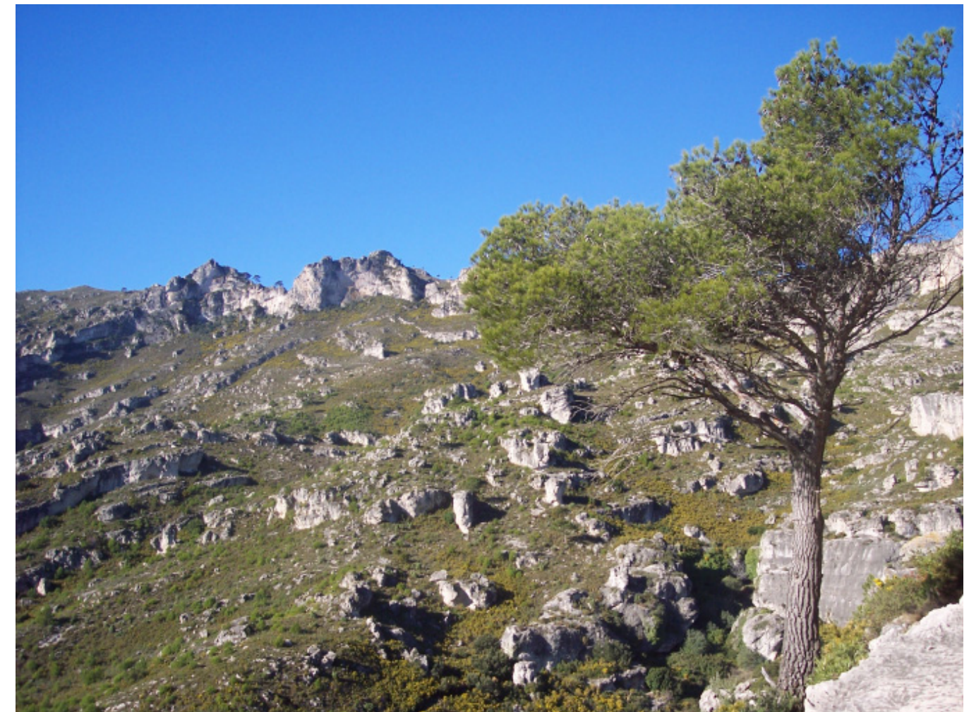
Figura 5.8. Aspecte actual de bona part dels paisatges de les serres de les Terres de l'Ebre. A la imatge, vista parcial del barranc de les Nines, a les Serres de Cardó-Boix.

En resum, el paisatge tradicional dels altiplans està marcat pel conreu de secà format per mosaics laberíntics de vinyes, oliveres i ametllers, caracteritzat pels bancals o feixes, l'arquitectura de pedra seca i petites hortes de molins i sènies. La pèrdua de població i l'abandonament del secà han suposat el creixement de la brolla i la pineda i la degradació dels bancals, acompanyada de l'alteració de la topografia pels aplanaments per a conreus de regadiu més productius. A més cal afegir-hi la densa xarxa de línies elèctriques d'alta tensió provinent de les centrals hidroelèctriques i nuclears que creuen tot el territori.