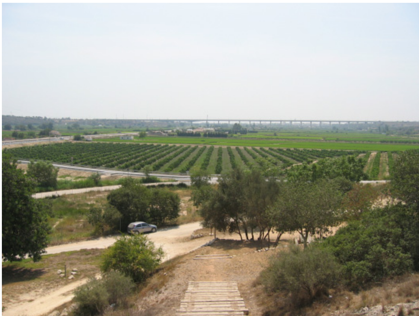
Figura 5.25. Vista des de la torre de la Carrova (Amposta), sobre les terrasses fluvials situades al sud, on es pot contemplar la presència de conreus de cítrics, alhora que la proximitat al delta es nota amb l'existència de conreus d'arròs.

L'eix Xerta-Amposta, caracteritzat per l'abundància d'espais planers i fèrtils, es troba en l'origen d'una important concentració residencial, industrial i comercial. Al nombrós conjunt de nuclis de població cal sumar-hi l'expansió sobre el territori de noves infraestructures i d'àrees urbanes disseminades.