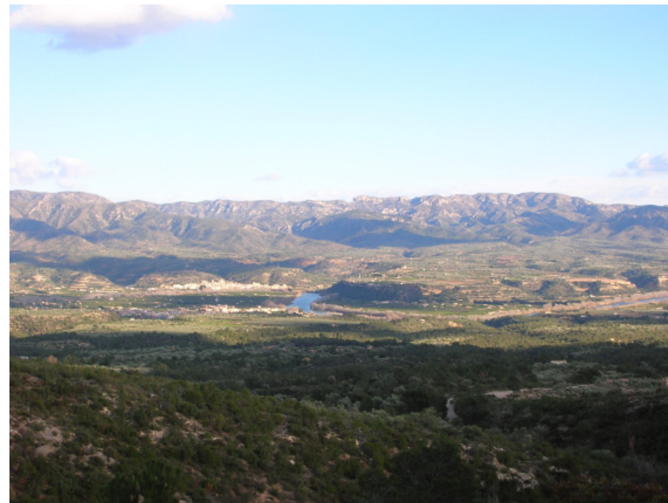
Figura 5.1. Panoràmica que permet contemplar part de la diversitat paisatgística de les Terres de l'Ebre. A la imatge es veuen les Serres de Cardó-Boix al fons, els Vessants de Tivenys-Coll de l'Alba a la dreta, el Paisatge fluvial de l'Ebre, al centre, i una petita part de la Plana del Baix Ebre-Montsià, en primer terme.

b) Un relleu accidentat, on les muntanyes i les planes es van intercalant: el Mediterrani, un mar entre terres, és més aviat un mar entre muntanyes. Les serralades i els massissos muntanyosos es disposen a poca distància de la costa i actuen com autèntiques muralles pètries que fan que el mar aparegui com encerclat, com un domini tancat. Les planes a les Terres de l'Ebre són l'excepció, rares i més aviat escasses, i en molts casos corresponen a accidents tectònics. És el cas de la Cubeta de Móra, la plana del Burgar, la foia d'Ulldecona, o la plana del Montsià.