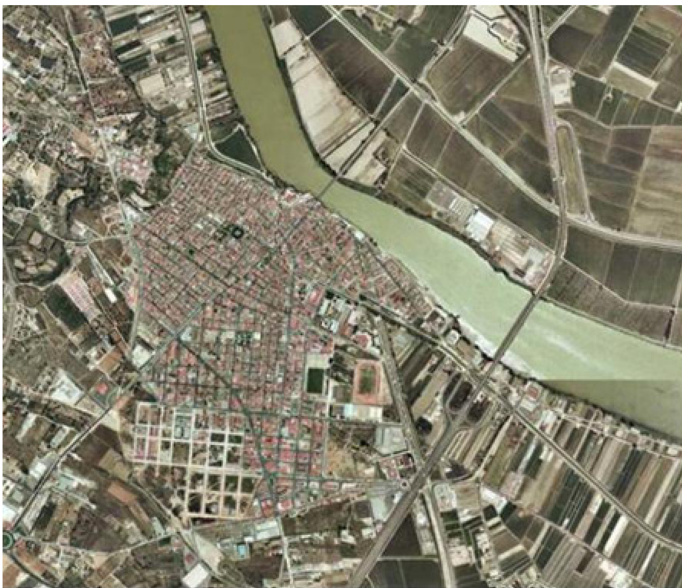
Figura 5.27. Ortofoto del nucli urbà d'Amposta.

En general, a les terrasses fluvials, el creixement ha estat massa sobtat per a quedar ben assimilat en el paisatge donant lloc a perifèries que sovint són espais intermedis, zones de transició, indrets mancats d'identitat. Aquests tipus de paisatges sobretot es localitzen al llarg de la carretera N-340, entre Sant Carles de la Ràpita i l'Aldea, de la C-12, entre Amposta i Tortosa-Roquetes, i la C-42, entre l'Aldea i Tortosa, així com a la perifèria d'aquests nuclis urbans.