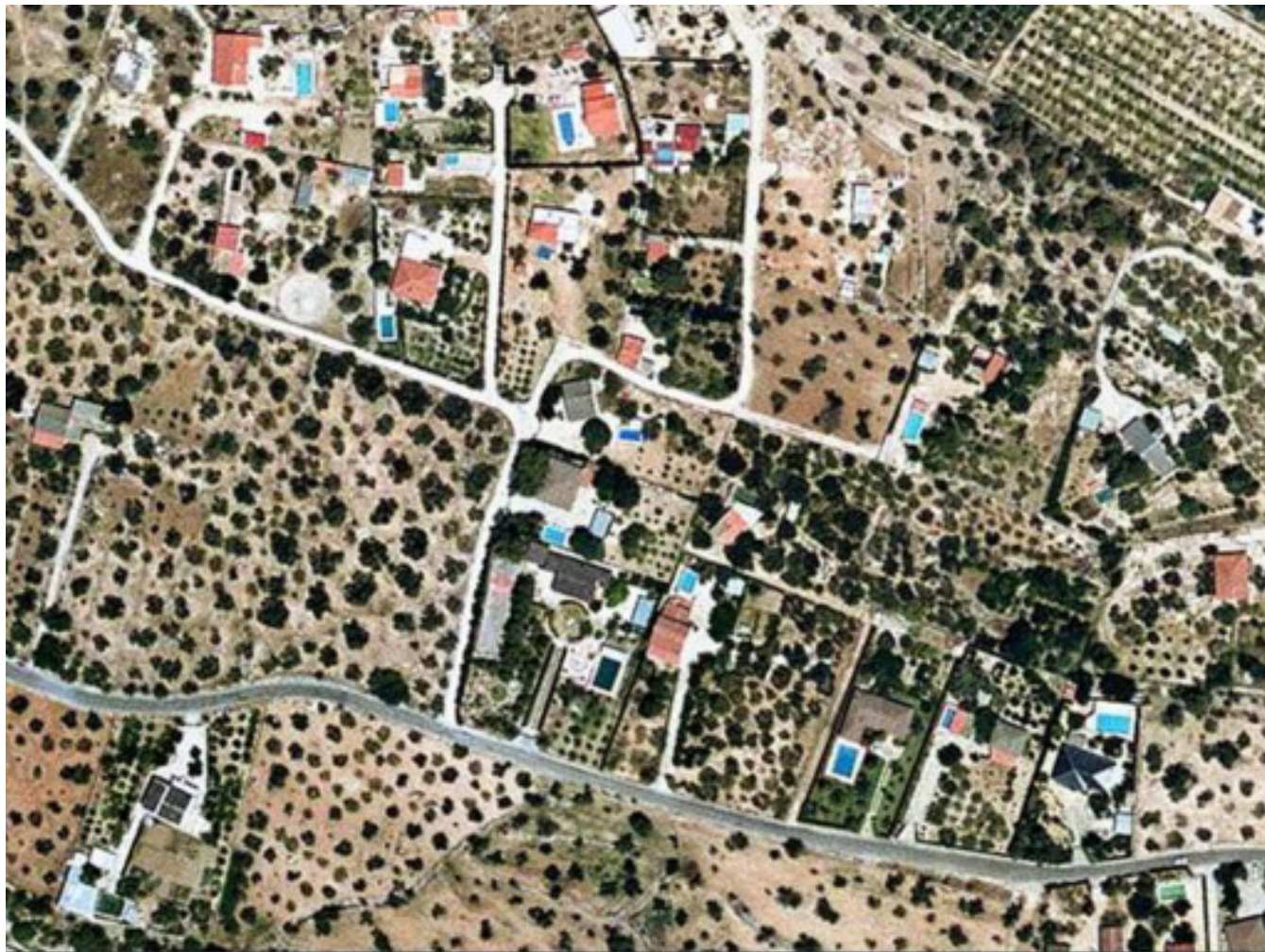
Figura 5.29. Model d'ocupació del sòl disseminat (tipologia del xalet).

En resum, del paisatge tradicional de les terrasses fluvials caracteritzat per l'horta, els canals i les sèquies, la combinació de nuclis grans o mitjans amb poblament disseminat, la navegació de llaguts i la vegetació de ribera a les ribes i illes, en queda ben poca representació. El creixement de l'activitat econòmica i l'especialització energètica ha rellevat l'interès econòmic dels usos tradicionals i, alhora, s'han modernitzat els recs i s'ha produït una forta expansió dels conreus de cítrics i fruita dolça arreu de les terrasses. El resultat és, doncs, una progressiva desaparició del paisatge tradicional d'horta i del seu patrimoni hidràulic, del qual avui es poden contemplar només restes degradades, la progressiva proliferació d'àrees residencials, industrials i comercials disperses i extensives, i l'existència de nuclis antics degradats.