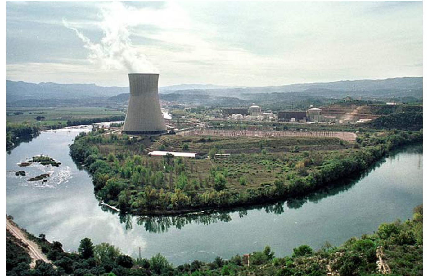
Figura 5.30. Complex nuclear d'Ascó, situat sobre la terrassa fluvial del riu Ebre al seu pas pel municipi d'Ascó.