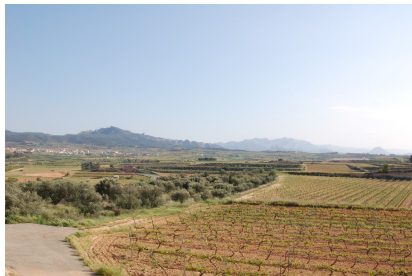
Figura 5.5. Panoràmica de l'altiplà de la Terra Alta, prop de Gandesa, caracteritzat pel mosaic de conreus de secà on la vinya té un paper predominant.

El paisatge de l'altiplà és un gran mosaic agroforestal on es combinen els cultius de secà (majoritàriament de vinya, oliveres i en menor mesura d'ametllers i cereal) amb la garriga i bosquines de pi blanc, dominat pels bancals de pedra en sec i tota la seva arquitectura associada (casetes de camp, cisternes,...).