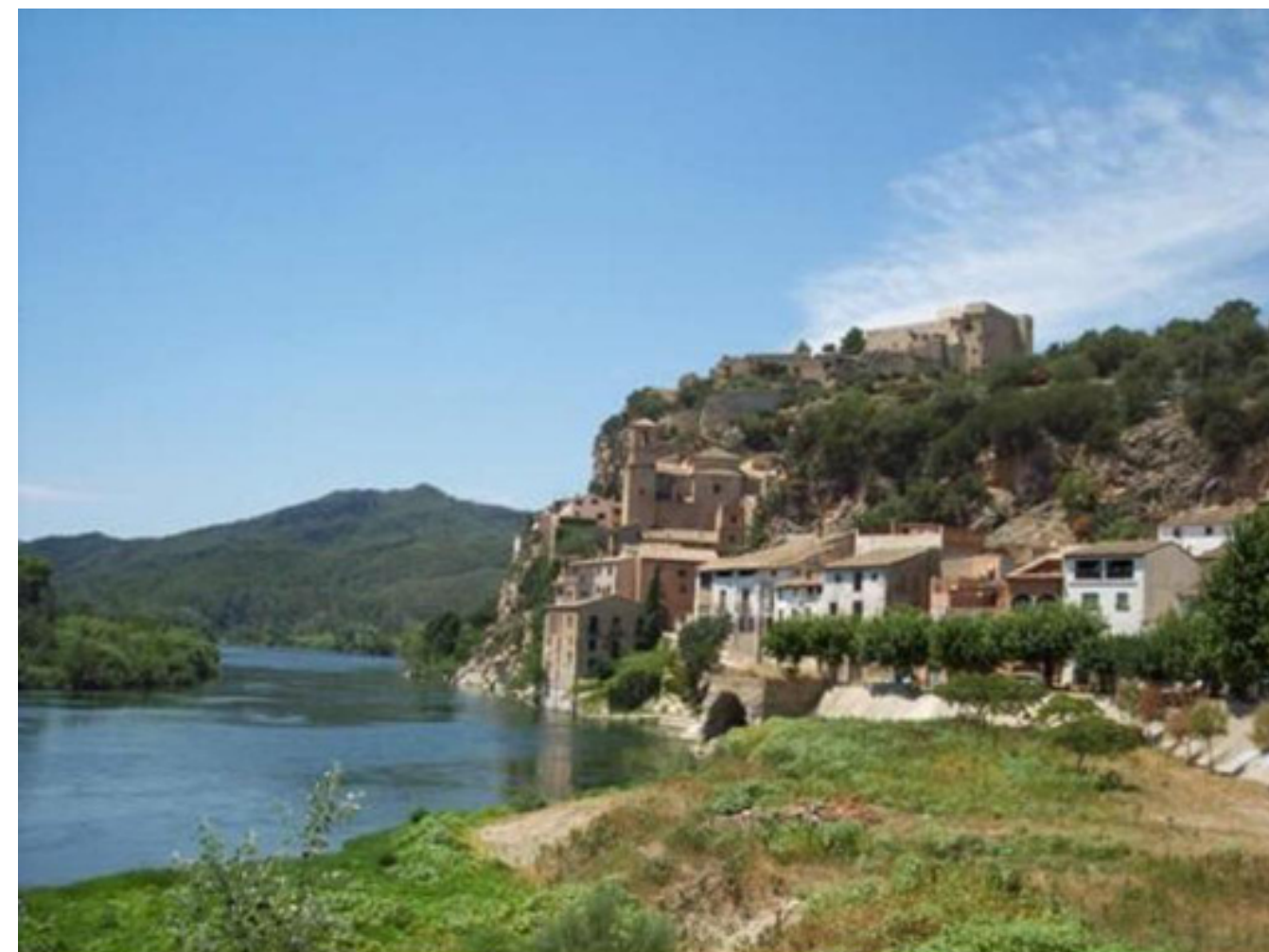
Figura 5.24. Vista del Cap de la Vila de Miravet, amb el castell al fons, encavalcat entre la cubeta de Móra i les estribacions nord del petit altiplà del Pinell de Brai.

l'expressió d'un paisatge intensament humanitzat resultat d'una economia agrària. Actualment no queden gaires exemples vius de les sènies, explotació agrària familiar conformada per parcel·les perpendiculars al riu amb diversitat de conreus, que havien caracteritzat les terrasses fluvials de la Cubeta de Móra, especialment les situades entre Miravet, Benissanet i Móra d'Ebre.