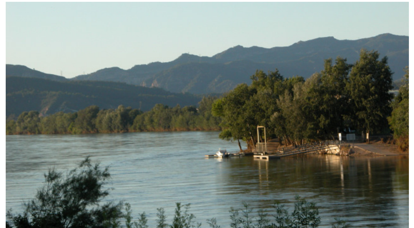
Figura 5.31. Bosc de ribera relativament ben conservat a les terrasses fluvials de la cubeta de Móra.