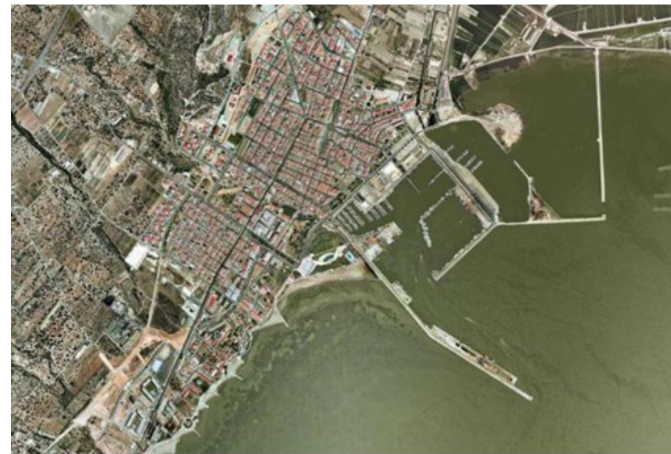
Figura 5.17. Ortofoto del nucli urbà de Sant Carles de la Ràpita, on es pot observar el traçat ortogonal de la trama urbana.