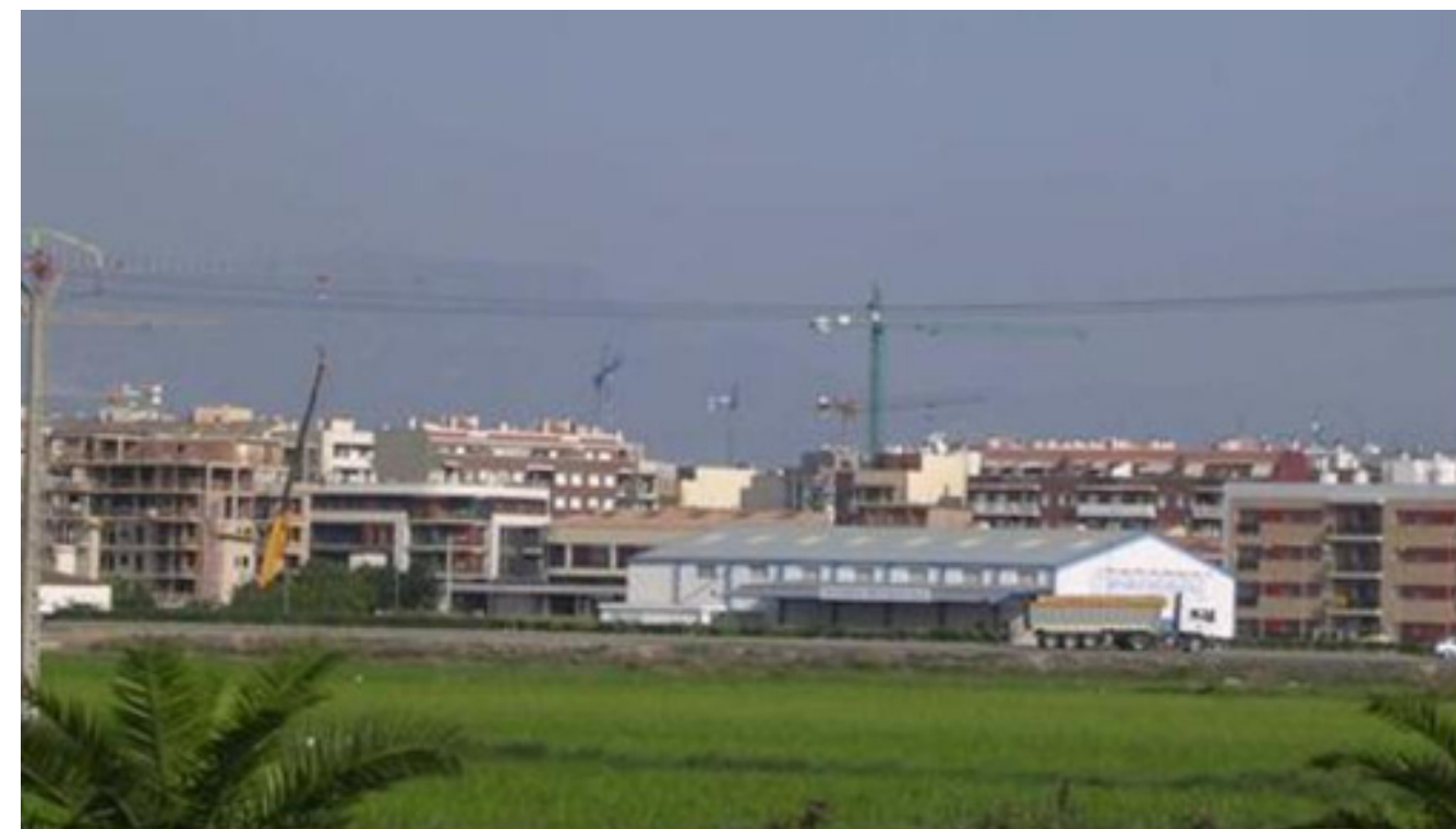
Figura 5.28. Creixements urbans al límit sud del nucli urbà d'Amposta.

Les terrasses fluvials situades a la conca entre Riba-roja d'Ebre i Vinebre, són en general més estretes, només destaquen les situades entre Vinebre i Ascó. La pràctica totalitat d'aquestes terrasses està ocupades per conreus de fruiters de regadiu i vinya, i les hortes hi són residuals. Les terrasses formades sobre el meandre d'Ascó presenten un paisatge conformat per les dues centrals nuclears d'Ascó, i la imponent torre de refrigeració, considerada la construcció més alta del conjunt del territori català.