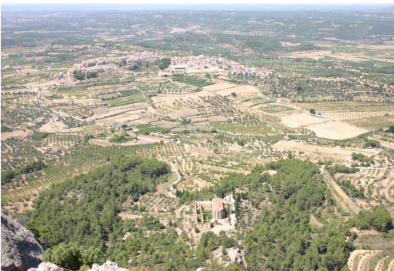
Figura 5.6. Panoràmica de l'altiplà de la Terra Alta, amb Horta de Sant Joan al fons, i el convent de Sant Salvador d'Horta, en primer terme.

Al sector situat al nord-est de la comarca de la Ribera d'Ebre, situat entre Flix i la Palma d'Ebre, predomina de forma gairebé exclusiva el mosaic agroforestal de garrigues amb conreu d'olivera formada sobre els vessants relativament suaus oportunament abancalats. Els conreus es mantenen sobretot als fons més planers i amb una millor accessibilitat, mentre que les garrigues i unes incipients bosquines es desenvolupen sobre els sectors de majors pendents.