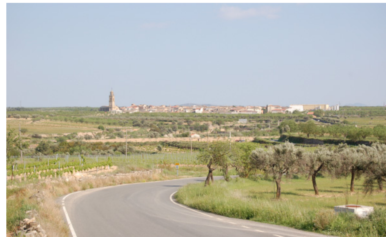
Figura 5.7. Vista del perfil del nucli urbà de Vilalba dels Arcs, petit i compacte, on sobresurt el seu campanar, inclòs en el Catàleg dels BCIN.

En general es pot afirmar que les infraestructures viàries estan adaptades a la topografia existent. La majoria de la xarxa viària dels altiplans està formada per diverses carreteres secundàries que sobretot tenen un caràcter local; només hi ha dues carreteres que pertanyin a la xarxa bàsica de