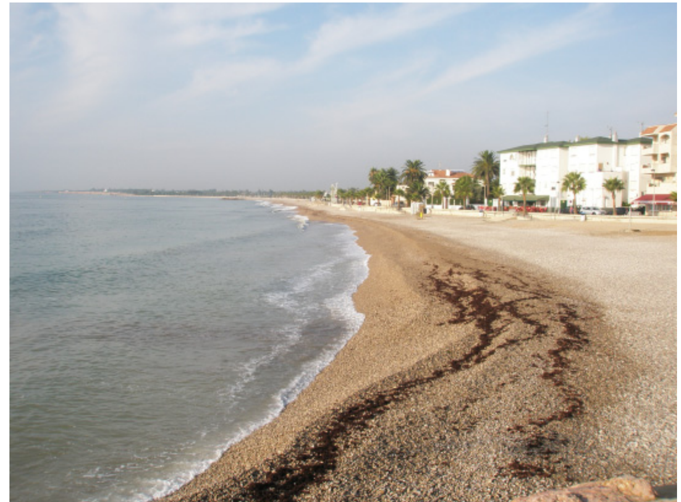
Figura 5.2. La recent thalassofília ha comportat l'apropament de la societat al mar, amb la subsegüent transformació paisatgística de les primeres línies de costa. A la imatge, part de la façana marítima del nucli urbà de les Cases d'Alcanar.

e) Una agricultura irrigada a les hortes: l'aigua és un bé escàs en el paisatge mediterrani on el regadiu ocupa poca extensió. Es limita a les hortes instal·lades a la vora del riu Ebre o als camps de