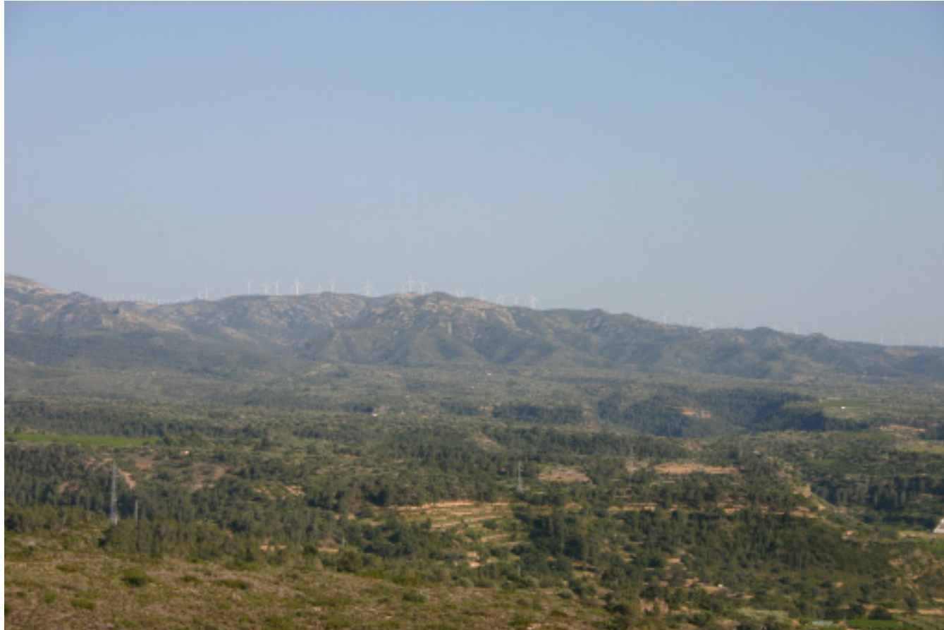
Figura 5.11. Panoràmica del sector Boix-coll de l'Alba, amb el parc eòlic ocupant el perfil topogràfic de la carena.

El sector meridional està format per les serres de Godall i de Montsià, que es troben separades de la primera serra esmentada per la vall de l'Ebre. Totes dues serres es troben cobertes, principalment, per pins i carrascars, tot i que també es poden trobar intercalats cultius de secà com l'olivera, el garrofer o l'ametller.