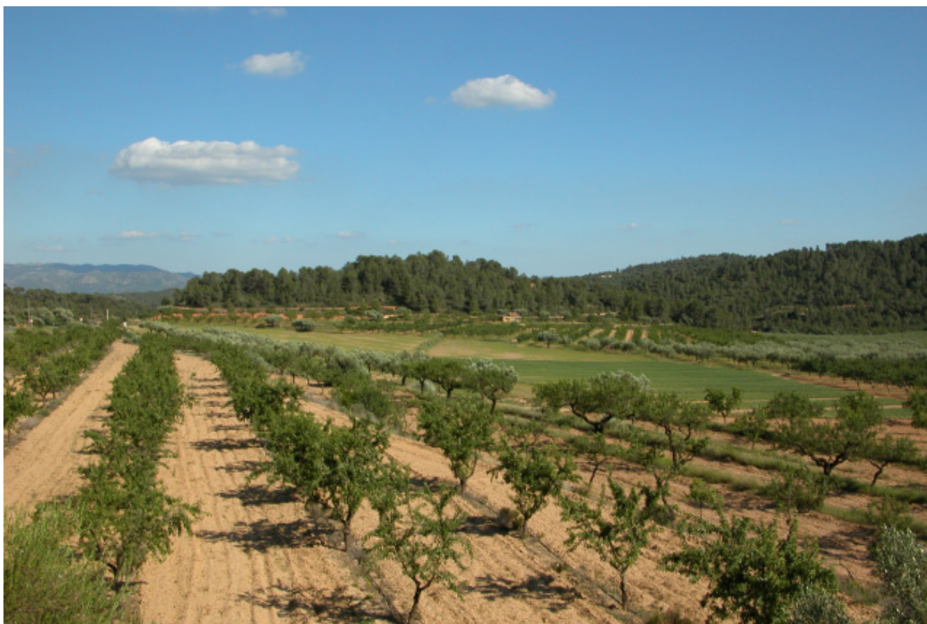
Figura 5.19. Mosaic agroforestal característic de l'interior de la Cubeta de Móra, allà on no arriba el regadiu.

component essencial del paisatge de la Cubeta de Móra, és la molt persistent boira que es conforma com a resultat dels processos d'inversió tèrmica.