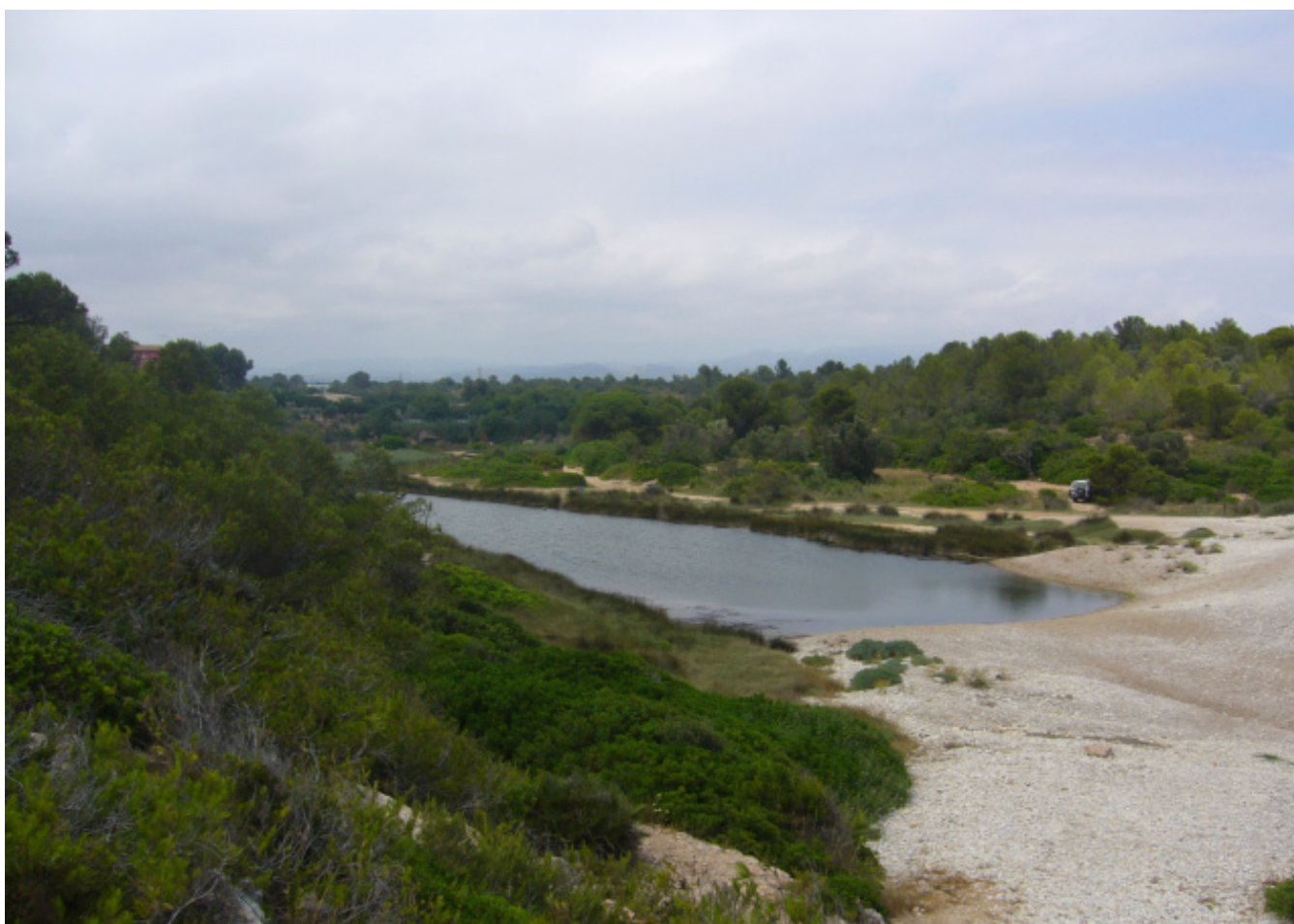
Figura 5.16. Llacuna de Santes Creus, a la desembocadura del barranc del mateix nom, al municipi de l'Ametlla de Mar.

A la plana sud, destaca el cultiu de cítrics (Alcanar) i el de olivera (Sant Carles de la Ràpita). Els vessants abancalats cap al mar han de competir, en un espai estret, amb urbanitzacions i complexos turístics, i també amb els complexos comercials desplecats a banda i banda de l'eix viari que conforma la carretera nacional N-340. El resultat ha estat la progressiva desaparició d'un paisatge litoral natural que combinava el bosc i la màquia amb els aiguamolls i les platges.