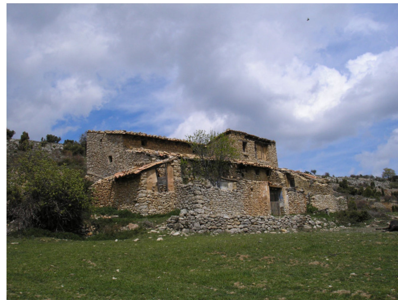
Figura 5.13. El mas de la Serreta, als Ports, actualment abandonat, es un clar reflex de la progressiva pèrdua d'activitat humana en aquest massís muntanyós.

Just al nord de Montcaro hi ha la urbanització del Mascar, i al nord-est de la unitat dels Ports, en els vessants que donen a la part nord de la Plana del Baix Ebre-Montsià, hi ha els nuclis urbans de Paüls i Alfara de Carles. La urbanització del Mascar, és un conjunt de cases unifamiliars aïllades construïdes enmig del bosc a partir de la dècada de 1970, i que han actuat de segones residències de muntanya per a un segment de població de l'entorn de Tortosa. Paüls i Alfara de Carles, per la seva banda són dos nuclis urbans petits (626 i 392 habitants, respectivament), compactes, i situats un punt enlairats respecte el territori que els envolta. Similarment passa a Prat de Comte (194 habitants), situat en una petita depressió entre Los Ports i les Serres de Pàndols-Cavalls.