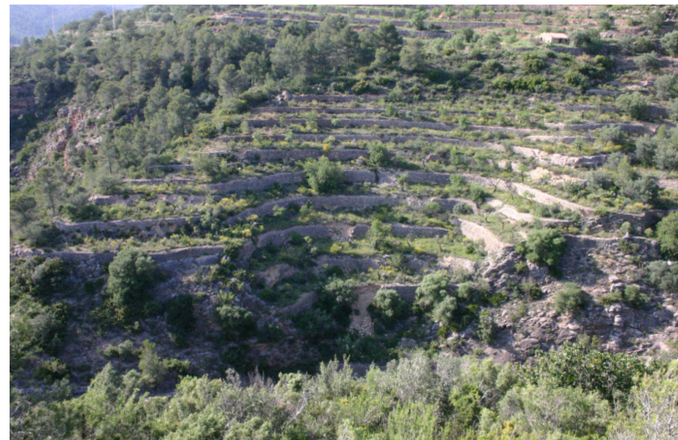
Figura 5.10. Antics conreus emmarjats a l'interior de les Serres de Cardó-Boix

La serra de Boix compta amb un atractiu paisatge escarpat, d'entre els quals destaquen el morral de les Nines i el tossal de Cabrafeixet, essent aquest darrer indret una mostra important de patrimoni cultural, ja que hi ha un conjunt de pintures rupestres força interessant.