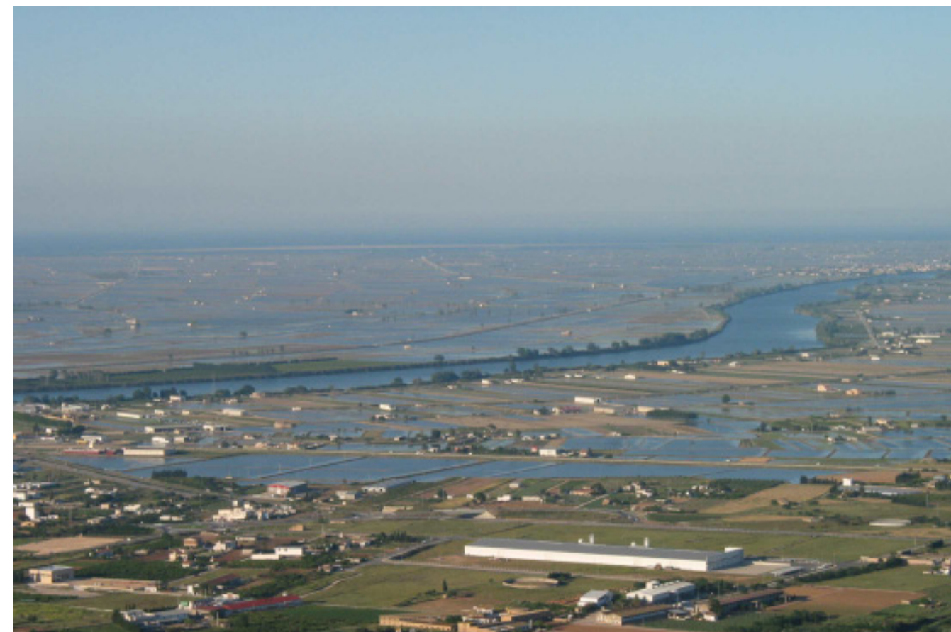
Figura 5.32. Panoràmica del Delta de l'Ebre inundat, des del Montsianell, a les Serres de Montisà-Godall.

Així doncs, el paisatge s'ha anat transformant cap a l'agrícola de regadiu actual tot desplaçant alguns usos extensius que tenien lloc a la plana deltaica (obtenció de sal, cultius de cereals, cultius