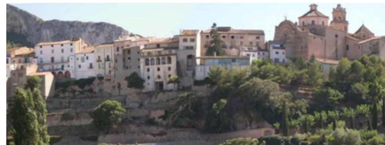
Figura 5.14. Façana del nucli urbà de Tivissa

A mig camí entre les serres i les planes hi ha situats nuclis com Mas de Barberans o Tivissa, que esdevenen balcons o miradors d'amplis territoris, i que en general han mantingut la seva estructura bastant intacta, sense transformacions consistents.