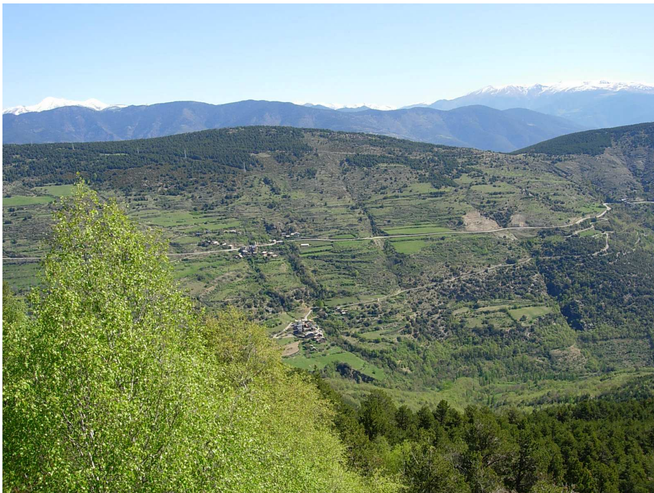
Figura 5.9. Mosaic agroforestal al voltant dels pobles de la vall del riu de Pallerols, amb Pallerols del Cantó i Cassovall

dissenyadors del paisatge actual. I és que l'ús del territori estava fortament condicionat per la base de la subsistència de les comunitats, que era l'agricultura de cereals. En canvi, la ramaderia permetia comerciar i, per tant, obtenir uns ingressos addicionals que es podien estalviar i contribuïen a l'enriquiment dels individus, si hi havia suficient marge. El resultat d'aquestes estratègies ha configurat un paisatge al voltant dels pobles amb terres de conreu fèrtils i individualitzades com a patrimoni de les cases, amb pocs arbres si no és en filera al voltant dels bancals i, més enllà d'aquests espais, les terres comunals en forma de boscos i vies de pas i camins d'accés, bé cap al fons de la vall, bé cap a les pastures. En l'actualitat aquest sistema, majoritàriament basat en la ramaderia, està en crisi i està donant peu a un seguit de dinàmiques d'abandonament que poden canviar l'entorn al voltant dels nuclis. A més, s'ha de tenir en compte que moltes residències estan sent ocupades per població que no és activa en la relació amb el medi natural i això afavoreix la forestació i l'emboscament d'antics entorns rurals, afectant la morfologia de les poblacions.