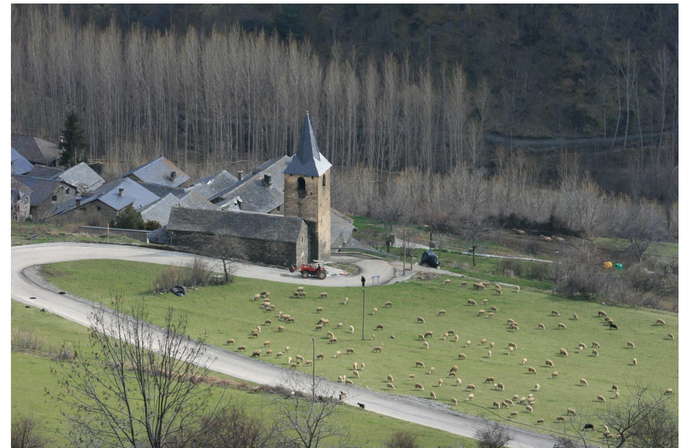
Figura 5.1. La petita vall d'Esterrí de Cardós gaudeix d'un dels paisatges més variats i rics de la unitat, amb un mosaic agroforestal de gran bellesa i estètica que denota encara un aprofitament ramader i forestal rendible i amb uns nuclis compactes

Cerdanya, Isona, Gavet de la Conca, Fígols, Salàs de Pallars, bona part de les poblacions de la vall Ferrera i les poblacions compreses entre Ribera de Cardós i Lladorre i una bona majoria de l'eix d'Isil, sense oblidar alguns nuclis com Cardet, Còll o Llesp. També cal mencionar els nuclis de mig vessant envoltats de prats i que recullen la tradició ramadera de l'àmbit d'estudi i on destaquen Bausen o els voltants de Vilamòs a la Val d'Aran, l'entorn d'Esterrí de Cardós, Bonestarre o Farrera al Pallars, parts de la Vall de Boí, Pobellà, Gerri de la Sal, els vessants de les Valls de Castellbò o entre Ortedó i Vilanova de Benat, Ansovell i Cava o Meranges.