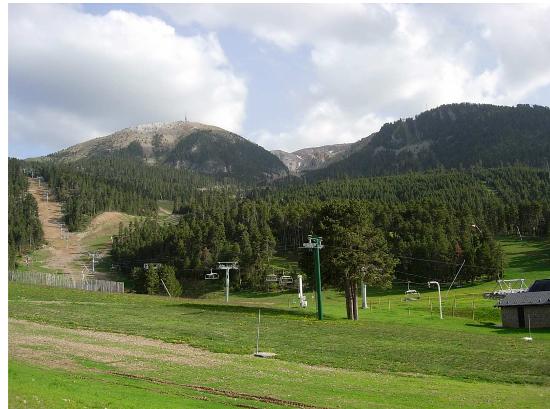
Figura 5.5. Els prats i boscos del vessant septentrional de la Tosa d'Alp, per on s'estenen les pistes d'esquí de Masella

Des d'un punt de vista socioeconòmic, aquest espai geogràfic que pot semblar isolat i aïllat de les pràctiques humanes ha tingut un gran pes en la gestió dels recursos naturals dels Pirineus i ha donat lloc a diferents processos d'especialització. L'altitud determina la presència de la neu i la neu la de l'aigua, la qual cosa permet que sigui una zona molt ben irrigada apta per al creixement de l'herba i fàcilment convertible en pastures. Això si el pendent permet un bon terraplenament de l'espai i evitant les zones més escarpades, sovint plenes de tarteres. Es tracta d'un territori que no és apte per a l'activitat agrícola. Per això, en l'actualitat és el resultat de diferents activitats que l'han mantingut i gestionat fins als nostres dies i que han deixat enrere aquesta tradicional ramaderia, que abans era molt més intensa i ara en molts llocs és purament testimonial o inexistent.