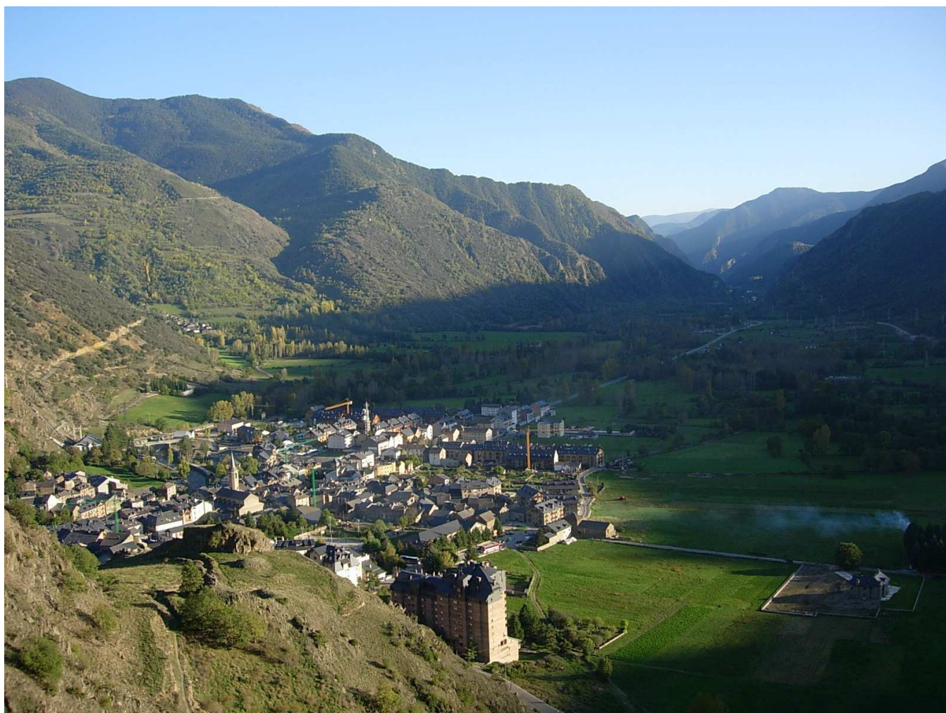
Figura 5.10. La cubeta d'Esterrri d'Àneu és un dels fons de vall d'origen glacial més característics de l'alt Pirineu

tant materials durs com tous. Com que les roques dures costen més de gastar que les roques toves el ritme és més lent i el llit del riu és abrupte i es formen passos estrets, com el congost de Tres Ponts al Segre, els de Terradets i Collegats a la Noguera Pallaresa o el de Mont-Rebei a la Noguera Ribagorçana. En canvi, allà on els materials són tous perquè han travessat faixes toves d'argiles o margues, les lleres s'eixamplen formant petites conques d'erosió o planes al·luvials, com la Conca de Tremp a la Noguera Pallaresa o els plans d'Organyà i Oliana al Segre. Aquestes depressions de morfologia suau faciliten els conreus de secà en àrees abançalades. En aquest sentit destaca la Conca de Tremp, en mig d'una regió força seca i amb una continentalitat acusada que provoca una vegetació rasa i escassa que sovint s'aixaragalla i forma badlands o zones d'erosió.