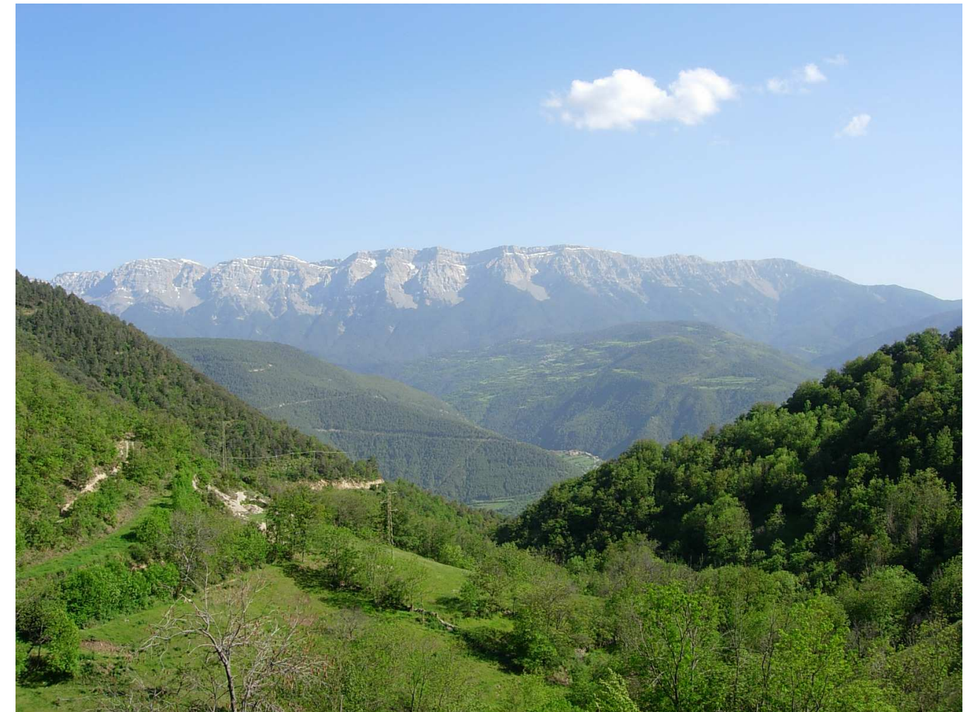
Figura 5.7. Les rouredes i els alzinars de caràcter més mediterrani, juntament amb petits camps als voltants dels pobles, formen part del paisatge vegetal de la franja meridional de la Solana del Baridà

La vegetació permet distingir la muntanya mitjana en dos grans sectors: el de les rouredes i pinedes muntanyenques seques i el de les pinedes, rouredes i fagedes de tipus medioeuropeu o atlàntic, amb un llindar difícil de situar. En aquestes zones les precipitacions totals anuals oscil·len entre els 700-800 mm i els 900-1.000 mm, i les temperatures mitjanes anuals, entre els 8°-12°C. Una part molt important d'aquests boscos es troba en terrenys calcaris, tot i que a través de les fondalades dels principals cursos fluvials també arriba als ambients més silícics, cas de zones al voltant de La Terreta, La Conca de Tremp, Boumort i les valls baixes que encerclen el riu Segre.