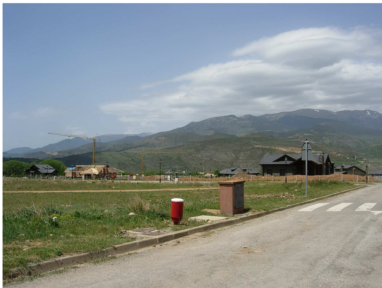
Figura 5.12. Creixements urbanístics de baixa densitat al municipi de Prats i Sansor, a la Vall Cerdana

El fet que per la major part dels fons de vall de tot l'àmbit de l'Alt Pirineu i Aran transitin les principals vies de comunicació, la majoria de les quals creuen els principals nuclis de població i, que això es dugui a terme al costat del riu i en l'espai en el que es concentren les principals activitats econòmiques, fa que el sentit de la oïda jugui un paper important en la percepció del paisatge. Mentre que la vista, que potser és menys important des d'aquestes fondalades, ja que sempre són millors les observacions des dels punts elevats, en canvi, sí que determina la percepció d'una gran part de la societat que visita aquestes contrades. Per aquesta raó, la percepció del paisatge de fons de vall que es desprèn en visitar la zona s'estructura entorn a les poblacions i les seves característiques visuals i sonores particulars fonamentades en el patrimoni històric i natural: teulades de pissarra, arquitectura romànica, ramaderia bovina, un riu cabalós i l'aigua, prats verds, etc. Quan aquests espais de fons de vall han quedat aïllats dels cursos principals també han tingut un paper destacat en la representació de certs valors representatius de la tranquil·litat i el silenci i l'origen antic del lloc: «en aquesta vall es pot escoltar silenci» o «Catalunya té mil anys, Àreu ja hi era» diuen alguns cartells a l'entrada a la vall Ferrera.