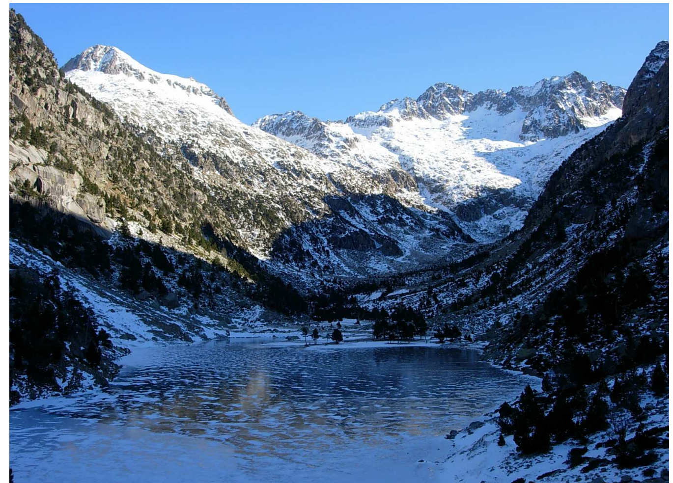
Figura 5.3. Imatge hivernal de l'estany de Besiberri i la cresta homònima

Des d'un punt de vista estructural costa trobar en el Pirineu indrets no afectats per cap de les orogènies alpines. Els plegaments caracteritzen aquestes muntanyes i això fa que les capes dels diferents materials puguin aparèixer verticalitzades, però també amb capbussaments diferents configurant els típics relleus en forma de valls que tanta importància tenen en les relacions de tota mena de sistemes. Els materials durs i els tous s'alternen i poden formar característics relleus en graderia a la Conca de Tremp i costals a la Serra del Cadí. Tot i que normalment el que abunda