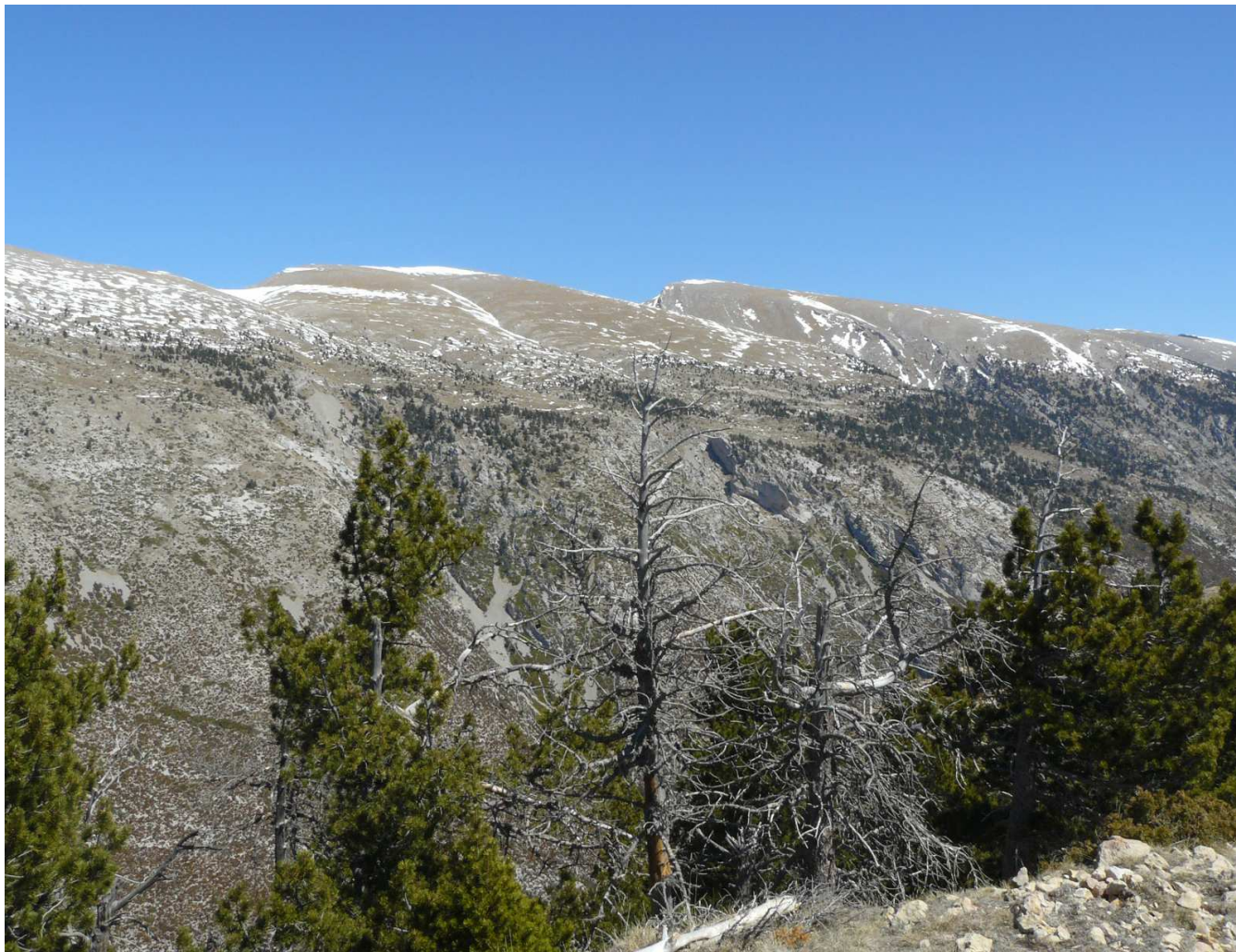
Figura 5.6. Aspecte de l'aspre i sec vessant sud de la serra del Cadí des del cim del Cadinell

Per aquesta raó, a l'hora d'analitzar la coberta vegetal de les valls, cal tenir en compte el fenomen de zonació propi de les muntanyes prou altes però també la zonació que de forma continuada es dona des de les parts més altes de la vall a les parts més baixes a mesura que el curs del riu avança. A més, si a la diversitat de materials i de substrats hi afegim la dels pendents i hi sumem els condicionants climàtics, la vegetació es repartirà per un conjunt de dominis de caràcter propi en funció de l'altitud i l'orientació. Dit això, els ambients propis de les valls pirinenques poden anar des de la vegetació específica de la muntanya plujosa submediterrània, medioeuropea i atlàntica fins a l'alta muntanya subalpina i boreoalpina, amb un paper determinant de l'orientació al sol o a l'obac.