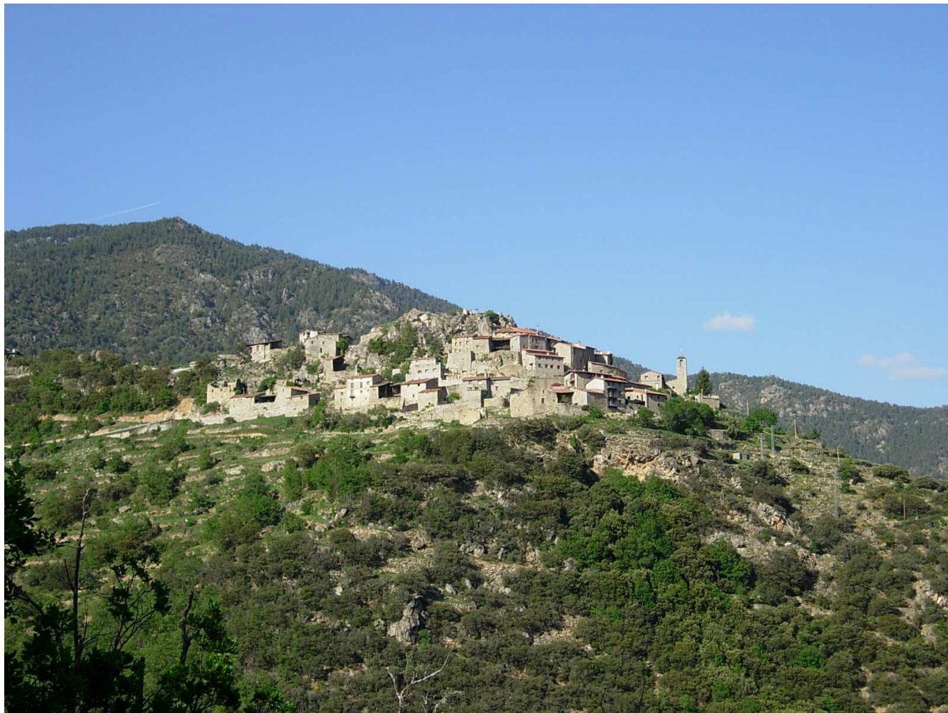
Figura 5.8. L'encimbellat nucli d'Aristot, al sector de la unitat del Cadí situat a la solana del Segre

Fruit d'aquesta lògica, en l'actualitat trobem molts més pobles a les solanes de les valls i a més altitud que no pas a les obagues. I és molt més fàcil identificar restes de murs de pedra seca i antics camps de conreu abandonats en orientació sud que no pas al nord. Aquests nuclis acostumen a ser molt agrupats i sovint destaquen per la localització encimbellada o a raser d'algun abric en forma de roca, com passa a bona part dels pobles de la Solana del Baridà i a la majoria de nuclis de les unitats prepirinenques en general.