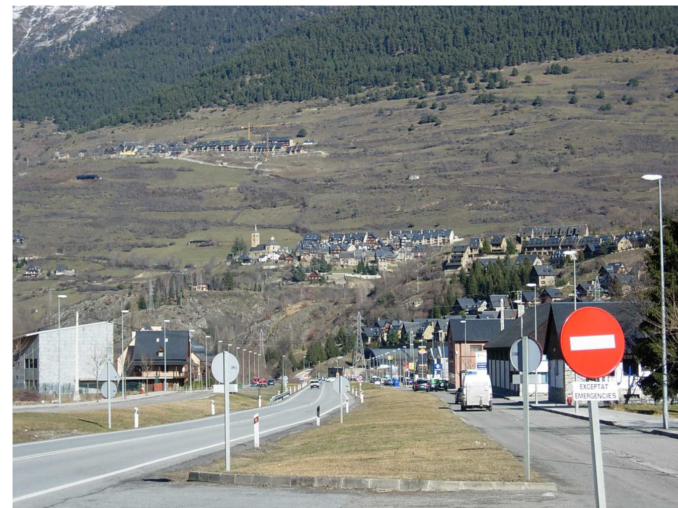
Figura 5.11. Els fons d'algunes valls de l'àmbit han experimentat grans transformacions degut als desenvolupaments urbanístics i industrials, de les vies de comunicació i dels aprofitaments hidroelèctrics dels cursos fluvials, com a Vielha i els seus entorns

A més, s'ha de tenir en compte que aquests nuclis que actualment han esdevingut claus per la seva capacitat de node de serveis, en origen van ser importants perquè van saber centralitzar l'organització d'uns paisatges agrícoles molt importants. Tremp i la conca, La Seu d'Urgell i tots els marges del Segre, Puigcerdà, etc., són casos en els que la ciutat es situa al voltant de grans zones de conreu