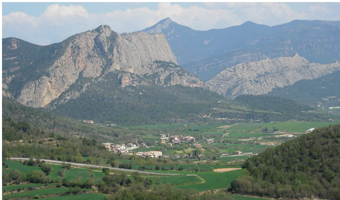
Figura 5.2. Poblament dispers a la Rodalia d'Oliana

Els poblaments compactes són els predominants a l'àmbit d'estudi, ja que l'estalvi de recursos (energia per l'escalfament, sòl apte per al conreu i consum d'aigua) durant molt temps era obligat per a l'establiment humà. No obstant això, allà on les condicions ambientals ho permetien i l'aprofitament de l'espai així ho recomanava, l'assentament és dispers, és a dir, nuclis o grups de cases no gaire grans repartits en un sector de territori més o menys extens. La plana cerdana destaca per aquest fet a tots dos marges del riu Segre, amb un saltejat de nuclis repartits aquí i allà que antigament es miraven de repartir l'espai i ocupar poc territori fèrtil. Destaca la zona al voltant de Prats, Urús, Das i Alp a la Cerdanya, els voltants de la Seu d'Urgell, amb Alàs i Banat, o Aravell i zones com Montan de Tost, Gramós o Nabiners. A tocar del Segre també hi ha els voltants de Fígols i Organyà o la zona de Tragó, Nuncarga Aguilar, a prop d'Oliana. A la conca de la Noguera Pallaresa destaquen alguns conjunts situats al voltant de Sort o la Coma de Burg, al nord, i al voltant de Tremp, al sud. Mentre que a la Noguera Ribagorçana i a l'interior de La Terreta sobresurt la zona al voltant de Castissent, Tercui, Espills i Escarlà.