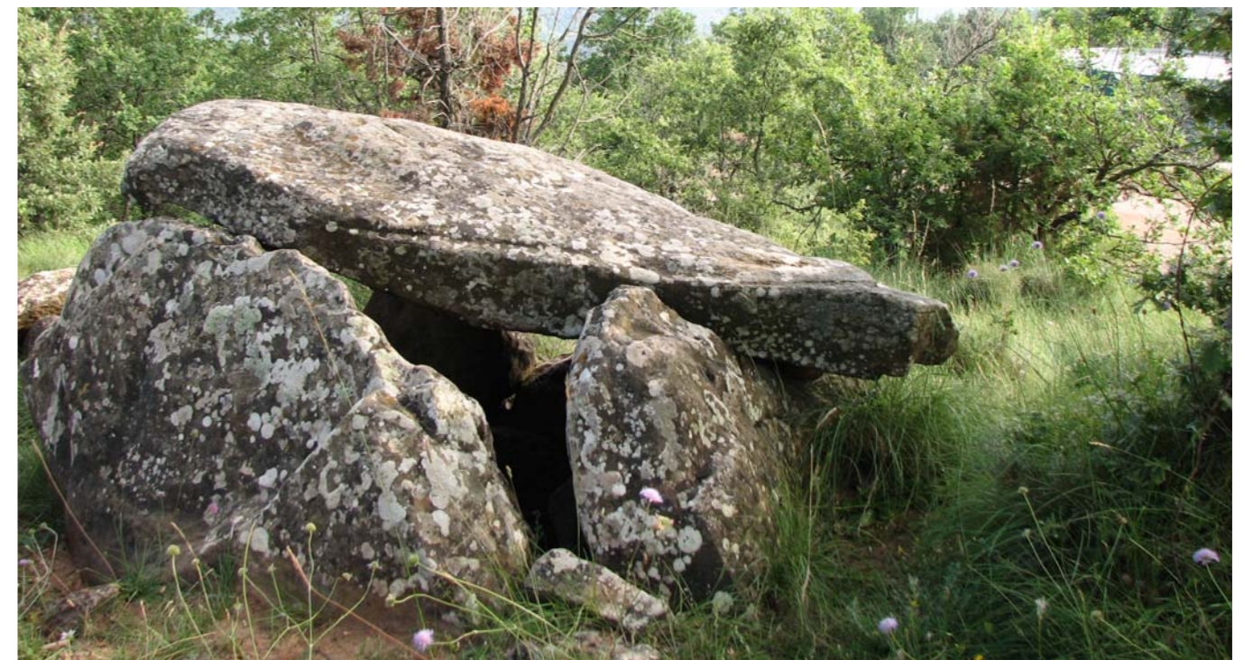
Figura 4.3: Dolmen de Puig-rodó, Moià. Moianès.