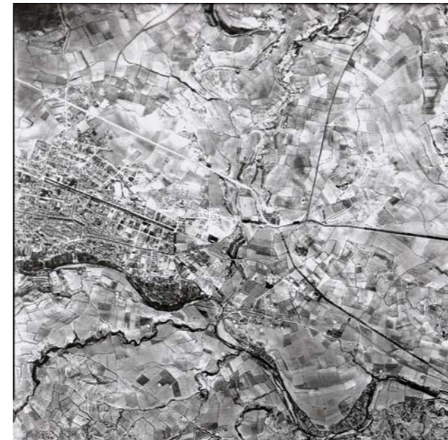
Figura 4.19: Imatge aèria de la Conca d'Òdena el 1956, on s'observa un sector d'Igualada.

facilitar la comunicació local entre el Bages i el Berguedà. El paper d'aquesta infraestructura lineal es complementà amb el túnel del Cadí (1984), amb l'autopista Terrassa – Manresa (1989) i amb la C-25 o Eix transversal (1997). Totes aquestes infraestructures lineals de comunicació, en relació amb els elements del territori, es feren sense tenir en compte, per exemple, en la geometria del traçat les pautes visuals o els espais segregats pel pas de la via la qual cosa generà impactes en el paisatge.