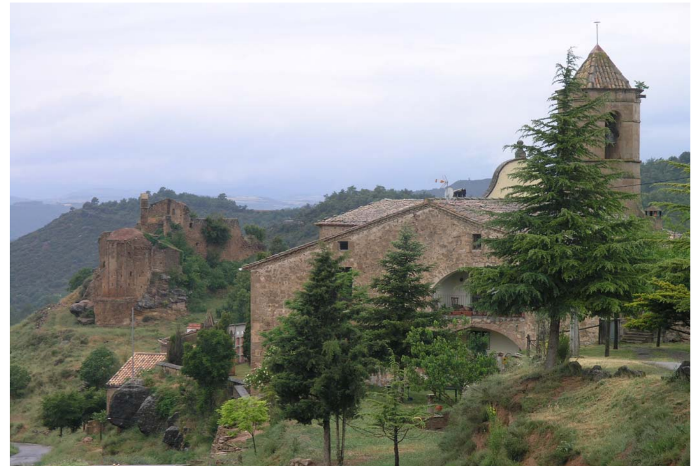
Figura 4.6: Sant Pere de Madrona (S. XI), Pinell de Solsonès.

A més a més d'aquests escenaris rurals i agraris, cal tenir en compte, també, el que conformen amb el temps les trames urbanes dels nuclis medievals de Cardona, Manresa, Vic, Solsona, Berga i Igualada. A