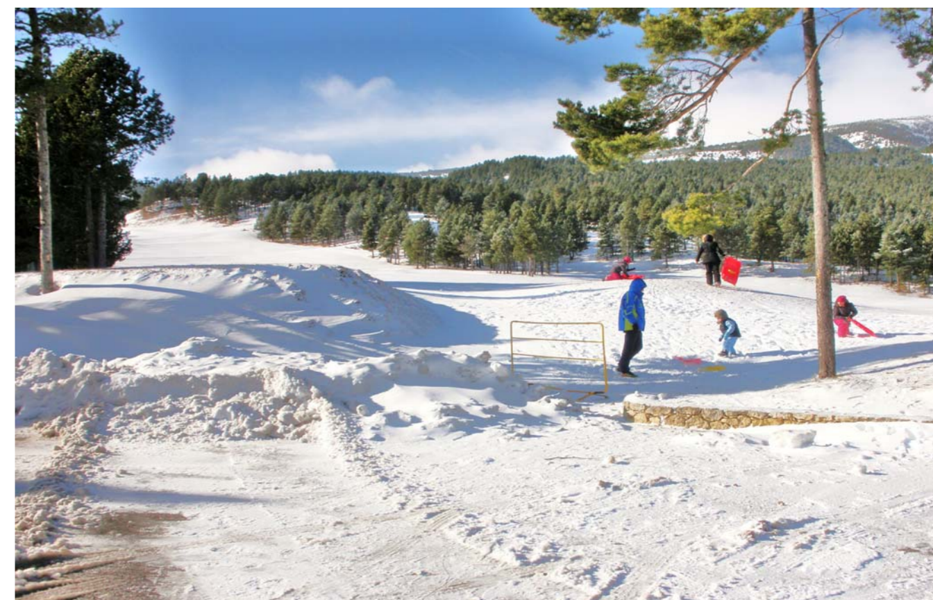
Figura 4.15: La nova percepció de les zones de muntanya han permès trencar la tendència al despoblament. La Coma i la Pedra.

Ara bé, aquest àmbit territorial també esdevé un pol d'atracció d'immigrants; especialment, els nuclis de Berga, Manlleu, Vic, Manresa i Igualada. En tots ells la construcció de noves extensions urbanes per a satisfer la demanda d'habitatge es feu sense planificar, es construï de manera deficient, es deixaren per a més endavant els serveis, esdevingueren àrees deslligades dels nuclis antics i, també, canviaren la fisonomia urbana. A Manlleu, que en 30 anys (1950-1980) passa dels 7.294 als 15.962 habitants, es construeix el barri de l'Erm. A Manresa s'aixequen cases barates i habitatges de protecció oficial, entre d'altres llocs, als barris de la Balconada, el Xup, la Parada o la Font dels Capellans. A Berga es construeix el barri de Santa Eulàlia, a Igualada el de Fàtima i a Súria el de Salipota.