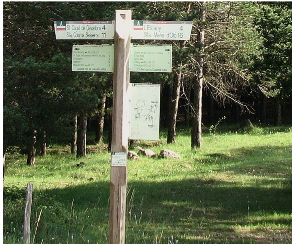
Figura 4.16: Els canvis territorials i culturals han creat nous usos de gaudi del paisatge. L'Estany, Moianès.

L'any 1979 s'instauen de nou els ajuntaments democràtics la qual cosa comportà, poc o molt, un procés de reconstrucció social i econòmica així com de protecció dels elements del territori. Entre els agents d'aquest procés de canvi destaquen les reivindicacions del moviment veïnal relacionades amb els espais urbans; a Manresa, per exemple, l'any 1976 es creà la Coordinadora de Barris. En aquesta mateixa ciutat els anys 1980 es desenvoluparen diversos plans parcials per adequar, entre d'altres, el barri de la Parada. A Berga s'inverteixen diners públics al barri de Santa Eulàlia per a millorar els habitatges, construir equipaments i facilitar la connectivitat. A Súria s'inicià una important rehabilitació de l'espai urbà del barri de Salipota afectat per l'aluminosi.