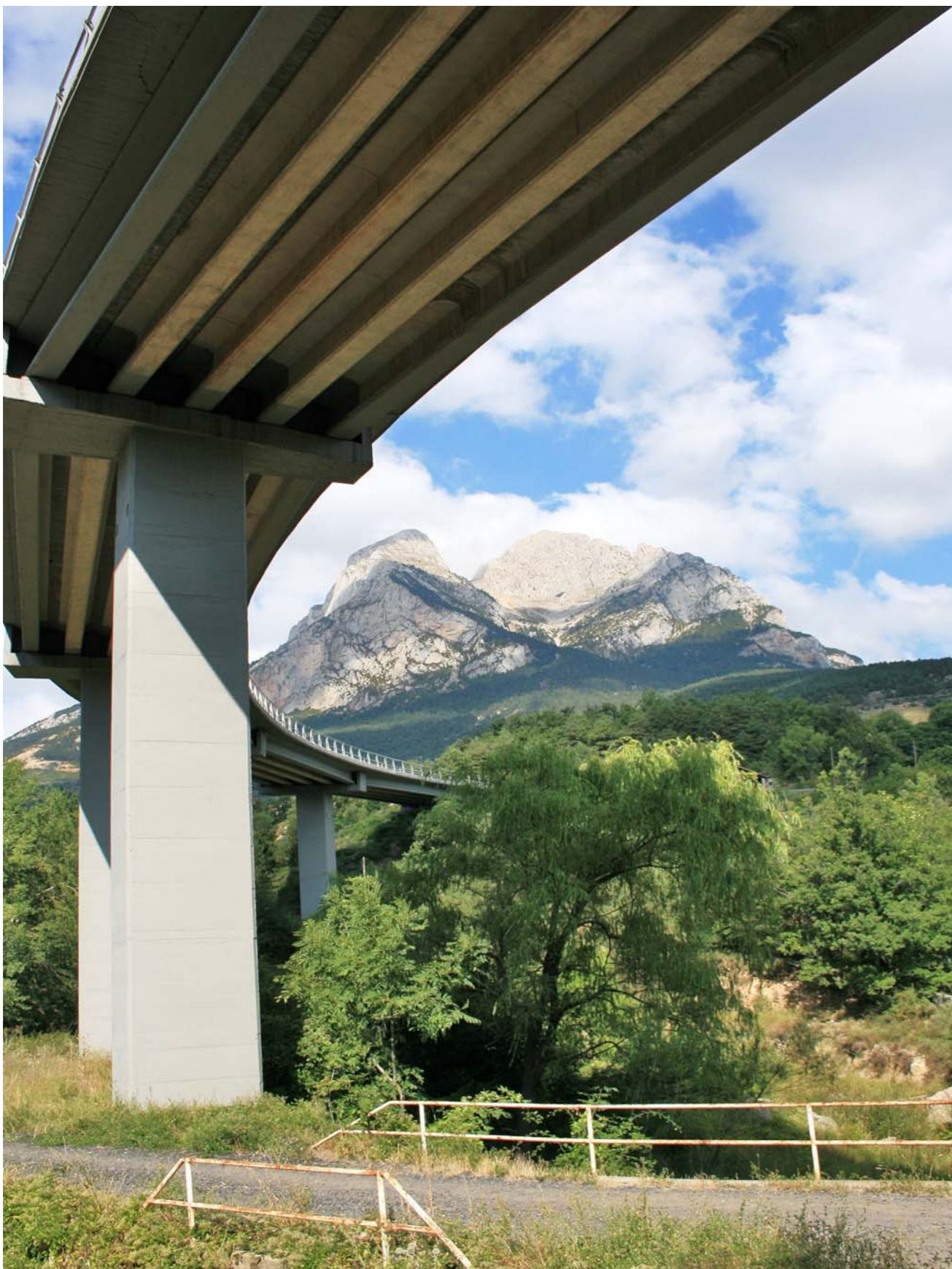
Figura 4.14: Carretera d'accés a Saldes amb el Pedraforca al fons.

L'èxode rural a partir dels anys 1960, com a conseqüència de la mecanització de l'agricultura i del creixement industrial, comportà una important davallada de la població a les zones més muntanyoses; com, per exemple, a les Capçaleres del Llobregat, Ribera Salada i Rubió-Castelltallat-Pinós. De manera més concreta, els casos dels nuclis abandonats de Peguera (Fígols), Uixols (Castellterçol) i Rodors (Moià) exemplifiquen aquesta realitat.