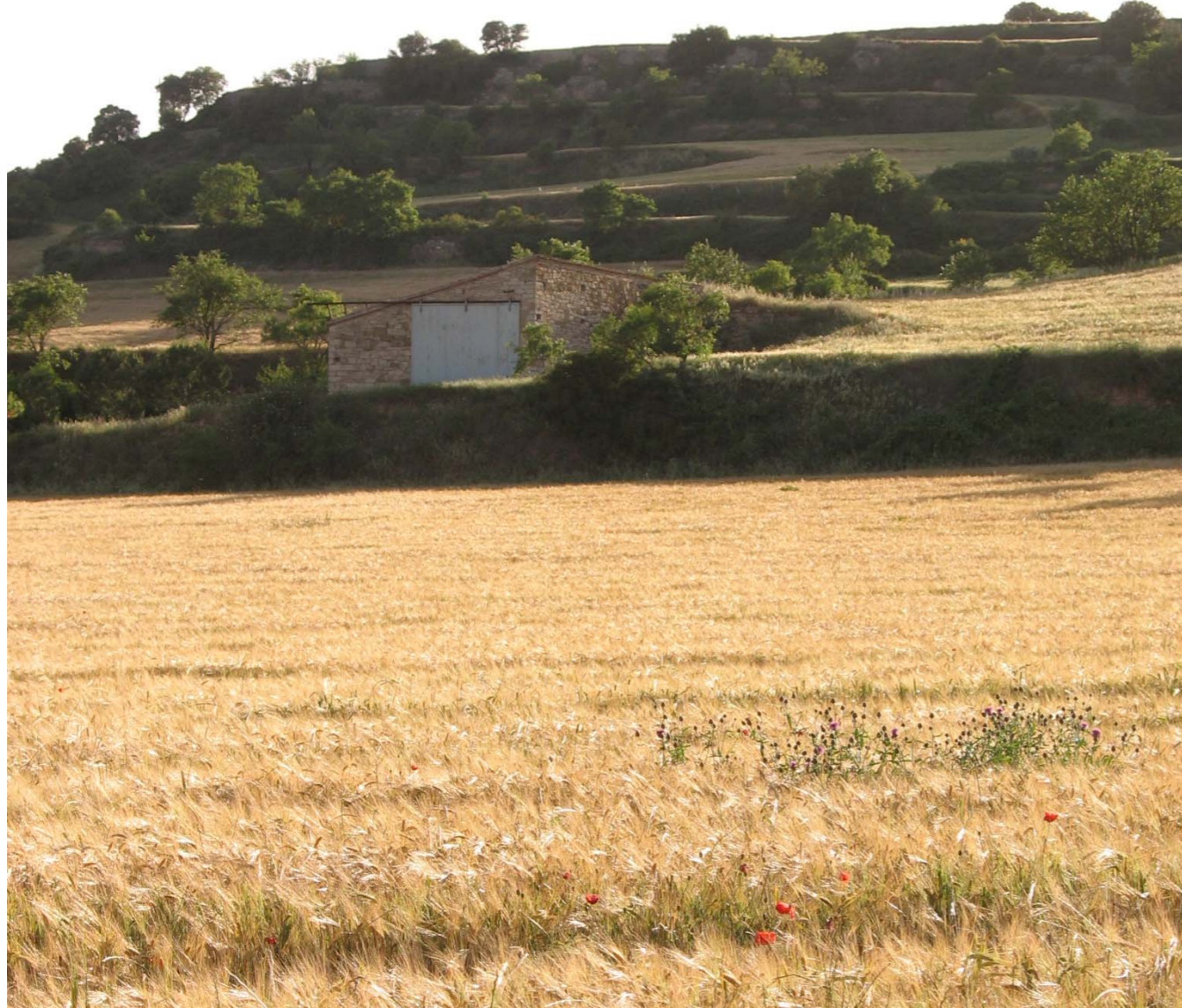
Figura 4.18: Camp de cereals a la Guàrdia Pilosa, a la unitat de paisatge dels Costers de la Segarra.

facilitar la comunicació local entre el Bages i el Berguedà. El paper d'aquesta infraestructura lineal es complementà amb el túnel del Cadí (1984), amb l'autopista Terrassa – Manresa (1989) i amb la C-25 o Eix transversal (1997). Totes aquestes infraestructures lineals de comunicació, en relació amb els elements del territori, es feren sense tenir en compte, per exemple, en la geometria del traçat les pautes visuals o els espais segregats pel pas de la via la qual cosa generà impactes en el paisatge.