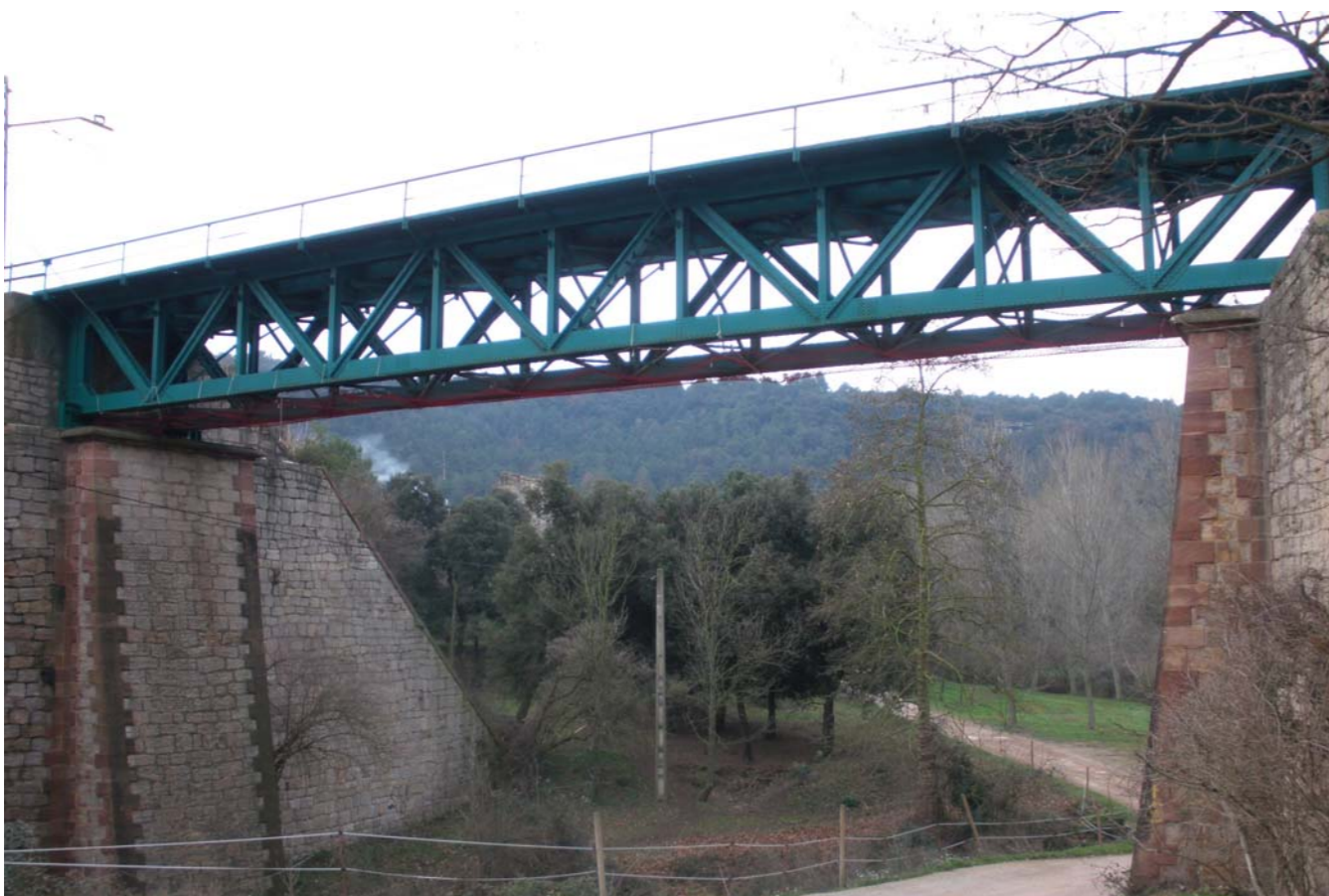
Figura 4.10: El ferrocarril permeté el desenvolupament de les comarques de la Catalunya interior. Pont del ferrocarril a Centelles.