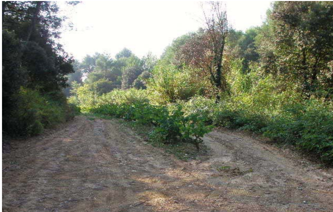
Figura 4.4: A les Comarques Centrals el conreu de la vinya va començar a ser important en temps dels ibers.

de l'Espelt (Òdena), la dels Trulls (Viver) i la de Sant Pau de Pinós (Merlès). El gran valor que adquireixen en aquesta època les dues ciutats, la divisió parcel·l·ària i les vil·les com a elements del territori explica el perquè en molts casos es perpetuen els llocs o es fossilitzen els límits. En el cas de Vic, per exemple, els emplaçaments de la catedral i del castell dels Montcada no s'expliquen sense l'herència d'aquest passat romà com tampoc la situació de moltes esglésies romàniques aïllades.