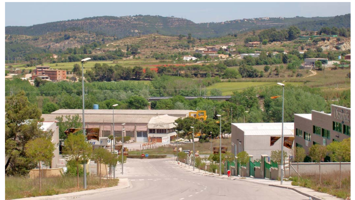
Figura 4.17: Polígon industrial a Castellbell i el Vilar.

A partir dels anys 1960 les fàbriques de manera progressiva començaren a situar-se fora dels nuclis, però, no serà fins la primera crisi del tèxtil (1970) i el tancament de les mines de carbó (1963, 1983, 1985, 1991, 1992) que proliferen els polígons industrials. Aquestes àrees especialitzades d'ús industrial es concentren, sobretot, a l'entorn de Berga, Manlleu, Vic, Manresa i Igualada. Més concretament, se situen en zones planes i ben comunicades per carretera davant la poca competitivitat de les antigues línies de via estreta. Així, per exemple, a Manresa es recolzen amb les carreteres C-16 i C-55, a Berga amb la C-26 o a Igualada amb la N-IIa. Aquests canvis s'acompanyaren, també, d'una diversificació de l'activitat i de recomposició de l'estructura industrial. En aquest sentit, a Manresa les indústries tèxtils i la mineria potàssica deixaren pas a indústries metal·lúrgiques, alimentàries i manufactureres. A Igualada van tancar les antigues fàbriques tèxtils i s'expandiren les indústries de genero de punt, de la pell i del paper. En general, la imatge d'aquestes àrees no suposà un valor afegit per al valor dels béns produïts. L'emplaçament, la trama, els materials, la qualitat de la construcció, els límits de l'àrea o els volums són qüestions que incidiren en la qualitat d'aquests escenaris industrials. Tot i això, destaquen, per exemple, els polígons de Les Garrigues (Calaf, 1989), el Parc d'Activitats Econòmiques d'Osona (Vic, 1989), El Polígon Malloles (Vic, 1980).