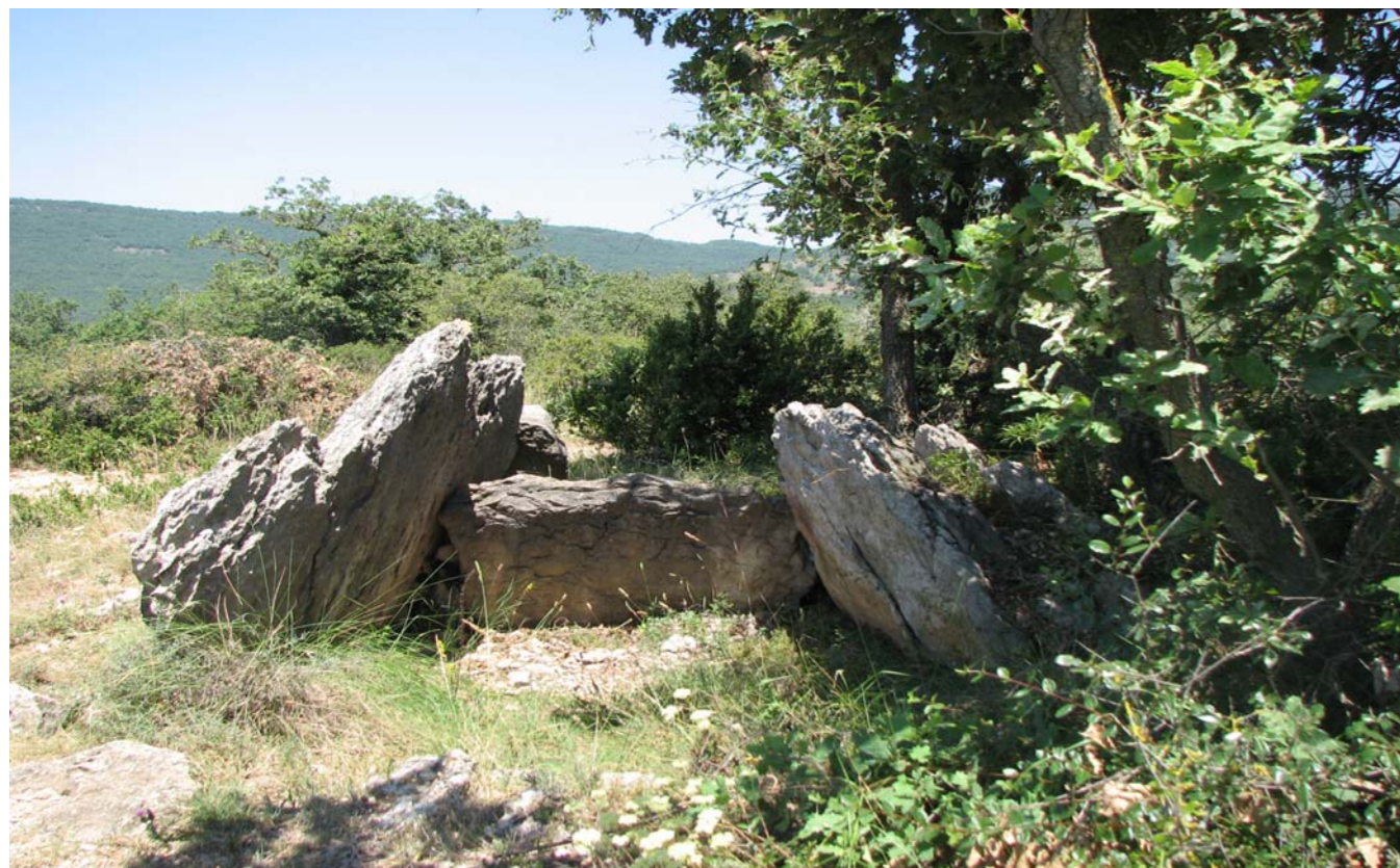
Figura 4.2: Dolmen del Cuspinar, Collsuspina, Moianès.

En època romana una part del paisatge d'aquest àmbit territorial degué experimentar una important transformació com a conseqüència de la fundació de dues ciutats; per una banda, la ciutat de Vic ( Ausa ) i, per l'altra, la dels Prats de Rei ( Municipium Sigarrens ). En ambdós casos, el fet de voler posar en evidència el poder, es canvia la imatge i el perfil dels antics assentaments ibèrics preexistents, la qual cosa altera la condició de punt de referència del territori. Aquests assentaments urbans a la Plana de Vic i als Costers de la Segarra respondrien a la necessitat de continuar explotant el mosaic agroforestal ibèric. Així doncs, a partir del segle II aC, més enllà d'aquests dos recintes urbans una part important de l'espai obert s'hauria dividit en peces quadrangulars (centúries) que incidirien en l'organització dels camins i dels límits parcel·lars especialment de les planes. Les restes d'aquesta quadrícula es documenten al Pla de Bages, a la Conca d'Òdena, als voltants de Solsona i a la plana meridional del Berguedà. D'acord amb aquesta quadrícula a les planes fèrtils i a la vall del Llobregat es construïren vil·les que, per la seva condició de construccions aïllades i programa arquitectònic, esdevindrien uns altres punts de referència del territori fins al moment inexistents. Els exemples més destacats de vil·les són la de Matacans (Artés), la de Sant Bartomeu (Navarces), la de Sant Amanç de Viladés (Rajadell), la de Boades (Castellgalí), la