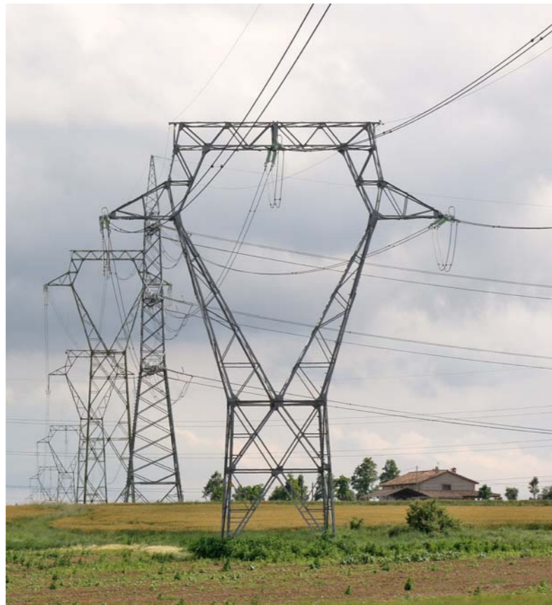
Figura 4.12: Torres d'alta tensió a la Plana de Vic.

Els diferents escenaris que conformen el paisatge durant la segona meitat del segle XX varen experimentar, més o menys segons les unitats, una important transformació com a conseqüència d'un consum indiscriminat del sòl i d'una ocupació despreocupada del territori. Aquests canvis comportaren una progressiva uniformització de la fisonomia del mosaic agroforestal, l'aparició de noves extensions urbanes per a satisfer la demanda d'habitatge, la proliferació dels espais de residència de baixa densitat i la dispersió dels polígons industrials.