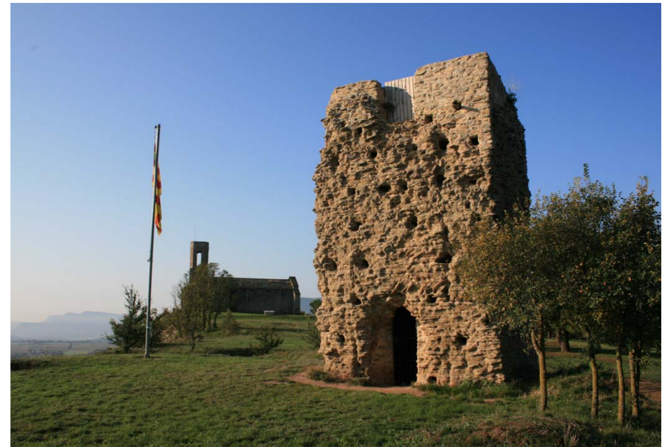
Figura 4.5: El Castell de Tona, documentat el 889, amb l'església de Sant Andreu al fons.

La via principal de pas a través era el camí reial de l'Aragó. Una infraestructura lineal d'herència romana que, des del pont del Diable de Martorell i pel coll de la Panadella, arribava a Lleida i més enllà. Els llocs de Vilanova del Camí a la Conca d'Òdena i Santa Maria del Camí (Veciana) als Costers de la Segarra són punts d'etapa d'aquest itinerari. Els camins de la sal de Cardona són altres vies de comunicació per on es traginava aquest producte cap als centres consumidors o distribuïdors; un d'aquests ramals era la via cardonesa documentada l'any 922. Altres camins de pas, entre la costa i els Pirineus, eren la via manresana entre Manresa i Vic, la via bergitane entre Manresa i Berga i la via cerdana entre Vic i Berga.