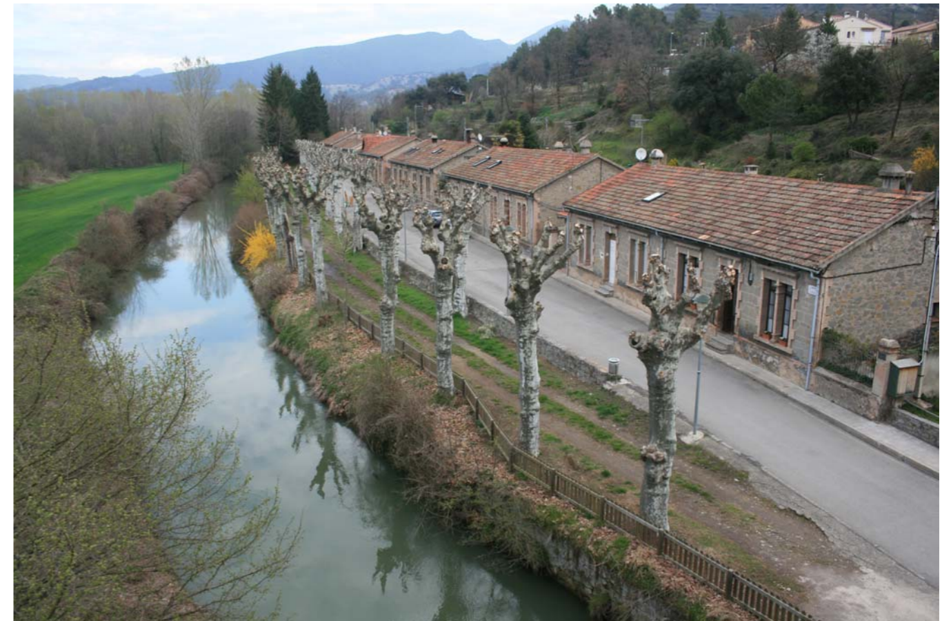
Figura 4.9: L'aprofitament de la força hidràulica dels rius i la construcció de colònies va ser una constant de principis del segle XX. Borgonyà, Plana de Vic.

El factor energètic i la xarxa del ferrocarril, entre altres factors, afavoriren la creació d'escenaris industrials nous a les conques del Llobregat i del Ter que res tindrien a veure amb l'antiga activitat artesanal. Un element destacat són els canals industrials de Berga i Manlleu; el primer pren l'aigua del Llobregat, es construeix entre 1886 i 1899 i té una llargada de 20 km, el segon aprofita l'aigua del Ter, es construeix el 1848 i té una llargada de 2 km. El cabal d'aigua servit per aquests canals possibilità aquests escenaris presidits per colònies industrials i fàbriques de riu. Als Replans del Berguedà es localitzaren algunes de les colònies més destacades com per exemple Cal Rosal (1858), la Plana (1900), Cal Bassacs (1863),