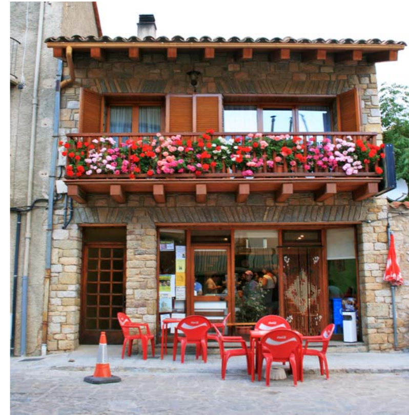
Figura 4.13: La revalorització del territori ha permès la recuperació de nombrosos pobles petits, per exemple, Gósol.

A partir dels anys 1960 però, sobretot a partir de l'any 1986 amb l'entrada a la Unió Europea, la mecanització de l'agricultura per a intensificar la producció provocà el tancament de moltes petites explotacions familiars amb el conseqüent èxode rural i l'ampliació de la superfície dels antics camps de secà. Així doncs, en un context regit per les fàbriques de pinso, als replans del Solsonès i del Berguedà s'abandona el conreu de blat i es potencia l'ordi i per contra a la Plana de Vic es planta massivament blat de moro. Un altre exemple d'aquesta nova agricultura, que poc té a veure amb la vida al camp dels segles XVIII i XIX, són les 550 hectàrees de vinya de la DO Pla de Bages creada l'any 1995. La particularitat d'aquestes vinyes rau en el valor de les varietats cultivades (picapoll, sumoll i mandó) i de les tines i les barraques de vinya anteriors a la fil·loxera.