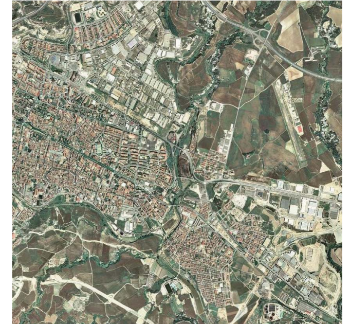
Figura 4.20: Ortofotomatge recent del mateix sector de la Conca d'Òdena il·lustrat a la Figura 4.20, on es pot comparar l'important creixement urbà i industrial d'Igualada, i el consegüent retrocés de l'agricultura.

L'any 1963 es va tancar el tram de via estreta entre Guardiola de Berguedà i Clot del Moro, el 1972 entre Olvan i Guardiola de Berguedà i, finalment tot i la protesta veïnal, el de Manresa a Olvan. Només quedà actiu el tram entre Manresa i Sallent per a transportar la potassa. La creació, l'any 1979, de l'empresa pública Ferrocarrils de la Generalitat de Catalunya va possibilitar el manteniment i la progressiva millora de les línies de via estreta entre Martorell i Manresa i entre Martorell i Igualada.