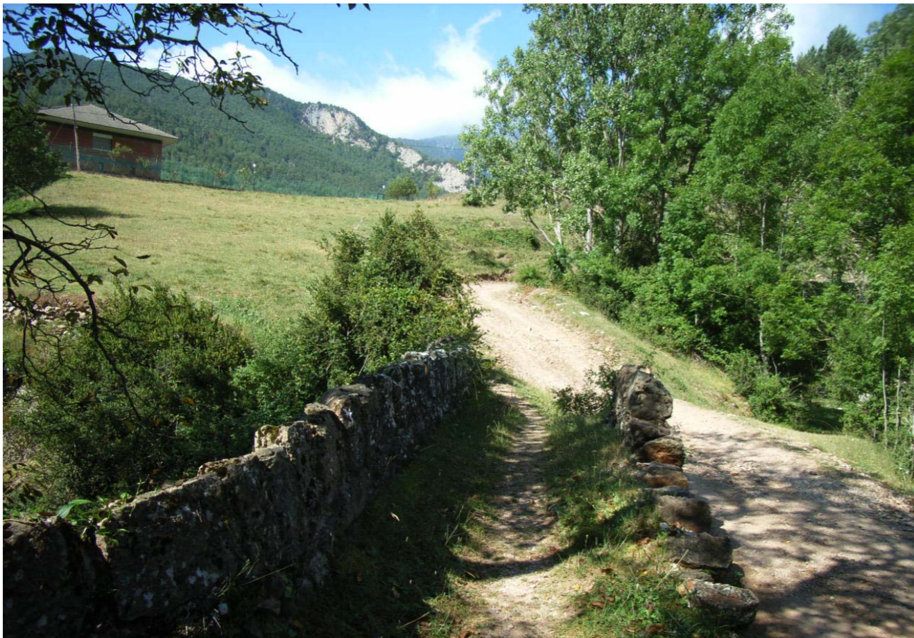
Figura 4.7: Pont del Molí de Güell, a la ruta dels Bons Homes.