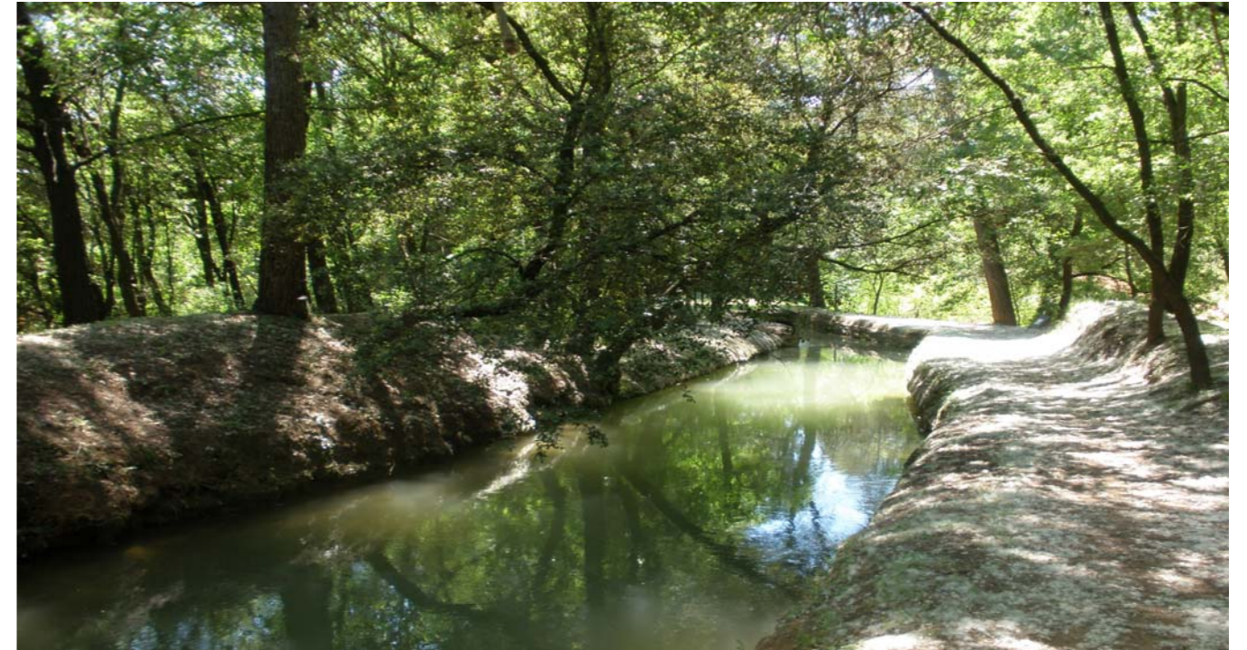
Figura 4.8: La séquia de Manresa, una de les infraestructures més importants de la Catalunya medieval.

paral·lela també es va produir una especialització agrícola per zones. Per una banda, a les unitats del sud, com ara el Pla de Bages, les Valls de l'Anoia, la Conca d'Òdena o els Costers, s'imposà la vinya per ser un conreu més rendible que el cereal. Per l'altra, a les unitats del nord, com ara els Replans de Berguedà, els Replans del Solsonès o la Plana de Vic, es mantenen els conreus herbacis de secà. En aquestes últimes zones, amb una agricultura més pobra, l'economia familiar es complementà amb una l'activitat artesanal domèstica vinculada a la draperia. No només va començar a canviar la fisonomia de molts espais agrícoles sinó també la imatge dels escenaris urbans heretada de l'època baix medieval. Durant aquesta centúria ja es començaren a enderrocar part de les muralles; per exemple, a Vic. En tot cas, la construcció de cases adossades a la muralla, com passa a Manresa, o el fet que les extensions urbanes superessin en nombre de cases a les del nucli antic, com per exemple a Igualada, comportà una progressiva transformació dels assentaments urbans. En aquest sentit, també cal tenir en compte les actuacions de millora dels accessos, la construcció de ponts, la pavimentació de carrers i la il·luminació amb fanals d'oli.