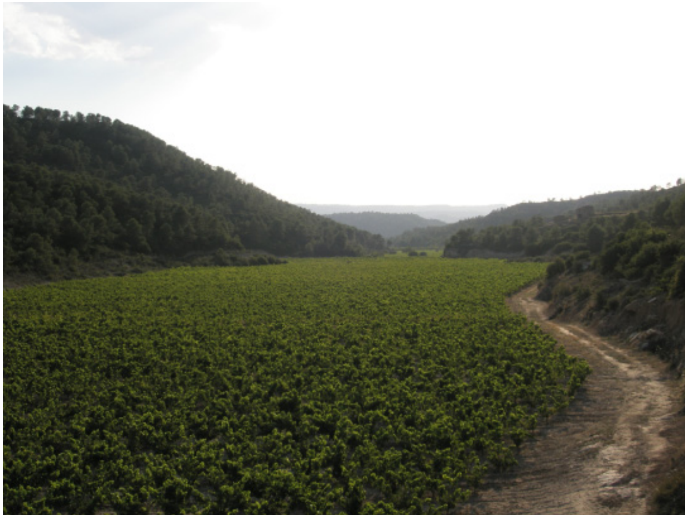
Figura 4.20. Riu de vinyes al municipi de Batea, a les Riberes de l'Algars.

Les noves plantacions de vinya a l'Altiplà de la Terra Alta i al Baix Priorat i la replantació o recuperació d'oliveres en aquests i altres territoris interiors, van ser les dinàmiques que marcarien la transformació paisatgística d'aquest sector de les Terres de l'Ebre en aquest període.