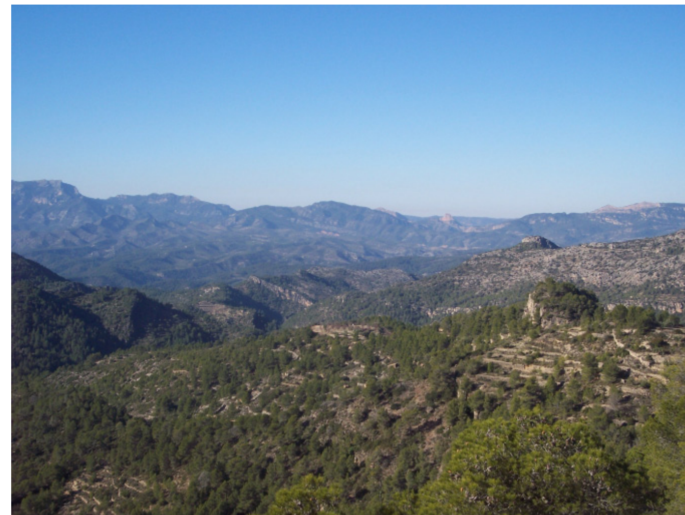
Figura 4.13. Vistes dels vessants de les Serres de Cardó-Boix, on poden observar-se restes d'antics conreus que remuntaven pels costers calcaris.

En aquest període, els espais forestals van ser explotats fins a la seva pràctica deforestació, fet que va generar processos erosius de certa magnitud. L'abundant ramaderia extensiva, juntament amb l'increment de la demanda de carbó com a matèria primera de les primeres indústries i el ferrocarril, expliquen la tala de la majoria de masses forestals ubicades en zones de muntanya. Quan es va detectar que el deteriorament progressiu de les masses forestals del massís dels Ports, considerades