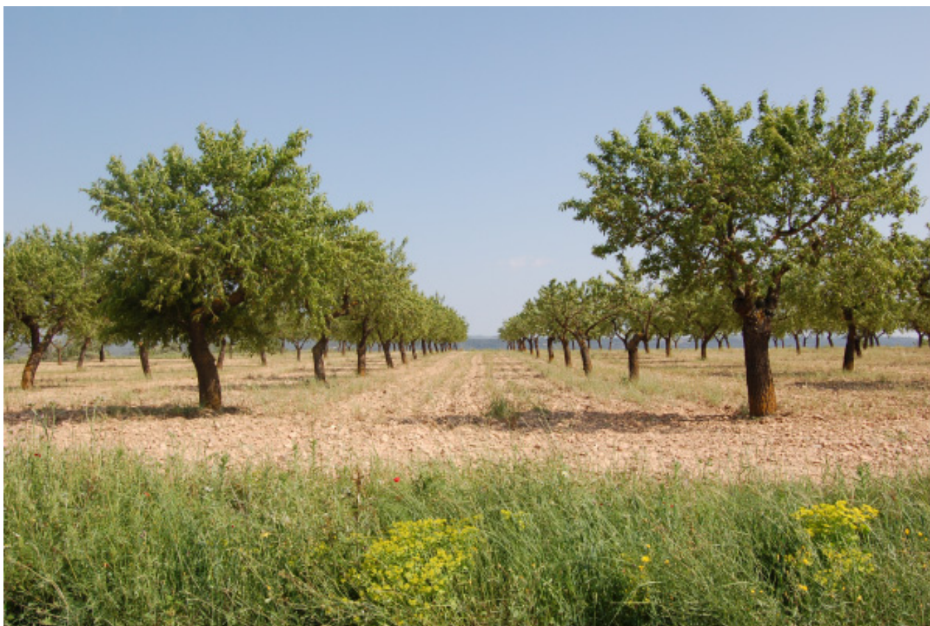
Figura 4.15. La introducció més important del conreu de l'ametller va tenir lloc a les primeres dècades del segle XX. A la imatge, detall d'un conreu d'ametllers al municipi de Vilalba dels Arcs.

En aquest sector litoral, a mesura que augmentaven les superfícies destinades al regadiu, les terres