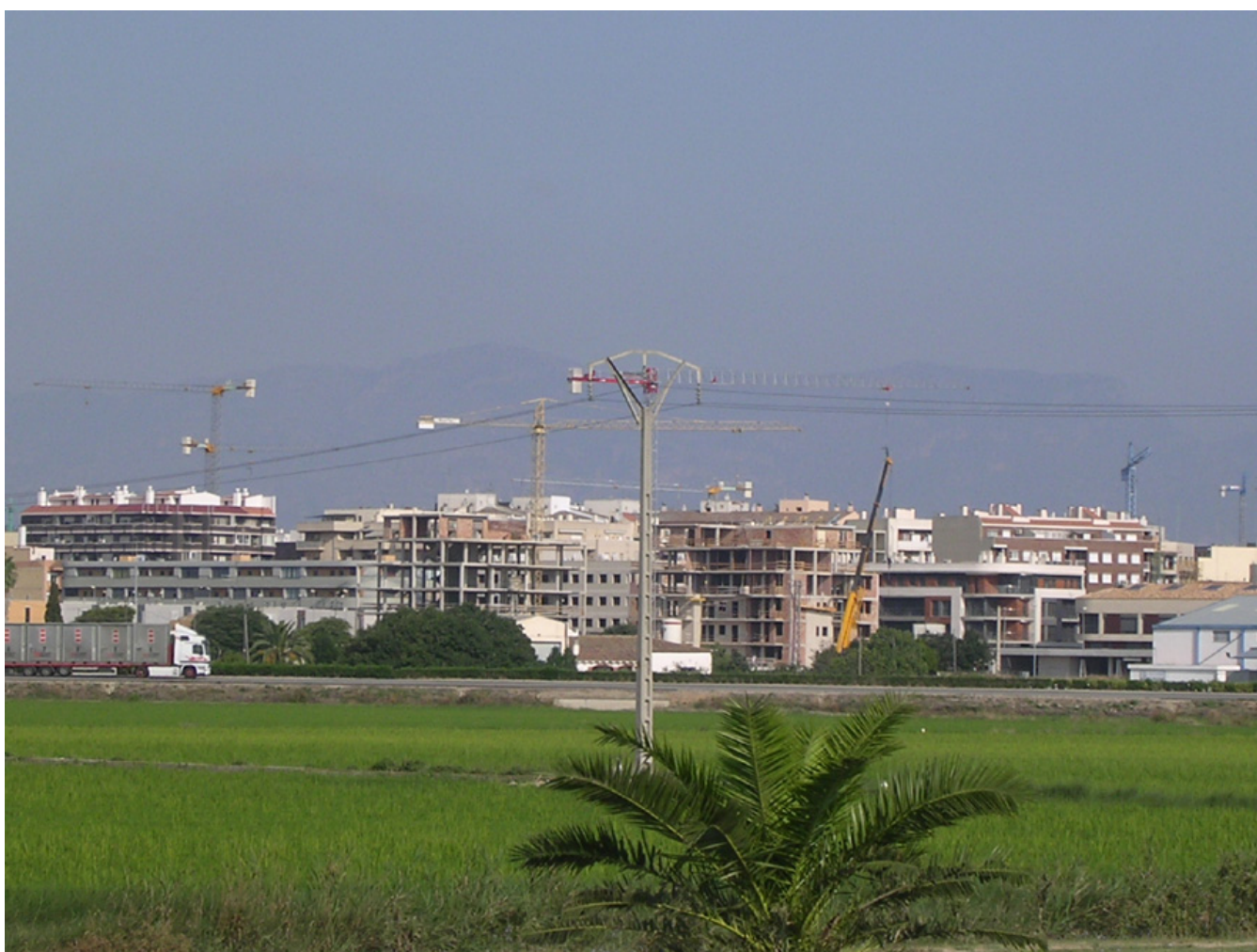
Figura 4.28. Els nous creixements dels principals nuclis urbans de les Terres de l'Ebre han estat relativament compactes, sobretot si es compara amb altres indrets de Catalunya. A la imatge, creixements urbans al sud del nucli d'Amposta.

En aquest període també es va produir un creixement urbanístic molt important del nucli urbans de la Cava i Jesús i Maria, que van acabar pràcticament unint-se en un de sol (de fet, la unió toponímica es produeix sota el nom de Deltebre). A banda de la important extensió superficial que es va assolir, especialment al nucli de la Cava, es va produir de forma que va generar uns paisatges urbans força peculiars (com també va ser el cas, en menor extensió superficial, del nucli de Sant Jaume d'Enveja, situat al marge dret del delta). Aquests creixements, que aparentment presentaven una forma desordenada, responien a una lògica de distribució familiar entre els descendents de les propietats (construcció d'habitatges adossats seguint l'estructura de les propietats), a una forma cultural de relacionar-se amb el medi (existència d'horts urbans en quasi cada parcel·la) i a una distribució capil·lar seguint els principals eixos viaris. Tot plegat fa que els nuclis urbans del delta de l'Ebre presentin un urbanisme particularitzat pel seu caràcter disseminat i per l'absència d'un nucli urbà relativament consolidat, seguint els orígens de creació d'aquests nuclis que ho feien a partir d'un conjunt inconnex de barraques, edificacions aixecades a partir dels materials de la zona: joncs,