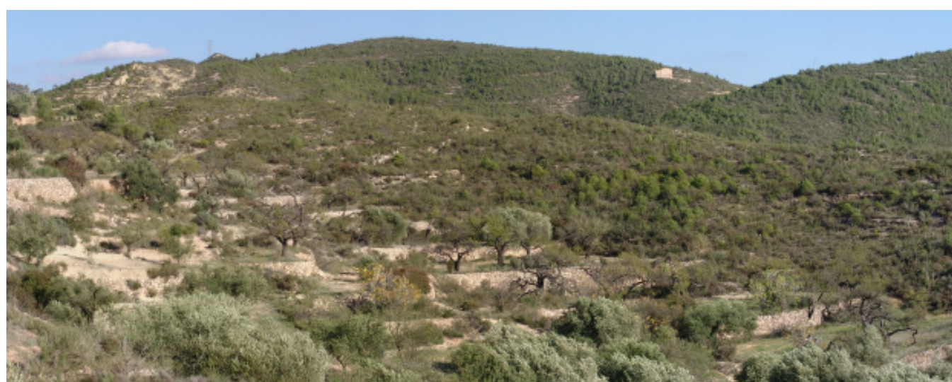
Figura 4.23. Paisatge resultant del procés d'abandonament de les activitats agroforestals als vessants de les serres de les Terres de l'Ebre. A la imatge, conreus abandonats i masses forestals resultants d'incendis forestals a la serra del Tormo.