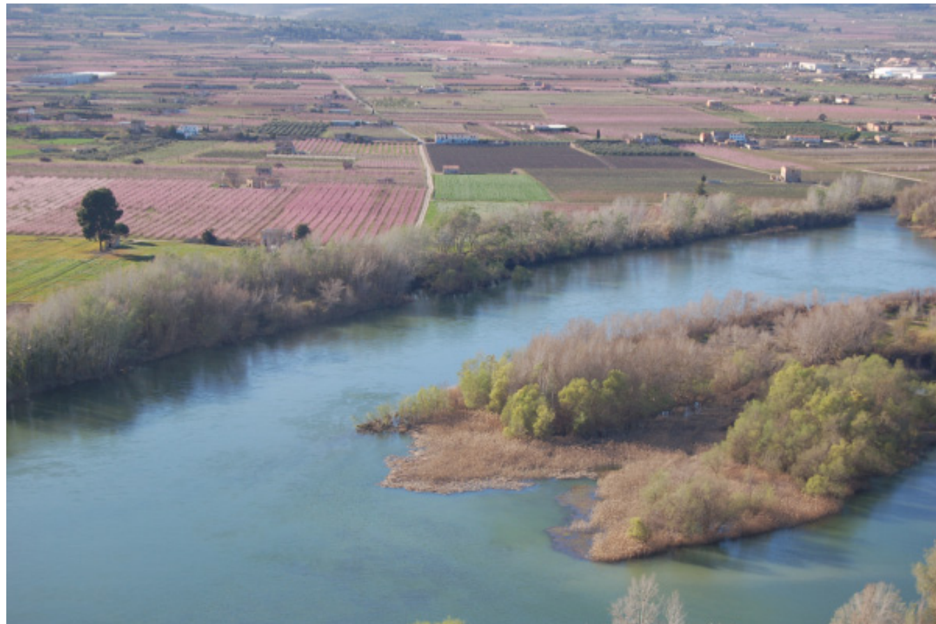
Figura 4.17. Paisatge de les sèries de Móra d'Ebre i Benissanet.

Tant a les terrasses del curs baix de l'Ebre, com a les terrasses situades a la Ribera d'Ebre, es conreaven fruiters de regadiu, com els presseguers, els perers, les pomeres, les figueres, i els albercoquers, així com també, i en menor mesura, prunes, melons, síndries, cireres, nespres, llimones i fins i tot fals safrà.