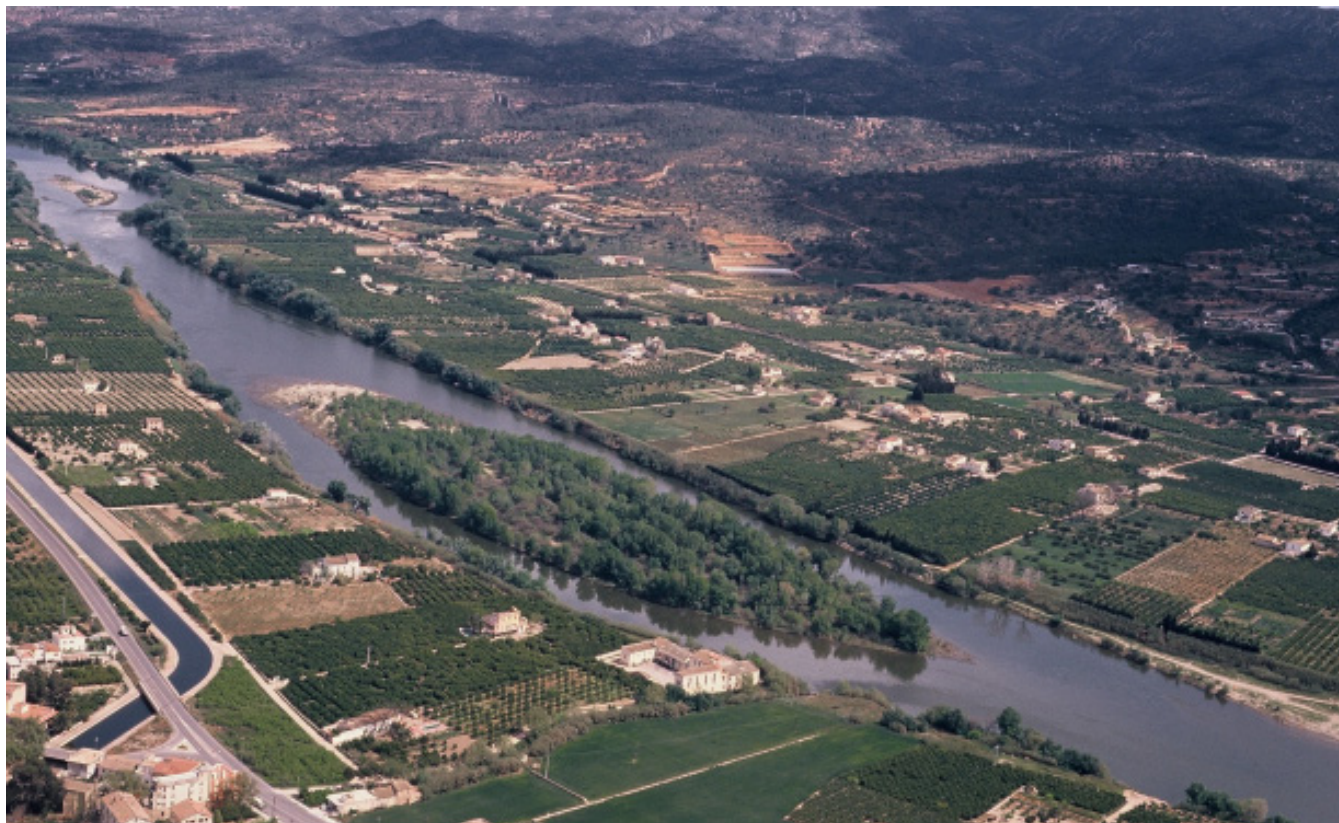
Figura 4.5. Paisatge fluvial de l'Ebre actual a l'altura de Jesús i Bitem, que es va començar a estructurar durant l'època islàmica.

Durant els s.XII i XIII, els Costums de Tortosa 1 van fomentar el conreu de la terra, afirmant el dret de propietat; un dret obtingut per donació o altre procediment. Els Costums autoritzaven a ampliar el terreny cultivat mitjançant un procediment que consistia a llençar una pedra fora de les fites de la propietat, en els terrenys erms circumdants. Es podien cultivar les terres que quedaven entre la propietat i la pedra. El procés podia continuar fins que s'arribés a unes altres fites de propietat pública o privada. Sembla que fou una manera de fer que va arribar fins a finals de s. XIX. Aquesta llei, que va permetre que l'agricultura arribés fins a llocs insospitats, permetia també la introducció de millores i la conversió de camps de secà en regadiu per mitjà de la construcció d'assuts, sínies i sèquies. Els conreus que s'hi produïen eren de civada, blat, ordi, cànem, oli, vi, llegums i productes d'horta.