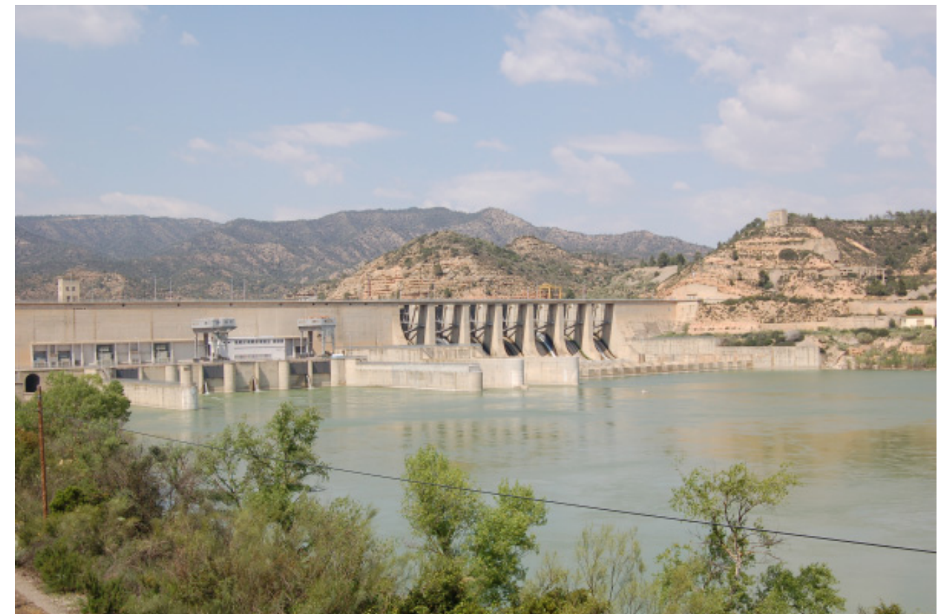
Figura 4.21. Presa de l'embassament de Riba-roja d'Ebre, als Costers de l'Ebre, construïda durant la dècada de 1960.

Durant aquest període, en aquestes comarques interiors la població disseminada va disminuir fins pràcticament desaparèixer, excepte en les esmentades sènies de la vora del riu Ebre. Només alguns pobles de la vora del riu Ebre (Riba-roja, Flix, Móra d'Ebre, Móra la Nova), presentaven algun creixement urbanístic més o menys important, en actuar de centres principals o secundaris a nivell comarcal. És el cas de les dues Móres o d'una certa industrialització en el cas de Flix. A Riba-roja la construcció de la presa aigües amunt del riu va atraure un elevat nombre de treballadors que hi fixaren la seva residència, amb la conseqüent expansió del nucli urbà.