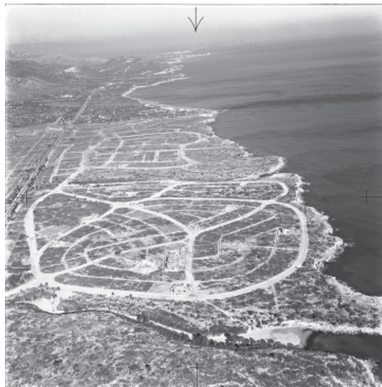
Figura 4.25. Vista aèria de les obres d'urbanització de Calafat (municipi de l'Ametlla de Mar), procés característic del sector nord del litoral del Baix Ebre iniciat a la dècada de 1960.

Posteriorment, a les dècades de 1980 i 1990, es va iniciar l'ocupació del front litoral de l'Ampolla i va continuar en els altres municipis esmentats anteriorment, amb una tipologia constructiva predominant en forma d'habitatges adossats i apartaments turístics. Tot i això, aquests creixements urbanístics no van arribar als nivells d'ocupació de sòl i densitat que van experimentar en altres sectors del litoral català.