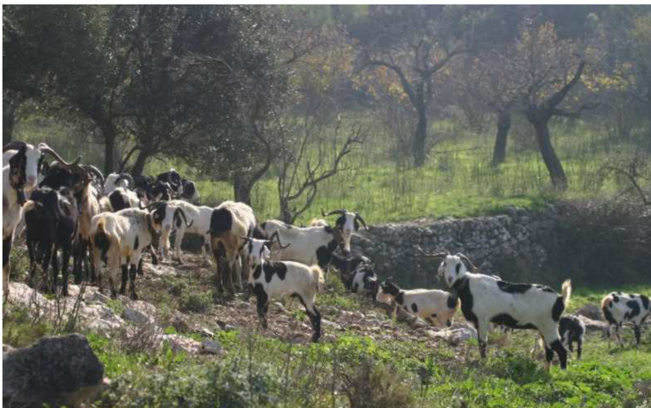
Figura 4.9. Ramat de cabra blanca a Rasquera (Serres de Cardó-Boix).

explotades, amb pobles petits i escasses superfícies agrícoles als sectors de muntanya, que vivien majoritàriament de les activitats silvícoles i ramaderes. Es pot dir que és un període on el paisatge era més o menys equilibrat, harmònic i molt divers. Per tant, és fàcilment imaginable un paisatge amb una notable diversitat de conreus, amb clapes forestals i amb un entorn fluvial més o menys ben conservat.