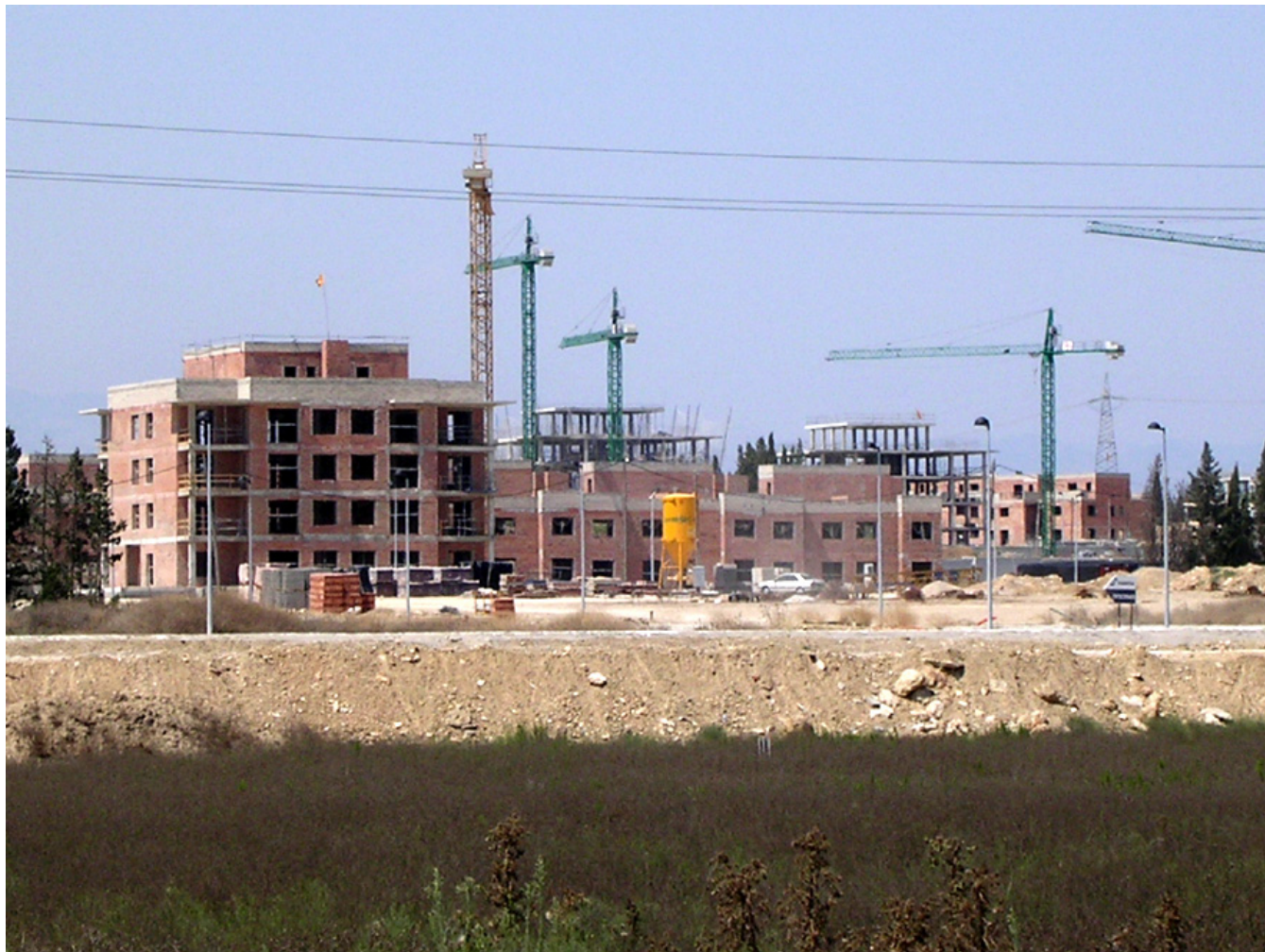
Figura 4.30. Paisatge que ha caracteritzat part del Litoral del Baix Ebre els darrers deu anys. A la imatge, construcció d'una urbanització a la finca de la Palma (municipi de l'Aldea).

En definitiva, el sector litoral i el de les terrasses fluvials són els espais que van experimentar durant els últims anys d'aquest període uns creixements residencials i infraestructurals més importants, que van anar ocupant antics conreus a partir d'un creixement en forma de taca, sovint a primera línia de mar.