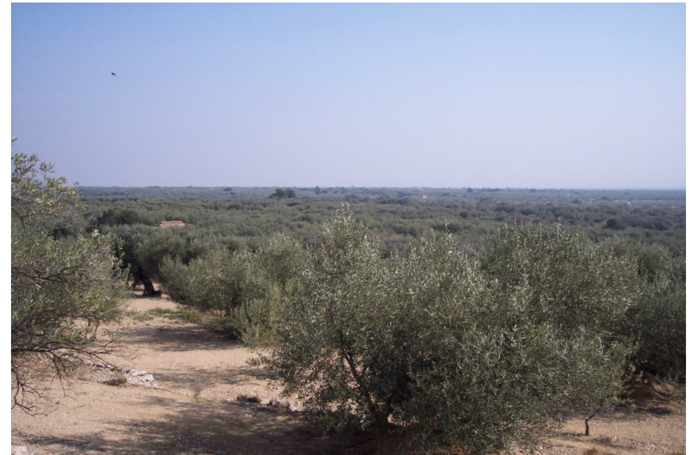
Figura 4.11. Cultiu d'olivares a les planes del Baix Ebre-Montsià.

un cop passada l'aigua es tornava a reconstruir i conrear.