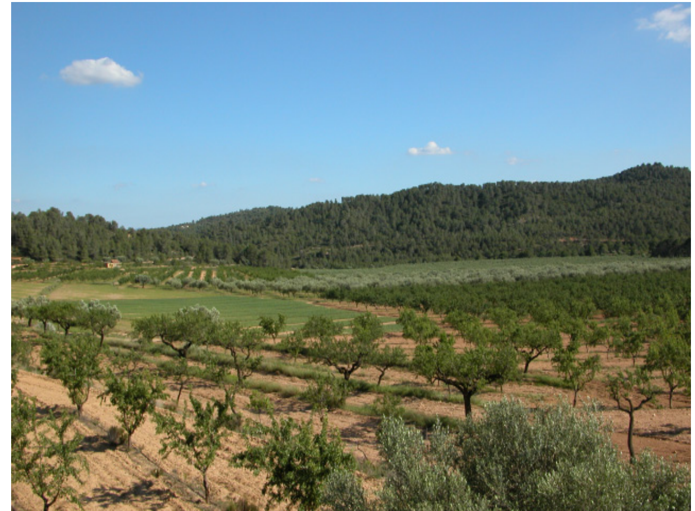
Figura 4.14. Mosaic de conreus d'ametller i olivera amb fragments de sembrats, a la cubeta de Móra.

per petits pobles envoltats de mosaics agroforestals, on, per una banda, s'iniciava la recuperació de les masses forestals i, per l'altra, s'introduïen nous conreus que generaren una diversificació paisatgística.