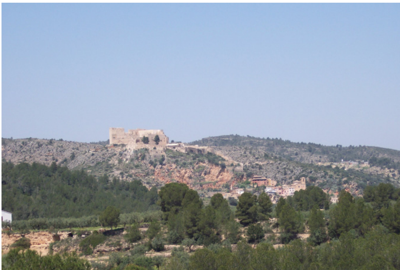
Figura 4.6. El castell de Miravet és l'exponent més destacat de la cultura templera a les Terres de l'Ebre.

car el territori fins als temps moderns. És en aquesta època que es crearen la majoria de pobles actuals, a través de les respectives cartes de població. A meitat del segle XIV, segons el fogatge de Pere III, en aquests territoris hi vivien uns 12.000 habitants, 5.000 dels quals a Tortosa, i al voltant d'un miler als municipis d'Ulldecona, Alcanar, el Perelló, Xerta, Amposta i la Sénia. En aquesta