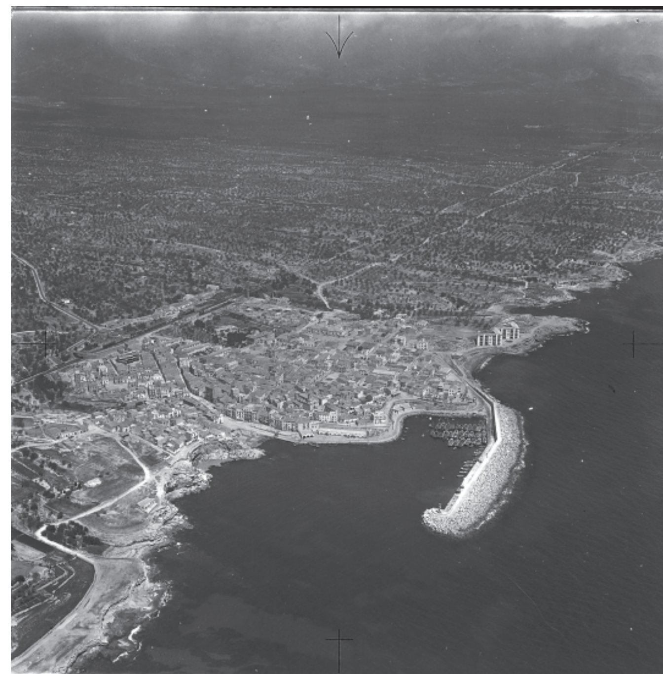
Figura 4.19. Vista aèria del nucli urbà de l'Ametlla de Mar l'any 1965.

Els pobles litorals, com Sant Carles de la Ràpita, les Cases d'Alcanar, l'Ampolla i l'Ametlla de Mar, aquests tres darrers nuclis de pescadors creats entre els s. XVIII-XIX, van experimentar un creixement moderat en aquest període, degut a la seva relativa especialització en l'activitat pesquera, que restava relativament al marge de la crisi agrícola predominant.