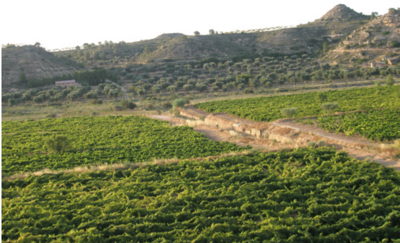
Figura 4.12. L'expansió del conreu de la vinya als altiplans interiors es va donar durant la segona meitat del segle XIX. A la imatge, detall de conreus de vinya a les Riberes de l'Algars, prop del nucli abandonat de Pinyeres (municipi de Batea).

estratègiques a nivell d'Estat, es va decidir no desamortitzar-les i impulsar, durant el segle XIX, diversos plans de gestió controlats del Distrito y Patrimonio Forestal del Estado . Qualsevol aprofitament passava per l'aprovació de l'enginyer d'aquest òrgan, qui autoritzava la tala per a subhastes de pins, de pins caiguts, cremats o malferits. Les zones on van ser més freqüents les tals de pins a finals del segle XIX són la mola de Catí, el barranc Fondo, la cova Cambra, la cova del Rastre i Bunyols, en les quals es van marcar aprofitaments en més d'un pla anual.