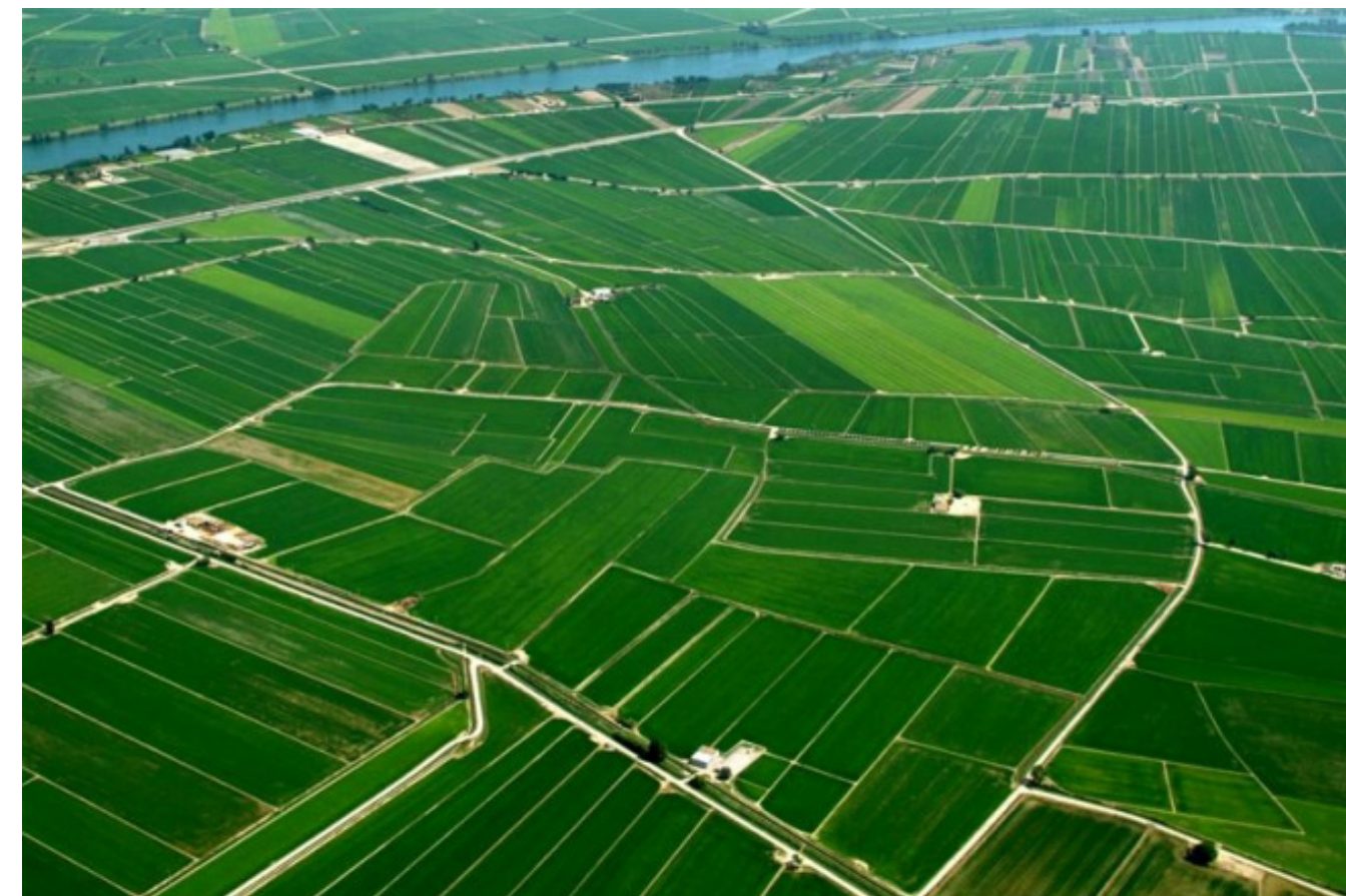
Figura 4.16. El monocultiu d'arròs al delta de l'Ebre comença a desenvolupar-se al ritme de la construcció dels canals de la dreta i de l'esquerra.

intensificar l'ocupació del sòl, sobretot a partir de la introducció de més plantacions d'olivera. Per tant, al sector litoral de les Terres de l'Ebre, el conjunt de les terres dedicades al conreu de secà va