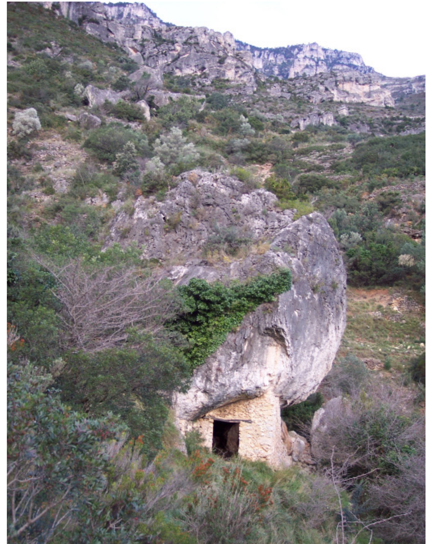
Figura 4.8. Panoràmica de part del barranc de la Caramella (municipi de Roquetes), als Ports.