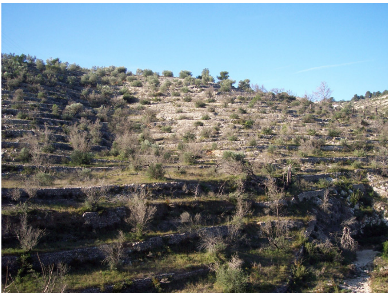
Figura 4.18. Conreus d'olivera abandonats als vessants de les Serres de Cardó-Boix.

En aquesta època, els municipis dels Ports van anar perdent població, com a conseqüència de la crisi del món rural que començava per afectar els sectors més abruptes i de pitjor accessibilitat. Mentrestant, els pobles situats a les planes litorals, van mantenir estabilitzada la població, degut a la seva situació en terrenys més planers que permetien un millor aprofitament agrícola. En el sector de les planes del Baix Ebre i del Montsià, a la dècada de 1950, com a complement de l'activitat agrícola, es va iniciar la construcció de granges d'aviram que poc a poc i puntualment van anar configurant nous elements en el paisatge tradicionalment agrícola.