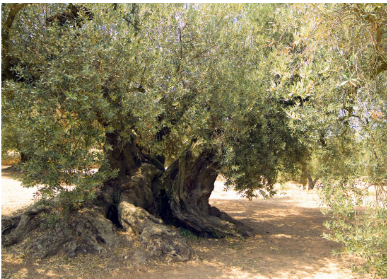
Figura 4.1. Olivera monumental al municipi d'Ulldecona, a la Plana del Baix Ebre-Montsià.

Les pàgines següents ofereixen una breu perspectiva històrica de l'ocupació de les Terres de l'Ebre i les transformacions paisatgístiques d'aquest territori al llarg dels segles. L'apartat ha de contribuir a interpretar el paisatge actual, com a base per elaborar els objectius de qualitat paisatgística i els criteris i accions contingudes als apartats 14 i 15 d'aquesta memòria.