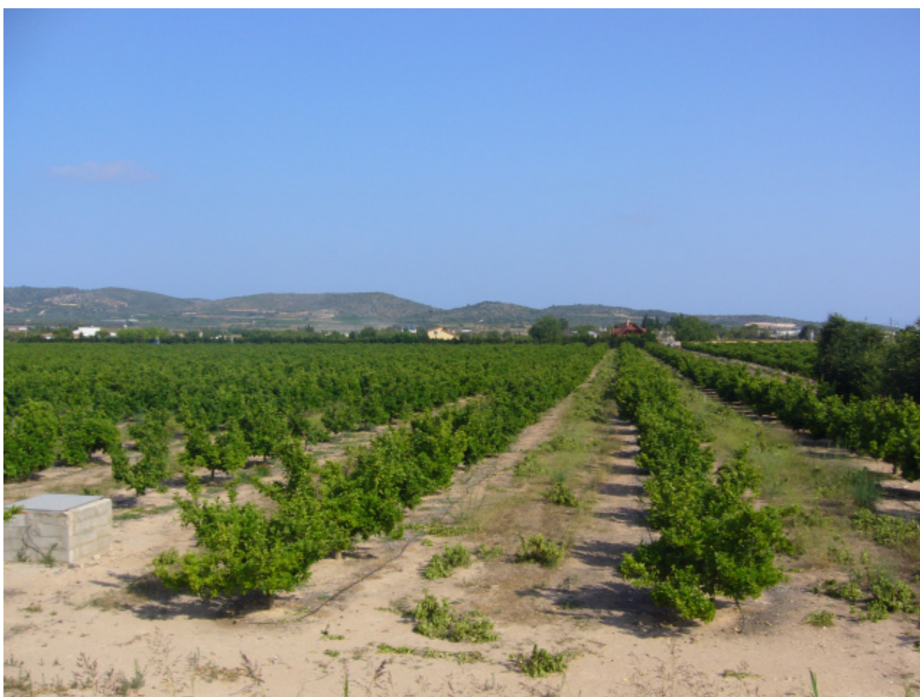
Figura 4.22. Camp de tarongers prop del riu Sénia, al sud de les Serres de Montsià-Godall.

A partir de la dècada de 1960 es van iniciar una sèrie de canvis en els paisatges de les Terres de l'Ebre. Fins aleshores, aquells paisatges havien estat eminentment rurals i agrícoles. Tot i que encara avui dia un dels trets distintius més característics del paisatge ebrenc és el seu caràcter agroforestal, durant aquest període parts del territori cada cop més importants en superfície, sobretot al sector litoral, es van transformar a través d'actuacions amb una incidència paisatgística important i amb vocació de permanència.