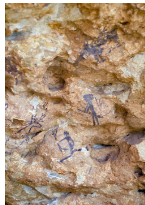
Figura 4.2. Fragment de pintures del conjunt d'art rupestre d'Ulldecona, a les Serres de Montsià-Godall.

Diversos vestigis arqueològics demostren la presència humana en el territori ja en època paleolítica . D'aquestes primeres comunitats nòmades de caçadors i recol·lectors destaca un excepcional conjunt d'abrics, balms i coves amb restes de pintura rupestre; entre els quals sobresurten els jaciments de l'Ermita a la serra de la Pietat (Ulldecona), els de les Esquarterades (Ulldecona) o els de les Calobres (El Perelló), del Ramat (Tivissa) o Pintada (Alfara de Carles). Tots aquests i d'altres, l'any 1988 es van inscriure a la Llista del Patrimoni Mundial de la UNESCO dins el bé cultural Art rupestre de l'arc mediterrani de la Península Ibèrica (Adserias, Ramón i Teixell, 2002: p.30). Dels