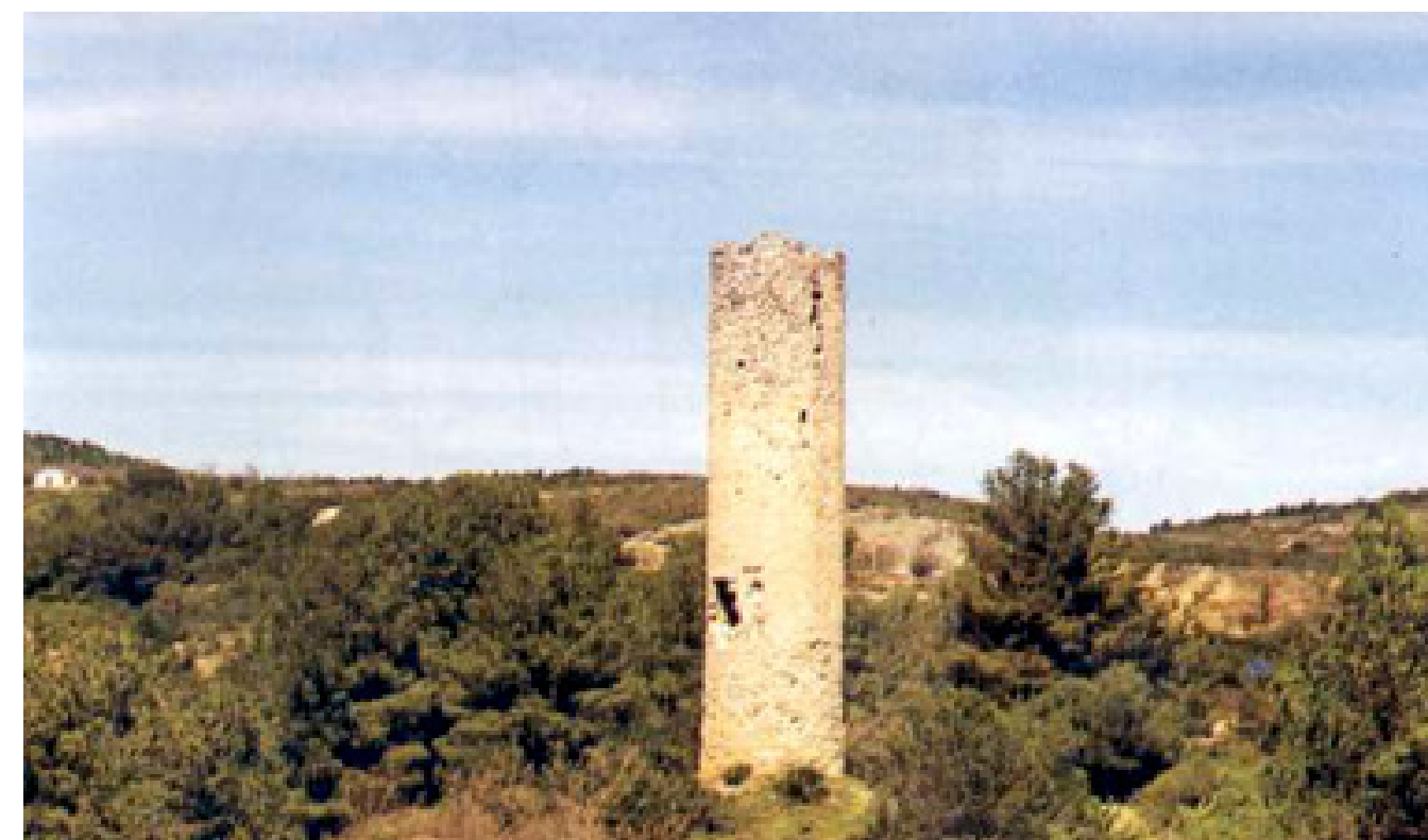
Figura 4.7. Torre de la Fullola al litoral del Baix Ebre (municipi del Perelló).

Fins a l'expulsió dels moriscos, la població es distribuïa uniformement pel nucli habitat. Quan aquesta es va produir hi va haver un despoblament, abandonó i empobriment sobretot de les terres de secà.