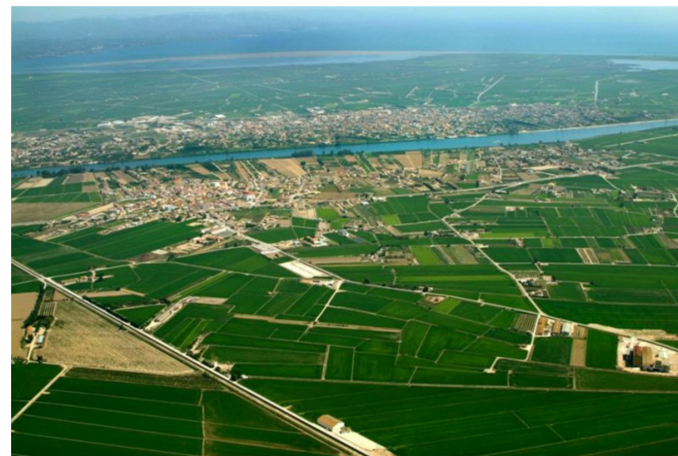
Figura 4.29. Vista aèria dels nuclis urbans de Deltebre i Sant Jaume d'Enveja, al Delta de l'Ebre.

És en aquesta època que hi ha un intent de colonització urbanístico-turística del front litoral, amb la construcció de les urbanitzacions de Riumar (municipi de Deltebre) i l'Eucaliptus (municipi d'Amposta), que s'ubiquen a primera línia de costa, seguint la tendència que s'estava produint en altres indrets del litoral català. Una accessibilitat deficient, així com les pròpies condicions naturals del delta, que el fan un sistema molt dinàmic, va comportar el fracàs d'aquest model urbanístic i les urbanitzacions ni van créixer massa més ni van aparèixer nous projectes en aquest front litoral.