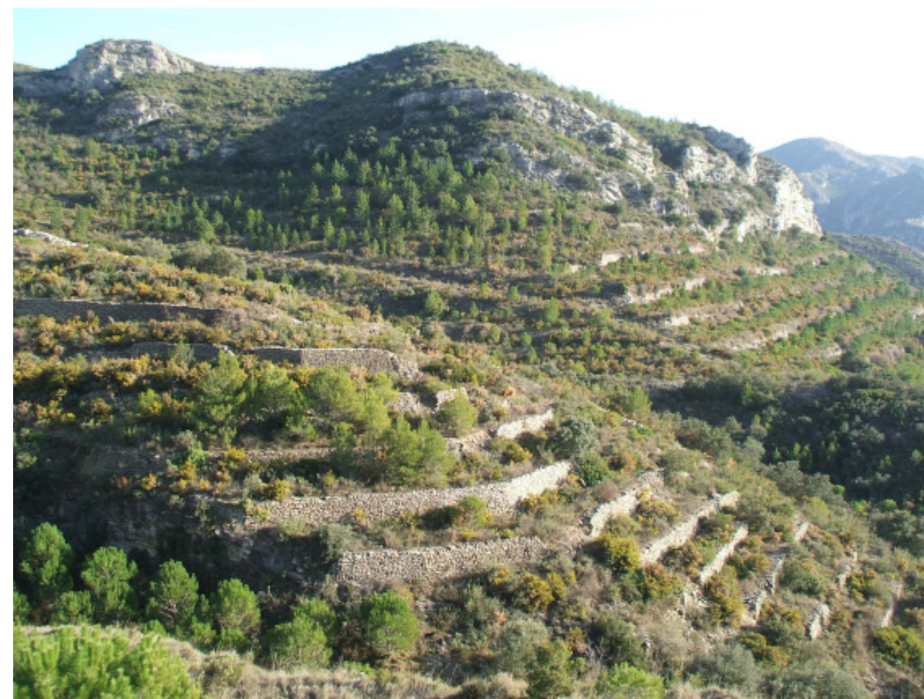
Figura 4.10. Conreus abandonats als vessants de les Muntanyes de Tivissa-Vandellòs.

Les característiques més rellevants del paisatge de les Terres de l'Ebre de principis de s. XVIII estan relacionades amb una feble comercialització dels productes del camp, un elevat autoconsum i uns rendiments escassos. Però aquesta situació es va anar modificant al llarg d'aquest segle, a causa de l'increment de la demanda com a conseqüència de l'augment de la població, amb l'extensió dels conreus a indrets fins llavors no conreats.