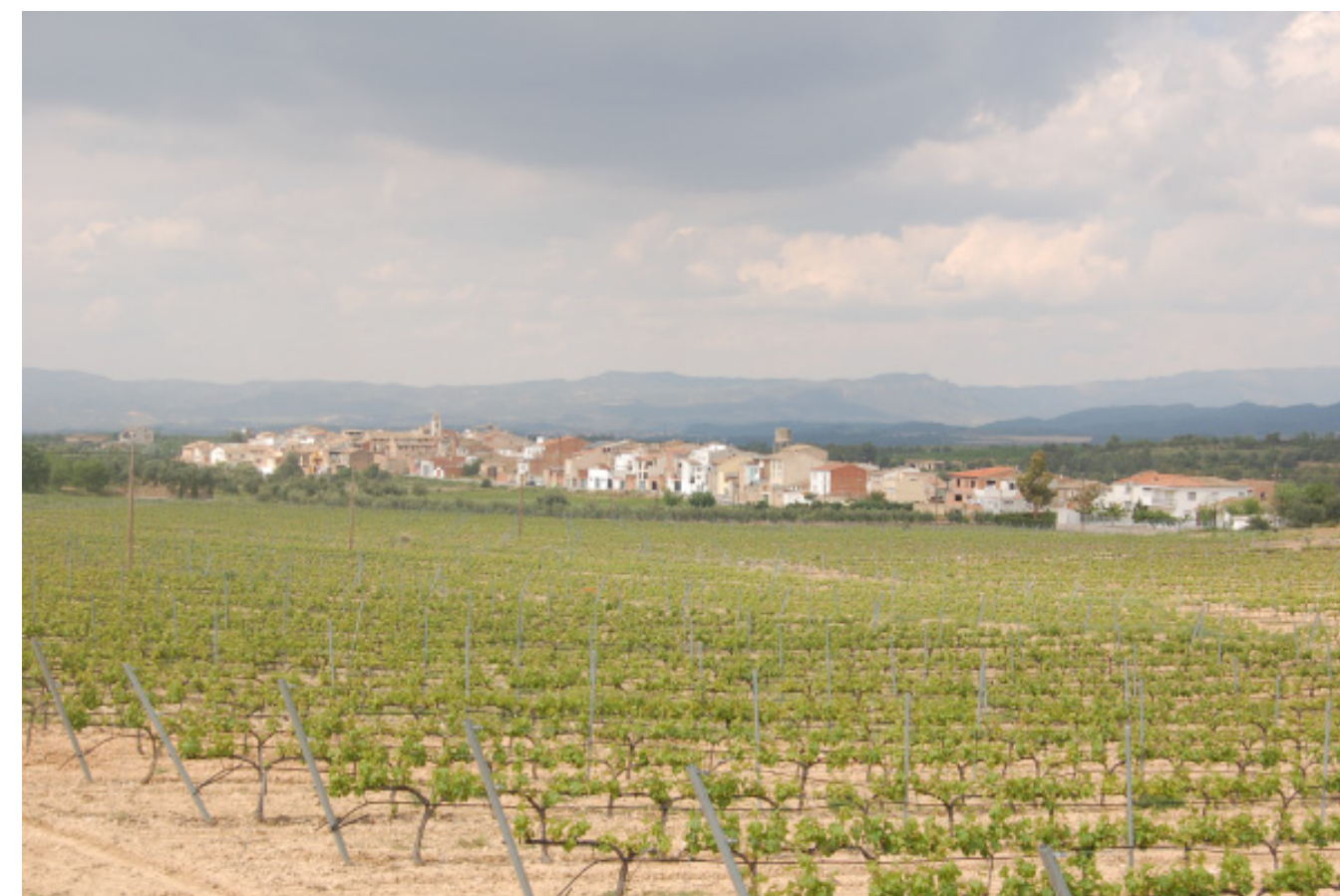
Figura 4.32. Replantació de vinya als afores de la serra d'Almos, al Baix Priorat.

El sector del Baix Priorat, ha mantingut fins avui uns paisatges agroforestals caracteritzats pel predomini de la vinya, però també amb presència d'olivera i altres conreus de secà (ametller i avellaner). Això va ser possible per la realització de tot un seguit de millores en les explotacions que en termes generals no han tingut una incidència notòria en el paisatge preexistent.