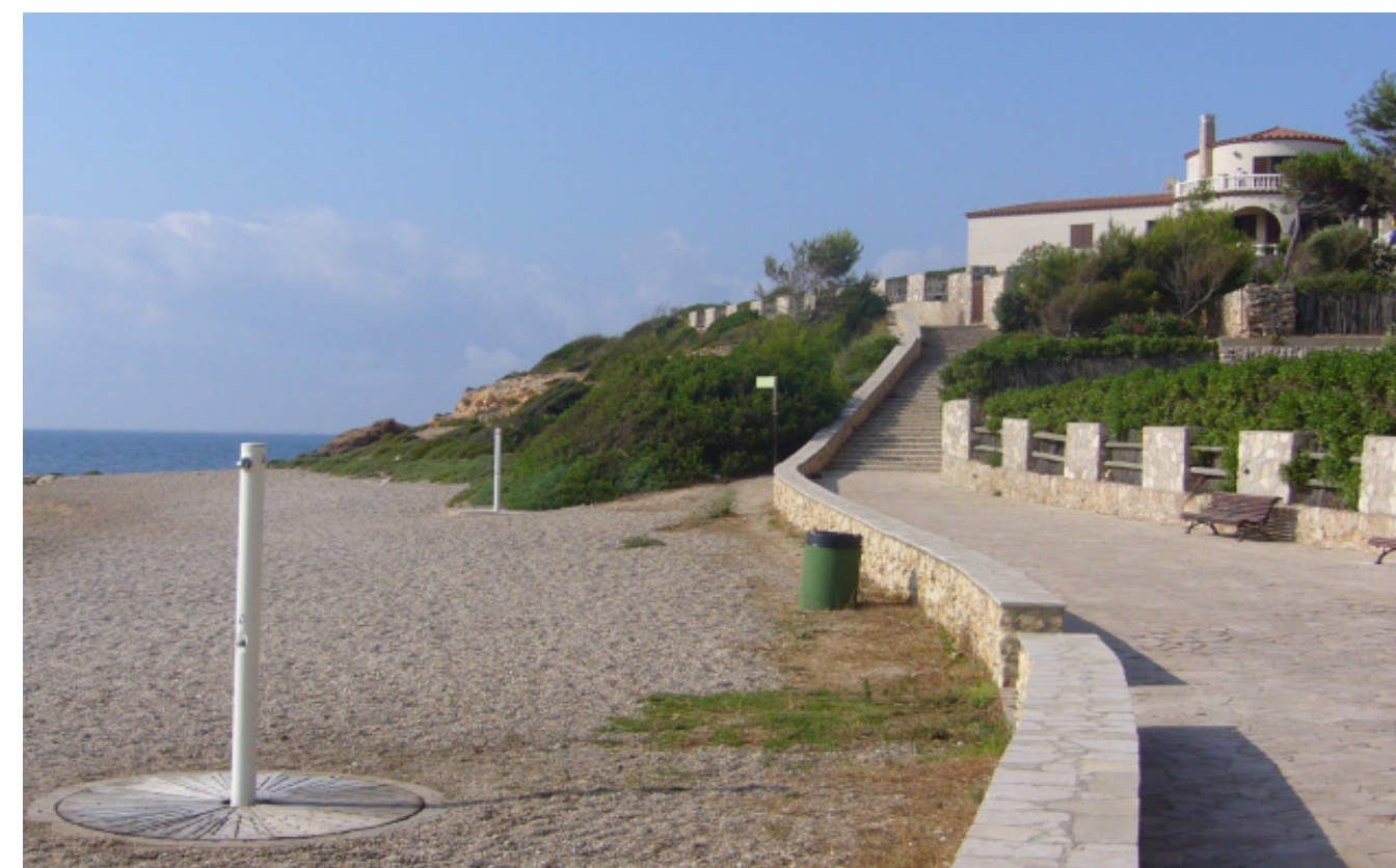
Figura 4.4. Part de la Via Augusta al seu pas pel Litoral del Baix Ebre.

De fet, en aquesta època es va repoblar el camp i es van fer noves rompudes de terres, que es treballaven en règim de propietat, censari o parcer. L'increment de la població, que permeté recupear les pèrdues de població que s'havien produït al Baix Imperi, en part, per la crisi del camp a causa dels elevats impostos romans (Grau i Sorribes, 1985), va anar acompanyat de la construcció