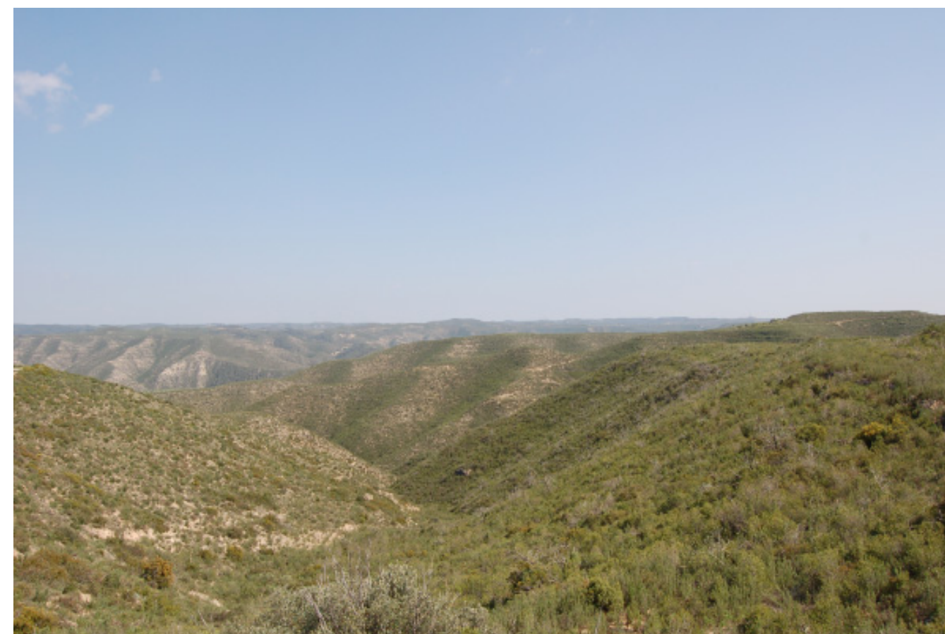
Figura 4.24. Paisatge resultant del gran incendi forestal de l'any 1994 als municipis de la Pobla de Massaluca, Vilalba dels Arcs, la Fatarella i Riba-roja d'Ebre, als Costers de l'Ebre.

Als sectors rurals més aviat planers de l'interior de les Terres de l'Ebre, es donaren diverses dinàmiques agrícoles vinculades a les dinàmiques del mercat. Per una banda, a l'altiplà de la Terra Alta i al Baix Priorat, va proliferar el conreu de la vinya mentre que l'ametller i els sembrats van entrar en plena recessió. En alguns casos es van roturar terres que anteriorment ja havien estat conreades en vinya, tot i que amb la mecanització moltes de les feixes es feien amb marges de terra i, per tant, en variava l'estructura característica de la pedra seca. Per l'altra, a la Cubeta de Móra el conreu de la fruita dolça es va estendre per terres cada cop més allunyades del riu, al mateix temps que es va anar millorant la tecnologia per a l'extracció d'aigua del subsòl. Aquestes dinàmiques van provocar una certa homogeneïtzació del paisatge en aquest sector central de la cubeta, en ser eliminats gairebé tots els rastres d'antics conreus de secà així com de bona part de l'explotació agrària que representaven les sènies, que només es mantenien en indrets marginals. Finalment, destaca tot el procés d'abandonament dels conreus d'olivera situats als Costers de l'Ebre, degut a diversos factors com l'envelliment de la població, la derivació de mà d'obra cap a la construcció de les centrals nuclears d'Ascó (iniciada a finals de la dècada de 1970 i acabada el 1984) i la implantació de nous conreus de regadiu, sobretot fruita dolça i cirerer a l'eix Vinebre-La Torre de l'Espanyol.