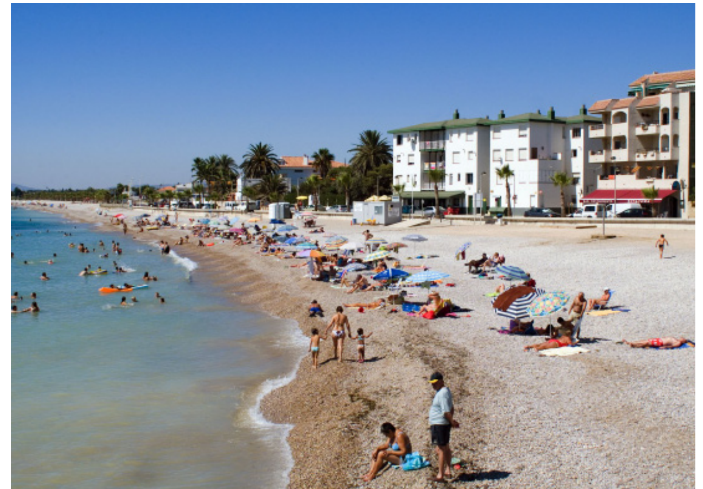
Figura 4.26. Edificacions a primera línia de mar, fruit dels processos constructius que van desenvolupar-se al litoral de les Terres de l'Ebre, especialment durant la dècada de 1970. A la imatge, part de les Cases d'Alcanar, a la part litoral de les Serres de Montsià-Godall.

El creixement urbanístic es va fer sobretot resseguint l'eix de les vies de comunicació (carretera N-340), creant un cert continu urbà en gairebé tot el front litoral dels municipis esmentats, només en restaven al marge aquells indrets amb una menor accessibilitat o major pendent del terreny. La no urbanització d'aquests espais litorals ha esdevingut un element molt característic i singular del paisatge litoral ebrenc. Cal tenir en compte que el patró d'urbanització que es va desenvolupar en aquelles dècades impedeix la visió del mar des d'alguns punts, trenca patrons arquitectònics de les poblacions litorals i provoca una homogeneïtzació dels paisatges urbans.