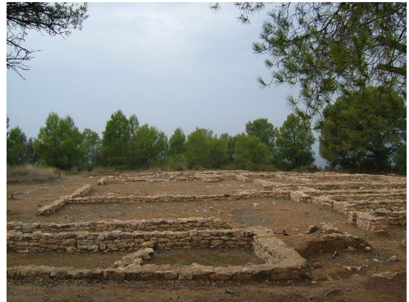
Figura 4.3. Detall de l'assentament iber del Castellet de Banyoles (municipi de Tivissa), al Baix Priorat.

ho demostren diverses restes de poblats localitzats al llarg del riu Matarranya i el riu Algars, així com en altres indrets com la Gessera (Caseres), Castellans (Cretes), Escodines Altes i Escodines Baixes (Massalió), St. Cristòfol (Massalió), St. Antoni (Calaceit), tossal del Moro-Pinyeres (Batea), coll del Moro (Gandesa), turó del Calvari (Vilalba dels Arcs), etc. Al Baix Priorat i a la serra del Tormo destaquen les restes del poblament del Castellet de Banyoles, al terme de Tivissa, on es va fer una important troballa de diversos utensilis i joies de plata que s'ha anomenat el Tresor de Tivissa, i a Vinebre es van trobar les restes del poblament de Sant Miquel. També s'han descobert restes d'antics assentaments ibers a Barrufemes i a les terrasses fluvials del tram final de l'Ebre a Benifallet (Castellots i coll de Som), a Vinallop-Tortosa (pla de les Sitges) i a Amposta (Carrova) i també sembla que, on actualment