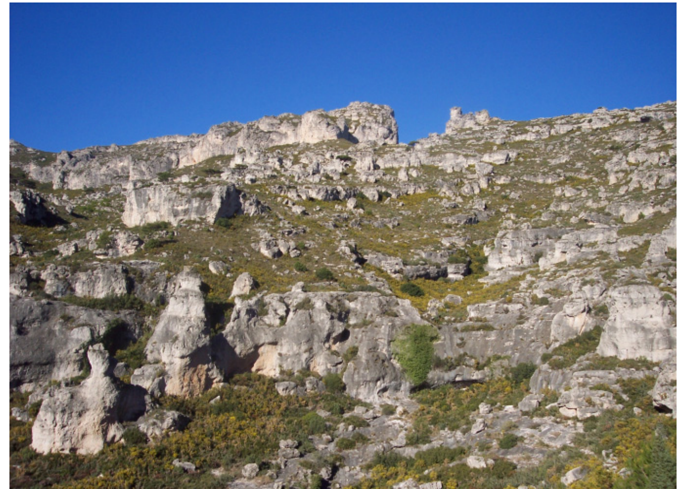
Figura 4.31. Els incendis forestals són un factor paisatgístic de primer ordre en el conjunt de les serres de les Terres de l'Ebre. A la imatge, capçalera del barranc de les Nines, al municipi del Perelló, a les Serres de Cardó-Boix.

En les àrees de muntanya, el fort procés de despoblament que va experimentar el territori va comportar l'abandonament de les terres de conreu i l'embosquament progressiu de les mateixes, contribuint a l'extinció de les masses forestals de les darreres dècades. En relació amb aquest darrer aspecte, és important destacar que els incendis forestals han estat els veritables protagonistes en la configuració del paisatge actual de bona part d'aquestes àrees. En aquests indrets de muntanya,