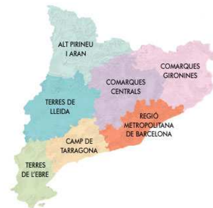
Figura 1.2. Àmbits territorials d'aplicació dels catàlegs de paisatge

Alt Pirineu i Aran Comarques Centrals Camp de Tarragona Terres de Lleida Regió Metropolitana de Barcelona Comarques Gironines Terres de l'Ebre