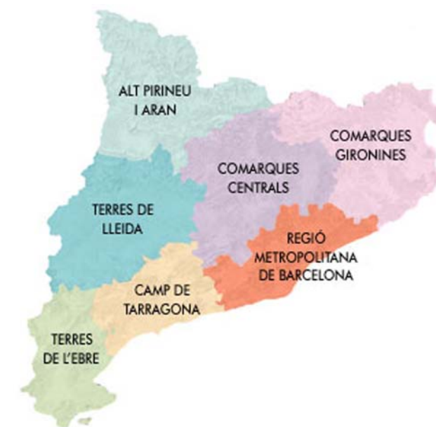
Figura 1.2: Àmbits territorials d'aplicació dels catàlegs de paisatge.