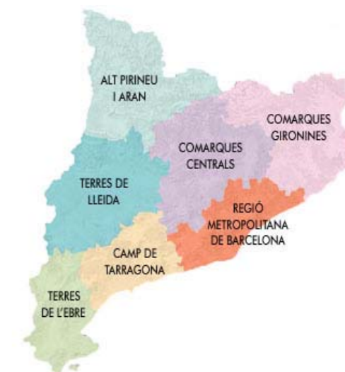
Figura 1.2: Àmbits territorials d'aplicació dels catàlegs de paisatge