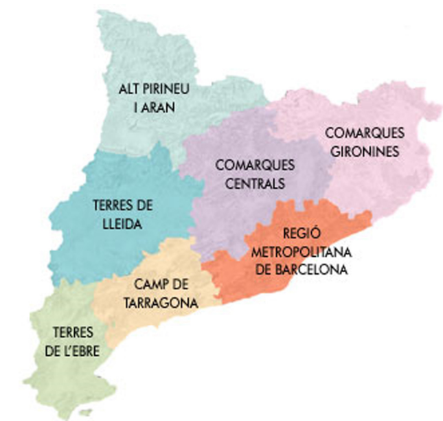
Fig. 1.2: Àmbits territorials d'aplicació dels catàlegs de paisatge.