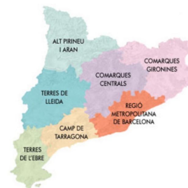
Fig. 1.2: Àmbits territorials d'aplicació dels catàlegs de paisatge.