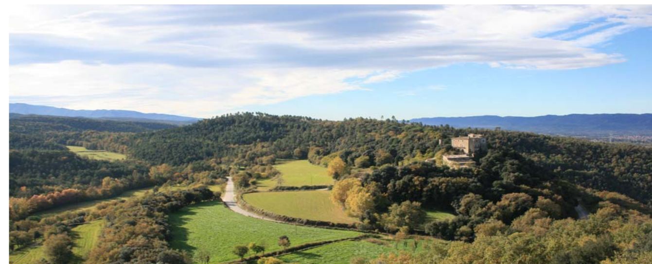
Figura 2. Vista des de Sant Feliuet de Savassona, Tavèrnoles.