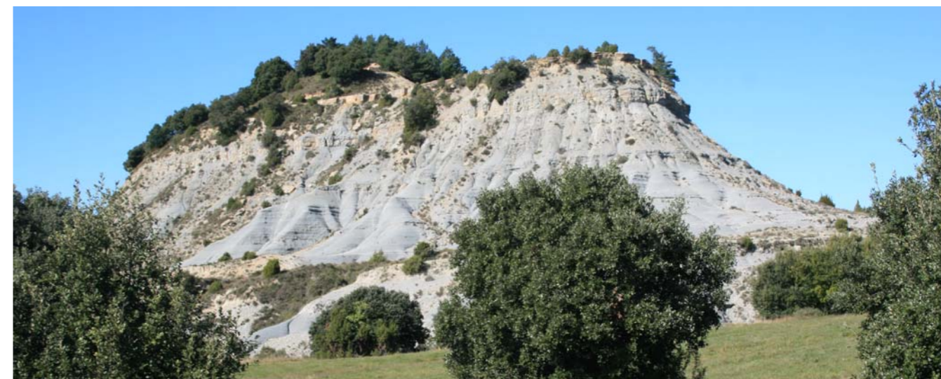
Figura 1. «Badlands» al Pla del Castell. Tavertet. El Cabrerès-Puigsacalm.

L'observació de les dades de la Taula 2 (veure pàgina següent) mostra els usos i cobertes del sòl predominants a cada unitat de paisatge establerta. Es detecta un grup nombrós d'unitats on hi predominen les cobertes forestals, en relació amb l'extensió dels paisatges de terra baixa, amb el domini dels alzinars i les pinedes de pi blanc, els paisatges de muntanya mitjana mediterrània, fins aproximadament els 1600 metres d'altitud, amb domini de l'alzinar muntanyenc, els roures, les pinedes de pi roig i faig als indrets més humits, i els paisatges de l'alta muntanya a partir d'aquesta cota, domini del pi negre. Un altre grup menys nombrós d'unitats es caracteritza per la dominància dels usos agrícoles, especialment a les unitats més planes (Plana de Vic, Costers de la Segarra, Conca d'Òdena, Pla de Bages), majoritàriament ocupades per conreus herbacis de secà. Finalment les unitats en que la transformació humana del paisatge ha estat més intensa, manifestant-se en l'elevat percentatge que ocupa l'espai urbanitzat són la Plana de Vic, la Conca d'Òdena i Pla de Bages, amb centre a les ciutats de Vic, Igualada i Manresa.