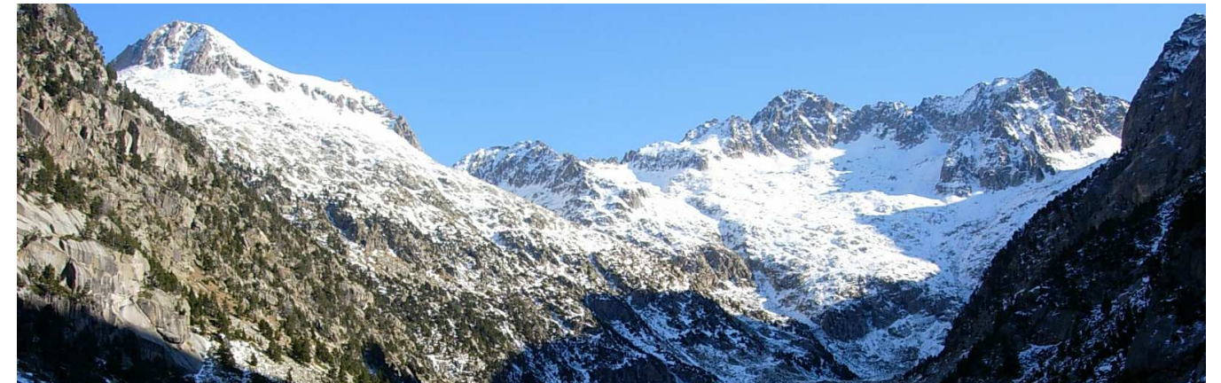
Figura 2: La vall del barranc de Besiberri i la cresta homònima, a l'Alta Ribagorça