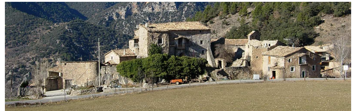
Figura 4: El llogaret de Sisquer, com molts altres de la vall de la Vansa, manté intacta la seva riquesa arquitectònica rural.