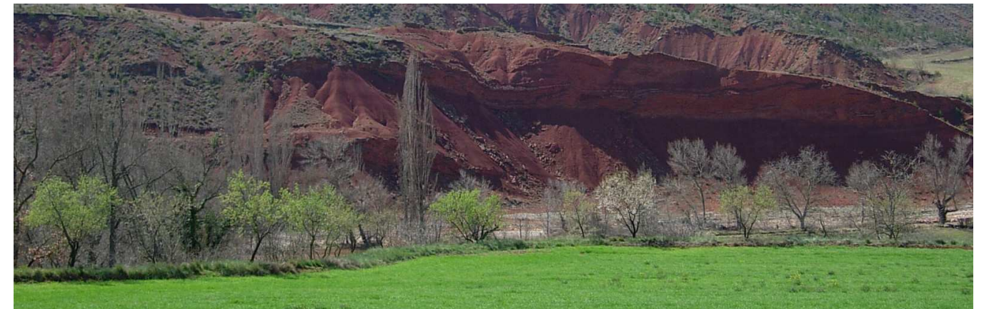
Figura 3: Ribes del barranc d'Esplugafreda, a prop d'Orrit, a la Terreta